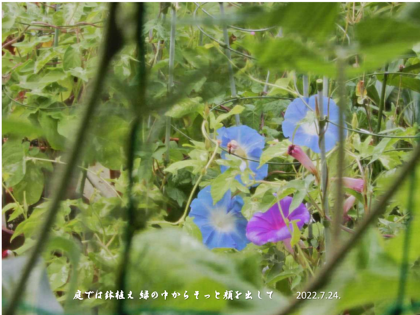
庭では鉢植え 緑の中からそっと顔を出して 2022.7.24.