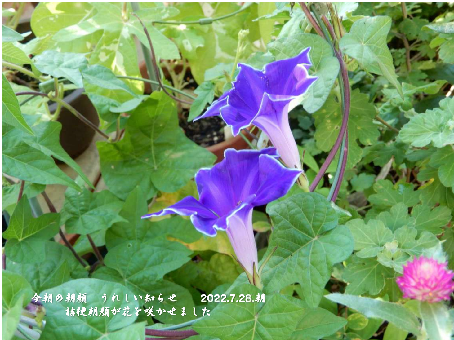
今朝の朝顔 うれしい知らせ 2022.7.28.朝 桔梗朝顔が花を咲かせました