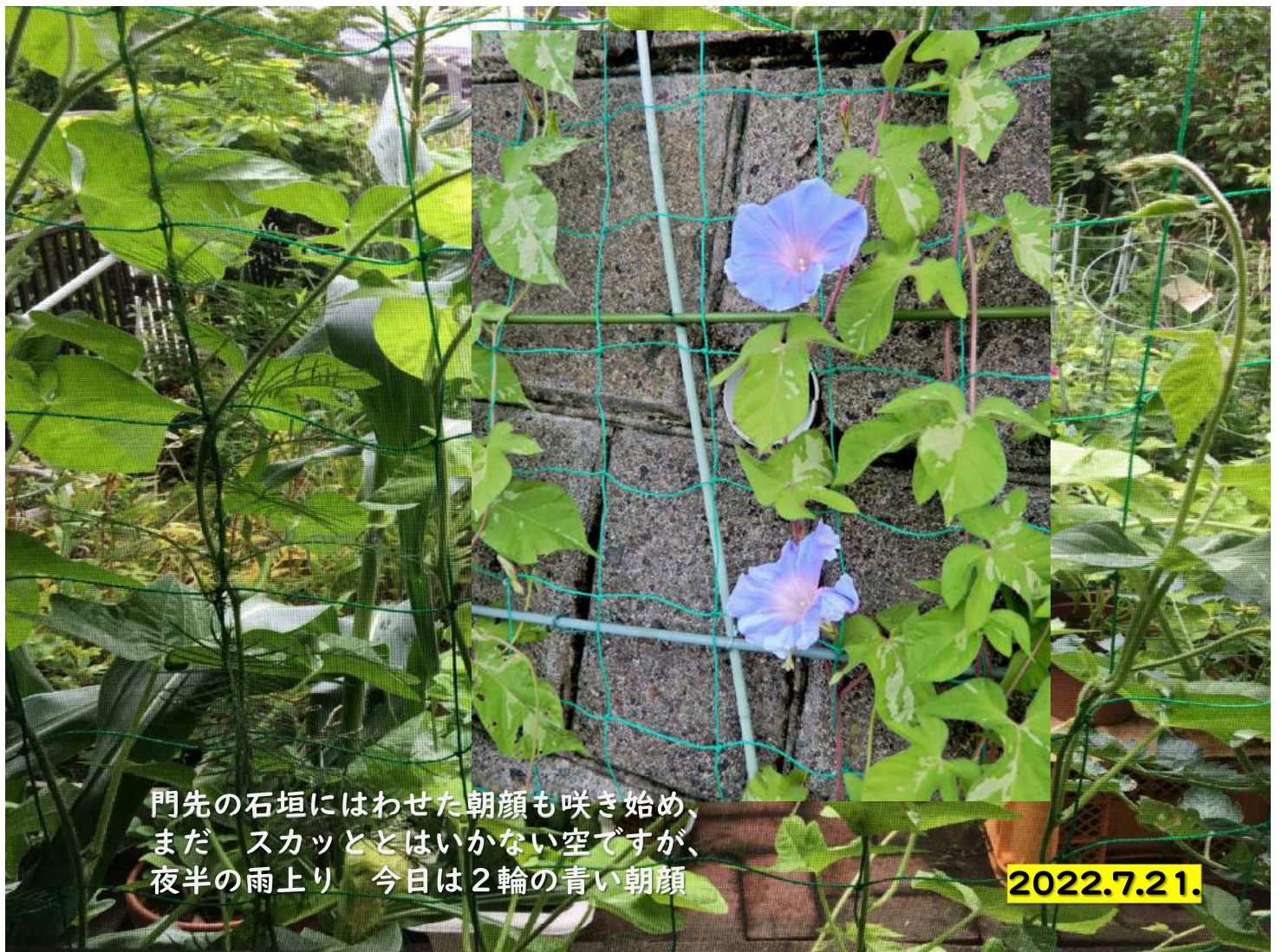
門先の石垣にはわせた朝顔も咲き始め、 まだスカッととはいかない空ですが、 夜半の雨上り 今日2輪の青い朝顔