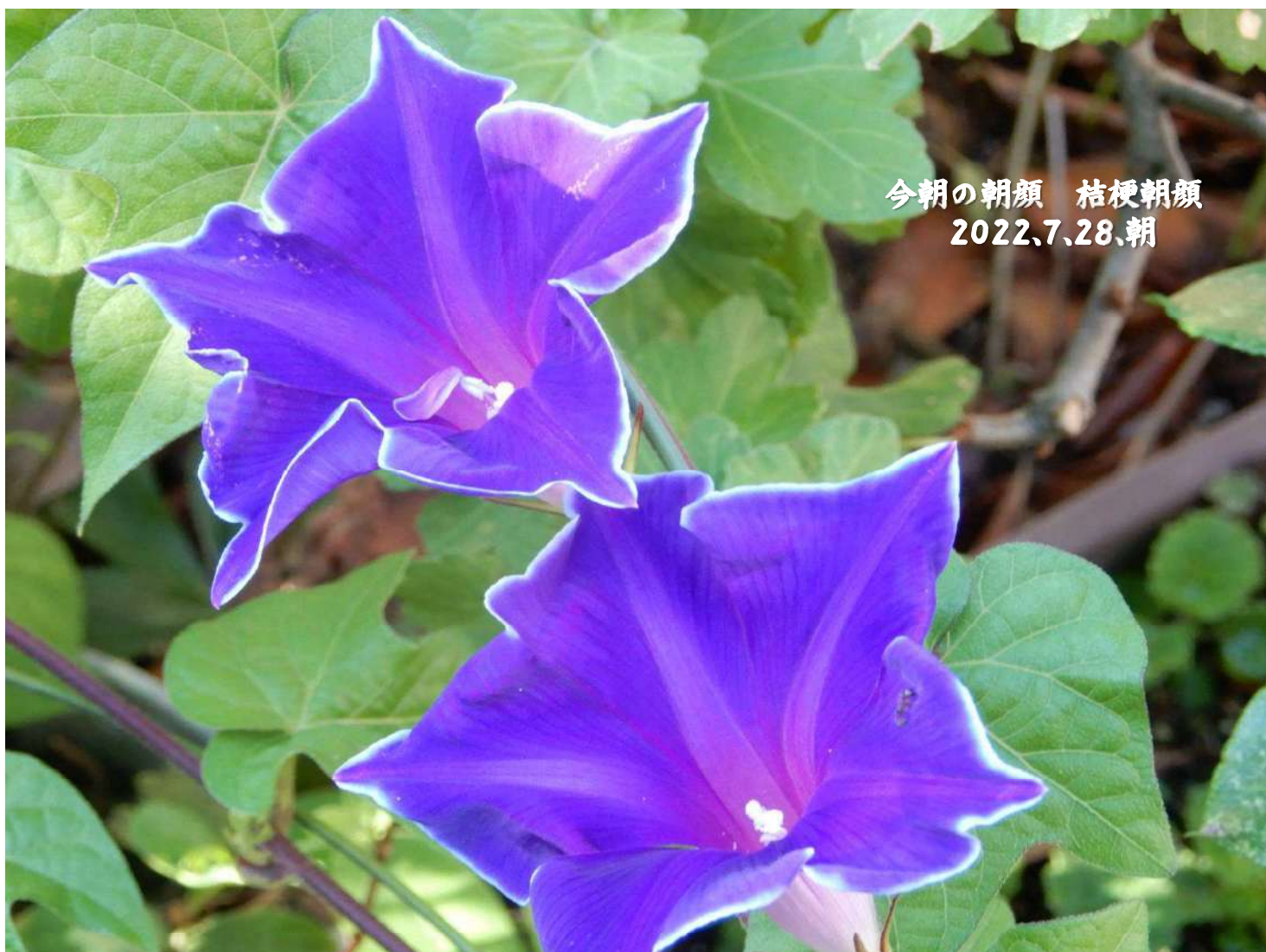
今朝の朝顔 桔梗朝顔 2022.7.28.朝