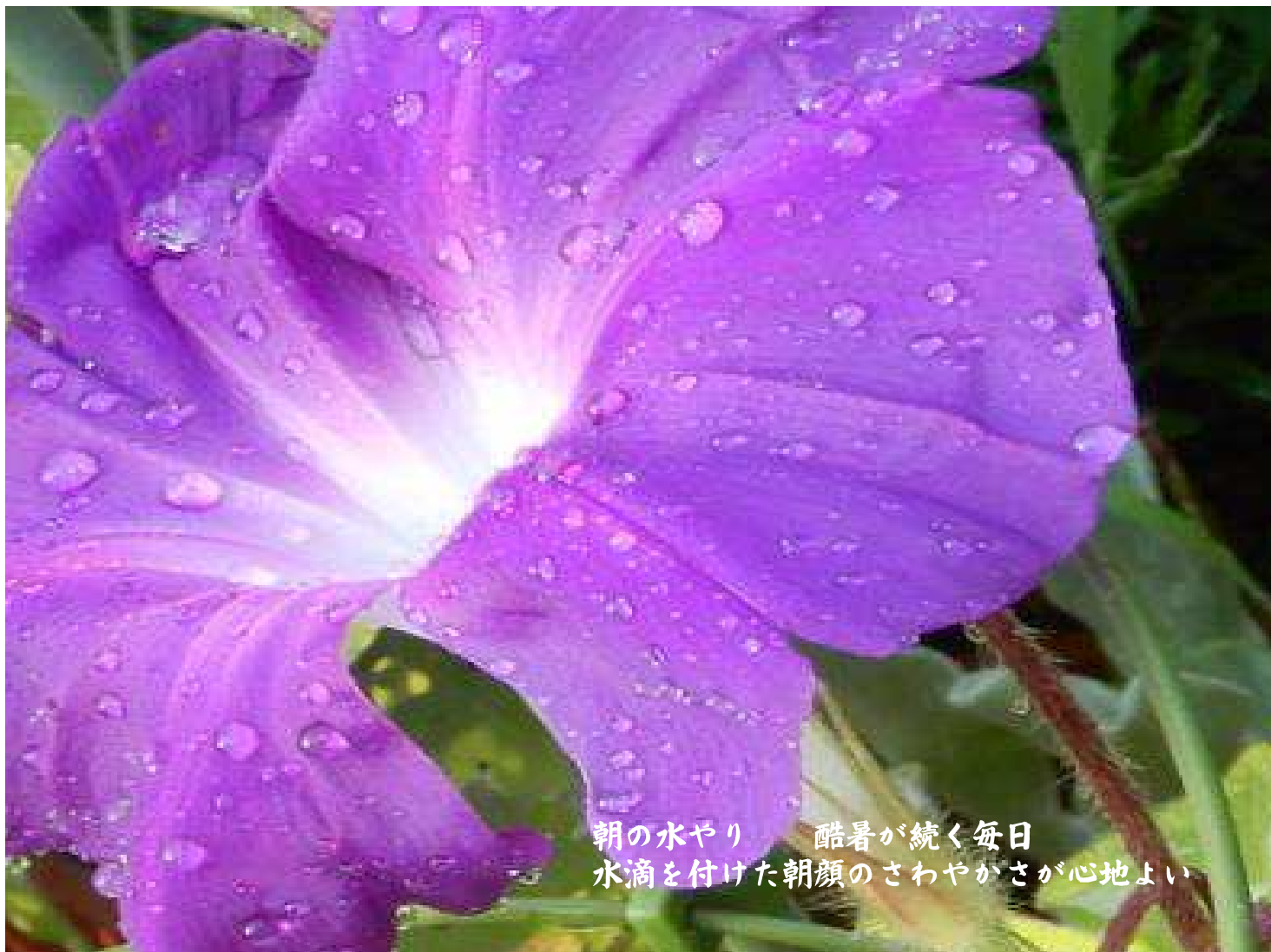
朝の水やり 酷暑が続く毎日 水滴を付けた朝顔のさわやかさが心地よい