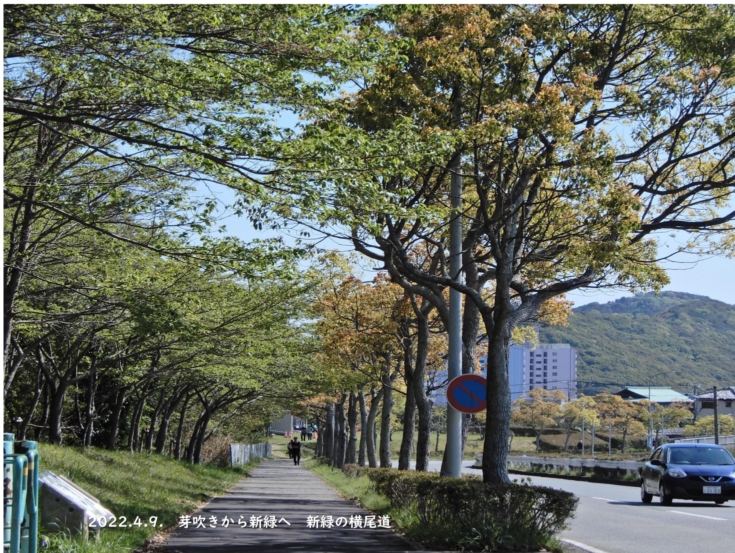
2022.4.9. 芽吹きから新緑へ 新緑の横尾道