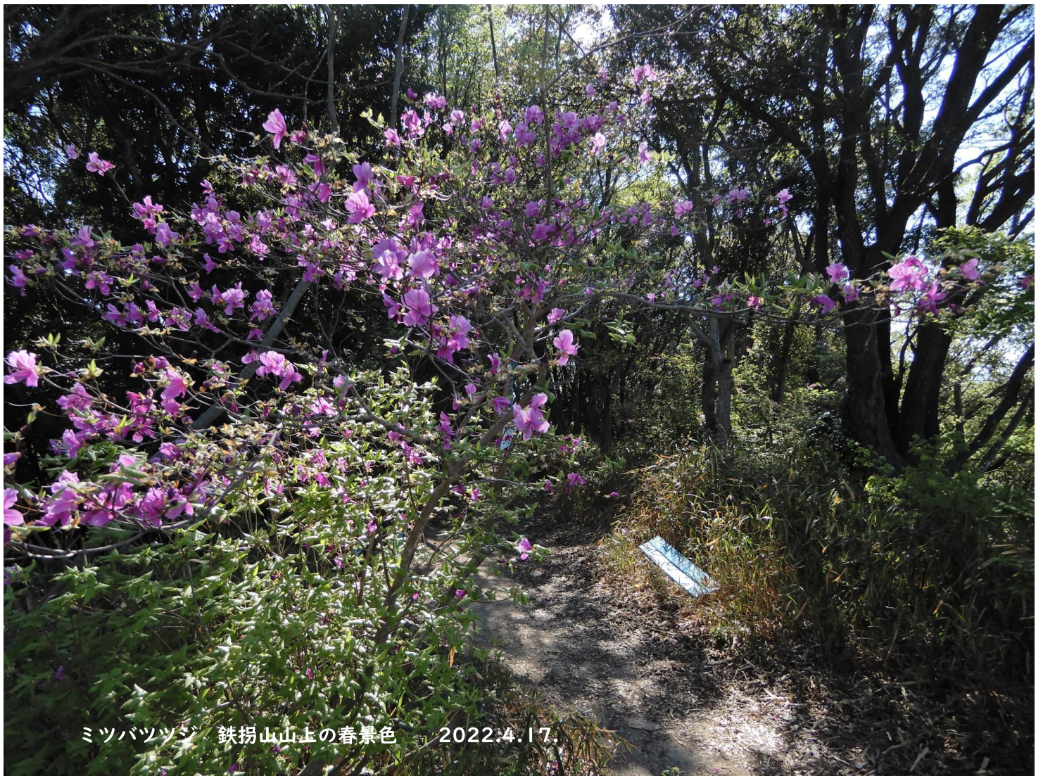
ミツバツツジ 鉄拐山山上の春景色 2022.4.17.