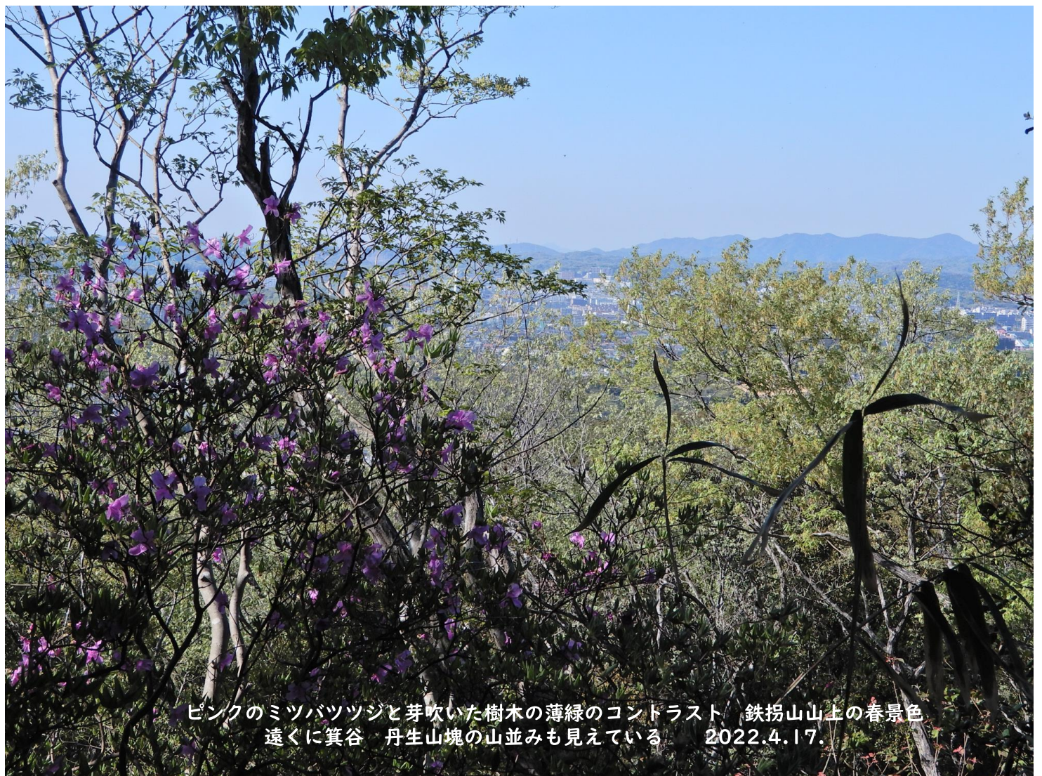
ピンクのミツバツツジと芽吹いた樹木の薄緑のコントラスト 鉄拐山山上の春景色 遠くに箕谷 丹生山塊の山並みも見えている 2022.4.17.