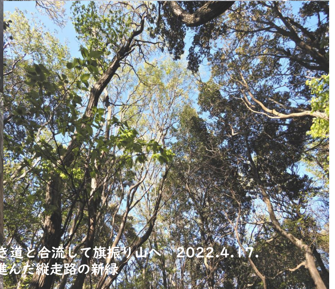
鉄拐山山頂から西へ鉄拐山を下って 巻き道と合流して旗振り山へ 2022.4.17. 何とほなしに また進んだ縦走路の新緑