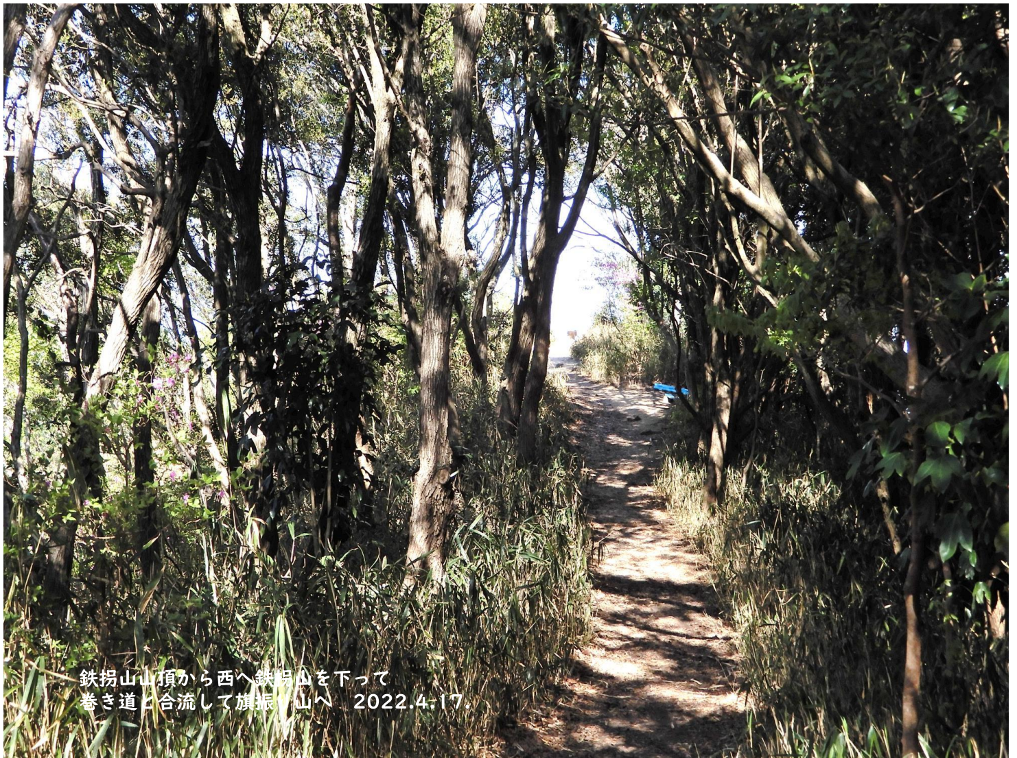
鉄拐山山頂から西へ鉄拐山を下って 巻き道と合流して旗振り山へ 2022.4.17.