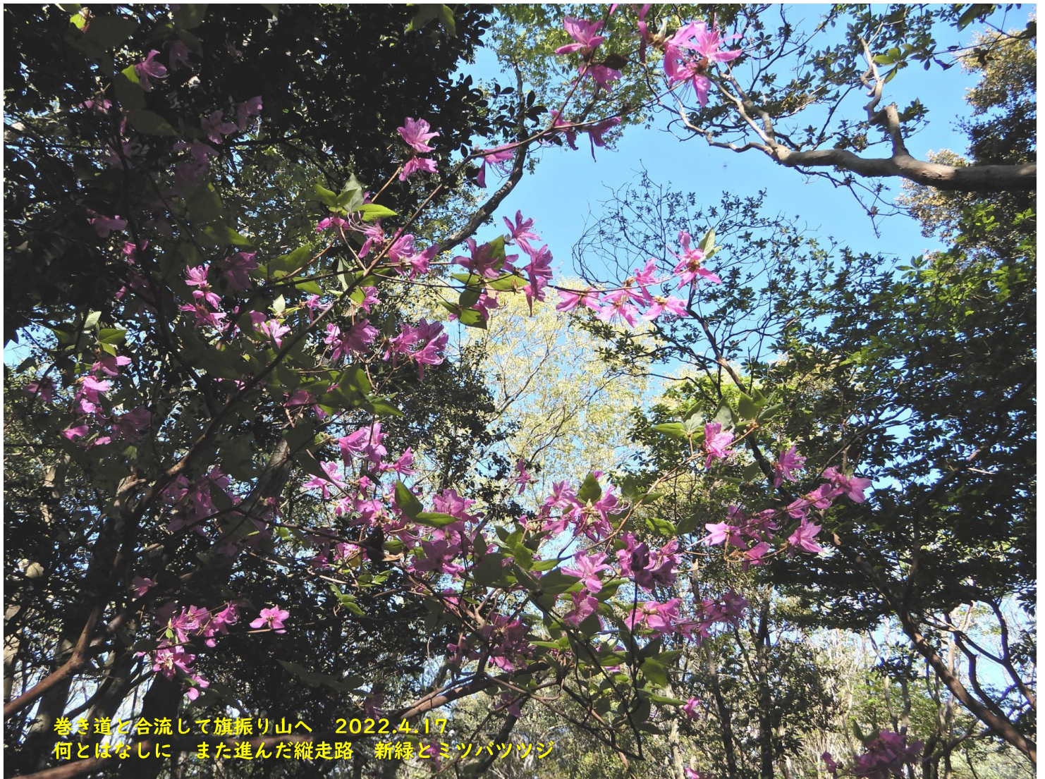
巻き道と合流して旗振り山へ 2022.4.17 何とはなしに また進んだ縦走路 新緑とミツバツツシ