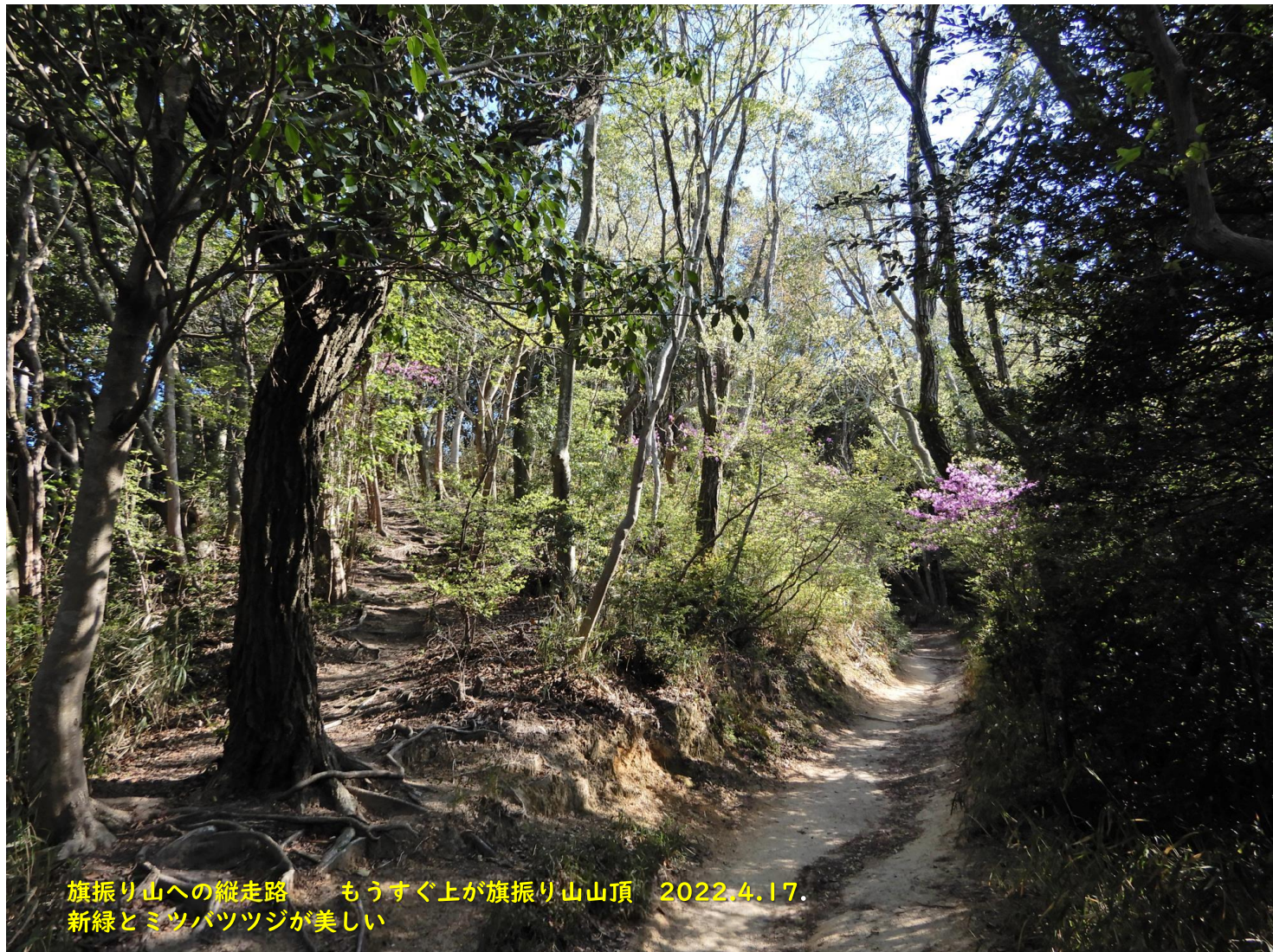
旗振り山への縦走路 もうすぐ上が旗振り山山頂 2022.4.17. 新緑とミツバツツジが美しい