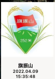
旗振り山 2022.04.09 15:35:48