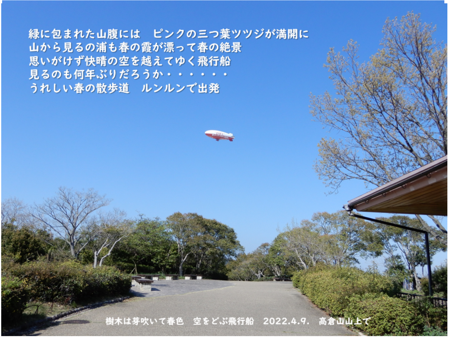
樹木は芽吹いて春色 空をどぶ飛行船 2022.4.9. 高倉山山上で

緑に包まれた山腹には ピンクの三つ葉ツツジが満開に 山から見るの浦も春の霞が漂って春の絶景 思いがけず快晴の空を越えてゆく飛行船 見るのも何年ぶりだろうか・・・・・・ うれしい春の散歩道 ルンルンで出発