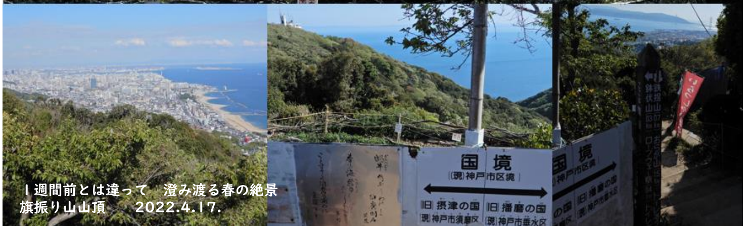
1週間前とは違って 澄み渡る春の絶景 旗振り山山頂 2022.4.17.