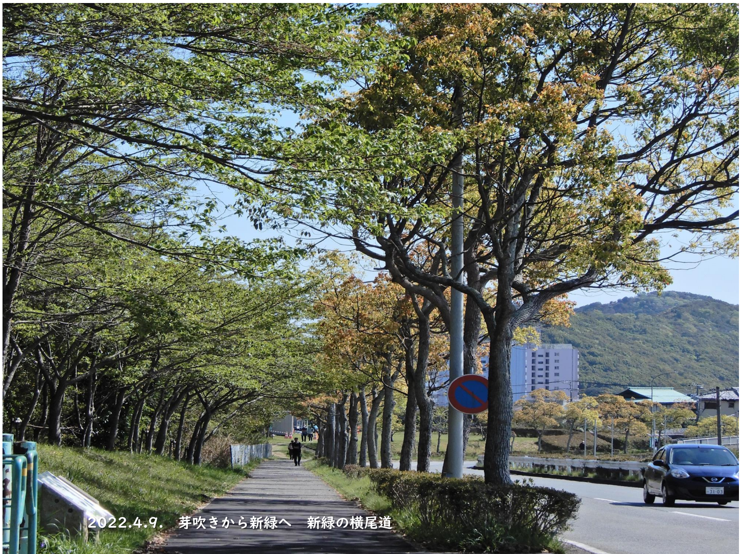
2022.4.9. 芽吹きから新緑へ 新緑の横尾道