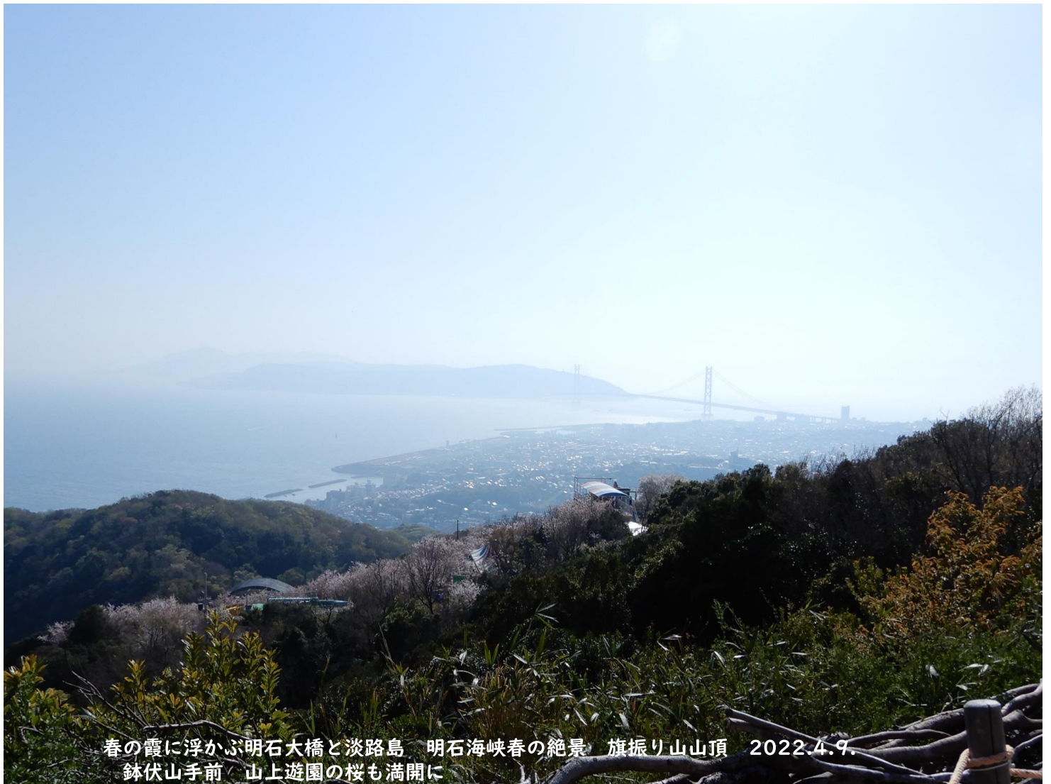
春の霞に浮かぶ明石大橋と淡路島 明石海峡春の絶景 旗振り山山頂 2022.4.9. 鉢伏山手前 山上遊園の桜も満開に