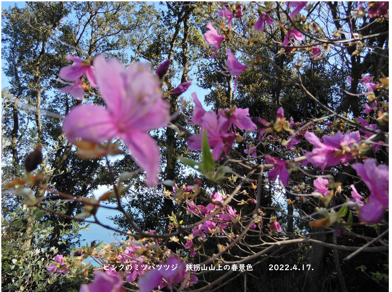
ピンクのミツバツツジ 鉄拐山山上の春景色 2022.4.17.