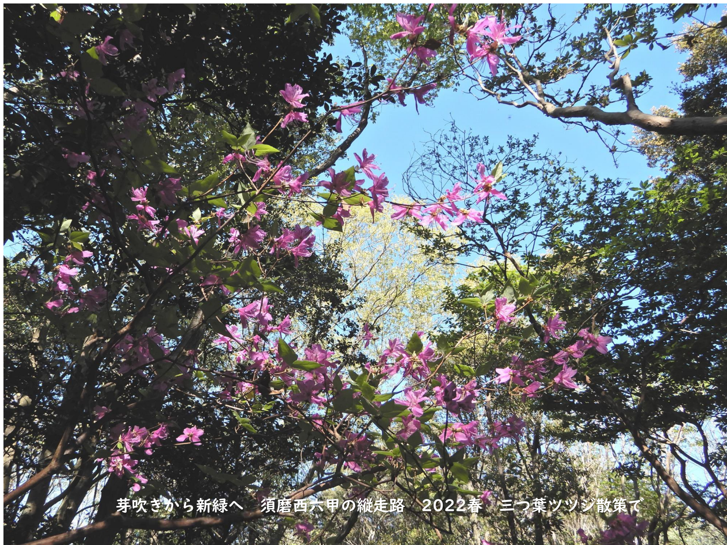
芽吹きから新緑へ 須磨西六甲の縦走路 2022春 三つ葉ツツジ散策で