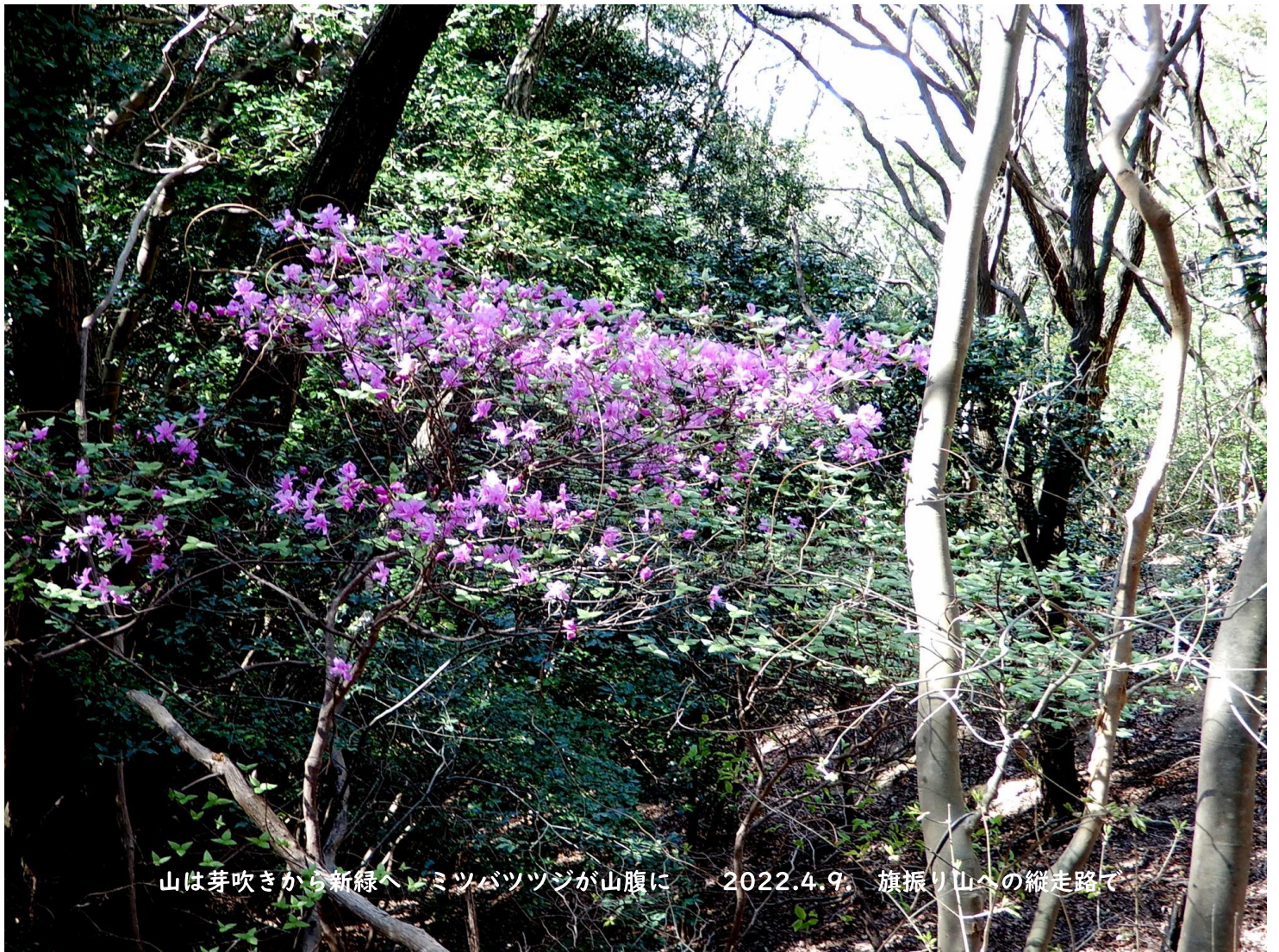
山は芽吹きから新緑へ、ミツバツツジが山腹に 2022.4.9. 旗振り山への縦走路で