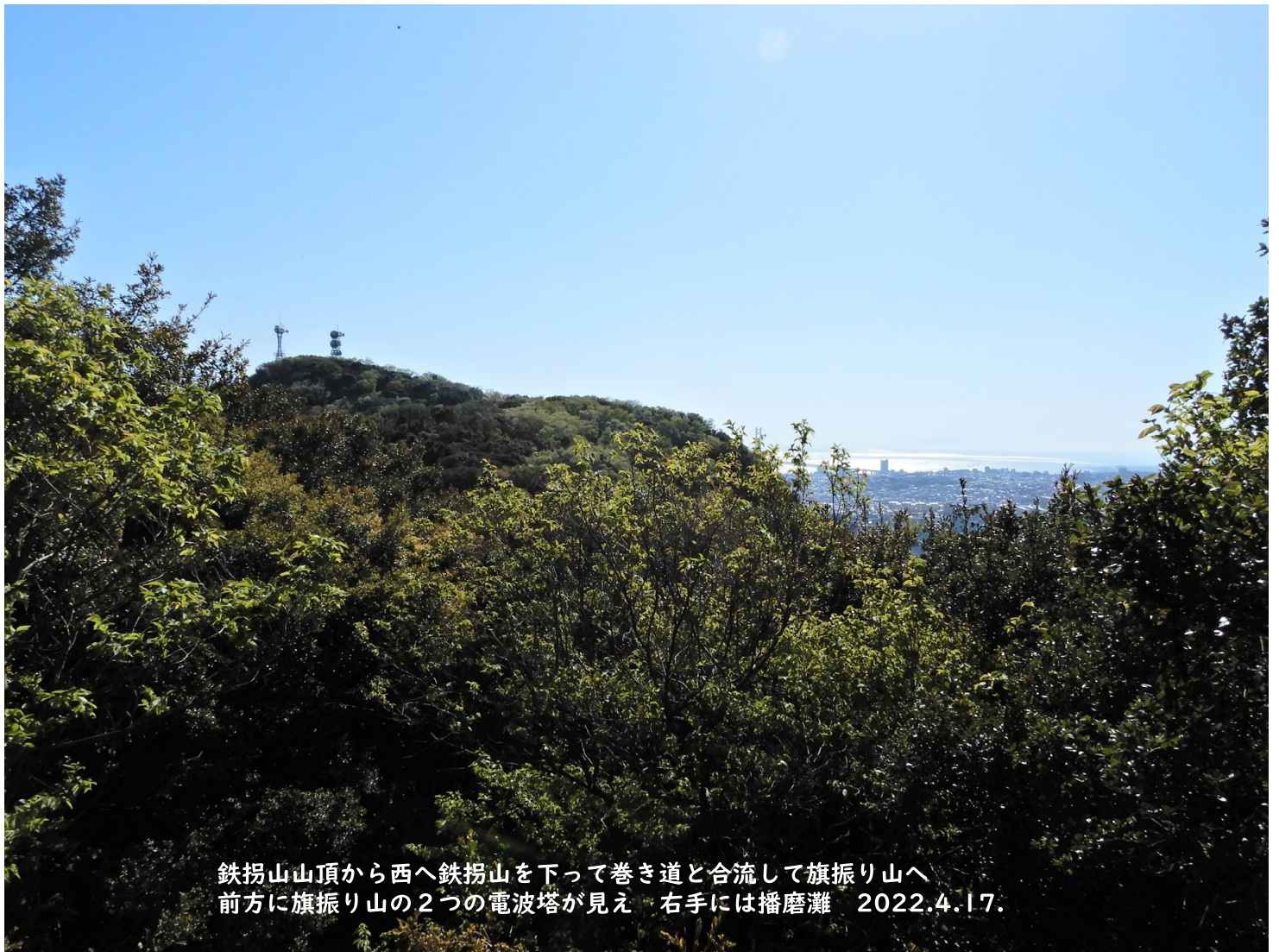
鉄拐山山頂から西へ鉄拐山を下って巻き道と合流して旗振り山へ 前方に旗振り山の2つの電波塔が見え 右手には播磨灘 2022.4.17.