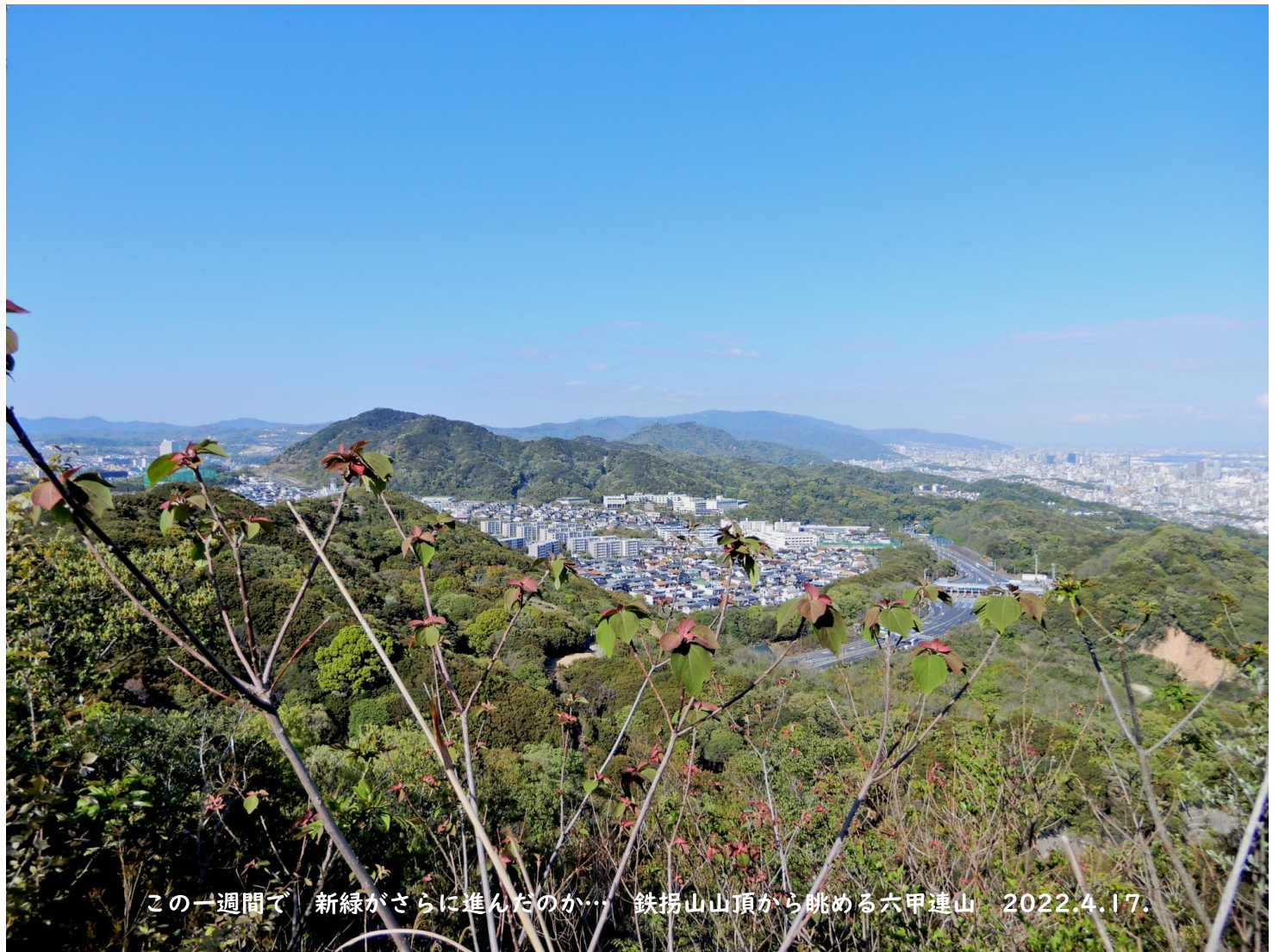
この一週間で 新緑がさらに進んだのか… 鉄拐山山頂から眺める六甲連山 2022.4.17.