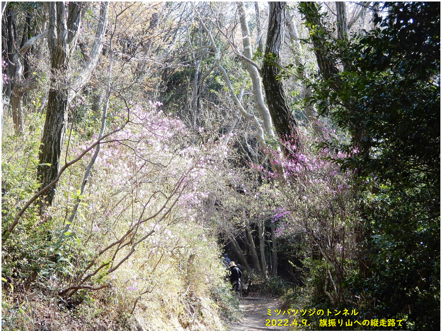
ミツバツツジのトンネル 2022.4.9. 旗振り山への縦走路で