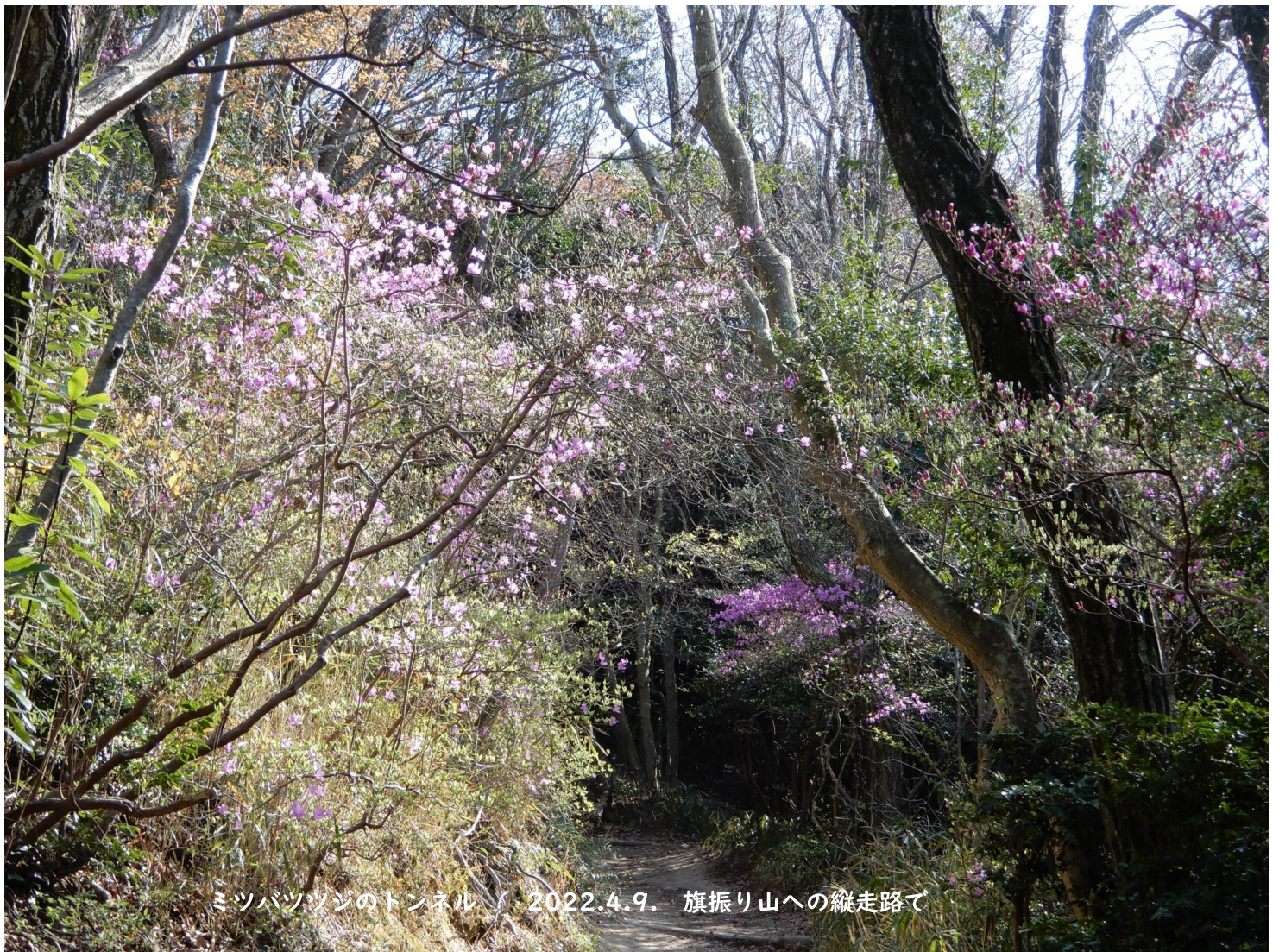
ミツバツツジのトンネル / 2022.4.9. 旗振り山への縦走路で