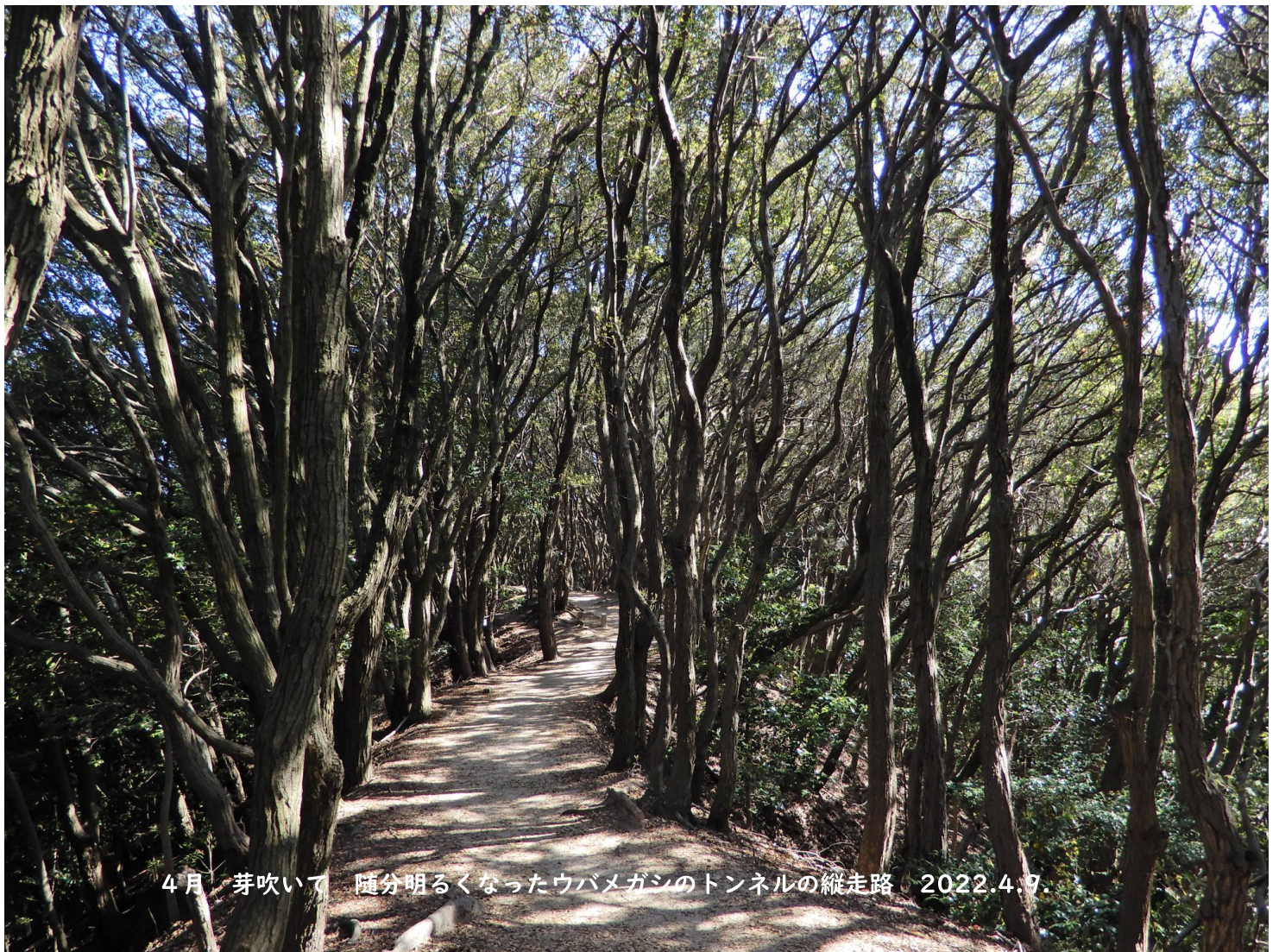
4月 芽吹いて 随分明るくなったウバメガシのトンネルの縦走路 2022.4.9.