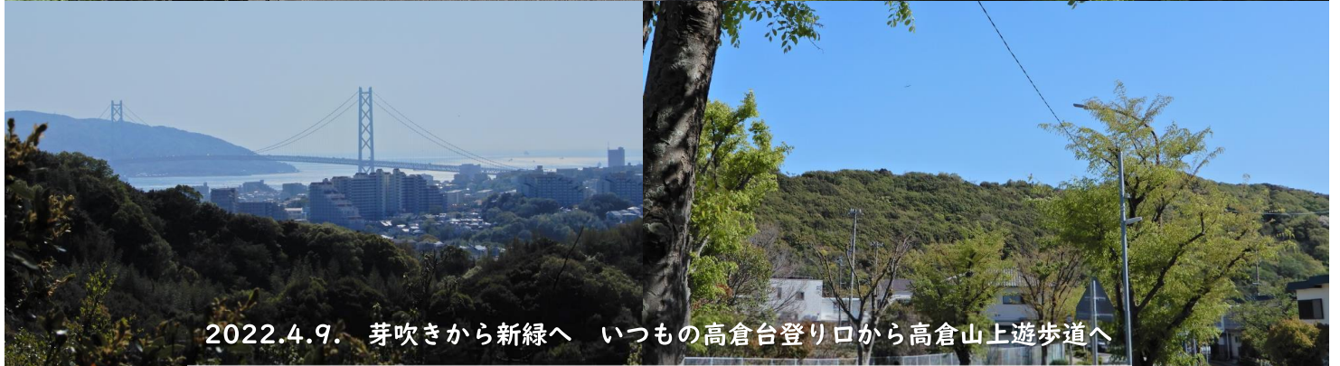
2022.4.9. 芽吹きから新緑へ いつもの高倉台登り口から高倉山上遊歩道へ