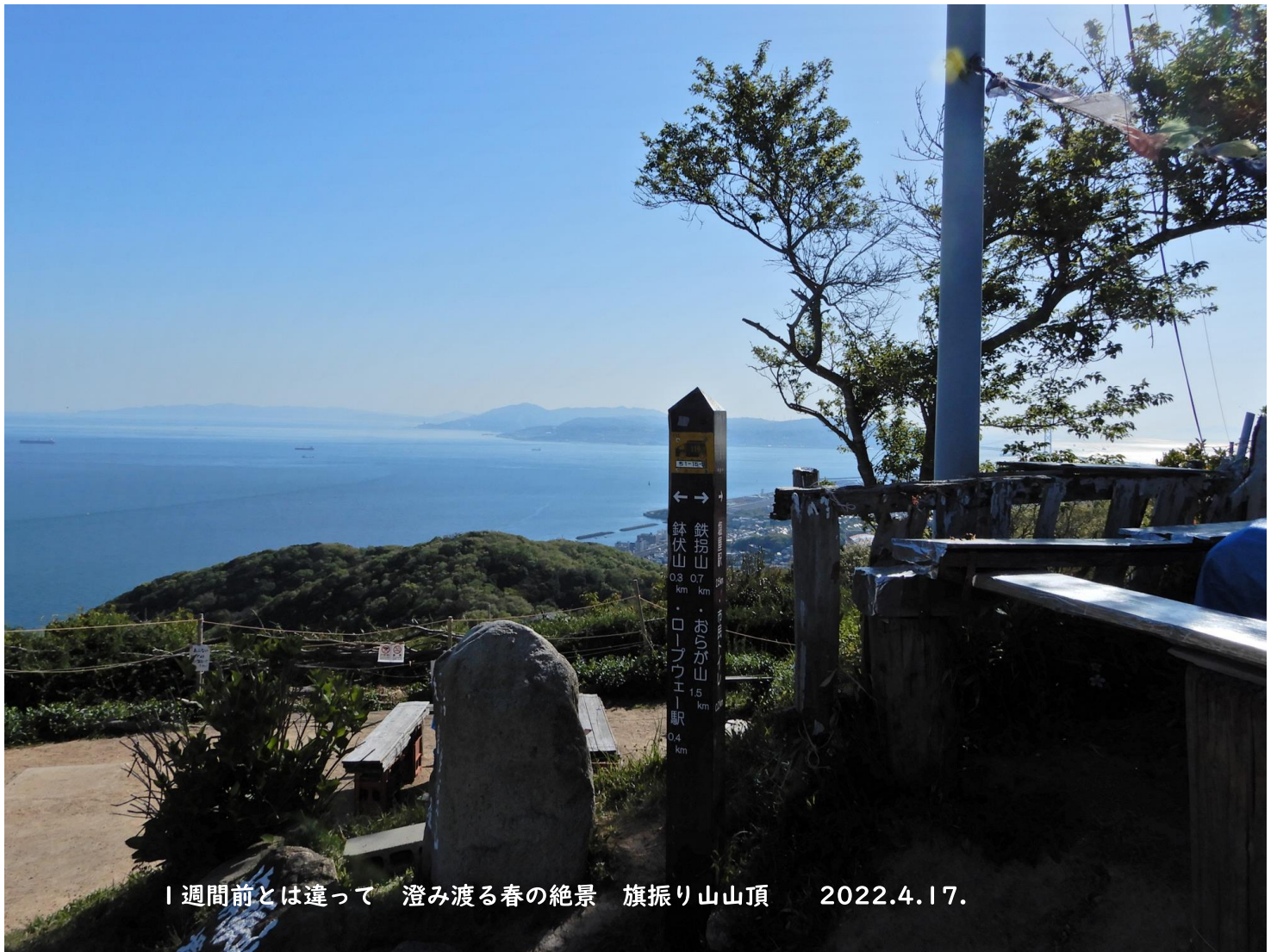
1週間前とは違って 澄み渡る春の絶景 旗振り山山頂 2022.4.17.