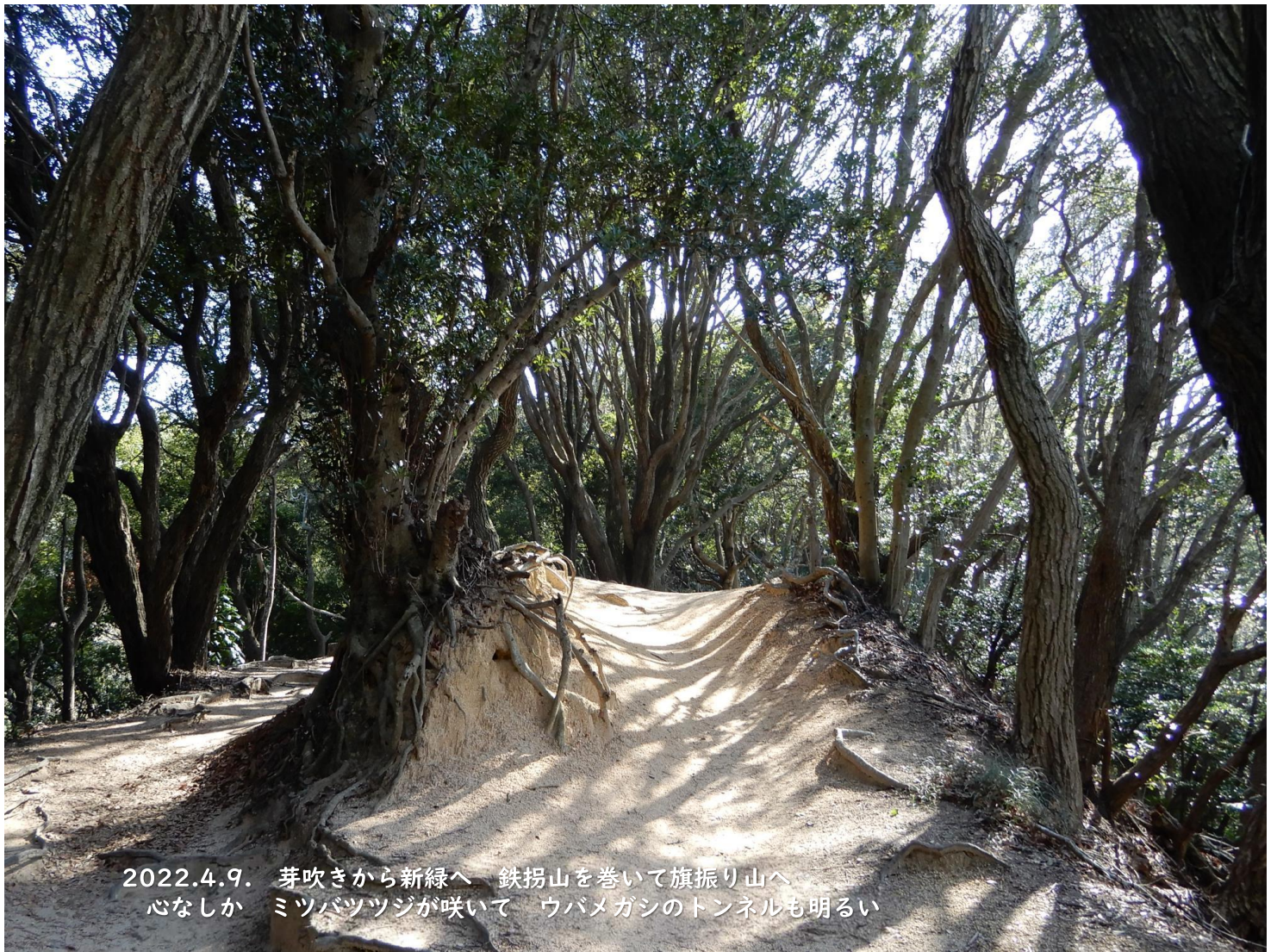
2022.4.9. 芽吹きから新緑へ 鉄拐山を巻いて旗振り山へ 心なしか ミツバツツジが咲いて ウバメガシのトンネルも明るい