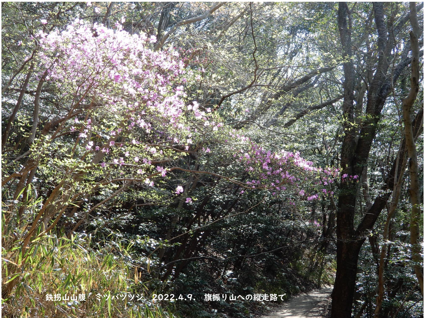
鉄拐山山腹 ミツバツツジ 2022.4.9. 旗振り山への縦走路で