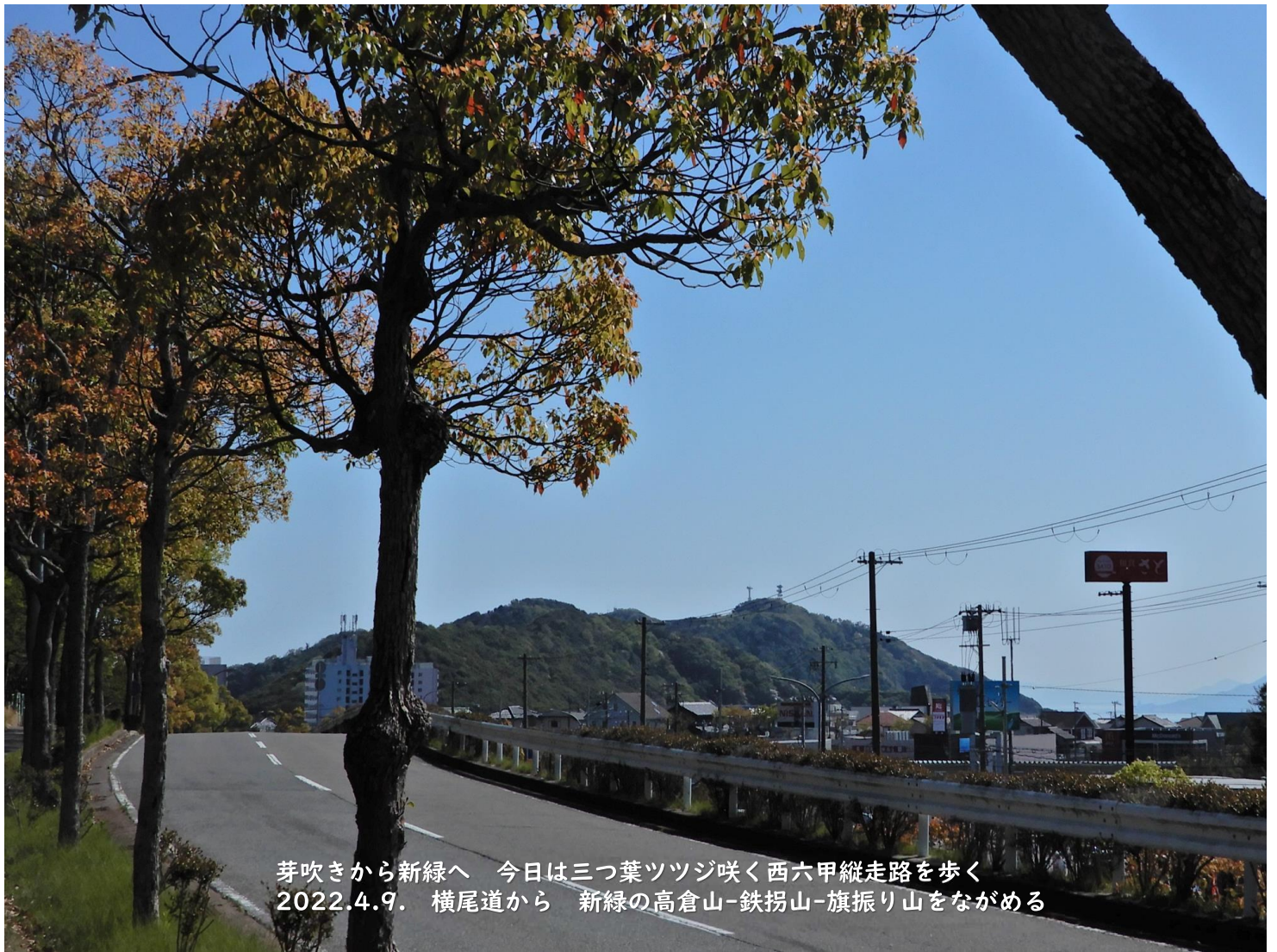
芽吹きから新緑へ 今日三つ葉ツツジ咲く西六甲縦走路を歩く 2022.4.9. 横尾道から 新緑の高倉山-鉄拐山-旗振り山をながめる