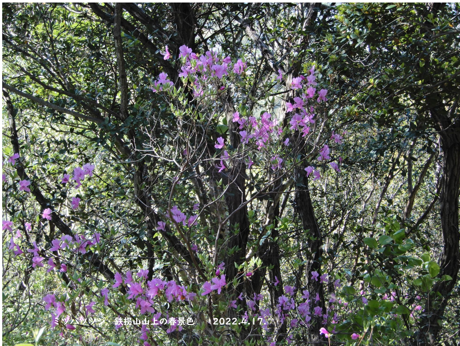
ミツバツツジ 鉄拐山山上の春景色 2022.4.17.