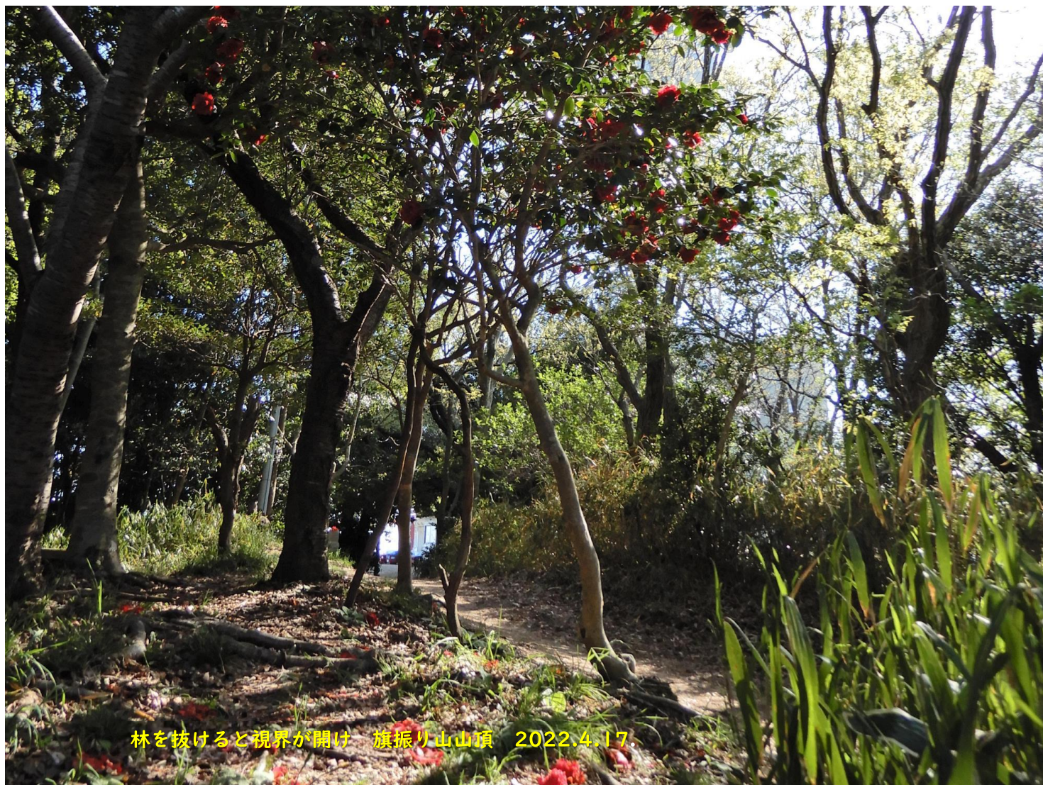
林を抜けると視界が開け 旗振り山山頂 2022.4.17.