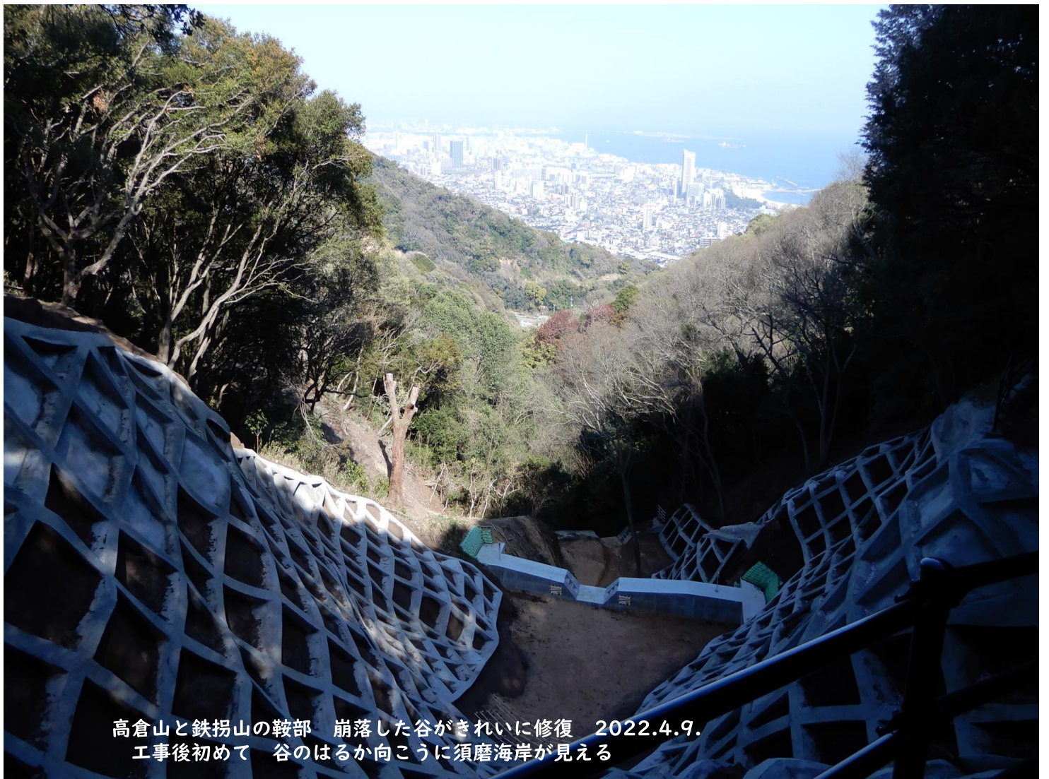
高倉山と鉄拐山の鞍部 崩落した谷がきれいに修復 2022.4.9. 工事後初めて 谷のはるか向こうに須磨海岸が見える