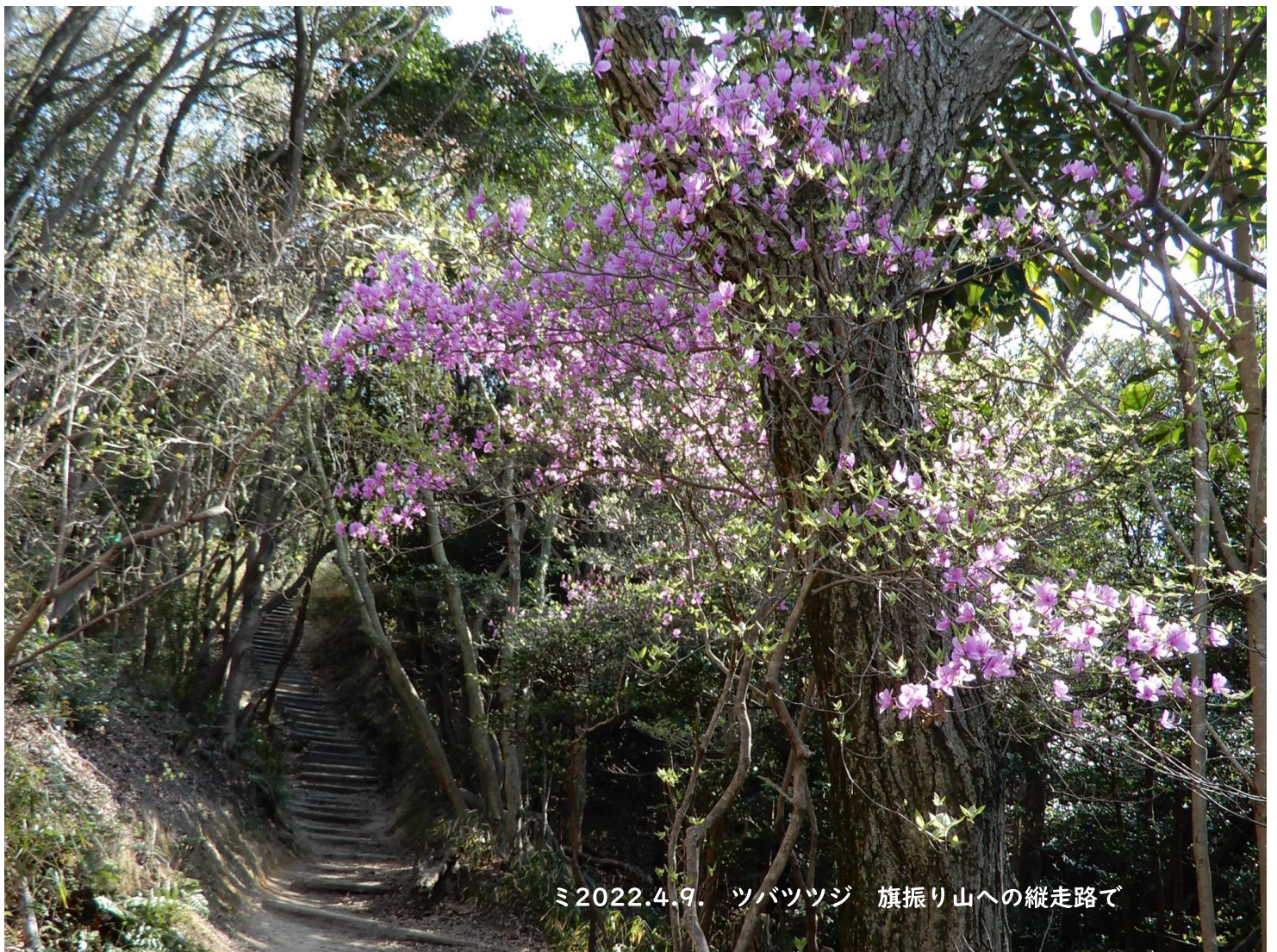
ミ2022.4.9. ツバツツジ 旗振り山への縦走路で