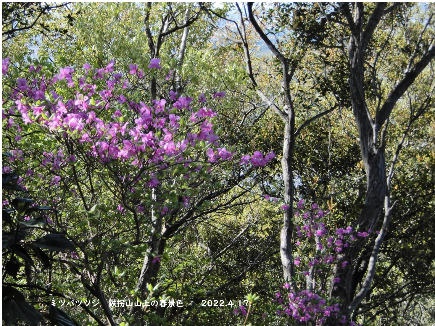
ミツバツツジ 鉄拐山山上の春景色 2022.4.17.