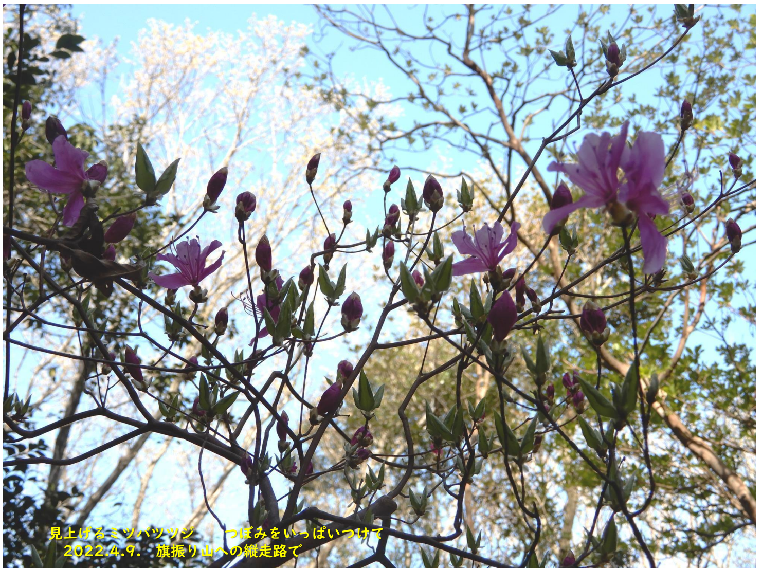
見上げるミツバツツジ つばみをいっぱいつけて 2022.4.9. 旗振り山への縦走路で