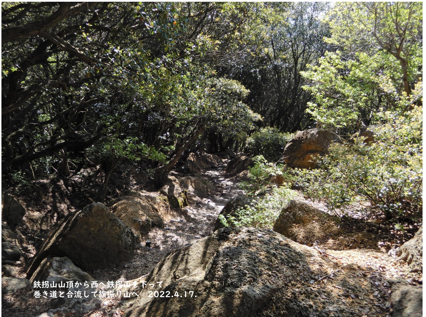
鉄拐山山頂から西へ鉄拐山を下って 巻き道と合流して旗振り山へ 2022.4.17.