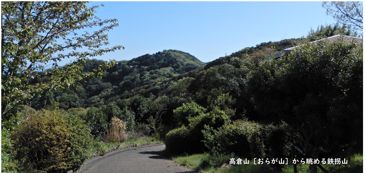
高倉山 [おらが山] から眺める鉄拐山