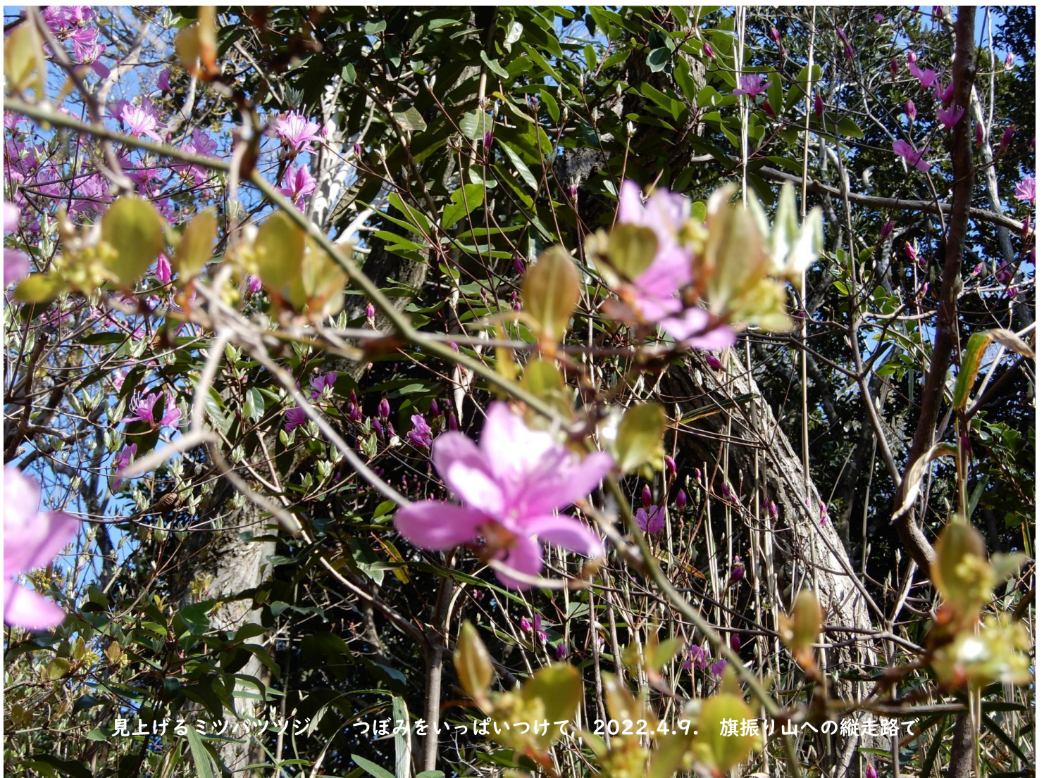
見上げるミツバツツジ つぼみをいっぱいつけて、2022.4.9. 旗振り山への縦走路で