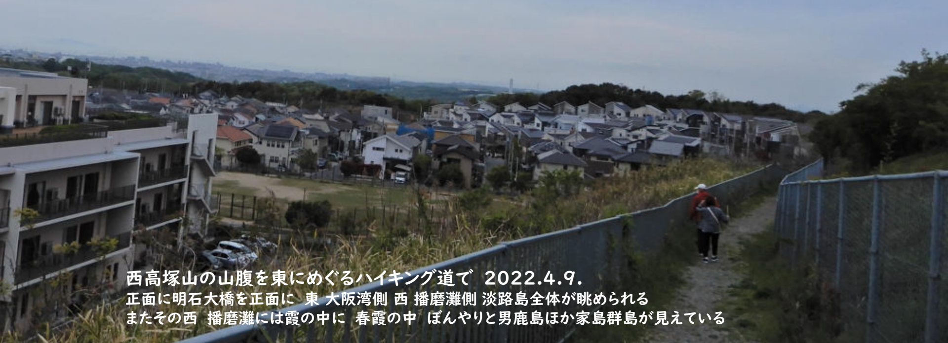
西高塚山の山腹を東にめぐるハイキング道で 2022.4.9. 正面に明石大橋を正面に 東 大阪湾側 西 播磨灘側 淡路島全体が眺められる またその西 播磨灘には霞の中に 春霞の中 ぼんやりと男鹿島ほか家島群島が見えている