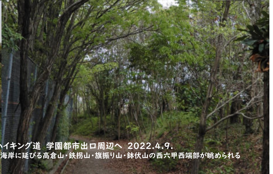
西高塚山の山腹を東にめぐるハイキング道 学園都市出口周辺へ 2022.4.9. 東に須磨アルプス 横尾山から須磨海岸に延びる高倉山・鉄拐山・旗振り山・鉢伏山の西六甲西端部が眺められる