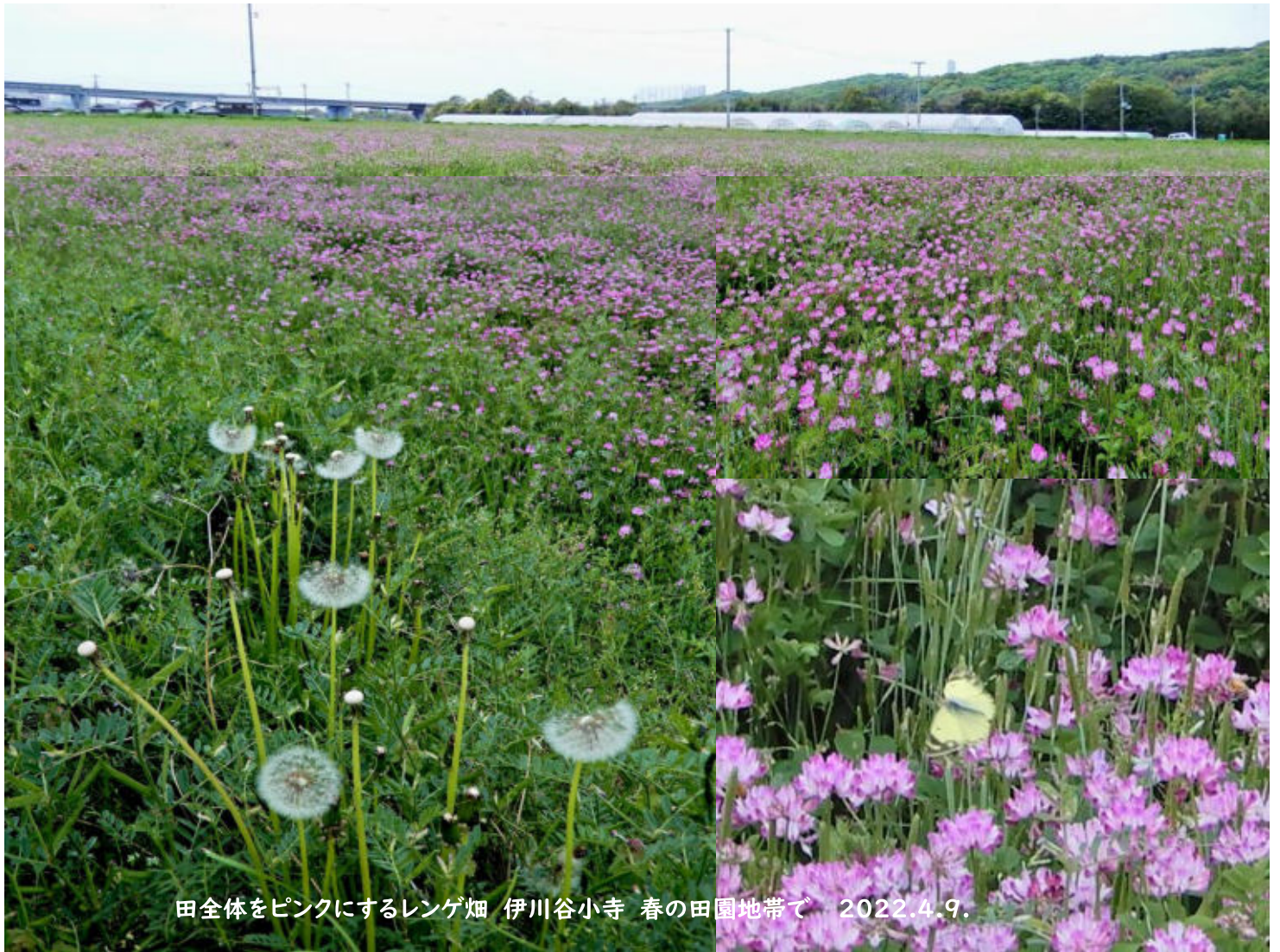
田全体をピンクにするレンゲ畑 伊川谷小寺 春の田園地帯で 2022.4.9.