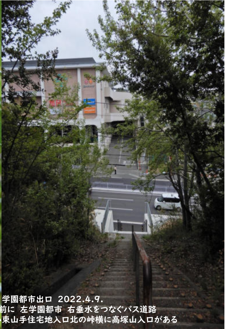
西高塚山の山腹を東にめぐるハイキング道 学園都市出口 2022.4.9. 学園都市小束山手の商業施設ブランチの前に 左学園都市 右垂水をつなぐバス道路 ハイキングロードはこの道の向こう左手 小束山手住宅地入口北の峠横に高塚山入口がある