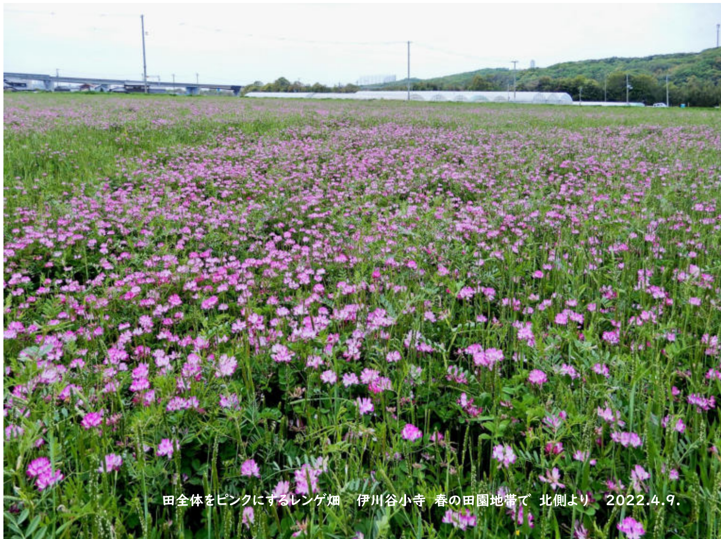
田全体をピンクにするレンゲ畑 伊川谷小寺 春の田園地帯で 北側より 2022.4.9.