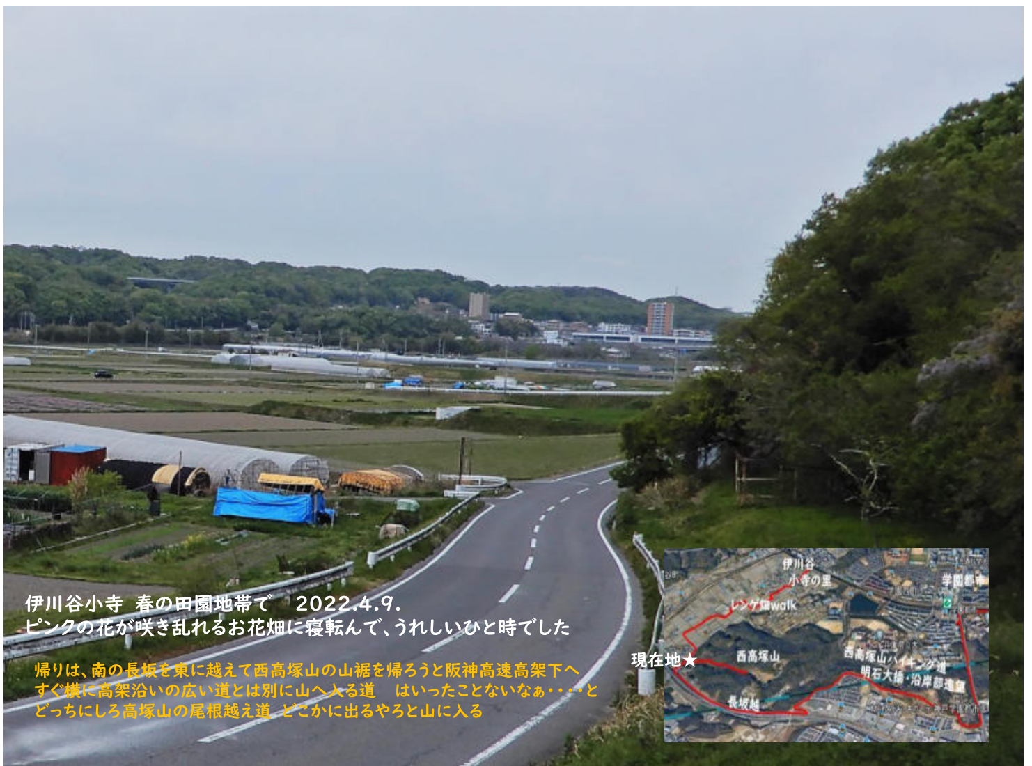
伊川谷小寺 春の田園地帯で 2022.4.9. ピンクの花が咲き乱れるお花畑に寝転んで、うれしいひと時でした

帰りは、南の長坂を東に越えて西高塚山の山裾を帰ろうと阪神高速高架下へ すぐ横に高架沿いの広い道とは別に山へ入る道 はいったことないなあ・・・と どっちにしる高塚山の尾根越え道 どこかに出るやると山に入る