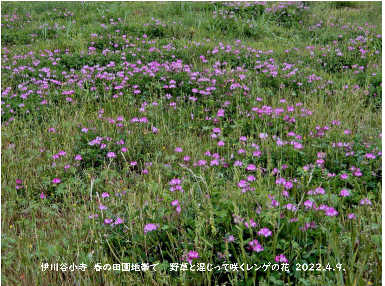
伊川谷小寺 春の田園地帯で 野草と混じって咲くレンゲの花 2022.4.9.