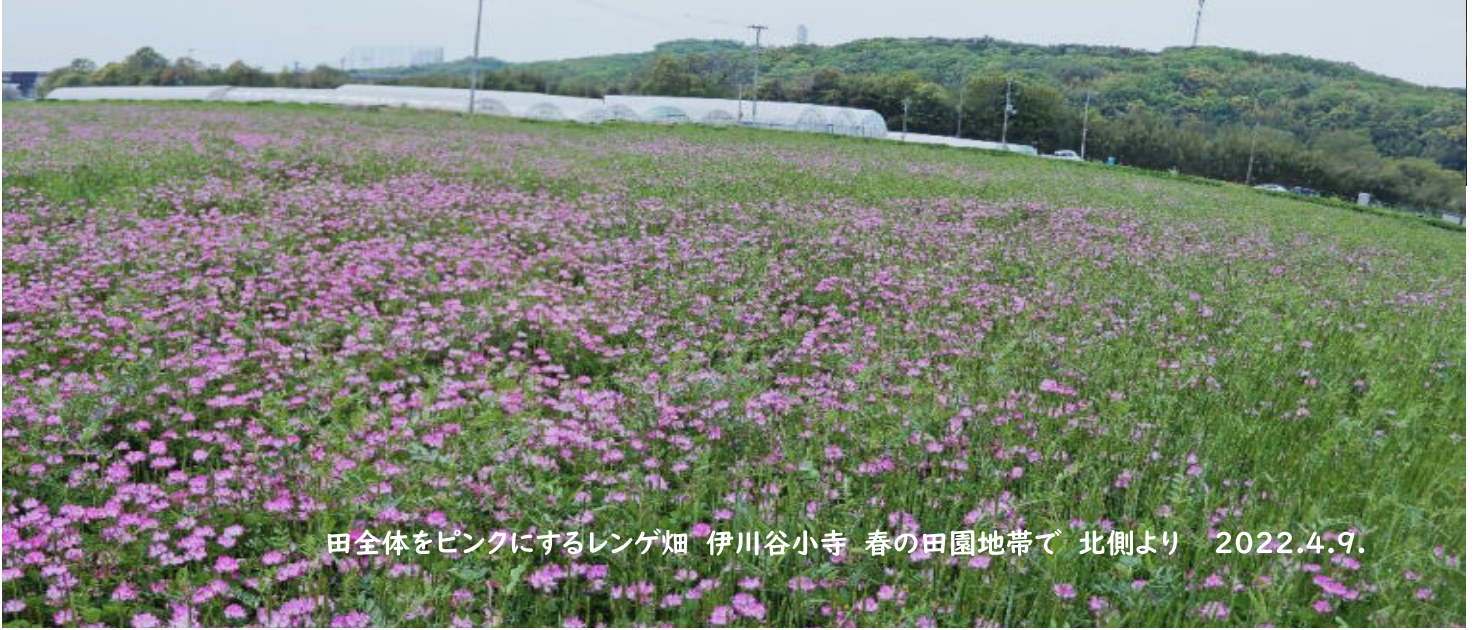
田全体をピンクにするレンゲ畑 伊川谷小寺 春の田園地帯で 北側より 2022.4.9.