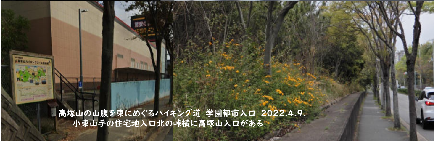
高塚山の山腹を東にめぐるハイキング道 学園都市入口 2022.4.9. 小束山手の住宅地入口北の峠横に高塚山入口がある