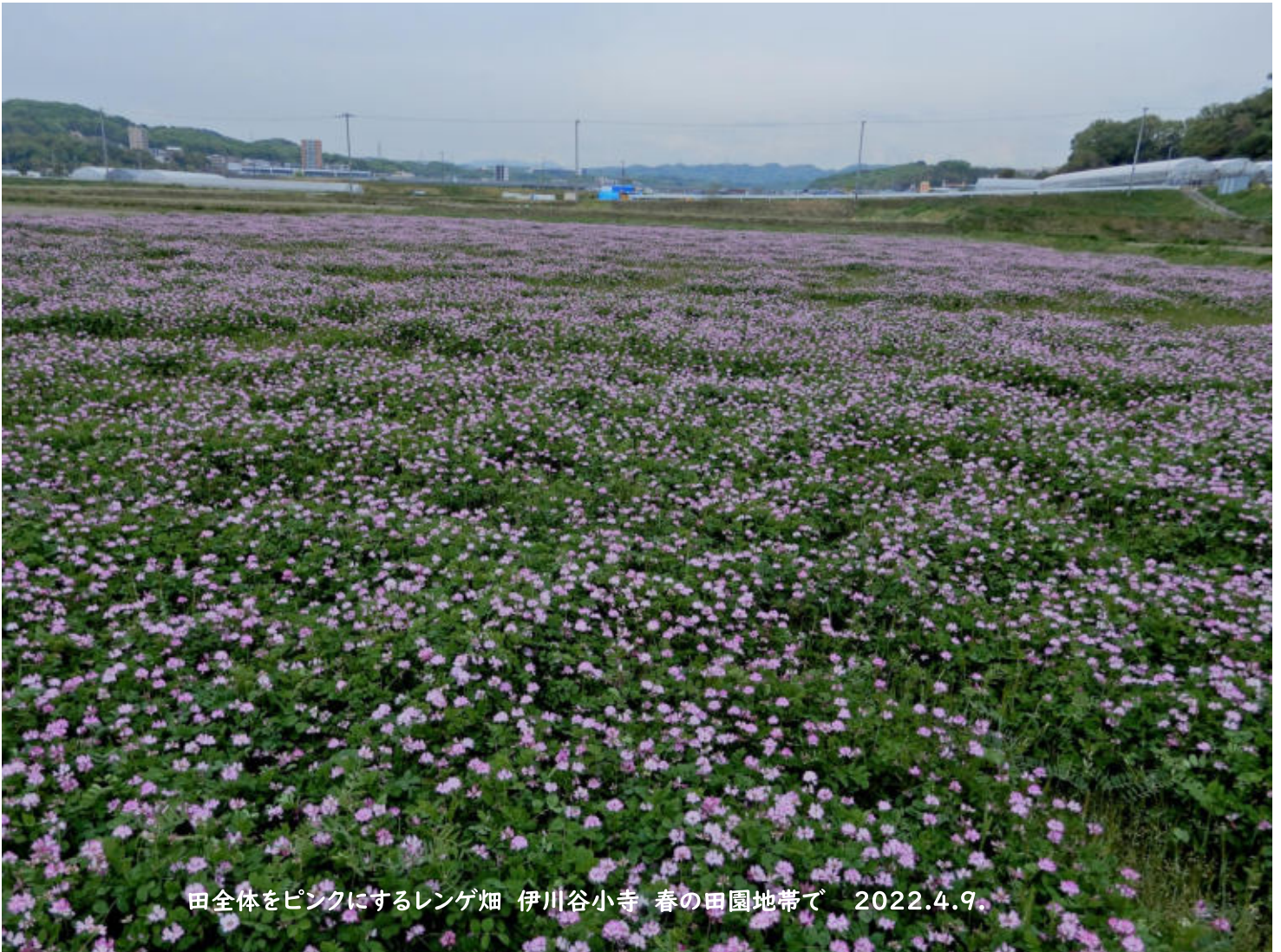
田全体をピンクにするレンゲ畑 伊川谷小寺 春の田園地帯で 2022.4.9.