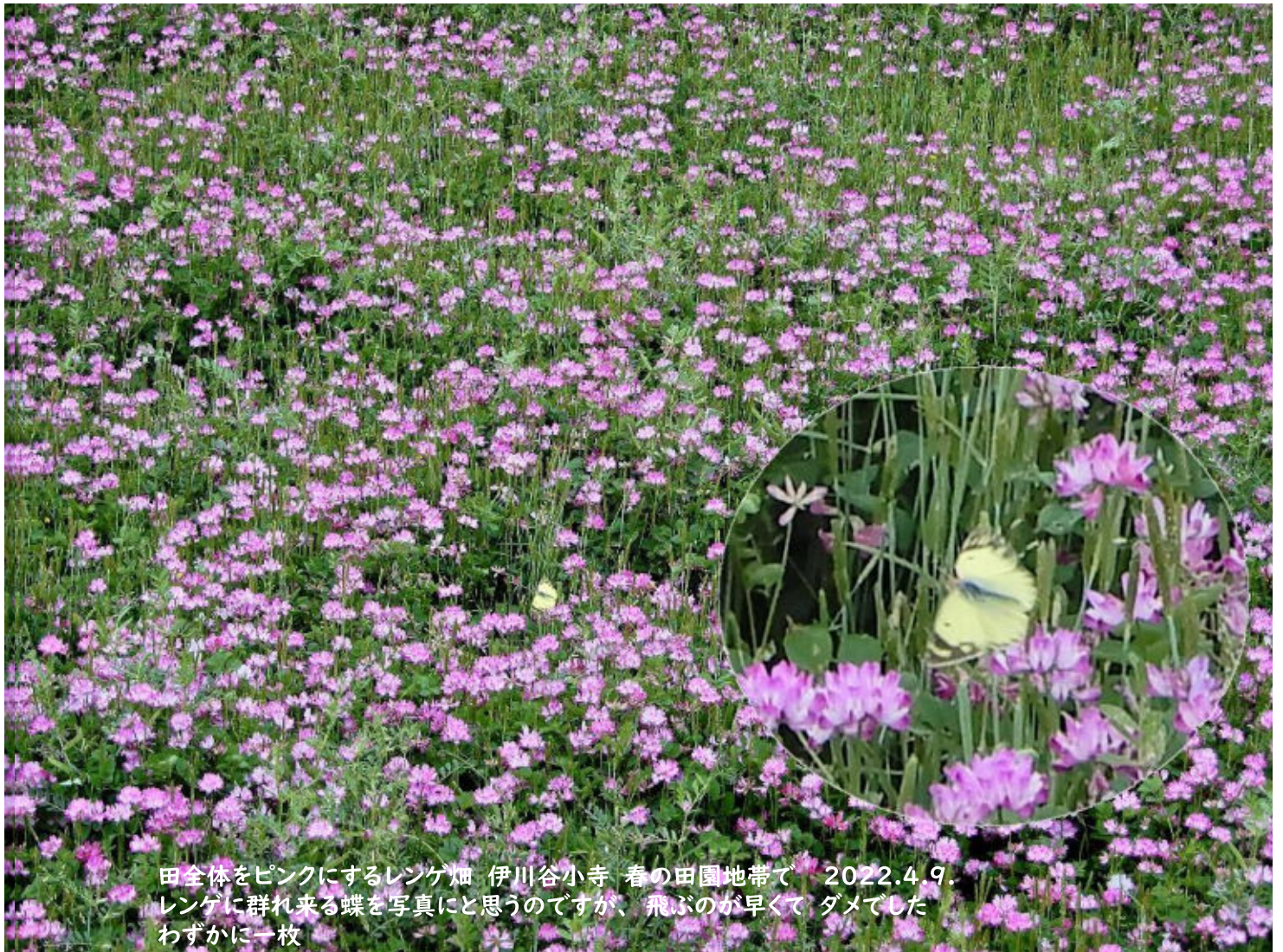
田全体をピンクにするレンゲ畑 伊川谷小寺 春の田園地帯で 2022.4.9. レンゲに群れ来る蝶を写真に思うのですが、飛ぶのが早くて ダメでした わずかに一枚