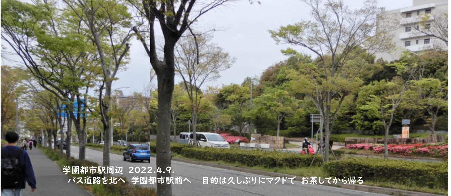
学園都市駅周辺 2022.4.9. バス道路を北へ 学園都市駅前へ 目的は久しぶりにマクドで お茶してから帰る