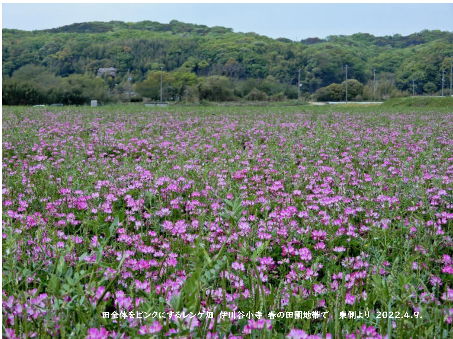
田全体をピンクにするレンゲ畑 伊川谷小寺 春の田園地帯で 東側より 2022.4.9.