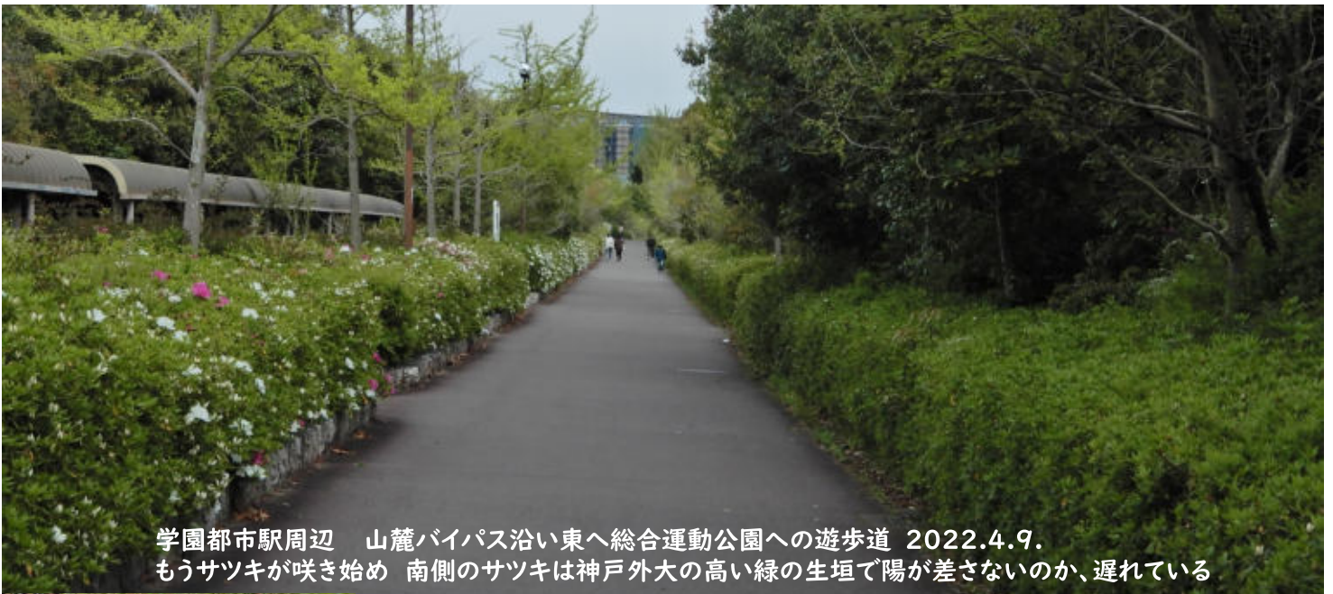
学園都市駅周辺 山麓バイパス沿い東へ総合運動公園への遊歩道 2022.4.9. もうサツキが咲き始め 南側のサツキは神戸外大の高い緑の生垣で陽が差さないのか、遅れている