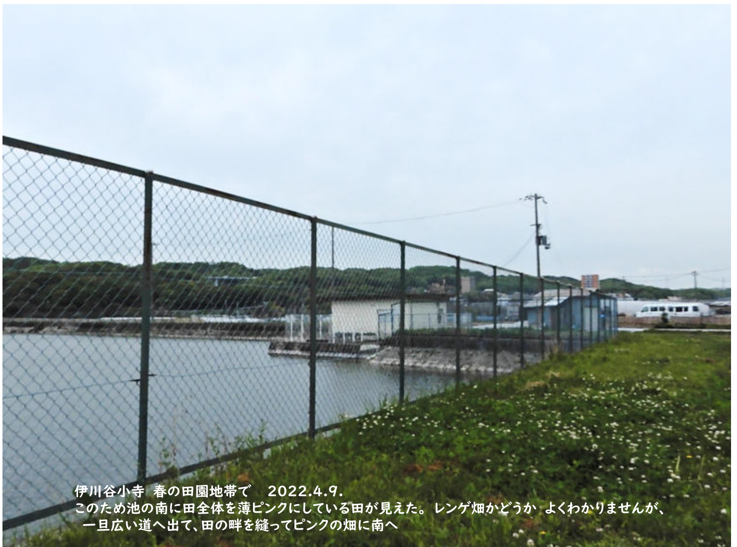
伊川谷小寺 春の田園地帯で 2022.4.9. このため池の南に田全体を薄ピンクにしている田が見えた。レンゲ畑かどうか よくわかりませんが、一旦広い道へ出て、田の畔を縫ってピンクの畑に南へ