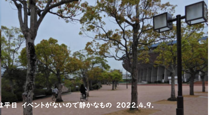
神戸総合運動公園駅周辺 今日平日 イベントがないので静かなもの 2022.4.9.