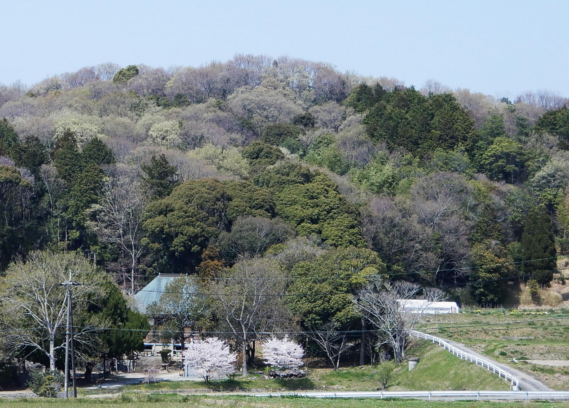
押部谷 性海寺の里の春景色 2022.4.6 芽吹き of 里山を背にして桜咲くこの里のシンボル 性海寺