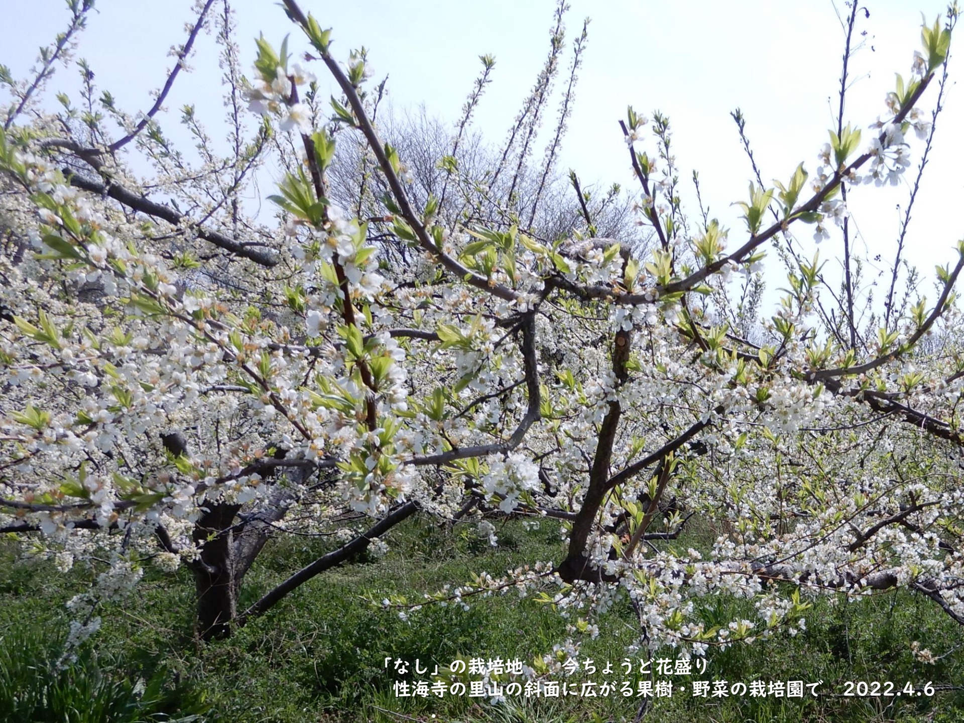
「なし」の栽培地 今ちょうど花盛り 性海寺の里山の斜面に広がる果樹・野菜の栽培園で 2022.4.6