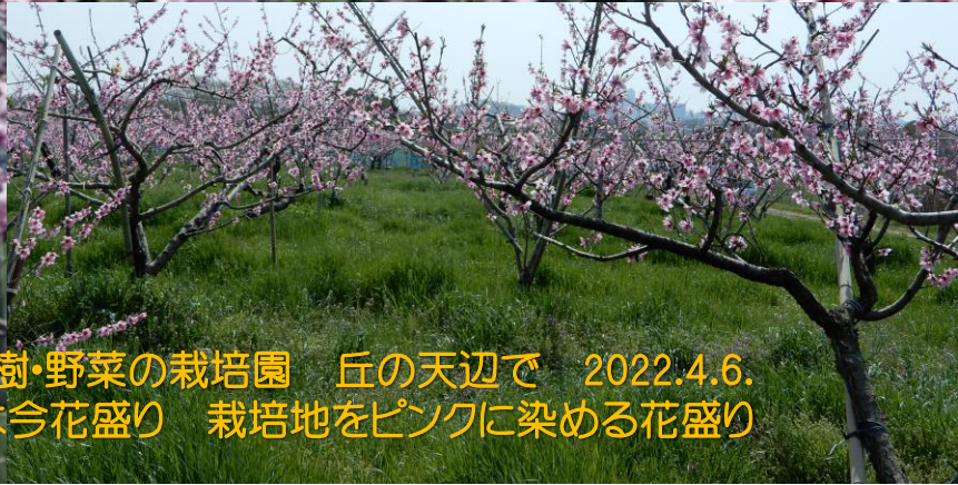
性海寺の里山の斜面に広がる果樹・野菜の栽培園 丘の天辺で 2022.4.6. 立ち並ぶ桃ノ木は今花盛り 栽培地をピンクに染める花盛り