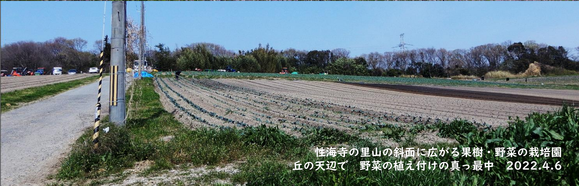
性海寺の里山の斜面に広がる果樹・野菜の栽培園 丘の天辺で 野菜の植え付けの真っ最中 2022.4.6