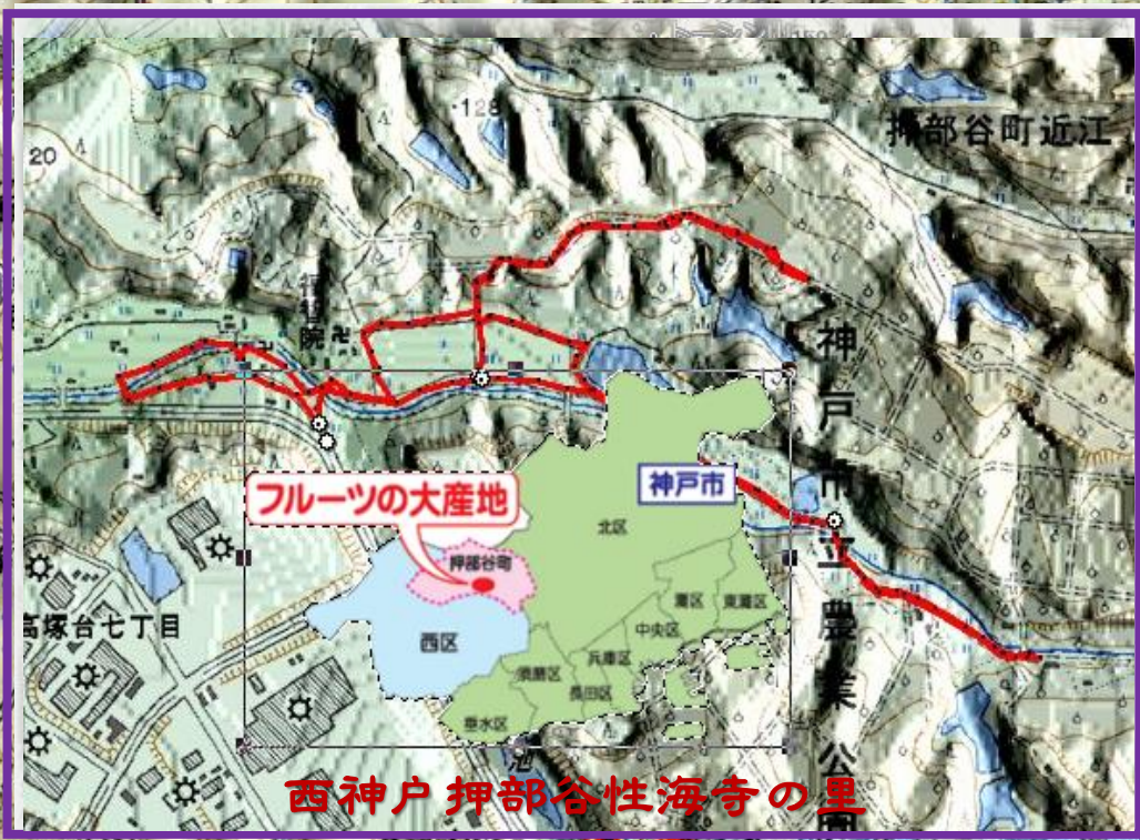
西神戸押部谷性海寺の里