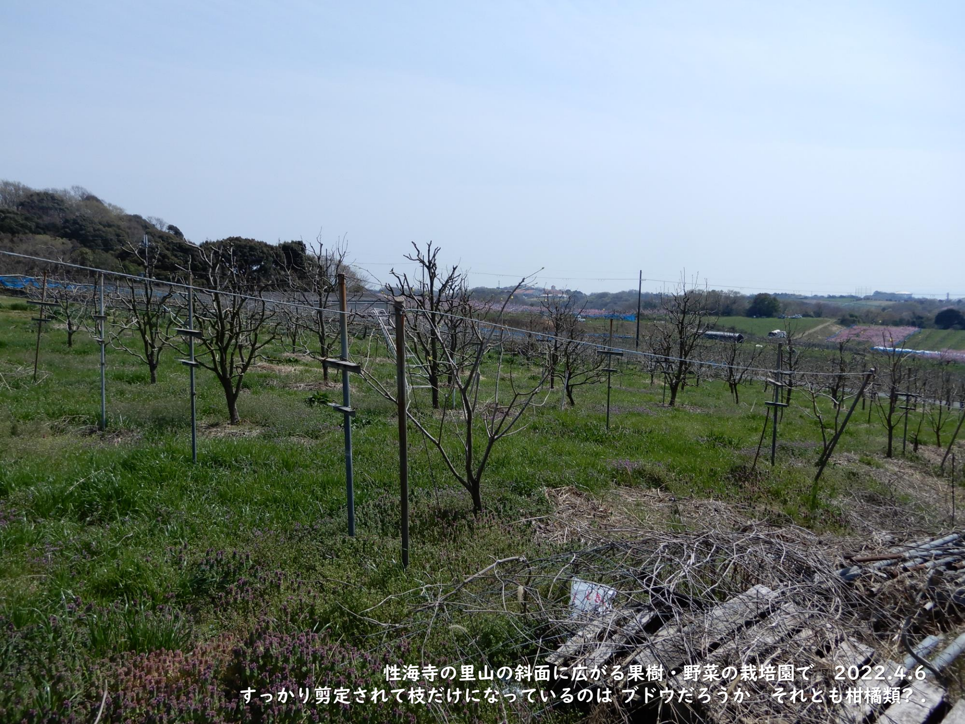
性海寺の里山の斜面に広がる果樹・野菜の栽培園で 2022.4.6 すっかり剪定されて枝だけになっているのは ブドウだろうか それとも柑橘類？