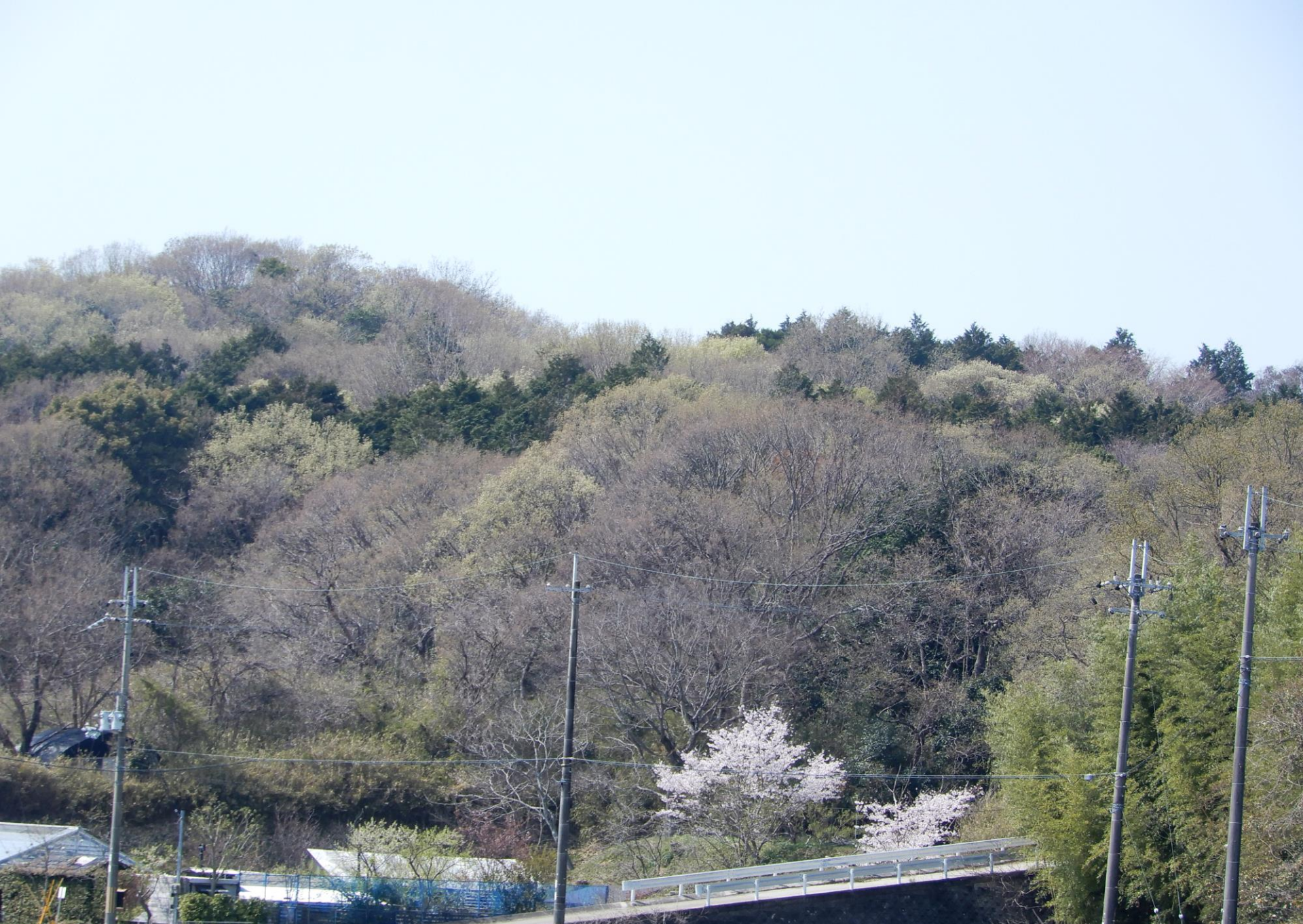
西神戸 芽吹きの里山 パステルカラーに彩られた春景色 押部谷 性海寺の里で 2022.4.6.