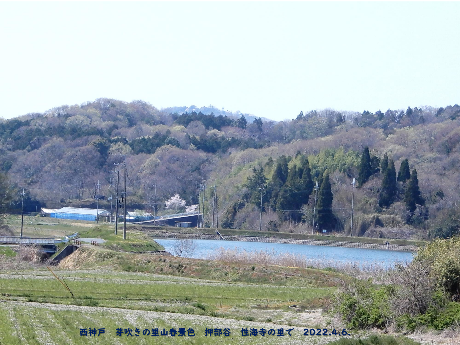
西神戸 芽吹きの里山春景色 押部谷 性海寺の里で 2022.4.6.