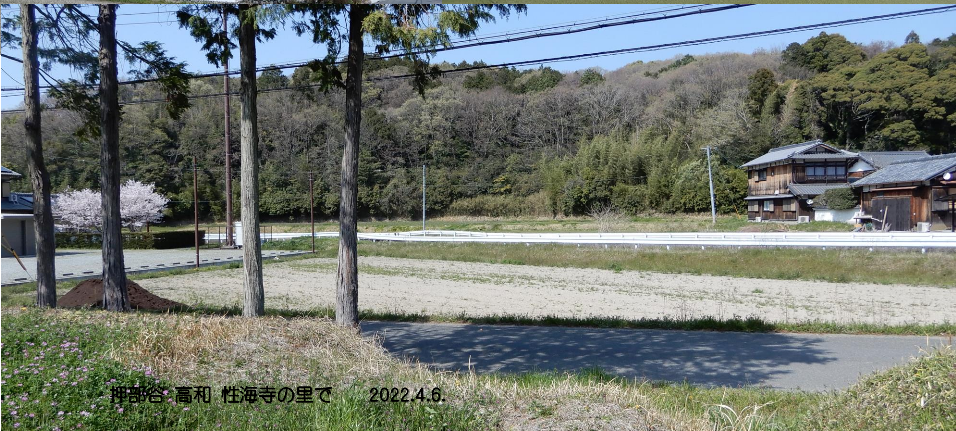
押部谷 高和 性海寺の里で 2022.4.6.