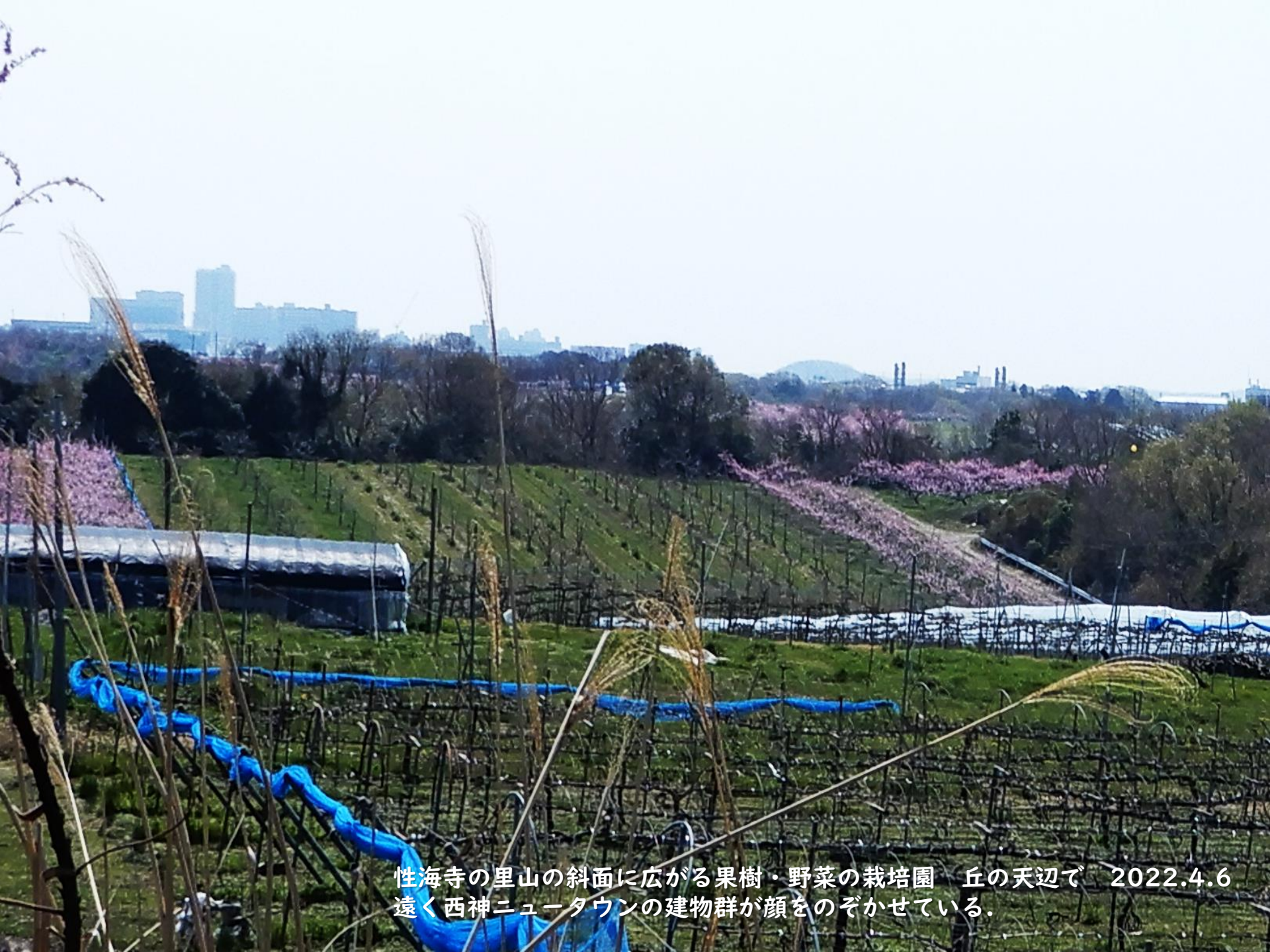
性海寺の里山の斜面に広がる果樹・野菜の栽培園 丘の天辺で 2022.4.6 遠く西神ニュータウンの建物群が顔をのぞかせている。