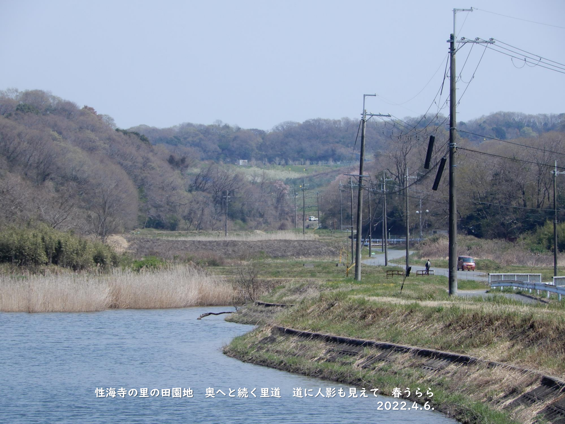
性海寺の里の田園地 奥へと続く里道 道に人影も見えて 春うらら 2022.4.6.