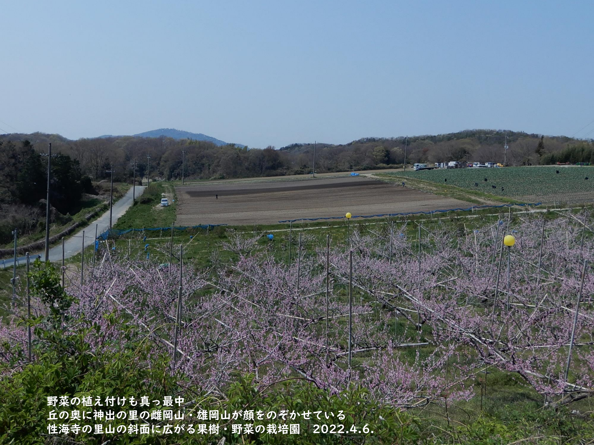
野菜の植え付けも真っ最中 丘の奥に神出の里の雌岡山・雄岡山が顔をのぞかせている 性海寺の里山の斜面に広がる果樹・野菜の栽培園 2022.4.6.