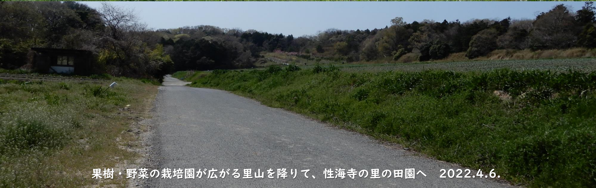
果樹・野菜の栽培園が広がる里山を降りて、性海寺の里の田園へ 2022.4.6.