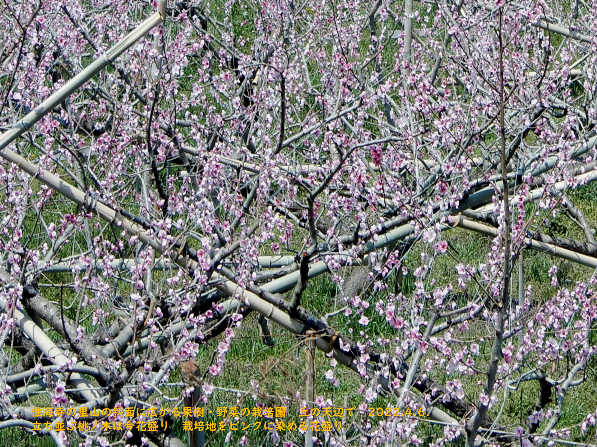
性海寺の里山の斜面に広がる果樹・野菜の栽培園 丘の天辺で 2022.4.6. 立ち並ぶ桃ノ木は今花盛り 栽培地をピンクに染める花盛り