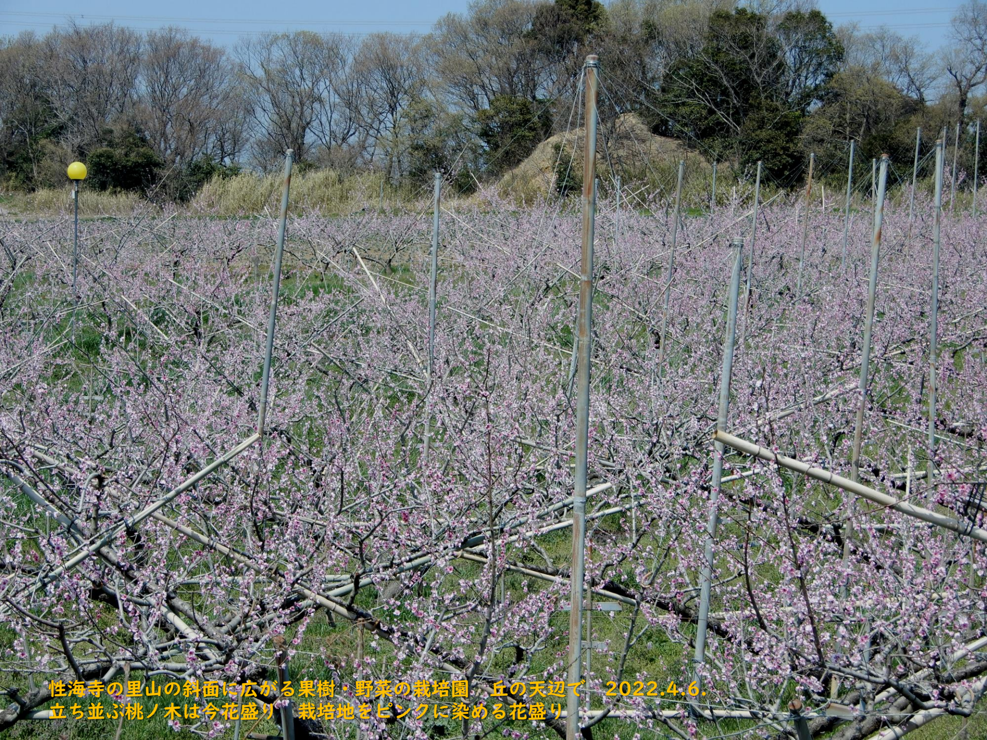
性海寺の里山の斜面に広がる果樹・野菜の栽培園 丘の天辺で 2022.4.6. 立ち並ぶ桃ノ木は今花盛り 栽培地をピンクに染める花盛り