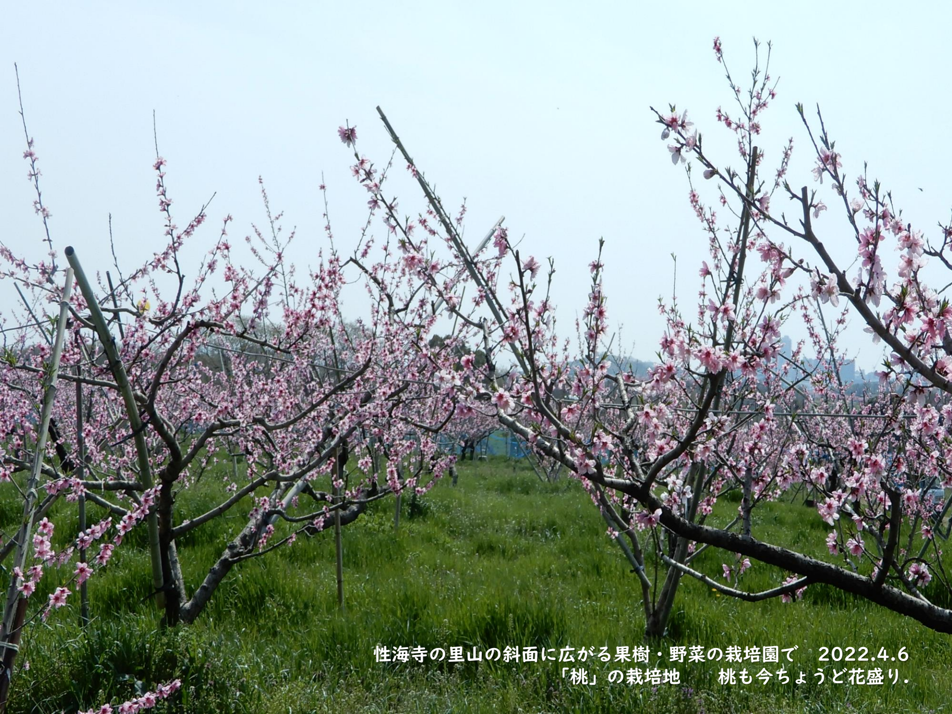
性海寺の里山の斜面に広がる果樹・野菜の栽培園で 2022.4.6 「桃」の栽培地 桃も今ちょうど花盛り。