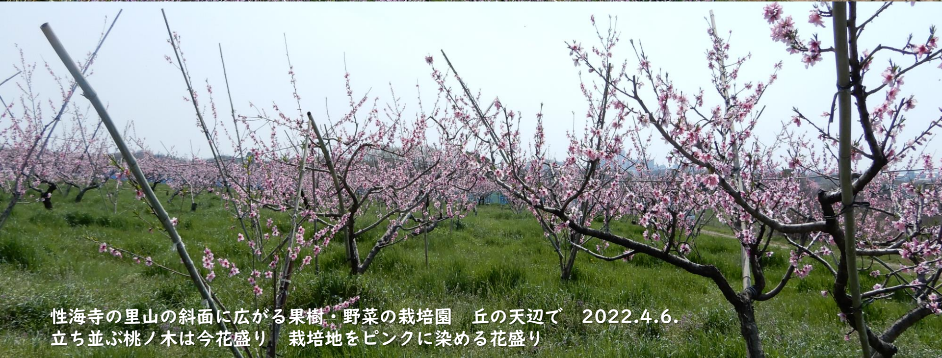
性海寺の里山の斜面に広がる果樹・野菜の栽培園 丘の天辺で 2022.4.6. 立ち並ぶ桃ノ木は今花盛り 栽培地をピンクに染める花盛り