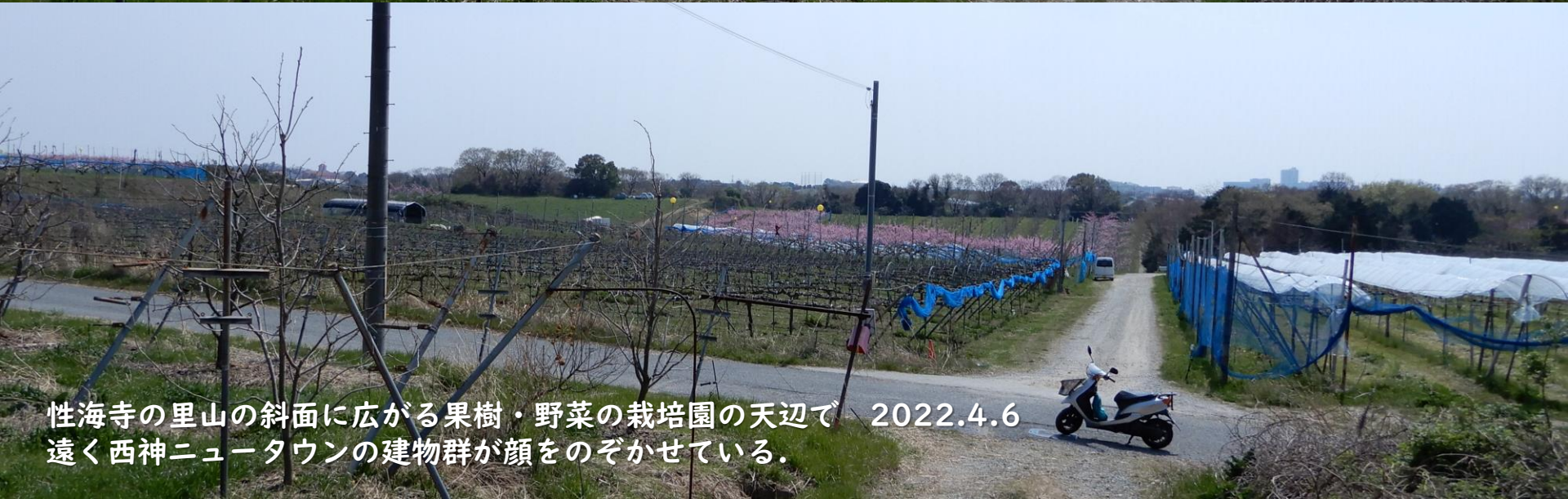
性海寺の里山の斜面に広がる果樹・野菜の栽培園の天辺で 2022.4.6 遠く西神ニュータウンの建物群が顔をのぞかせている。