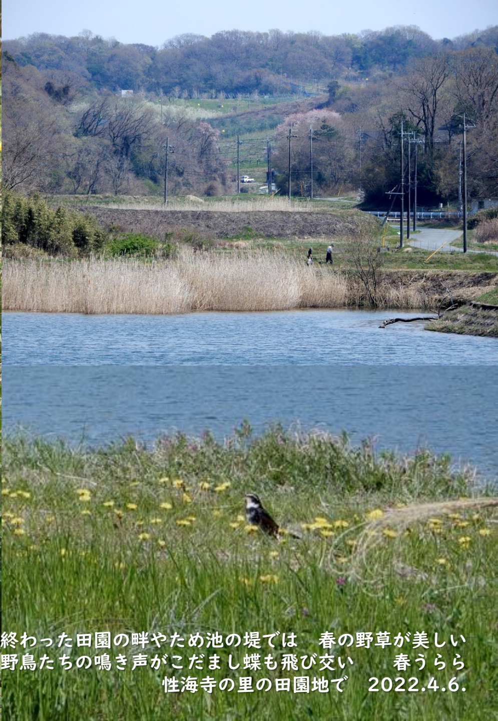
収穫の終わった田園の畔やため池の堤では 春の野草が美しい 野鳥たちの鳴き声がこだまし蝶も飛び交い 春うらら 性海寺の里の田園地で 2022.4.6.