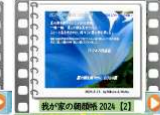
我が家の朝顔祭2024 [2] 我が家の朝顔祭2024 [2] 夏の朝を爽やかにしてくれる朝陽 我が家の朝顔祭2024 [2]