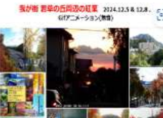
我が街 若草の丘周辺の紅葉 2024.12.9 & 12.8. 6分アニメーション(動画)