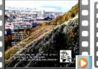
私の秋送り[2] 深まりゆく秋 野路菊の花満開の丘 秋の夕暮れ 2024.11.24. 逝った仲間を思い浮かべつつ 秋送り