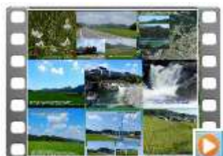
我が家の朝顔祭 朝陽が高くて、やっと朝夕は涼しくなっ てきて涼しい。みらね庭園 日曜朝陽の朝顔祭 2024.8.22.