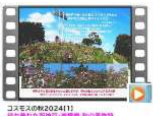
コスモスの秋2024[1] 緑々とした西神戸・高野朝 秋の風物詩 一面ピンクのコスモス畑を歩くと 神戸総合運動公園 コスモスの丘で 2024.10.20.