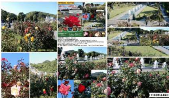
須磨離宮公園 秋のバラ 2024.11.3 Gifアニメーション 無音

https://infokkna2.com/ironroad2/GifAnime/R06IIRoseSumaI.gif