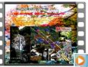
【神戸の秋2024】 2024.11.15. 紅葉し始めた赤引の滝 滝道Walk 紅葉し始めた赤引の滝 滝道を登って 布引ダムから市原へ 神戸紅葉Walk