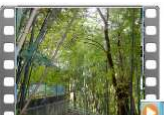
朝陽 大蔵神社境内から眺める高野山への散歩道 2024.8.25.