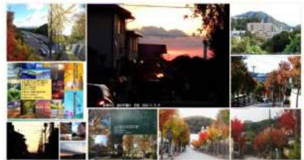
我が街 若草の丘周辺の紅葉 2024.12.5 & 12.8. Gifアニメーション(無音)

https://infokkna2.com/ironroad2/GifAnime/R06IIRoseSumaI.gif