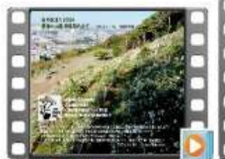
私の秋送り[1] 深まりゆく秋 11月中旬 野路菊が咲き出した横間山頂 遠く秋空を思い浮かべつつ秋送り 野路菊の丘で 2024.11.14.秋晴の午後