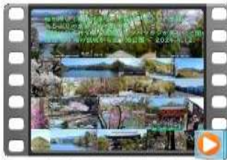
2024年東京都とミツバツの散歩道 .mp4