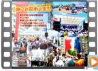
【録音】2024.5.11、5.12 第2回神戸新聞地音演奏 2024.5.11、5.12