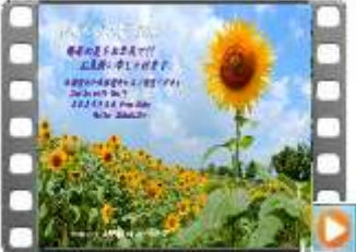
ひまわりの夏2024 到来 2024.7.19. 東播磨小野市ひまわりの丘