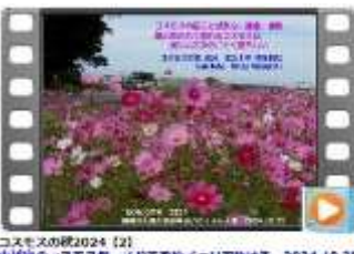
コスモスの秋2024 [2] 水鏡のコスモス畑 赤くて恋の赤い花で飾る 2024.10.25. 1.遊歩道の畔の田舎の朝陽大蔵神社境内のコスモス畑 2.高野朝陽の田舎の朝陽 高野朝陽のコスモス畑