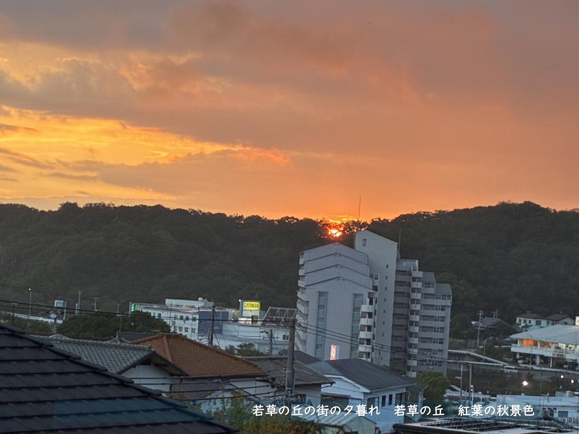
若草の丘の街の夕暮れ 若草の丘 紅葉の秋景色