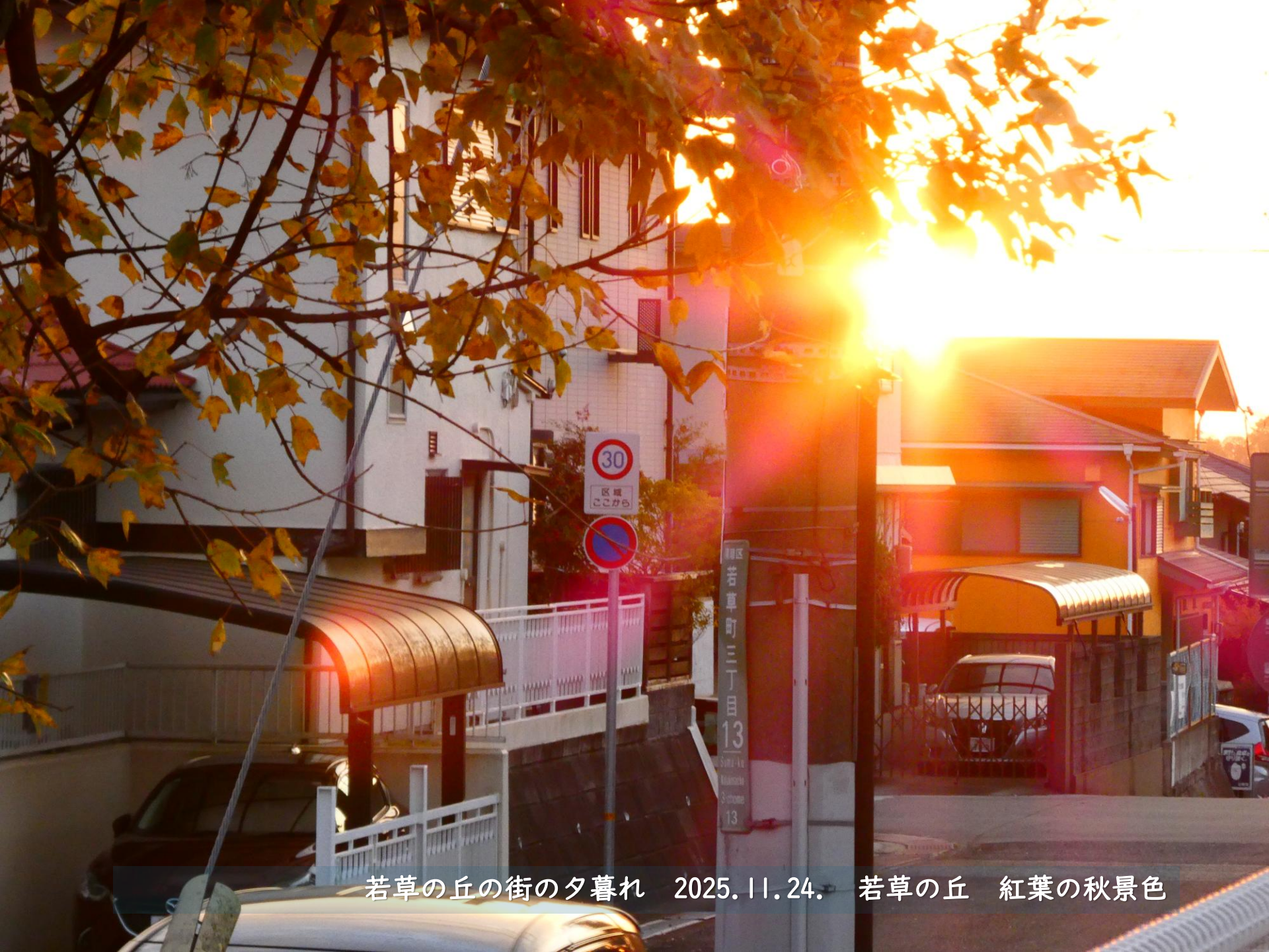
若草の丘の街の夕暮れ 2025.11.24. 若草の丘 紅葉の秋景色