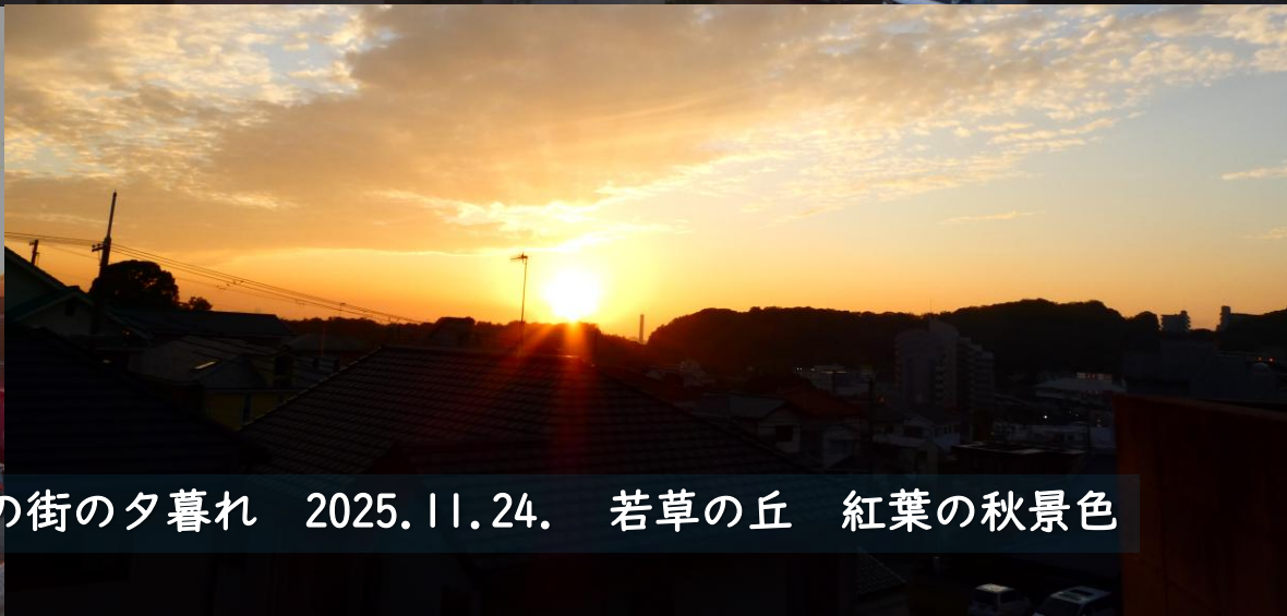
若草の丘の街の夕暮れ 2025.11.24. 若草の丘 紅葉の秋景色