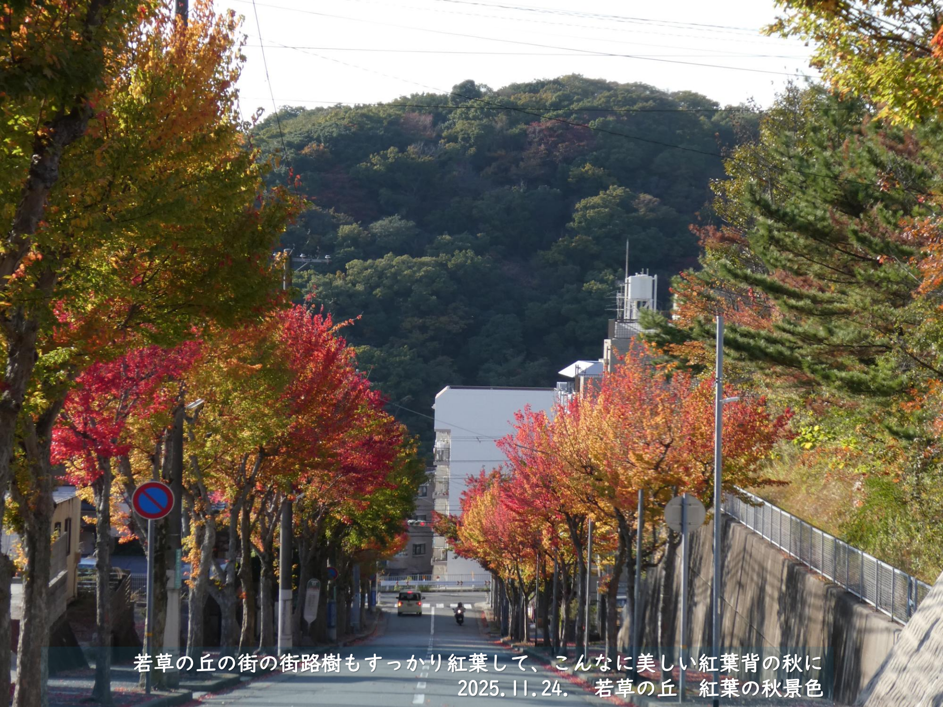
若草の丘の街の街路樹もすっかり紅葉して、こんなに美しい紅葉背の秋に 2025.11.24. 若草の丘 紅葉の秋景色