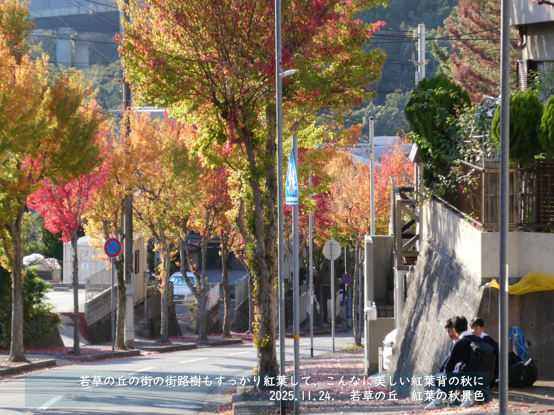
若草の丘の街の街路樹もすっかり紅葉して、こんなに美しい紅葉背の秋に 2025.11.24. 若草の丘 紅葉の秋景色