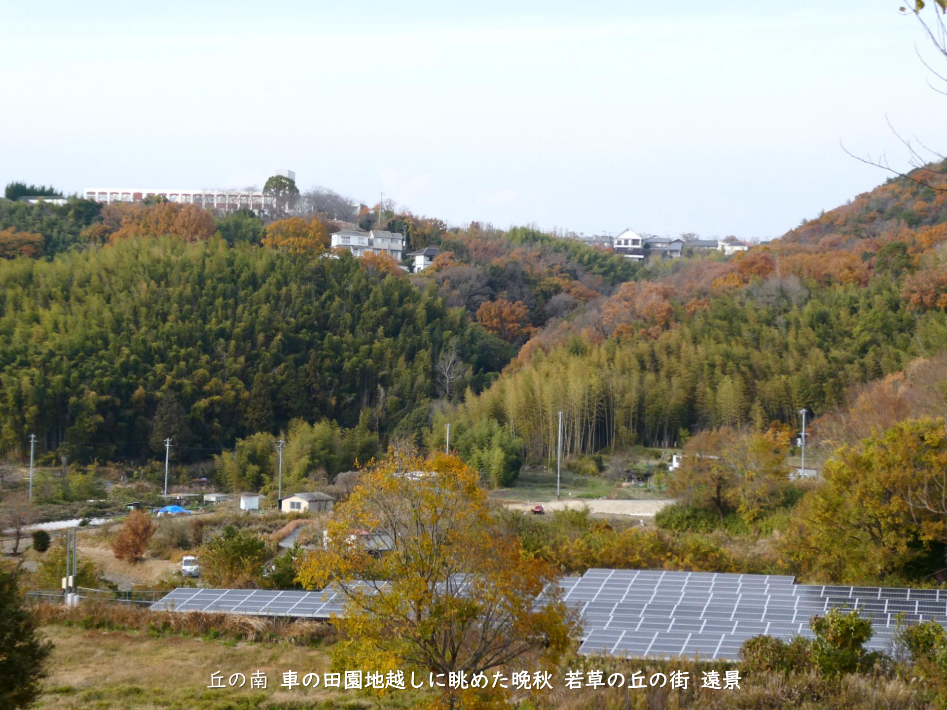
丘の南 車の田園地越しに眺めた晩秋 若草の丘の街 遠景