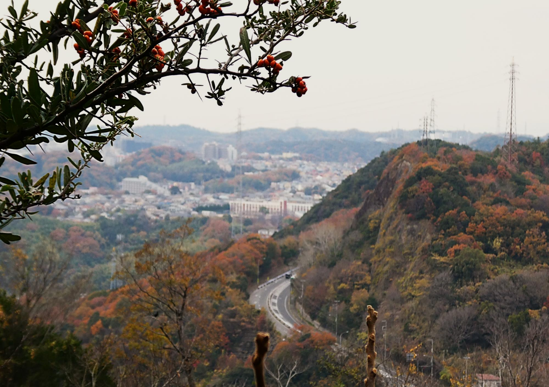
高取山中腹 飛竜寺参道から 右手鶴越の尾根越しに眺めた晩秋の若草の丘の街並 2025. 12. 8.