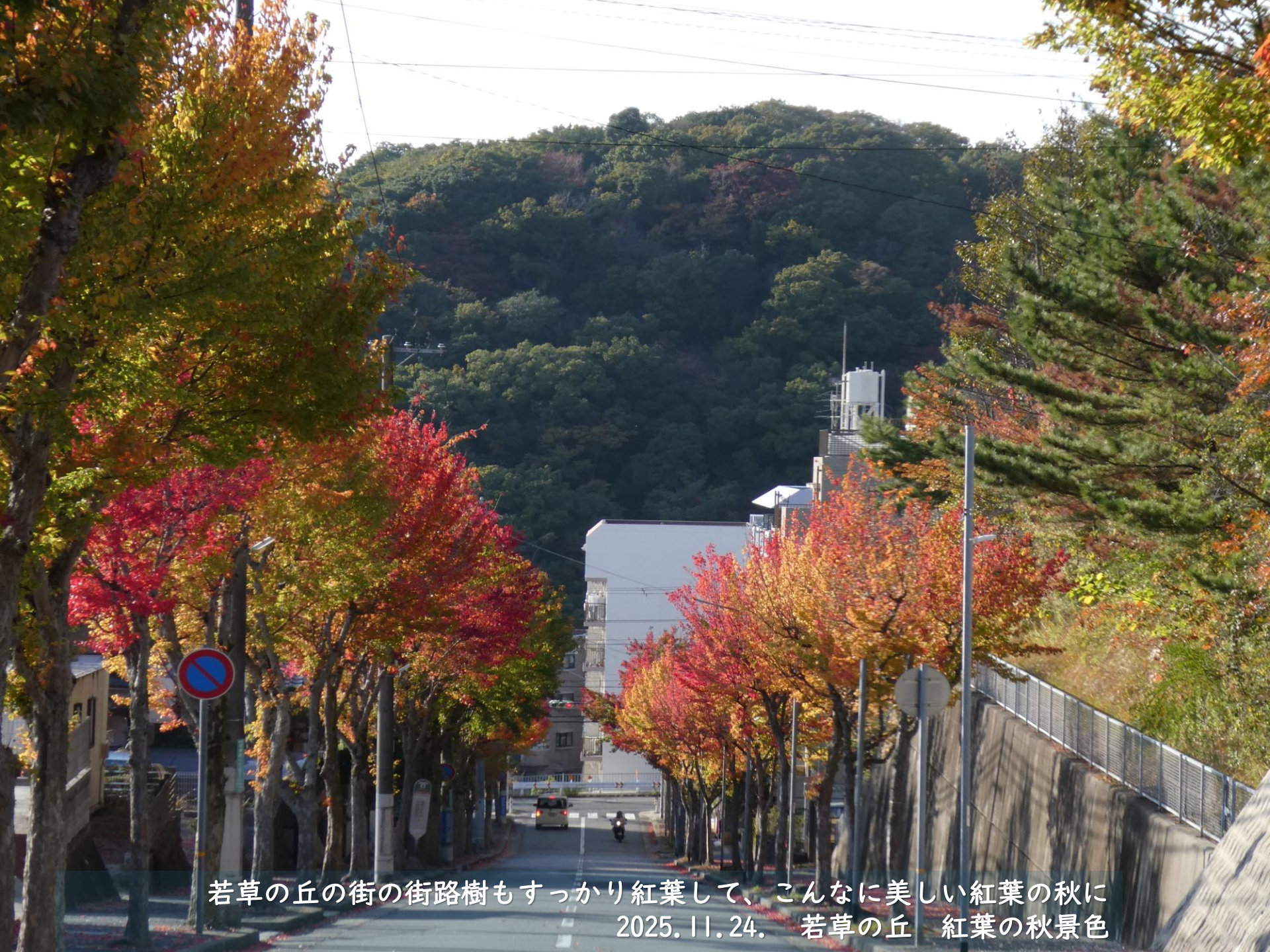
若草の丘の街の街路樹もすっかり紅葉して、こんなに美しい紅葉の秋に 2025.11.24. 若草の丘 紅葉の秋景色