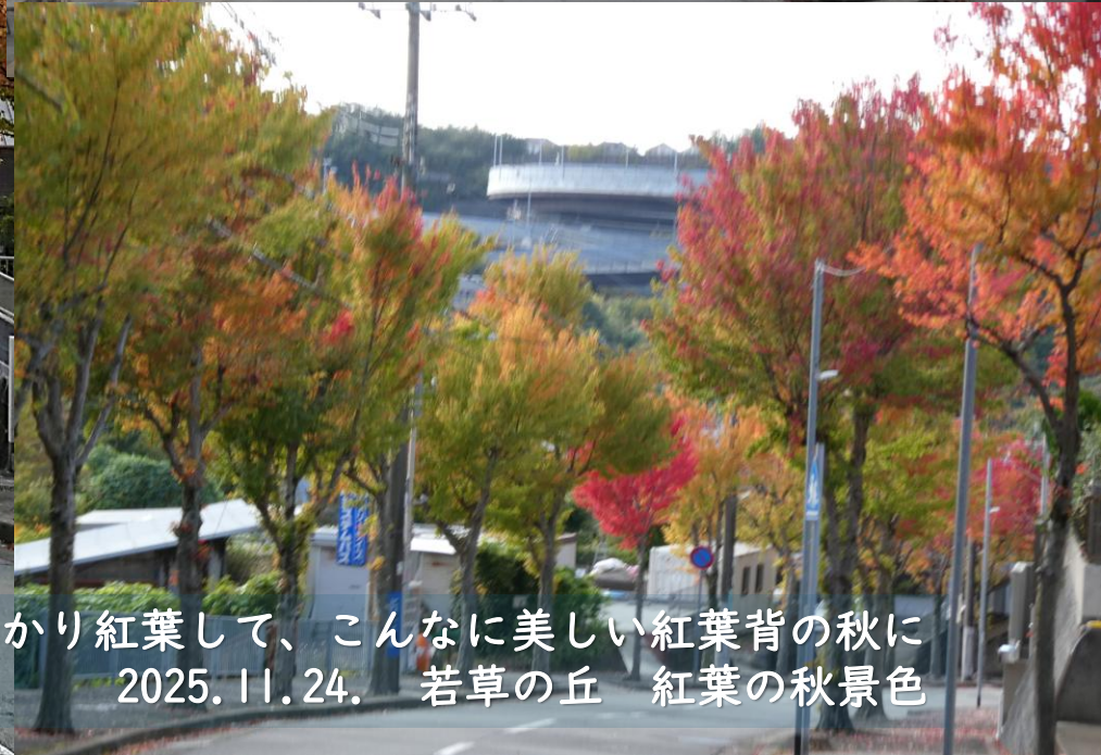
若草の丘の街の街路樹もすっかり紅葉して、こんなに美しい紅葉背の秋に 2025.11.24. 若草の丘 紅葉の秋景色