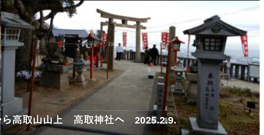
飛龍寺口から高取山山上 高取神社へ 2025.2.9.