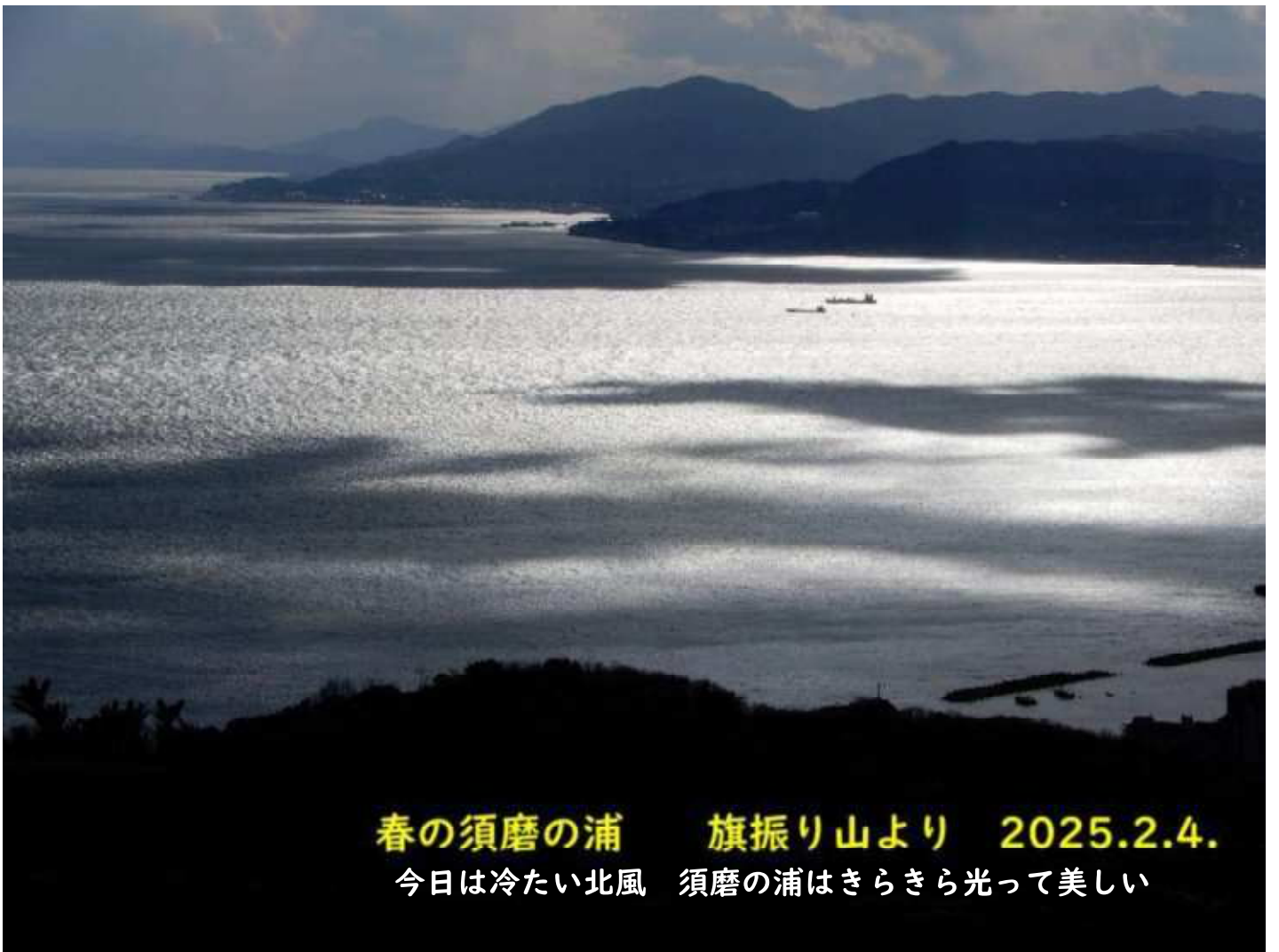
春の須磨の浦 旗振り山より 2025.2.4. 今日は冷たい北風 須磨の浦はきらきら光って美しい