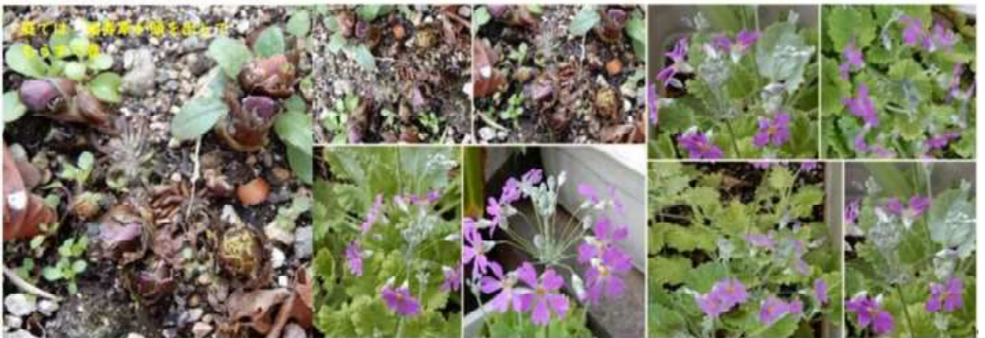
日本列島を襲った寒波もやっと収まって、庭では、福寿草が頭をもたげ、 ピンクのサクラソウが咲き始めています 2025.2.12.