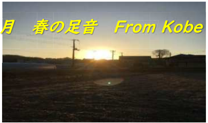
春の足音が聞こえる冬の朝