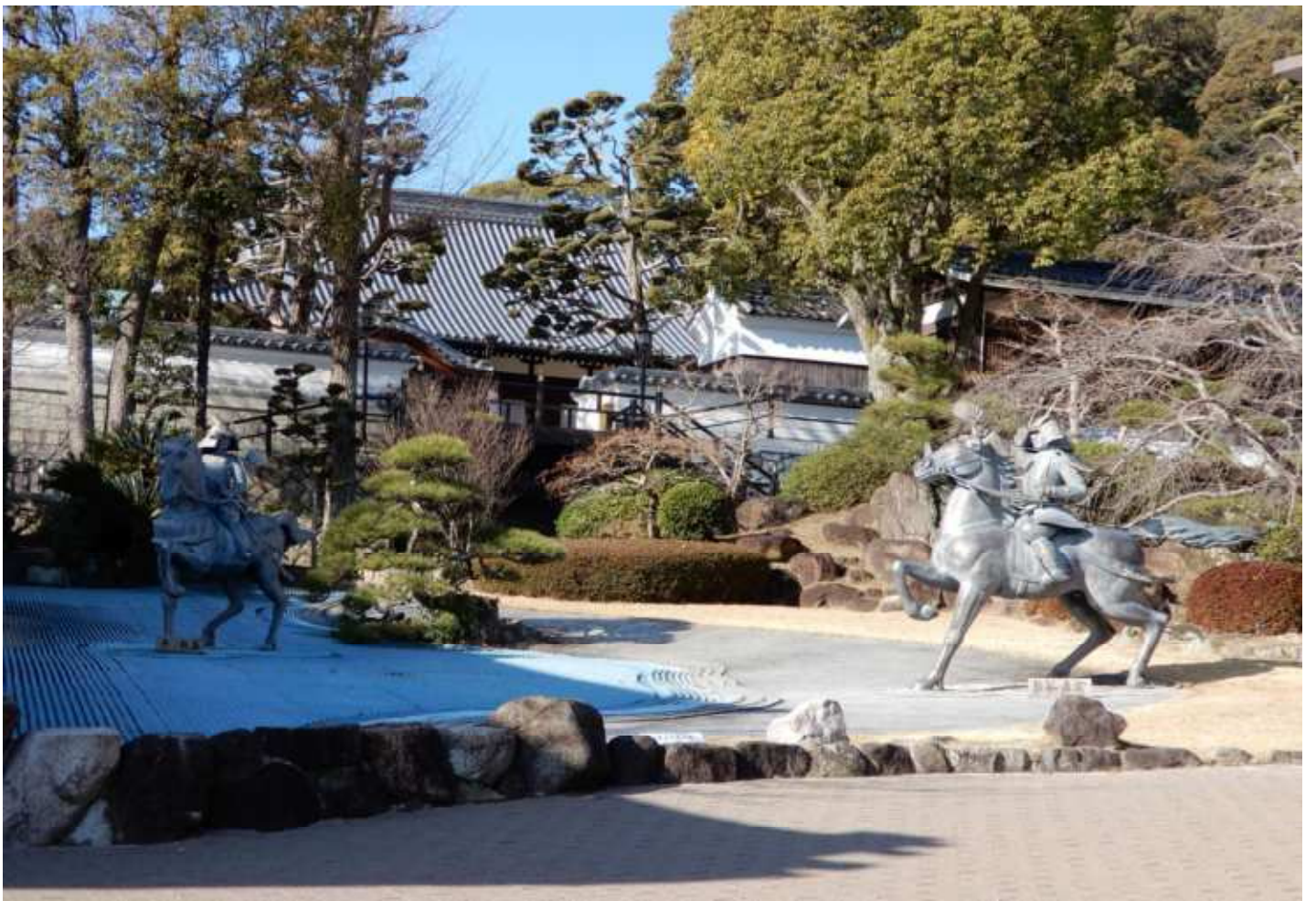
2025.2.20. 須磨寺源平の庭 孫には弘法市参道で敦盛だんごを忘れずに