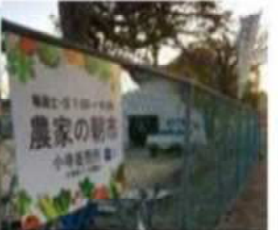
日曜日の早朝 夜明けの太陽まぶしい伊川谷小寺の里 里の田園には霜が降りて 手がかじかむ 毎日曜日家内が野菜調達に出かける小寺の里の農家が開く朝市へ 久しぶりに家内の手助け 我が家の野菜の収穫庫 物価高の今 みんな顔なじみで 朝市前の会話も楽しみという