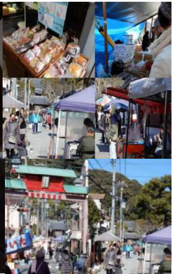
2025.2.20. 須磨寺の月例「弘法市」へ 地域でその呼び名は「弘法さん」・「お大師さん」 今日のお目当て 孫の好きな須磨焼き海苔・干物 長らく世話になった”柚子絞り”の出店は 高齢になられ、直接送ってもらうことに 弘法市もどんどん変わっています