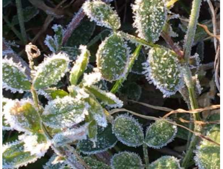
2025.2.9. 手がかじかむ早朝の朝 目を凝らすとあちこちに霜柱 伊川谷小寺の里で