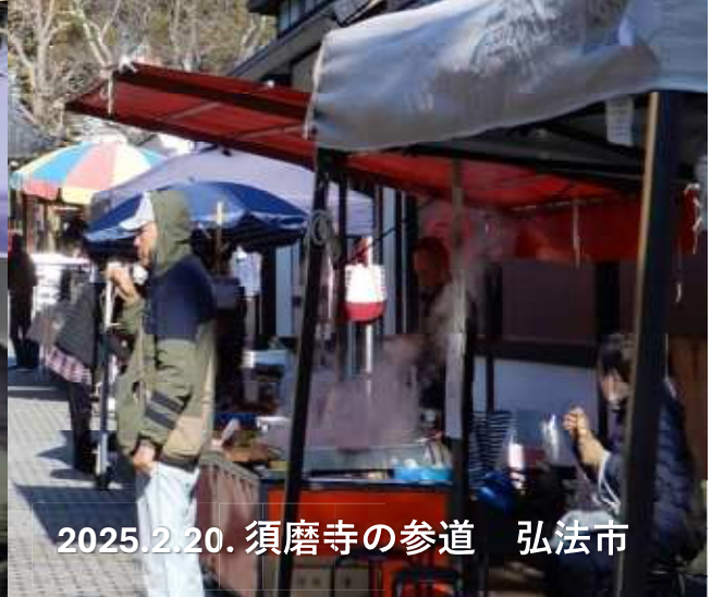
2025.2.20. 須磨寺の参道 弘法市