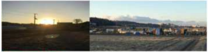
2025.2.9. 早稲田川 小寺の庭で