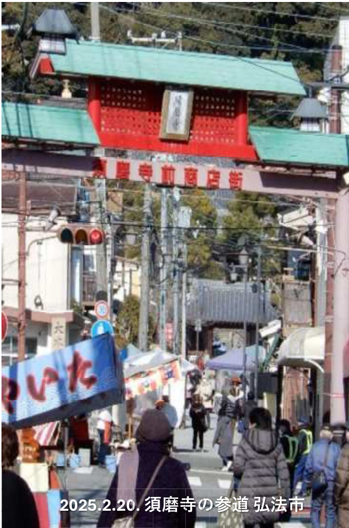
2025.2.20. 須磨寺の参道 弘法市