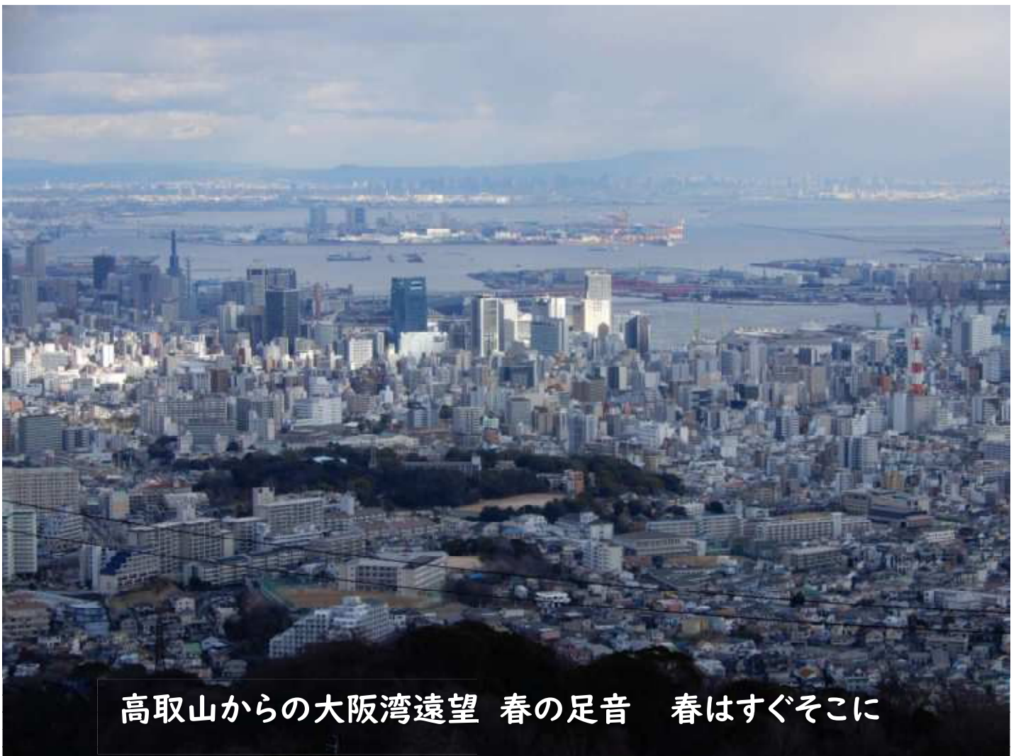
高取山からの大阪湾遠望 春の足音 春はすぐそこに