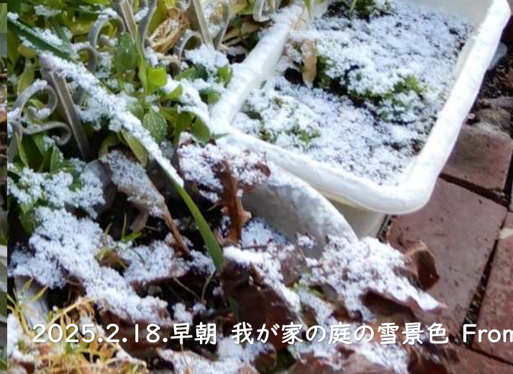
2025.2.18.早朝 我が家の庭の雪景色 From