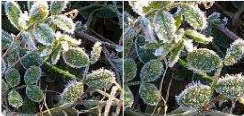
2025.2.9. 手がかじかむ早朝の朝 目を凝らすとあちこちに霜柱 伊川谷小寺の里で