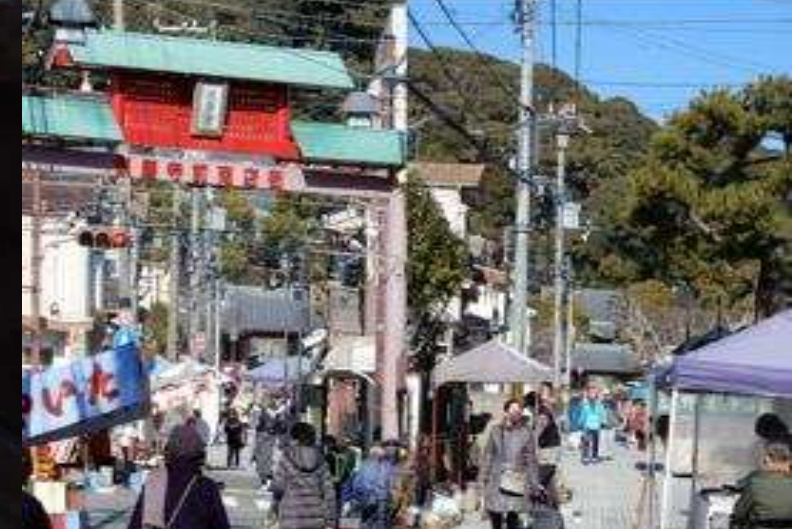
2025.2.20. 須磨寺の月例「弘法市」へ 地域での呼び名は「弘法さん」・「お大師さん」 今日のお目当て 孫の好きな須磨焼き海苔・干物 長らく世話になった”柚子絞り”の出店は 高齢になられ、直接送ってもらうことに 弘法市もどんどん変わっています