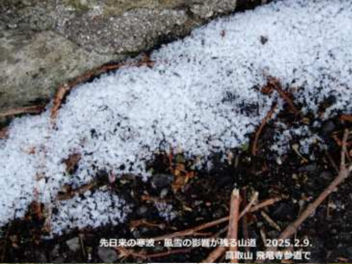
先日来の豪波・風雪の影響が残る山道 2025.2.9. 高取山 飛竜寺参道で