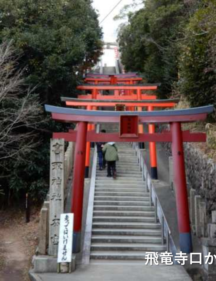
飛竜寺口から高取山山上 高取神社へ 2025.2.9.