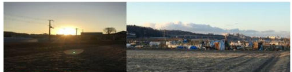
2025.2.9. 早朝伊川谷 小寺の屋で

節分・立春が過ぎても、目まぐるしく変わる天候 冷たい風に寒いい日が続く時節 でも春の足音 もうすぐ春