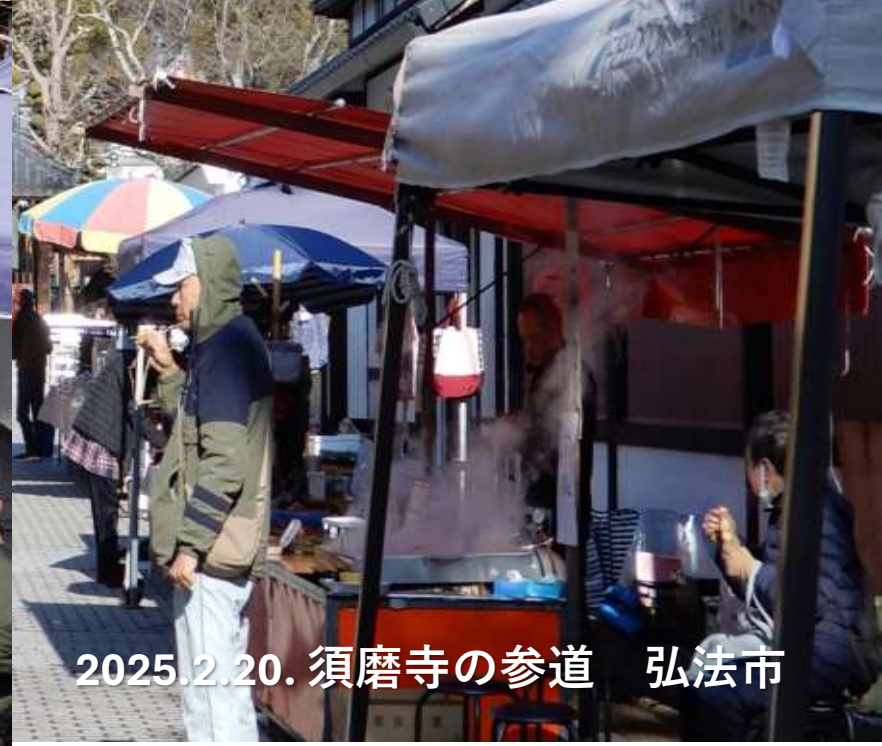
2025.2.20. 須磨寺の参道 弘法市