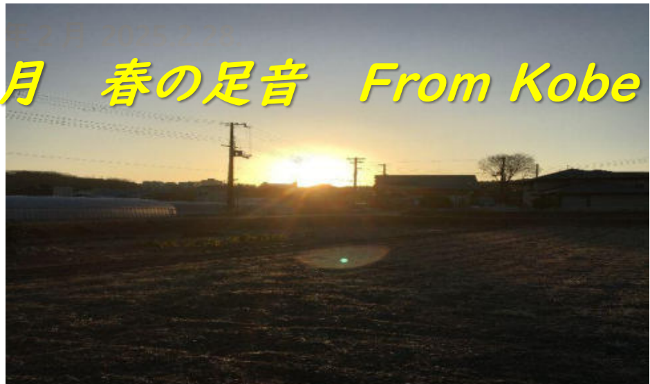
春の足音か聞こえる冬の朝