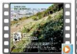
私の秋祭り[1] 深まりゆく秋 11月中旬 野路菊が咲き出した備前山麓 遠く秋空を思い浮かべつつ秋祭り 野路菊の丘で 2024.11.14. 秋晴の午後