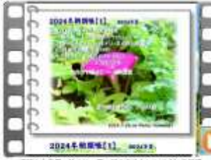
2024年朝顔祭り 2024.8. 通園な本夏の朝顔祭り 夏の朝を爽やかにしてくれる朝顔 2024年7月14日~7月24日の日程