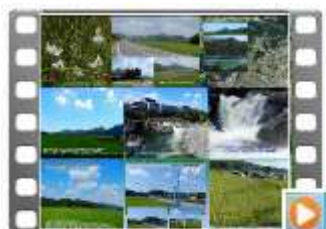
我が家へ 朝顔を育てて、わっと夏夕は涼しくなって 夕で涼しい、みらね庭園 日曜朝顔の季節 2024.8.22.