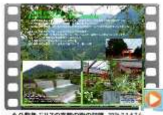
6月8日 江戸の京都の街の記憶 2024.7.1 & 7.4. 上野茂村野埋堀 & 北野名物 長五郎刺 夏川原介書「スピノザの刺殺案」