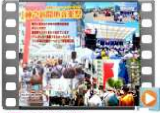
【開催地】神戸市中央区 2024年 2024.5.11. & 5.12. 第2回神戸新聞地蔵音楽祭