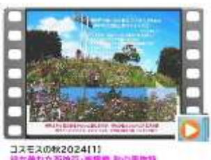
コスモスの秋2024[1] 緑を染めた西神戸・美原の 秋の風景詩 一面ピンクのコスモス畑を歩くと 神戸総合運動公園 コスモスの丘で 2024.10.20.