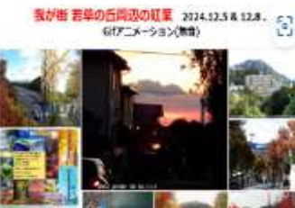
我が街 若草の丘周辺の紅葉 2024.12.9 & 12.8. 6分アニメーション(動画)