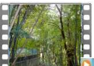
朝顔 大蔵神社境内から眺める高野山への散歩道 2024.1.25.