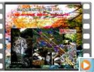
【神戸の秋2024】 2024.11.15. 紅葉しはじめた赤引の滝 滝道Walk 紅葉し始めた赤引の滝 滝道を登って 布引ダムから市原へ 神戸紅葉Walk