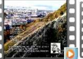
私の秋祭り[2] 深まりゆく秋 野路菊の花満開の丘 秋の夕暮れ 2024.11.24. 逝った仲間を思い浮かべつつ 秋祭り