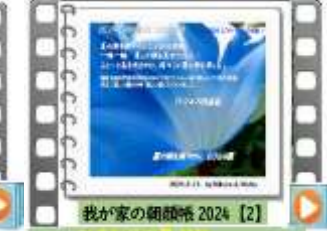
我が家の朝顔祭2024 [2] 夏の朝を爽やかにしてくれる朝顔 我が家の朝顔祭2024 [2]