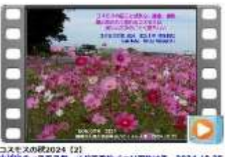
コスモスの秋2024 [2] 水鏡のコスモス畑 赤くて恋の赤い花で染まる 2024.10.25. 1.遊園地内の川原野原美原大蔵神社のコスモス畑 2.遊園地の川原野原 美原の丘のコスモス畑