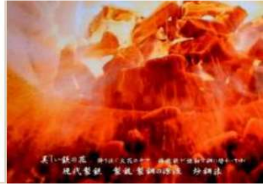
美しい鉄の花 赤い鉄の花の心 赤い鉄の花の心 赤い鉄の花の心 現代鉄鋼 愛読家鉄鋼の歴史 鉄鋼史

和鉄の道・Iron Road 概要追記 From Kobe Mutsu Nakanishi