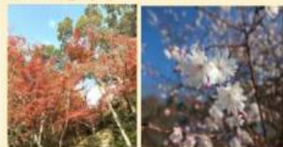
紅葉 ジュウガツザクラ