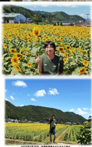
2025年7月28日 佐用町東徳久のひまわり畑で