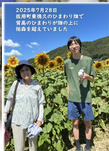
2025年7月28日 佐用町東徳久のひまわり畑で 背高のひまわりが畑の上に 祐森を超えていました

帰路は相生の港が見たくなって、まっすぐ南へ山越えの道テクノライン 放射光施設のある播磨科学公園都市「光都」を抜けて相生へ