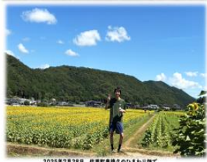
2025年7月28日 佐用町東徳久のひまわり畑で