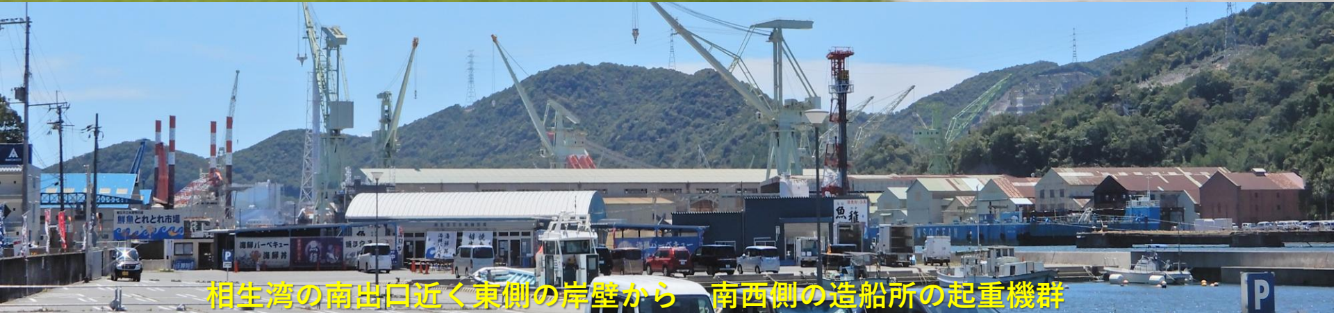
相生湾の南出口近く東側の岸壁から 南西側の造船所の起重機群