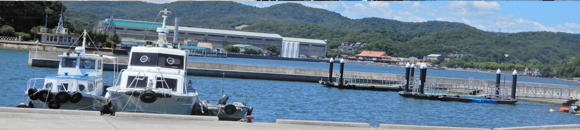
相生湾の南出口近く東側の岸壁から 北の狭い湾内 白竜城が見える