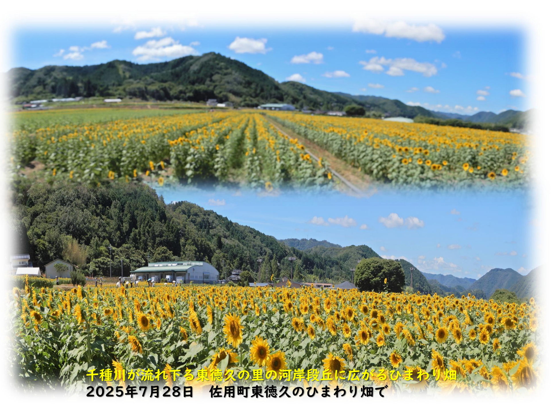
千種川が流れ下る東徳久の里の河岸段丘に広がるひまわり畑 2025年7月28日 佐用町東徳久のひまわり畑で