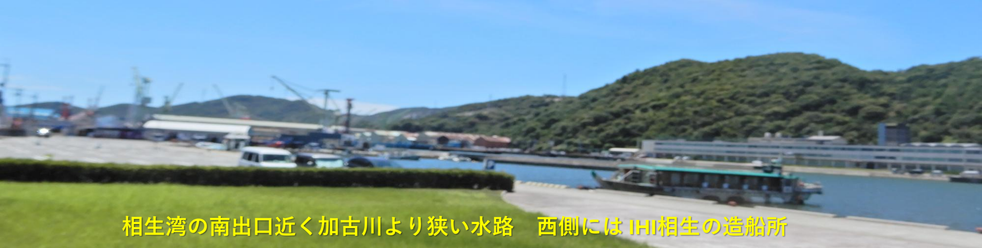
相生湾の南出口近く加古川より狭い水路 西側には IHI 相生の造船所