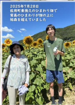
2025年7月28日 佐用町東徳久のひまわり畑で 背高のひまわりが畑の上に 祐森を超えていました