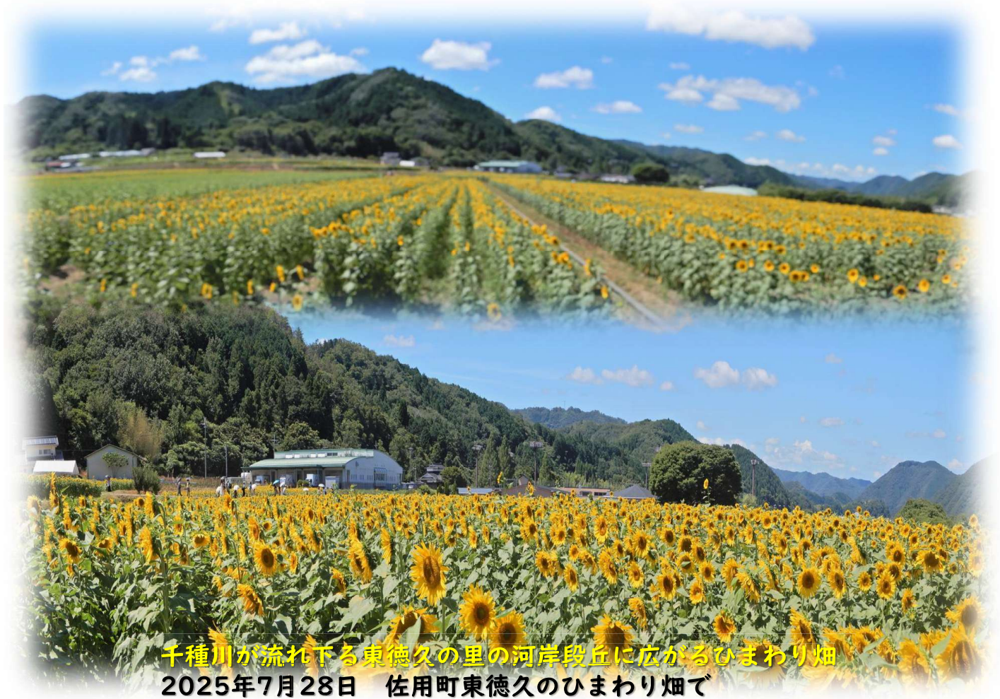
千種川が流れ下る東徳久の里の河岸段丘に広がるひまわり畑 2025年7月28日 佐用町東徳久のひまわり畑で