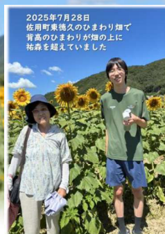
2025年7月28日 佐用町東徳久のひまわり畑で 背高のひまわりが畑の上に 柵森を超えていました