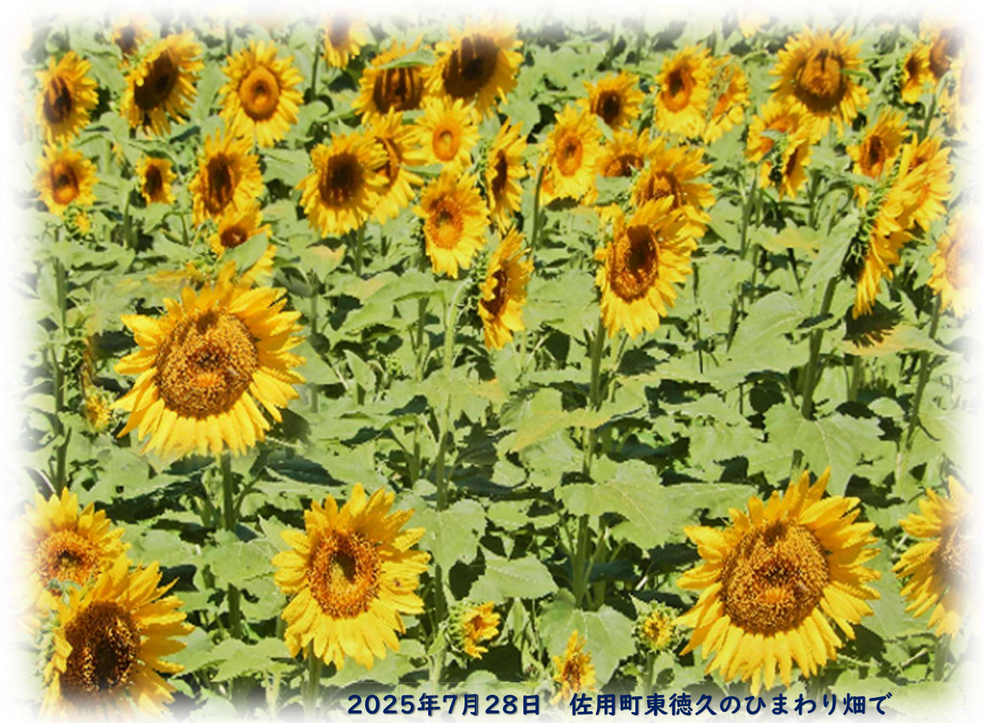
2025年7月28日 佐用町東徳久のひまわり畑で