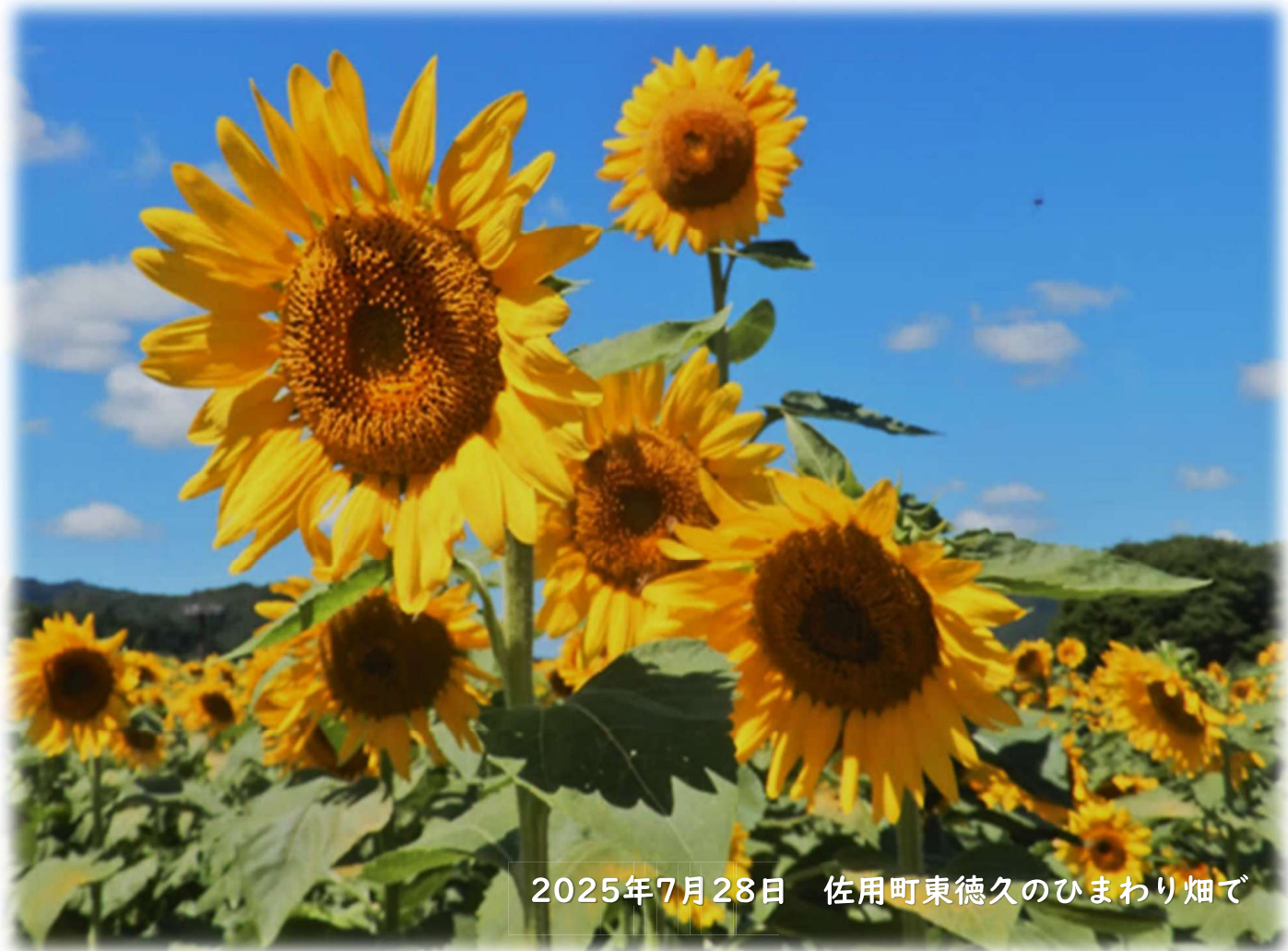
2025年7月28日 佐用町東徳久のひまわり畑で