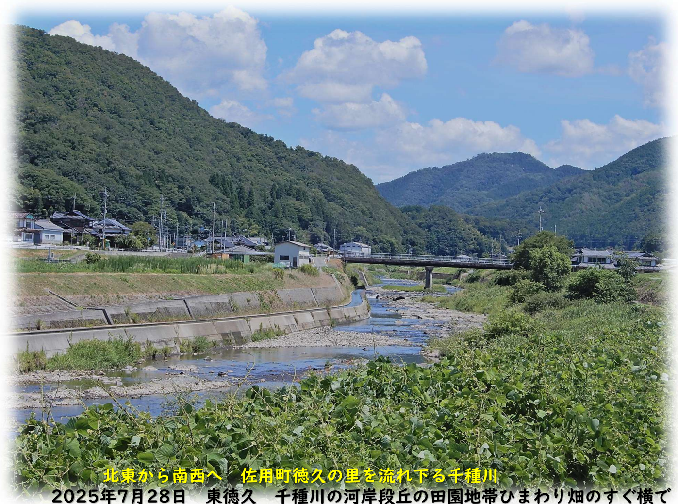
北東から南西へ 佐用町徳久の里を流れ下る千種川 2025年7月28日 東徳久 千種川の河岸段丘の田園地帯ひまわり畑のすぐ横で