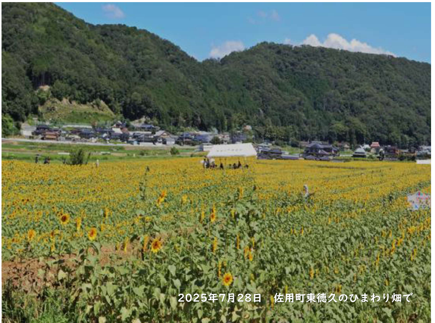
2025年7月28日 佐用町東徳久のひまわり畑で