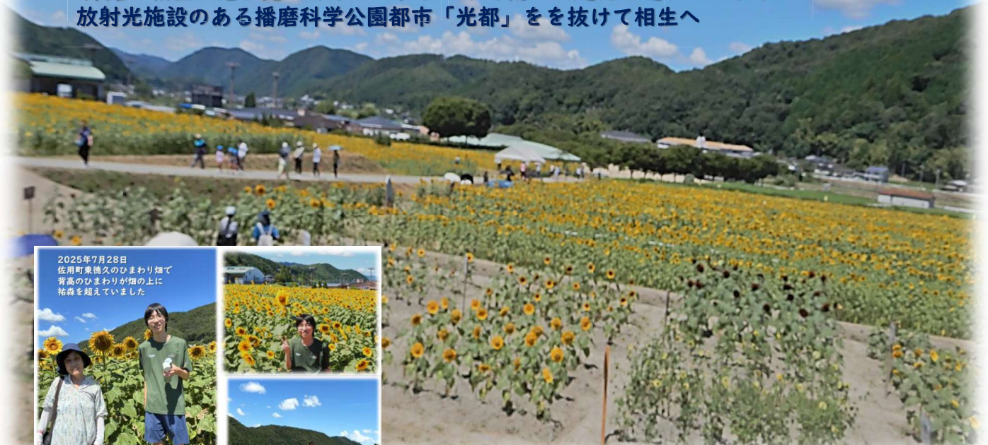
2025年7月28日 佐用町東徳久のひまわり畑で 背高のひまわりが畑の上に 祐森を超えていました

帰路は相生の港が見たくなって、まっすぐ南へ山越えの道テクノライン 放射光施設のある播磨科学公園都市「光都」を抜けて相生へ