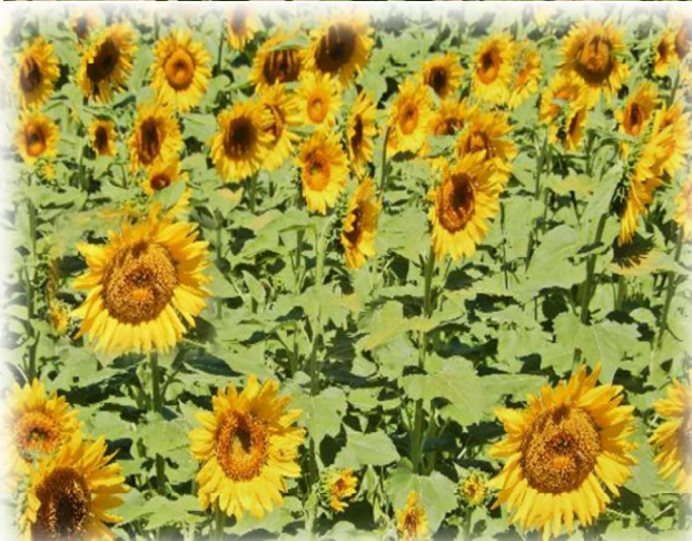
うれしい夏の風物詩 佐用 数々のひまわりとの出会い 2025.7.28 元気を貰って この酷暑を乗り切らねばと…