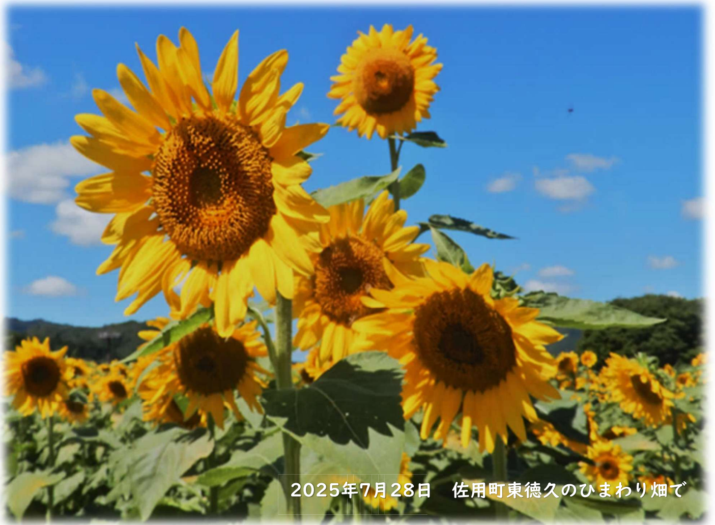
2025年7月28日 佐用町東徳久のひまわり畑で