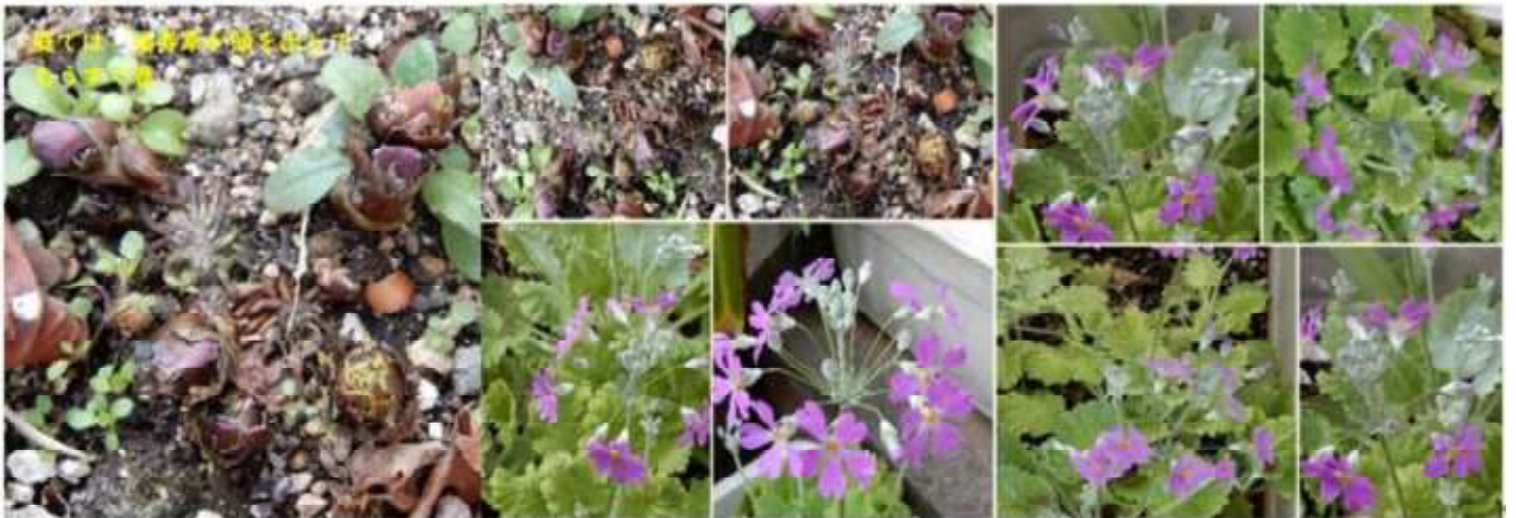
日本列島を襲った寒波もやっと収まって、庭では、福寿草が頭をもたげ、 ピンクのサクラソウが咲き始めています 2025.2.12.