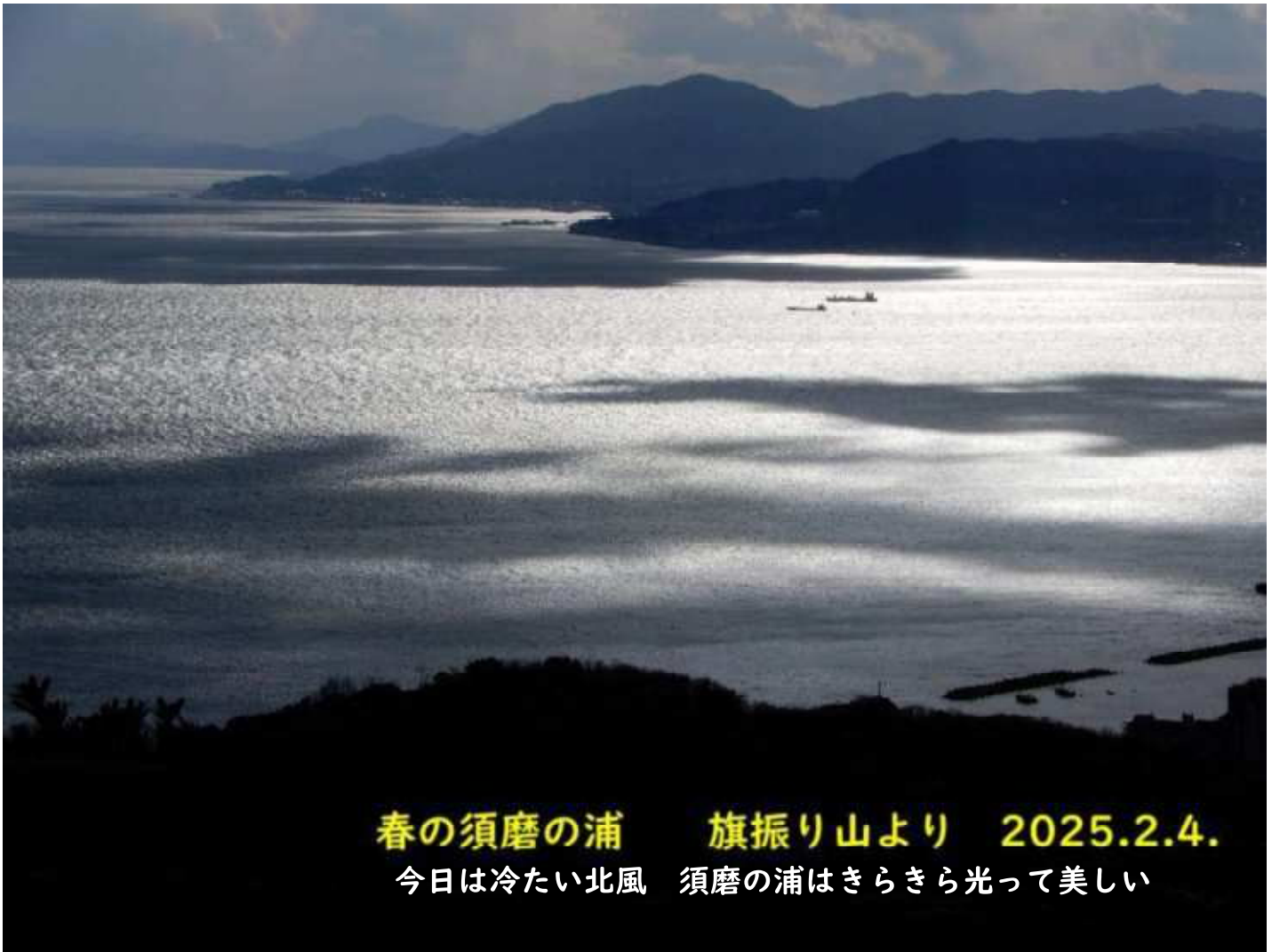
春の須磨の浦 旗振り山より 2025.2.4. 今日は冷たい北風 須磨の浦はきらきら光って美しい