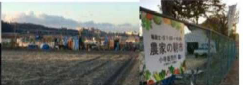
日曜日の早朝 夜明けの太陽まぶしい伊川谷小寺の里 里の田園には霜が降りて 手がかじかむ 毎日曜日家内が野菜調達に出かける小寺の里の農家が開く朝市へ 久しぶりに家内の手助け 我が家の野菜の収穫庫 物価高の今 みんな顔なじみで 朝市前の会話も楽しみという