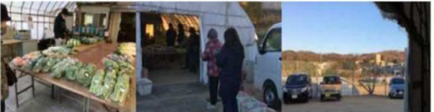
始まる前に一列に並んで、まず、おのおの一品づつ籠にいれ、それから始まるのが流儀という。街の大きな朝市と違い、 近郊農業の里 それぞれの農家持ち寄り運営の朝市 会話も弾む和やかな朝の始まりです