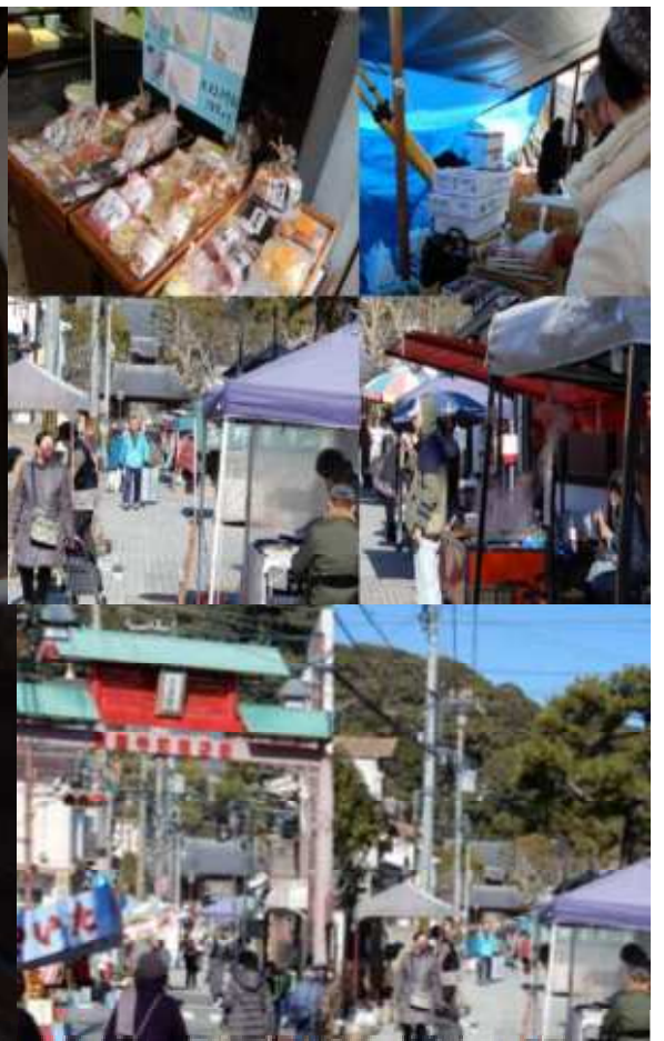
2025.2.20. 須磨寺の月例「弘法市」へ 地域でその呼び名は「弘法さん」・「お大師さん」 今日のお目当て 孫の好きな須磨焼き海苔・干物 長らく世話になった”柚子絞り”の出店は 高齢になられ、直接送ってもらうことに 弘法市もどんどん変わっています