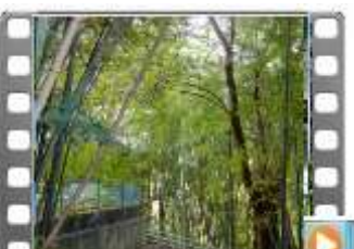
朝陽 大蔵神社境内から眺める高野山への散歩道 2024.12.5.