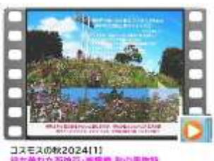
コスモスの秋2024[1] 緑を染めた西神戸・美意識 秋の風物詩 一面ピンクのコスモス畑を歩くと 神戸総合運動公園 コスモスの丘で 2024.10.20.