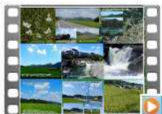
我が家の朝顔祭 朝顔が盛って、やっと朝夕は涼しくなっ てきて涼しい。みらね庭園 日曜朝陽の朝顔祭 2024.8.22.