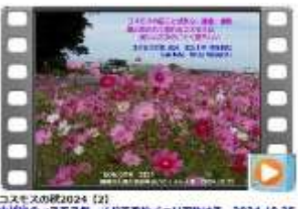
コスモスの秋2024 [2] 水鏡のコスモス畑 赤くて恋の赤い花で染まる 2024.10.25. 1.遊歩道の畔の田舎の朝陽大蔵神社境内のコスモス畑 2.田舎の朝陽の田舎の朝陽 遠方の朝陽のコスモス畑