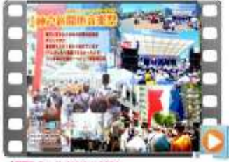
【開催地】神戸市中央区 2024年 2024.5.11. & 5.12. 第2回神戸新聞地音楽祭