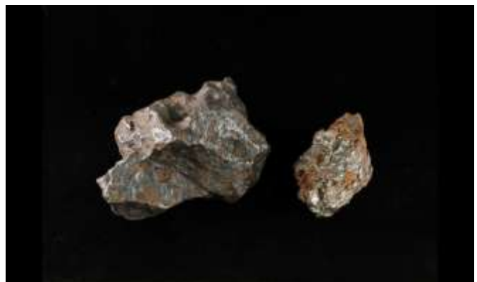
宇宙の産物・隕鉄（鉄を多く含む隕石・愛媛大学 AIC 所蔵）

そしてできあがった隕鉄製鉄器の形・色・模様を実感し、多くの皆様と共有することも、大きな目的としています。