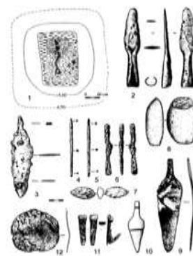
ポリショイ・ボルディレフスキー古墳で発見された隕鉄製鉄器（6,11,12）と銅器・石器

そして、世界最古級の鉄器をモデルに復元品を鍛造するうえでなくてはならない存在が、伝統的な技術を継承した鍛冶