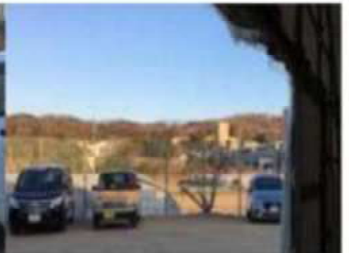
始まる前に一列に並んで、まず、おのおの一品づつ籠にいれ、それから始まるのが流儀という。街の大きな朝市と違い、近郊農業の里 それぞれの農家持ち寄り運営の朝市 会話も弾む和やかな朝の始まりです