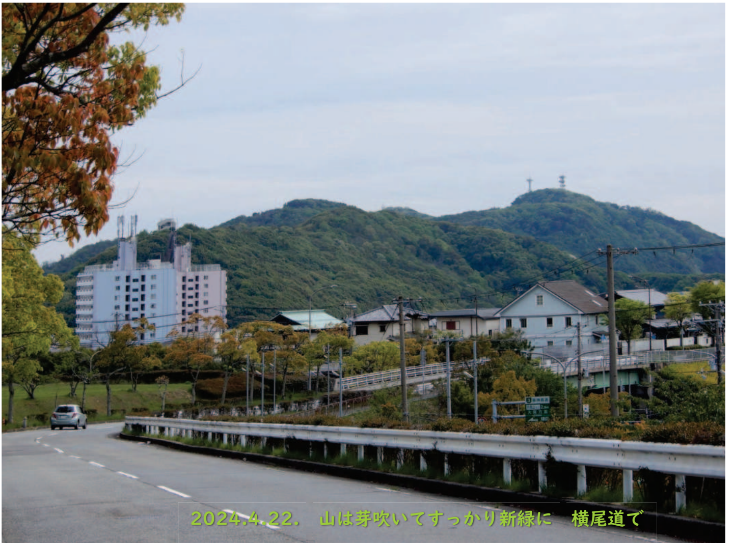
2024.4.22. 山は芽吹いてすっかり新緑に 横尾道で