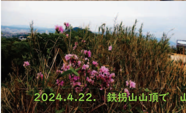
2024.4.22. 鉄拐山山頂で 山頂にツツジが咲き残っていました