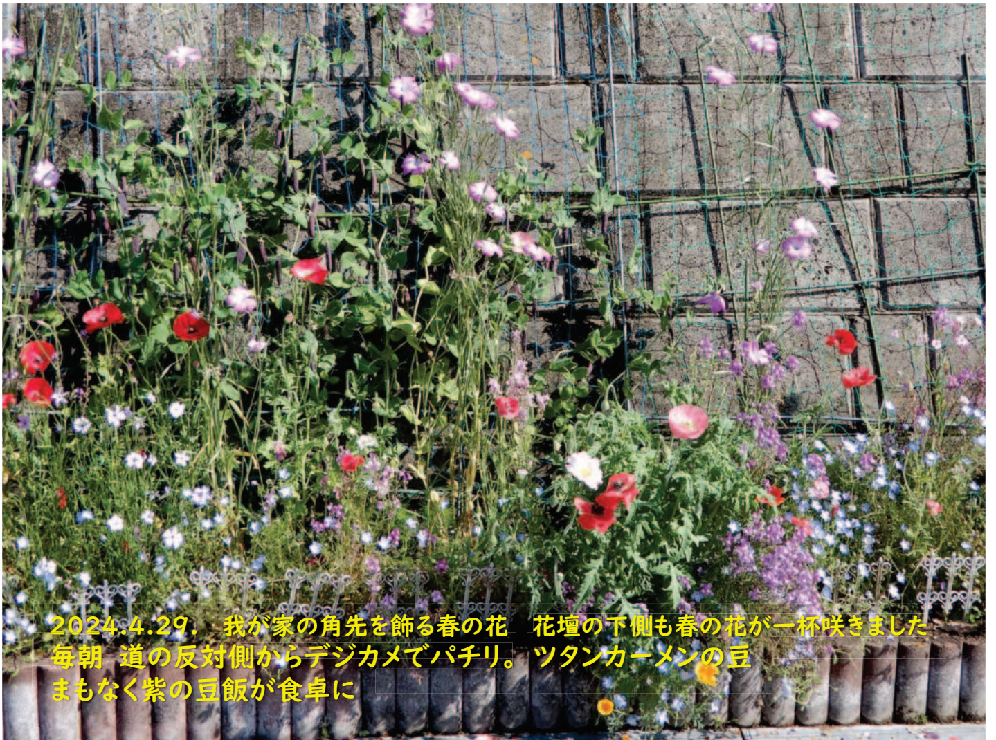
2024.4.29. 我が家の角先を飾る春の花 花壇の下側も春の花が一杯咲きました 毎朝 道の反対側からデジカメでパチリ。ツタンカーメンの豆 まもなく紫の豆飯が食卓に