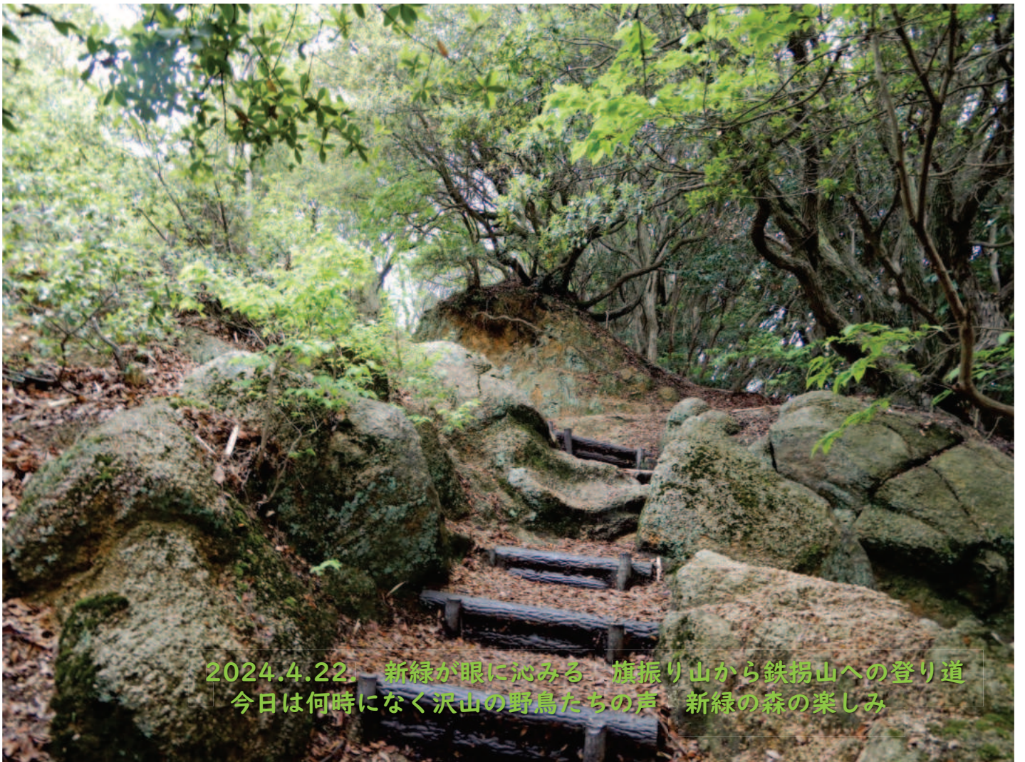
2024.4.22. 新緑が眼に沁みる。旗振り山から鉄拐山への登り道 今日は何時になく沢山の野鳥たちの声。新緑の森の楽しみ