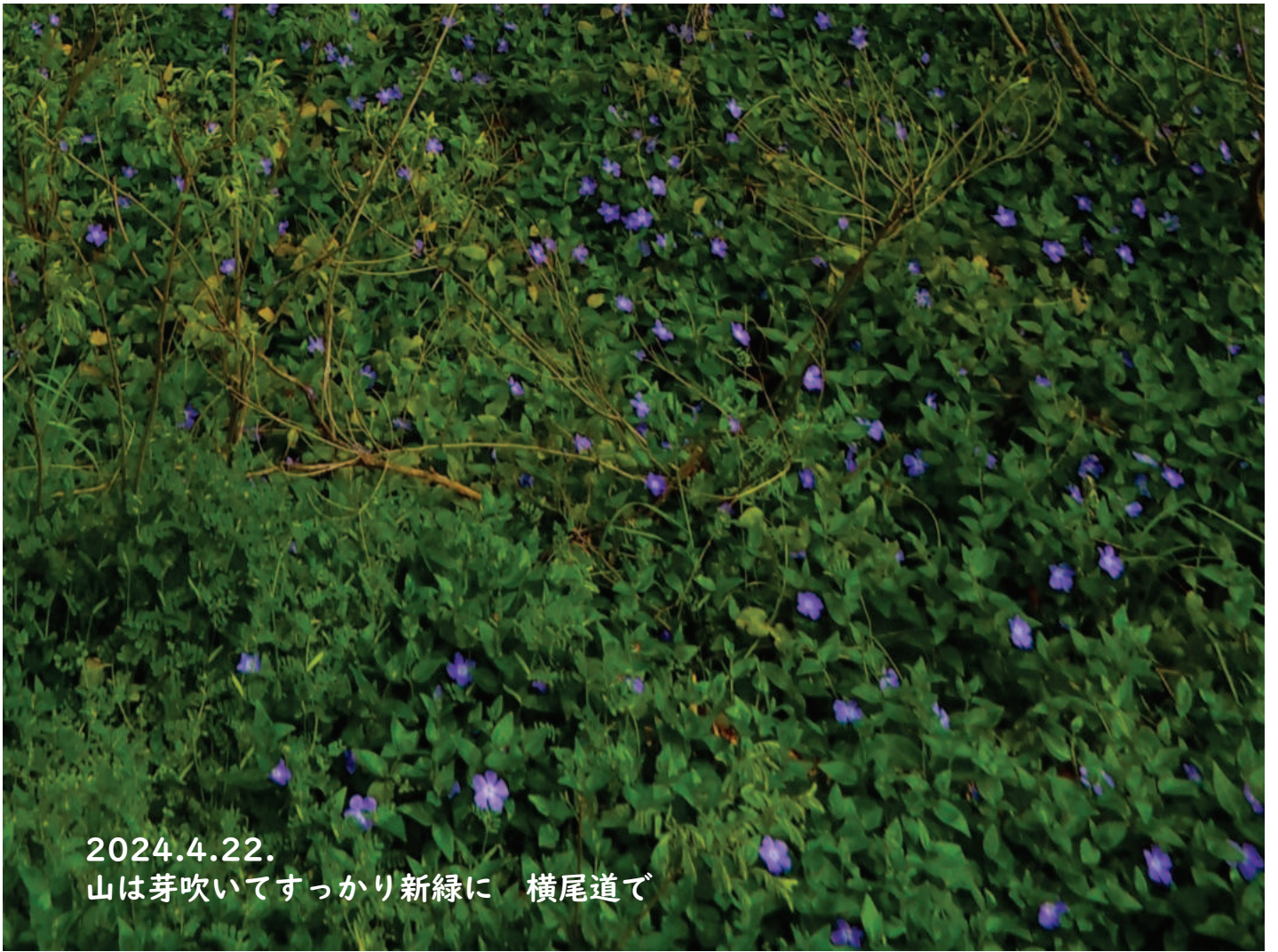
2024.4.22. 山は芽吹いてすっかり新緑に 横尾道で