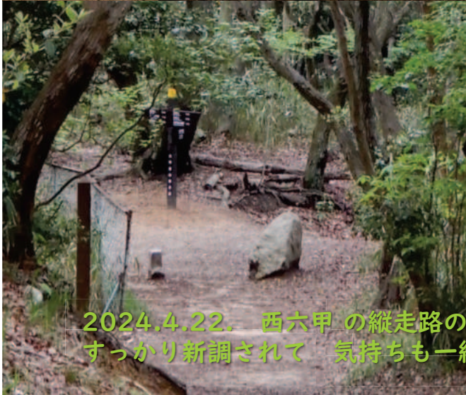
2024.4.22. 西六甲の縦走路の案内板・道標 すっかり新調されて 気持ちも一緒にリフレッシュ