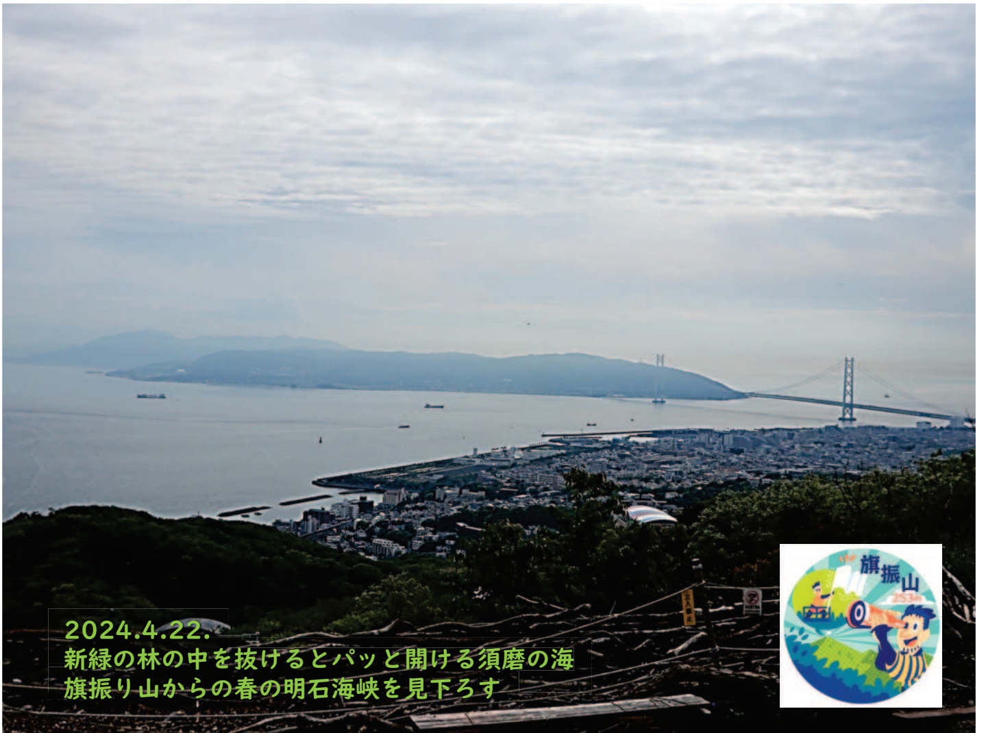
2024.4.22. 新緑の林の中を抜けるとパッと開ける須磨の海 旗振り山からの春の明石海峡を見下ろす