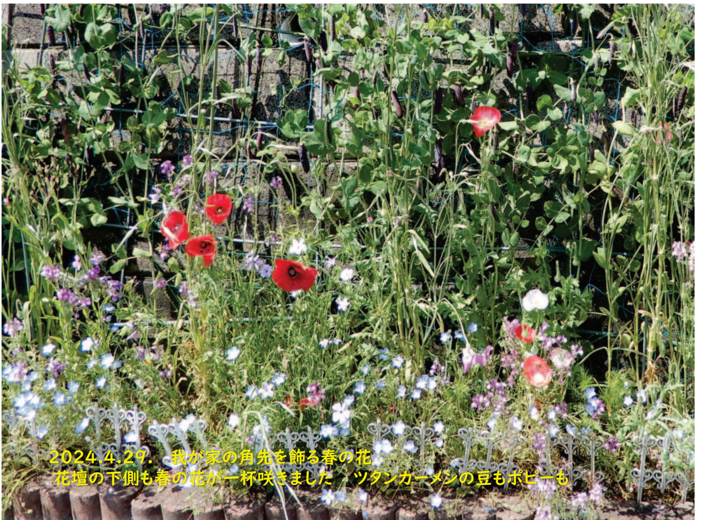
2024.4.29. 我が家の角先を飾る春の花 花壇の下側も春の花が一杯咲きました ツタンカーメンの豆もポピーも