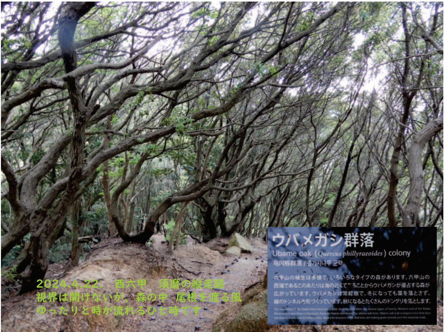
2024.4.22. 西六甲 須磨の縦走路 視界は開けないが、森の中 尾根を渡る風 ゆったりと時が流れるひと時です

ウバメガシ群落 Urame oak ( Quercus phillyraeoides ) colony 烏岡栎群落 / 줄기시나무 군락 六甲山の植生は多様で、いろいろなタイプの森があります。六甲山の西端であるこのあたりは海の近くであることからウバメガシが優占する森が広がっています。ウバメガシは常緑樹で、冬になっても葉を落とさず、緑のトンネルを形づくっています。秋になるとたくさんのドングリを落とします。 The vegetation of the Rokko Mountains has a wide diversity, and there are various types of forests. Western end of the Rokko Mountains is very close to the ocean, there are forests dominated by urame oak trees. Urame oak is an evergreen tree that does not lose its leaves even in winter. Also, drops a lot of acorns in fall. And trees are making green tunnels over the mountain trails.