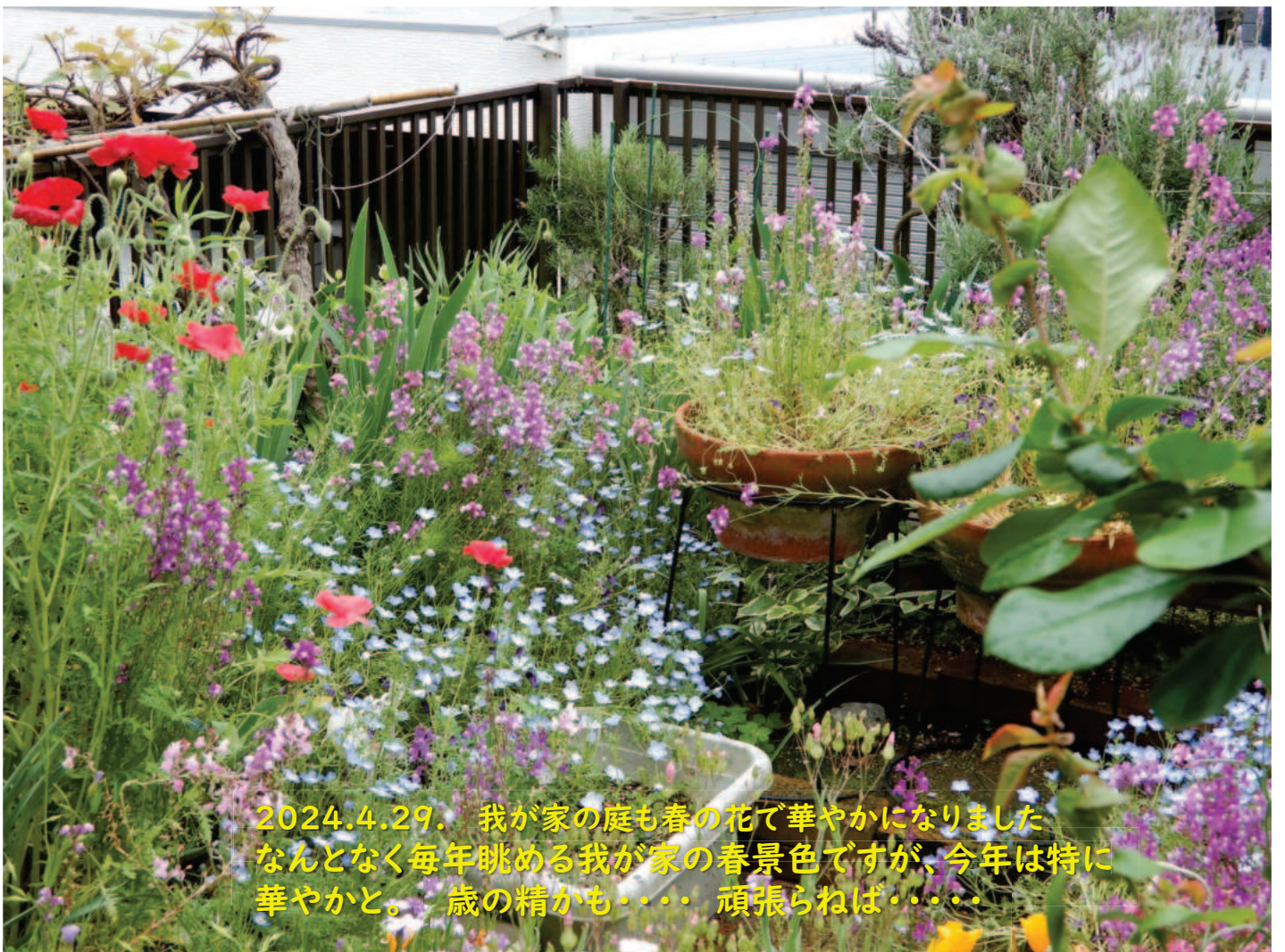
2024.4.29. 我が家の庭も春の花で華やかになりました なんとなく毎年眺める我が家の春景色ですが、今年は特に 華やかと。 歳の精かも・・・ 頑張らねば・・・