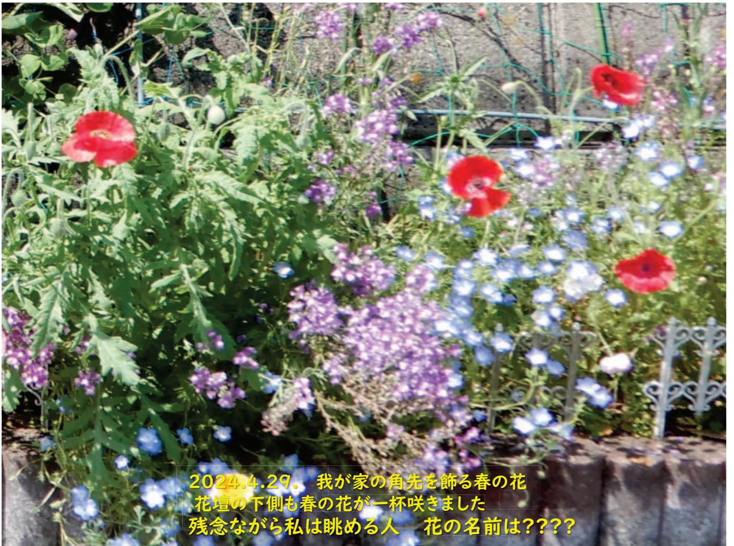
2024.4.29. 我が家の角先を飾る春の花 花壇の下側も春の花が一杯咲きました 残念ながら私は眺める人 花の名前は????