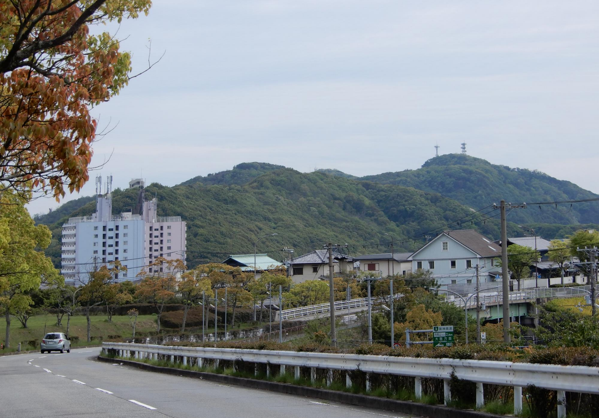
2024.4.22. 山は芽吹いてすっかり新緑に 横尾道で