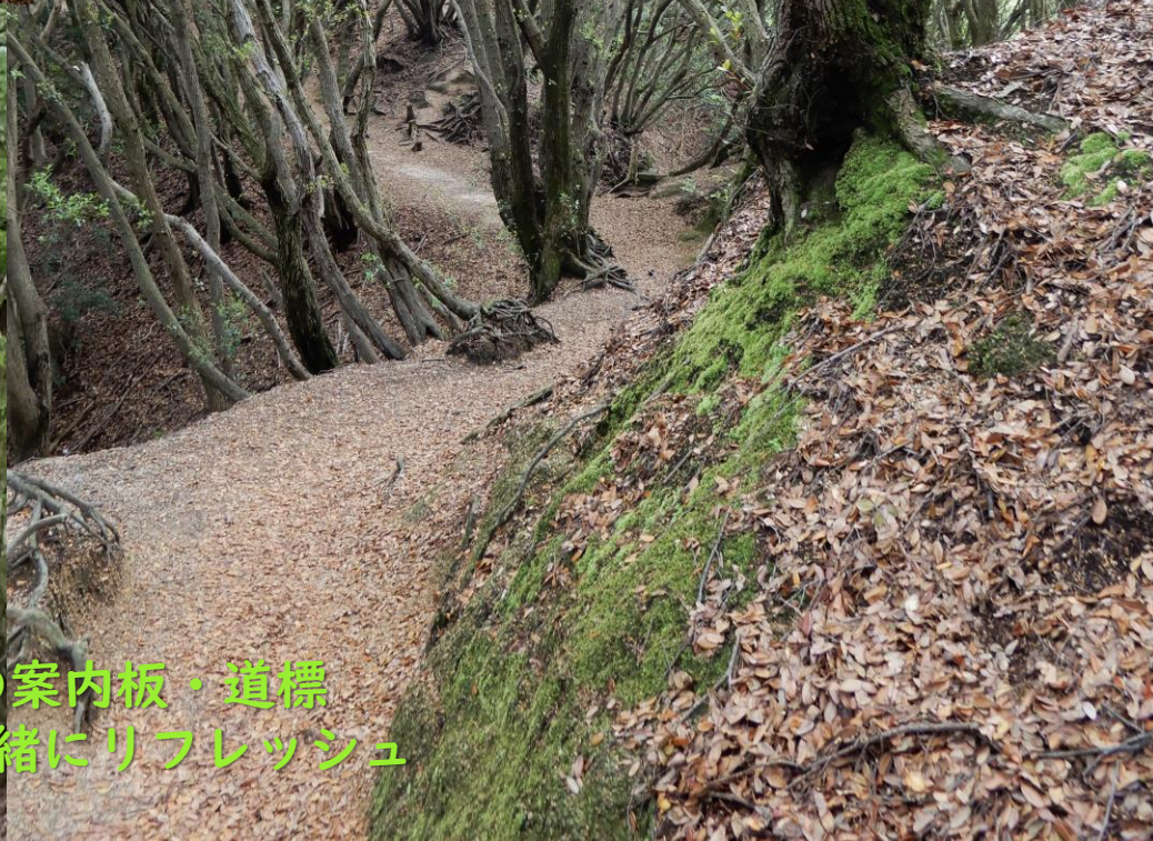
2024.4.22. 西六甲の縦走路の案内板・道標 すっかり新調されて 気持ちも一緒にリフレッシュ