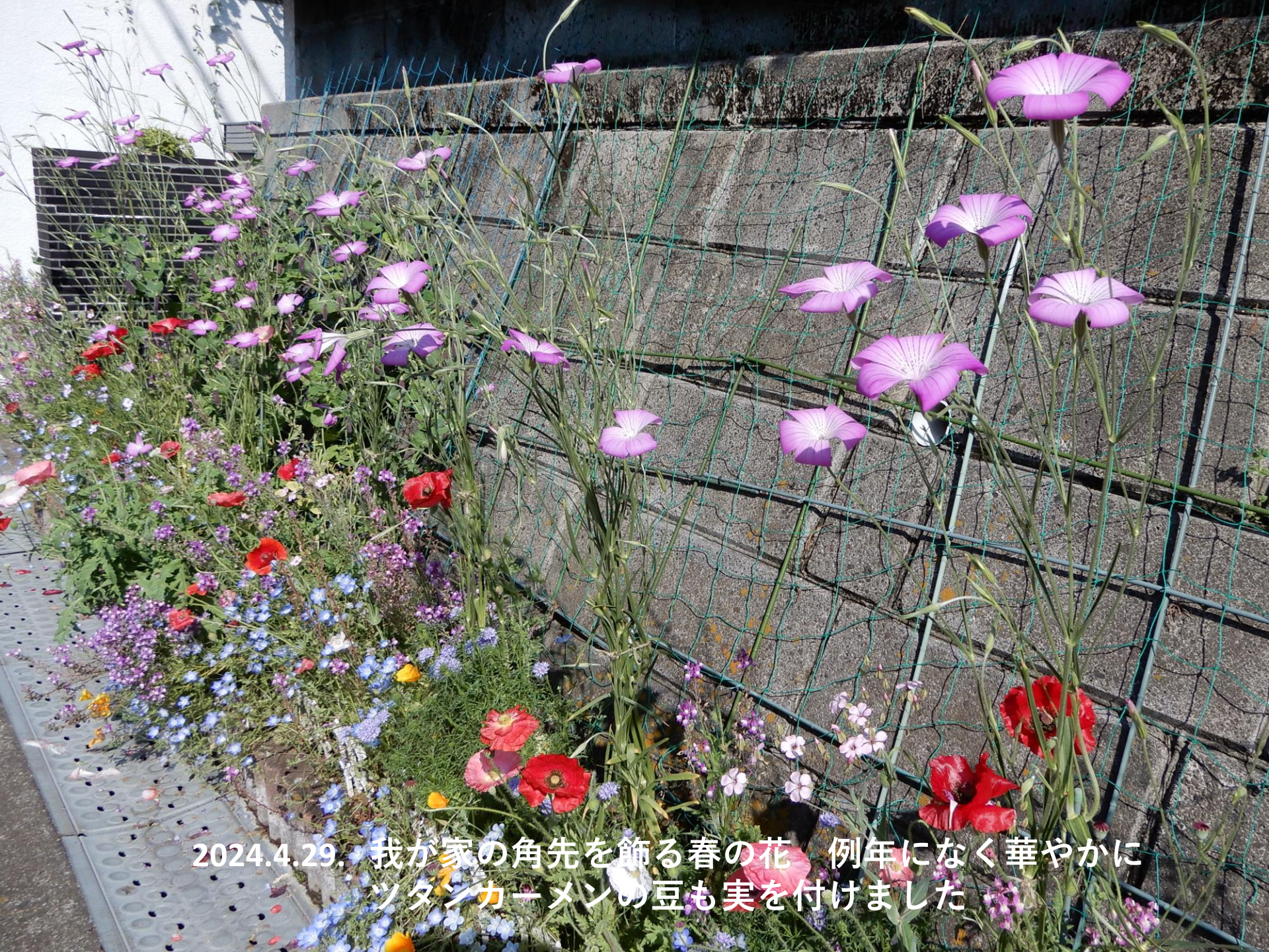
2024.4.29. 我が家の角先を飾る春の花 例年になく華やかに ツタンカーメンの豆も実を付けました