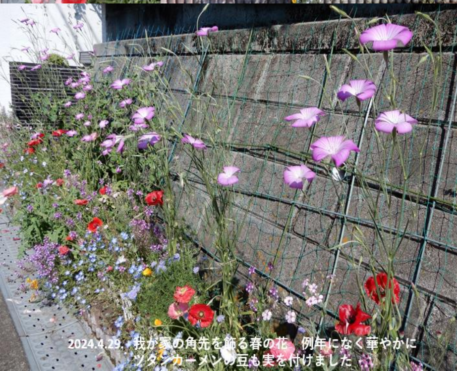
2024.4.29. 我が家の角先を飾る春の花 例年になく華やかに ソタンカーメンの豆も実を付けました