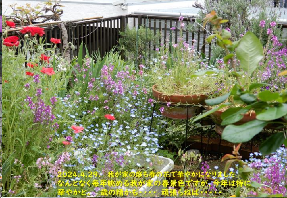
2024.4.29. 我が家の庭も春の花で華やかになりました なんとなく毎年眺める我が家の春景色ですが、今年は特に 華やかと。歳の精かも・・・頑張らねば・・・