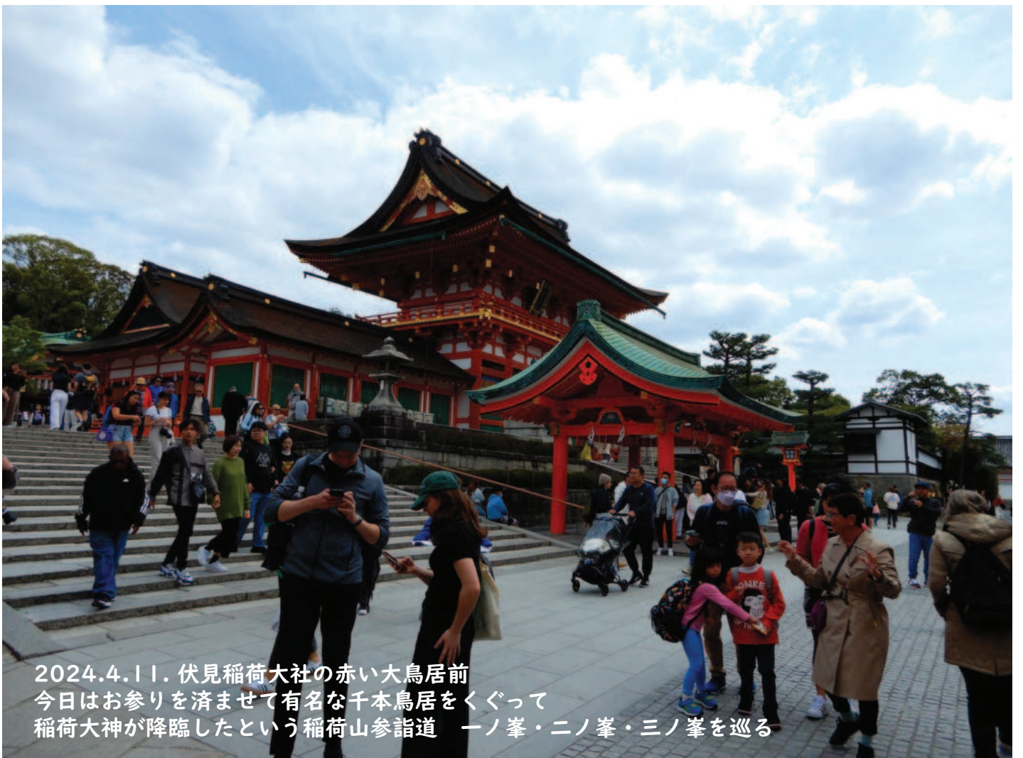
2024.4.11. 伏見稲荷大社の赤い大鳥居前 今日はお参りを済ませて有名な千本鳥居をくぐって 稲荷大神が降臨したという稲荷山参詣道 一ノ峯・二ノ峯・三ノ峯を巡る