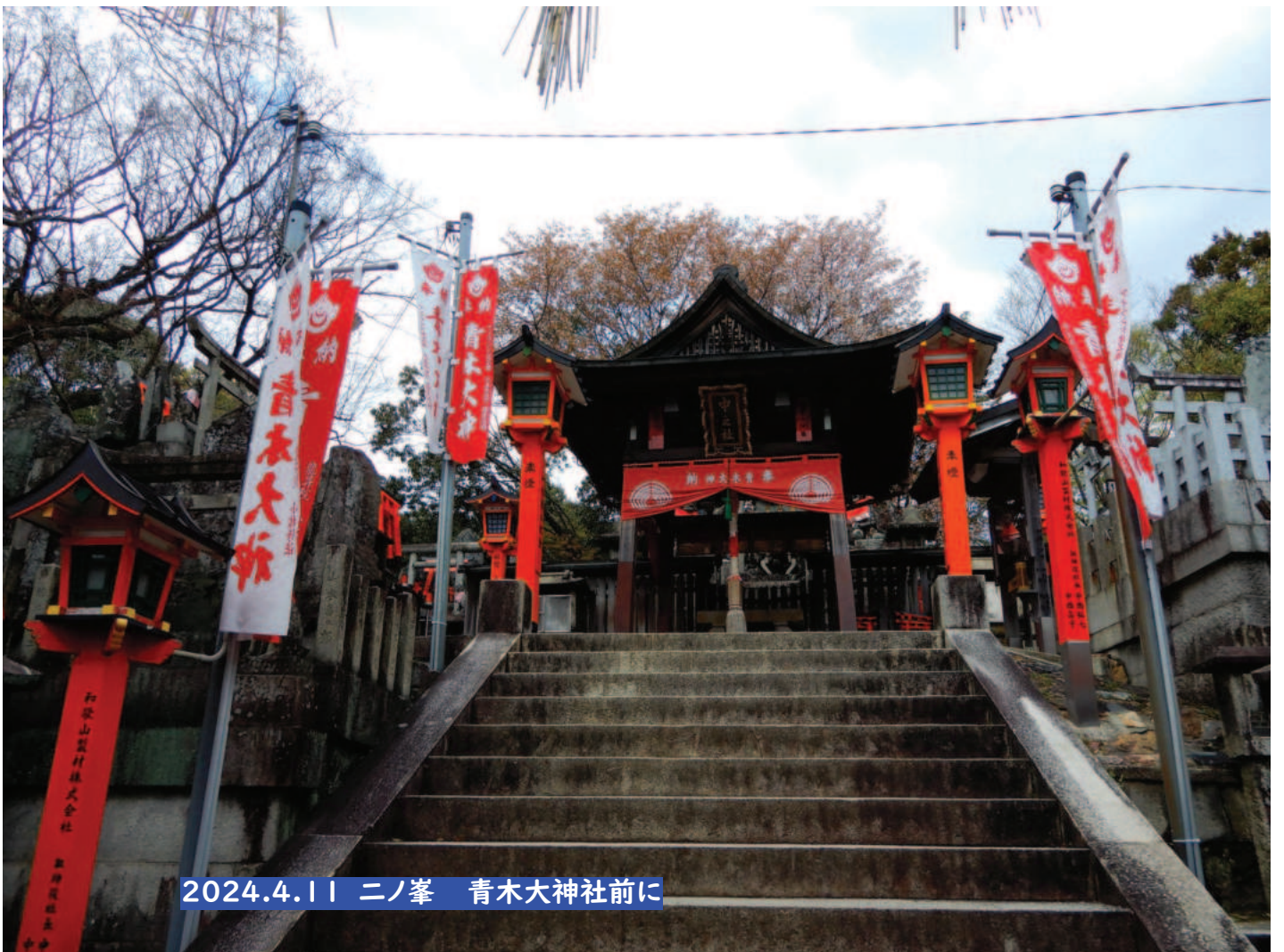
2024.4.11 ニノ峯 青木大神社前に