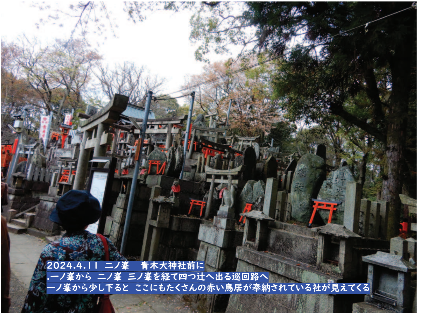
2024.4.11 ニノ峯 青木大神社前に 一ノ峯から ニノ峯 三ノ峯を経て四つ辻へ出る巡回路へ 一ノ峯から少し下ると ここにもたくさんの赤い鳥居が奉納されている社が見えてくる