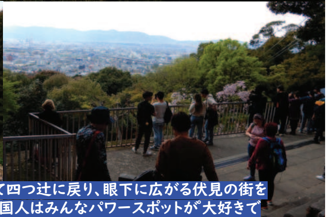
2024.4.11. 15分ほどで 三峯巡りを終えて四つ辻に戻り、眼下に広がる伏見の街を眺めながらの休息 周りは外国人ばかり 外国人はみんなパワースポットが大好きで