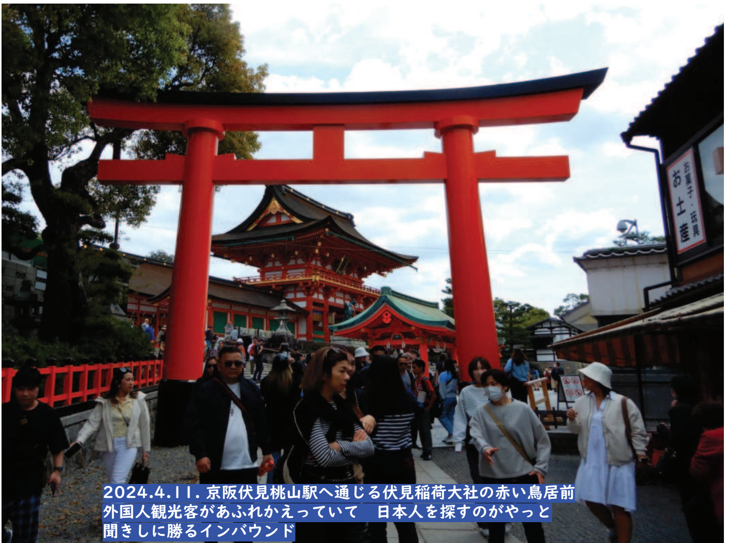
2024.4.11. 京阪伏見桃山駅へ通じる伏見稲荷大社の赤い鳥居前 外国人観光客があふれかえっていて 日本人を探すのがやっと 聞きしに勝るインバウンド