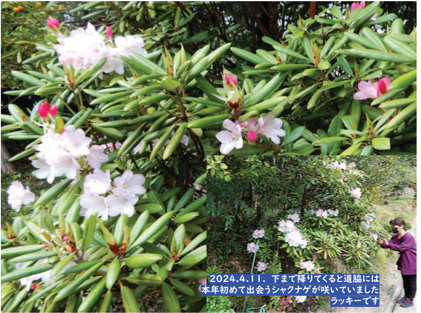
2024.4.11. 下まで降りてくると道脇には 本年初めて出会うシャクナゲが咲いていました ラッキーです