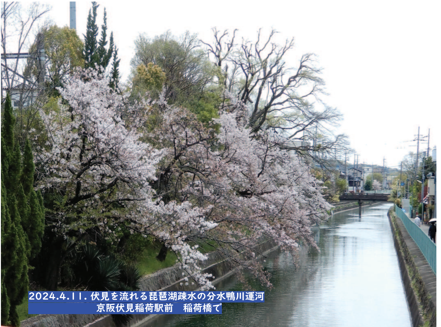
2024.4.11. 伏見を流れる琵琶湖疎水の分水鴨川運河 京阪伏見稻荷駅前 稲荷橋で