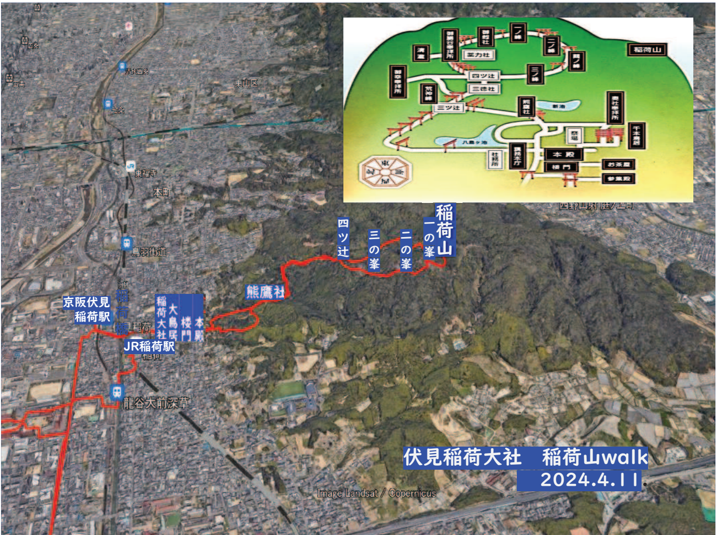
伏見稲荷大社 稲荷山walk 2024.4.11