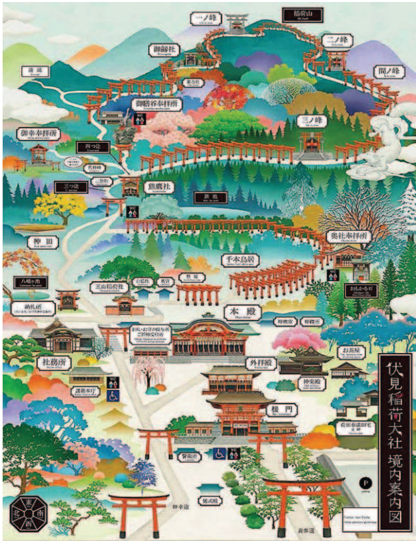
伏見稲荷大社境内案内図

4月11日 娘の所用に付き合っ京都伏見へ出かけ、所用を済ませた午後、伏見稲荷の参道稲荷山巡りをしました。久しぶりの伏見稲荷。平日というのに聞きしに勝るインバウンドの外国人の群れ。もう国籍種々多様。老いも若きも着物姿にトライしているのにもびっくり。似合うも似合わないもテーマパークの内。また、10年近く登らなかった稲荷山巡りの参道には赤い鳥居がびっしり。これが今の日本の縮図現状か・・・娘と家内と3人 それに外国人の観光客けっこう楽しい稲荷山三峰巡りでした。