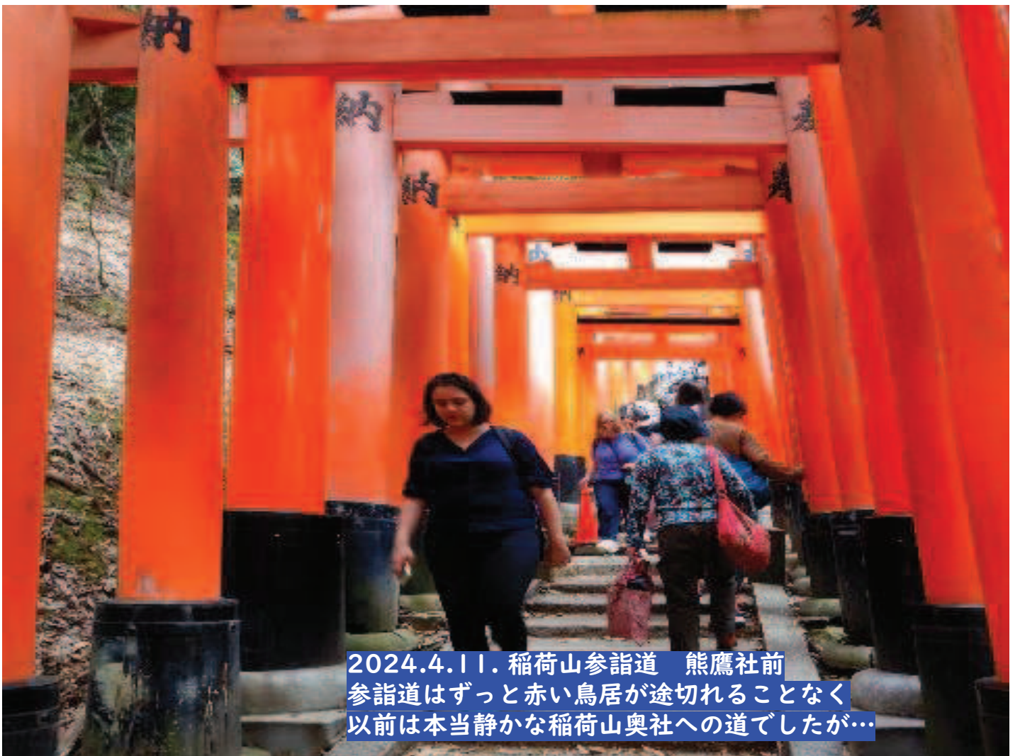
2024.4.11. 稲荷山参詣道 熊鷹社前 参詣道はずっと赤い鳥居が途切れることなく 以前は本当静かな稲荷山奥社への道でしたが…