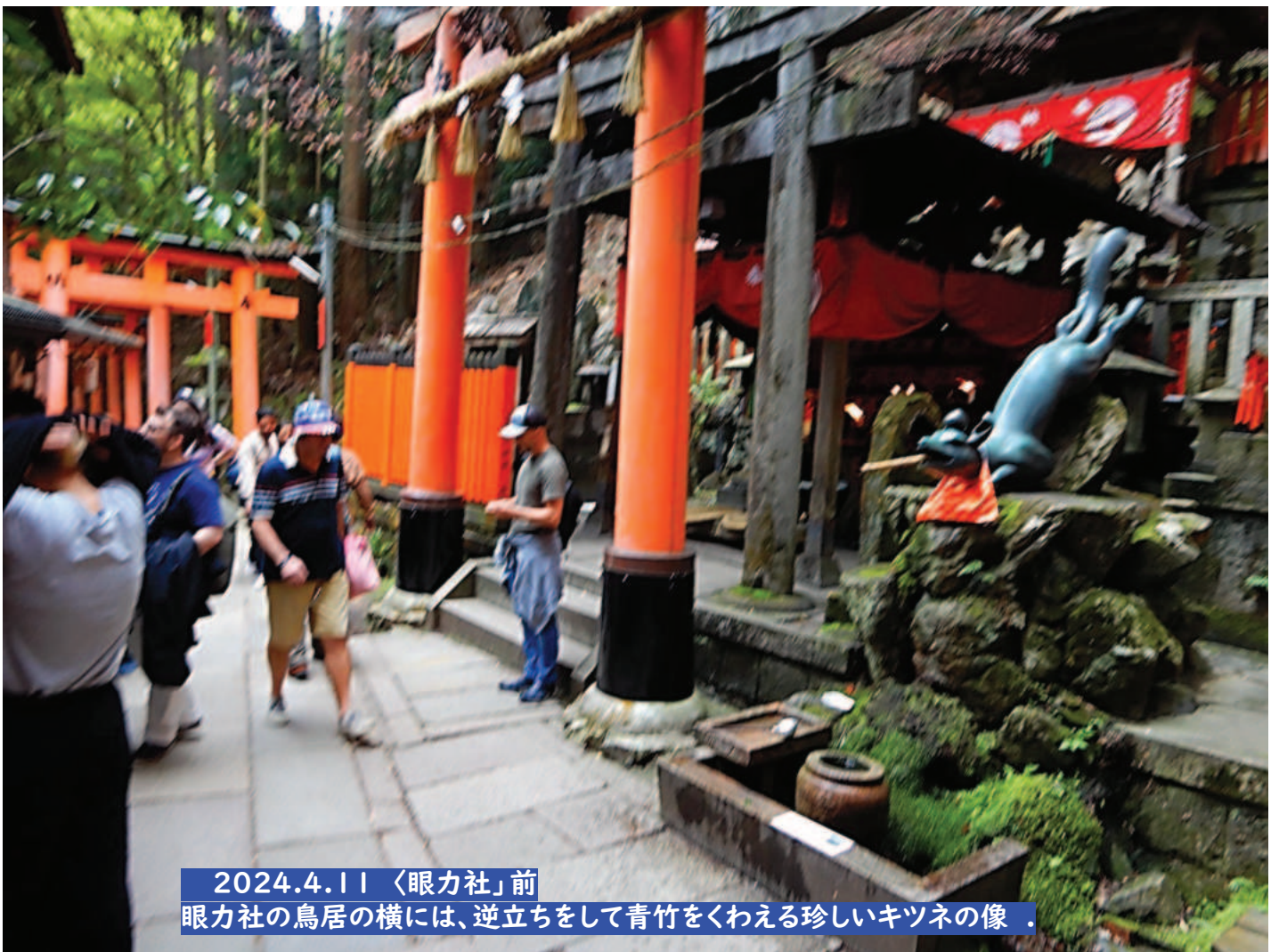
2024.4.11 <眼力社>前 眼力社の鳥居の横には、逆立ちをして青竹をくわえる珍しいキツネの像