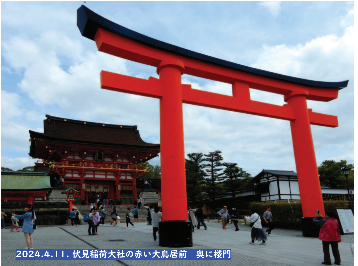
2024.4.11. 伏見稲荷大社の赤い大鳥居前 奥に楼門