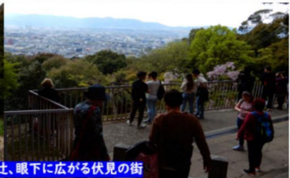
2024.4.11. 稲荷山 四つ辻、眼下に広がる伏見の街