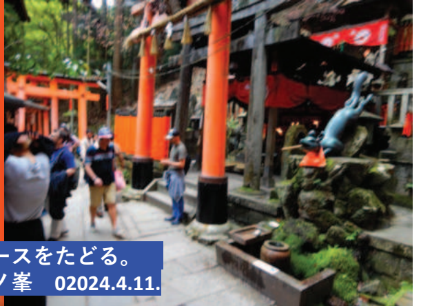
四ツ辻から左の一ノ峯から稲荷山山頂部の周回コースをたどる。 有名な「眼力社」前を過ぎるとまもなく山頂 一ノ峯 02024.4.11.