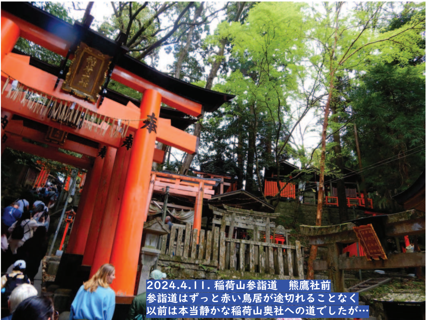
2024.4.11. 稲荷山参詣道 熊鷹社前 参詣道はずっと赤い鳥居が途切れることなく 以前は本当静かな稲荷山奥社への道でしたが…