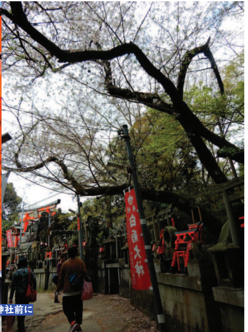
2024.4.11 三ノ峯 白菊大神社前に