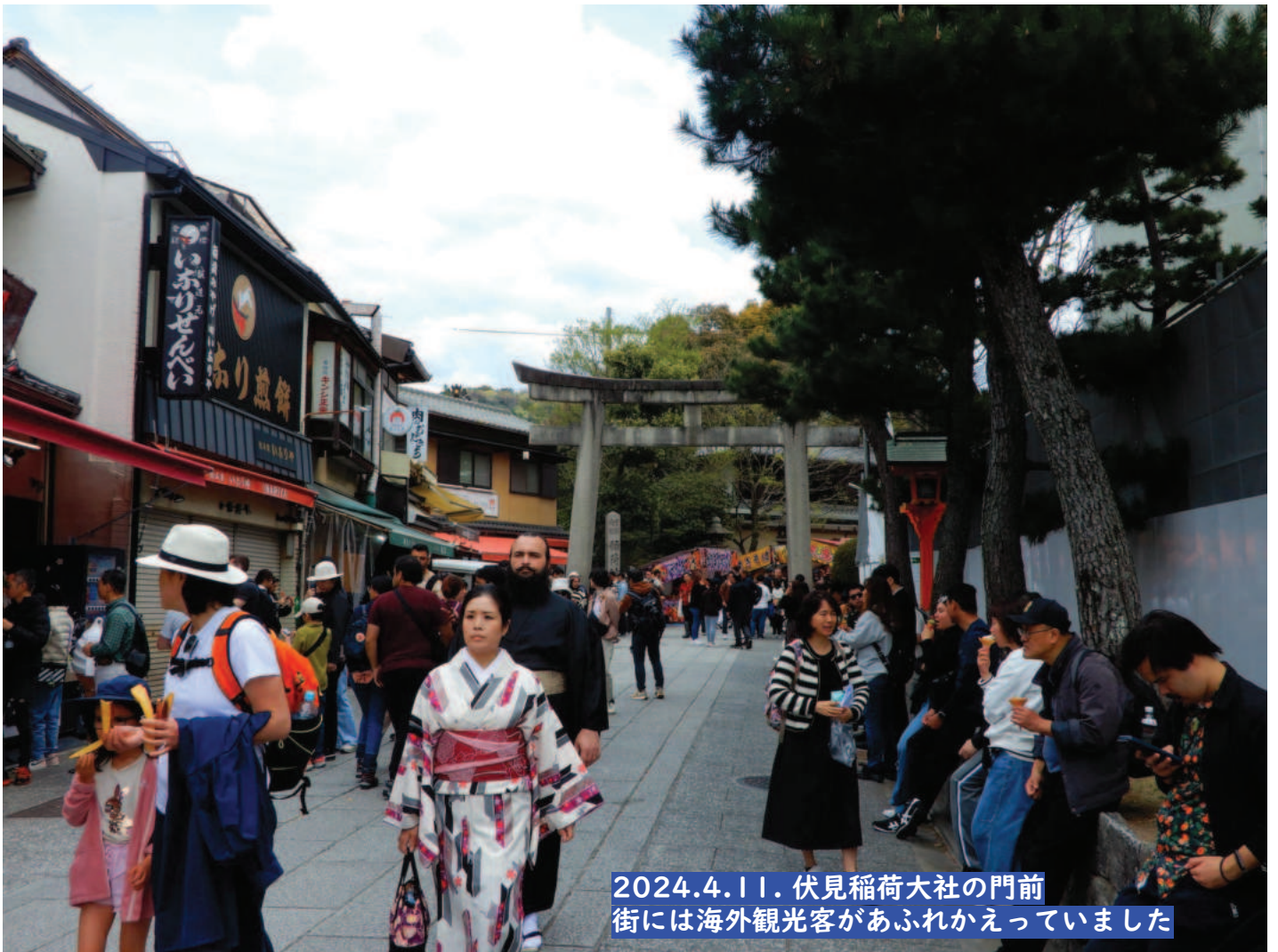
2024.4.11. 伏見稲荷大社の門前 街には海外観光客があふれかえっていました