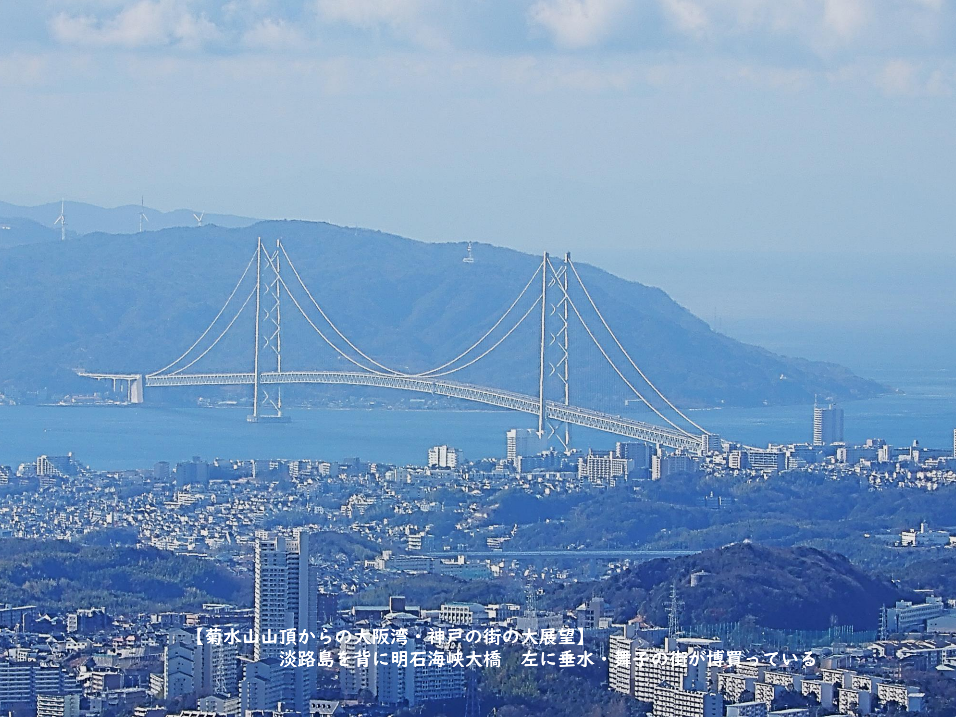
【菊水山山頂からの大阪湾・神戸の街の大展望】 淡路島を背に明石海峡大橋 左に垂水・舞子の街が博覧している