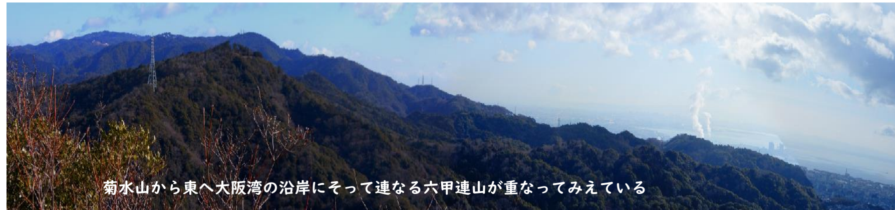
菊水山から東へ大阪湾の沿岸にそって連なる六甲連山が重なってみえている