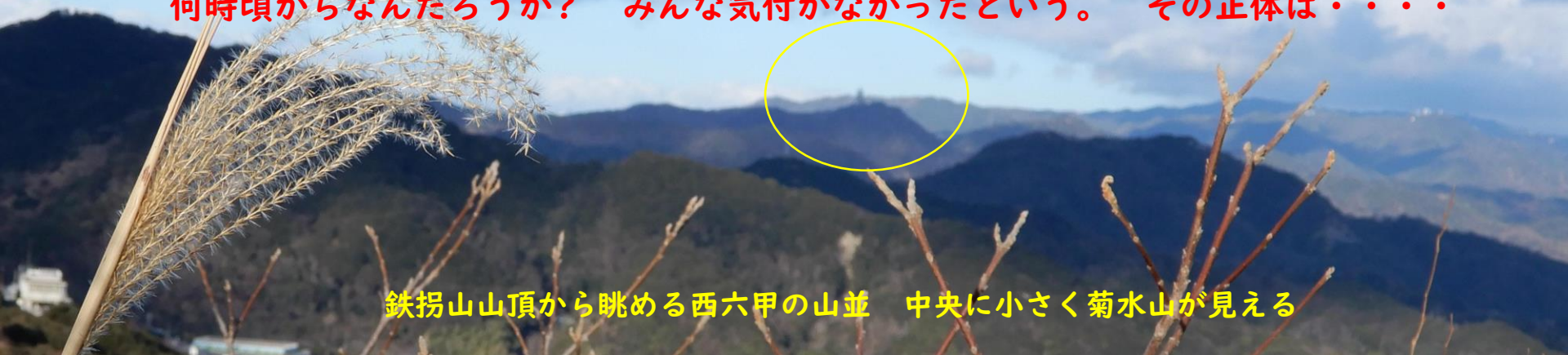
鉄拐山山頂から眺める西六甲の山並 中央に小さく菊水山が見える