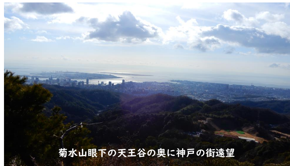
菊水山眼下の天王谷の奥に神戸の街遠望