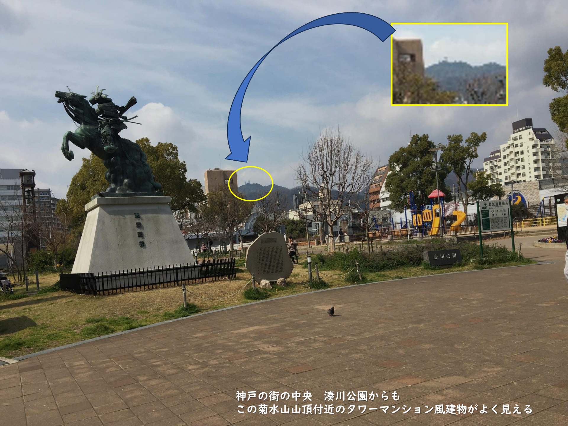
神戸の街の中央 湊川公園からも この菊水山山頂付近のタワーマンション風建物がよく見える