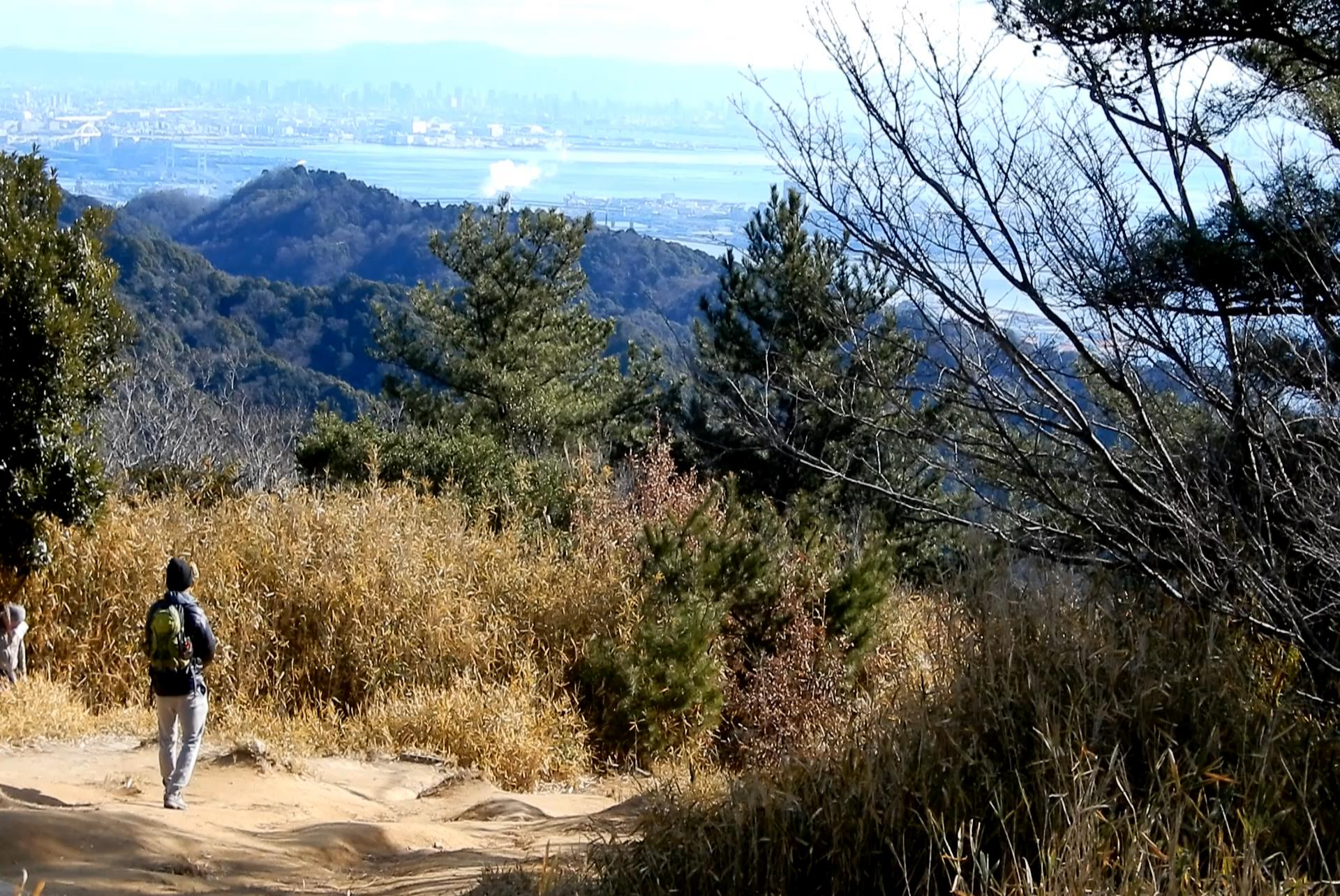
【菊水山山頂からの大阪湾・神戸の街の大展望】【3】 2024.1.8. 南東側 大阪湾沿い神戸の街・ポートアイランド・六甲アイランド 背後には大阪・阪神間の市街地 そして 六甲の山並 六甲山頂が見える