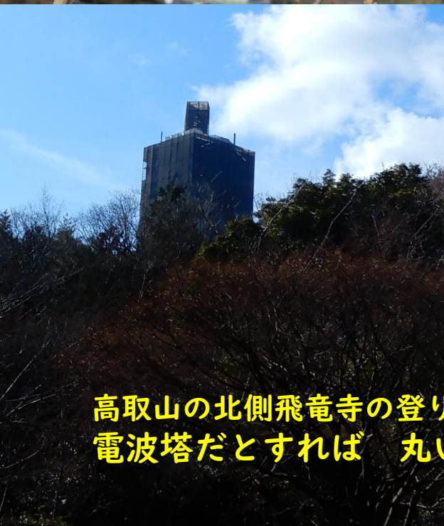
高取山の北側飛竜寺の登り口から見ても やっぱリタワーマンションのように見える。 電波塔だとすれば 丸いパラボラが見えるはずなのですが.....