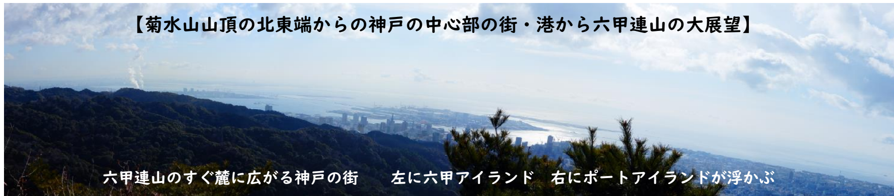
六甲連山のすぐ麓に広がる神戸の街 左に六甲アイランド 右にポートアイランドが浮かぶ