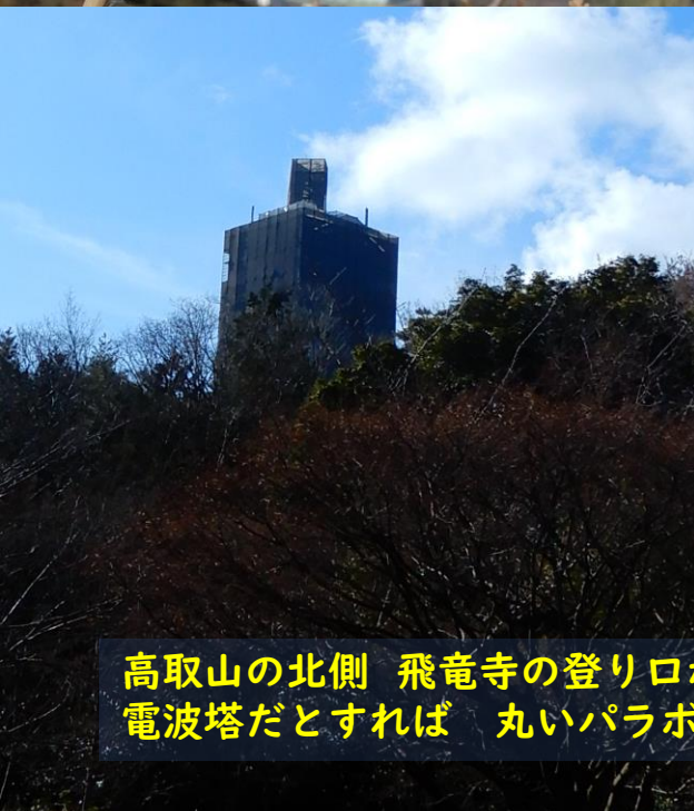
高取山の北側 飛竜寺の登り口から見ても やっぱりタワーマンションのように見える。 電波塔だとすれば 丸いパラボラが見えるのですが・・・