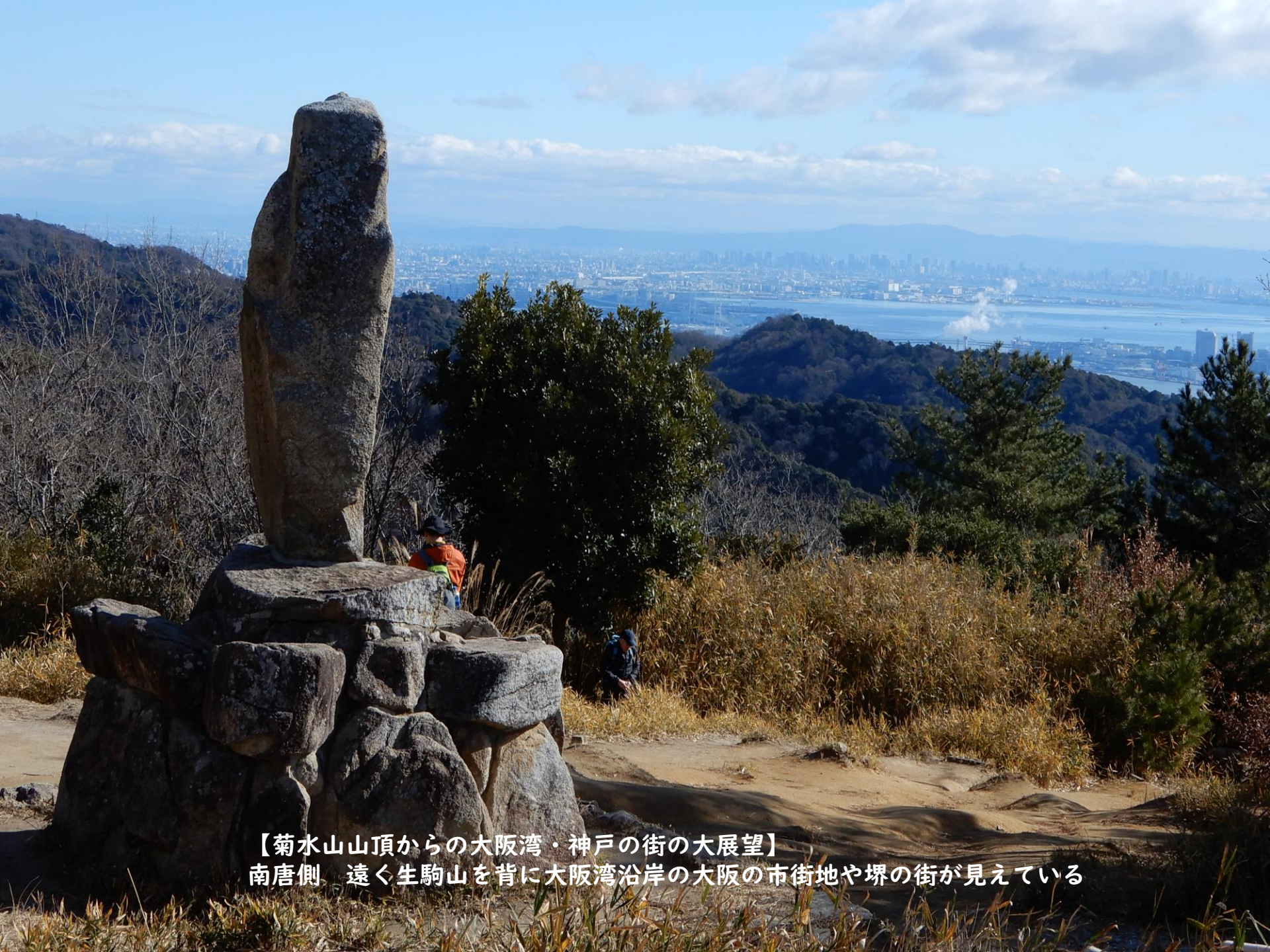
【菊水山山頂からの大阪湾・神戸の街の大展望】 南唐側 遠く生駒山を背に大阪湾沿岸の大阪の市街地や堺の街が見えている