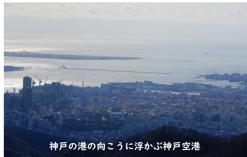
神戸の港の向こうに浮かぶ神戸空港