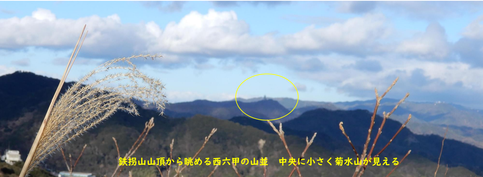
鉄拐山山頂から眺める西六甲の山並 中央に小さく菊水山が見える