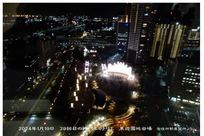
2024年1月19日 29回目の神戸ルミナリエ 東遊園地会場 赤役所野展望所より