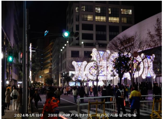
2024年1月19日 29回目の神戸ルミナリエ 旧外国人居留地会場

本年1月1日能登半島大地震で被災された皆様へ！ 厳しい寒さの中 一日も早く支援の手が届きますよう God be With You!! From Kobe