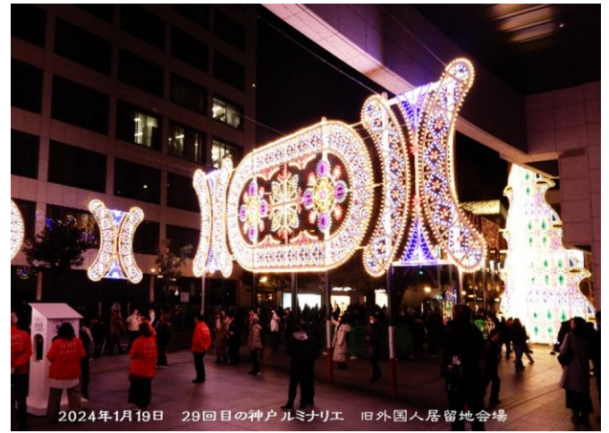
2024年1月19日 29回目の神戸ルミナリエ 旧外国人居留地会場