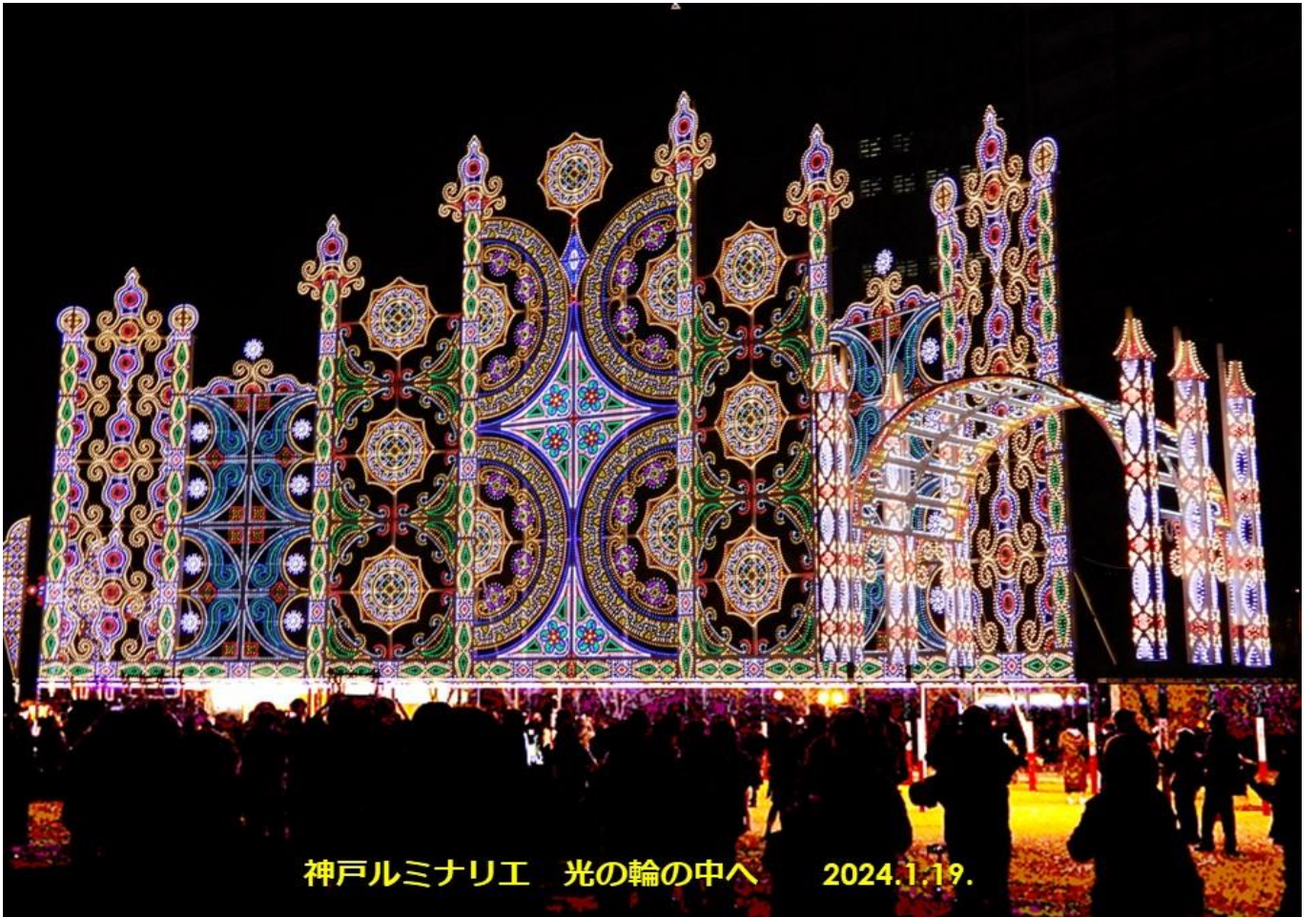
神戸ルミナリエ 光の輪の中へ 2024.1.19.