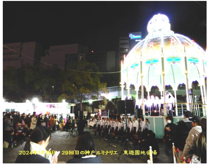
2024年1月19日 29回目の神戸ルミナリエ 東遊園地会場