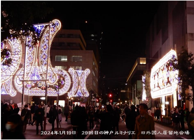
2024年1月19日 29回目の神戸ルミナリエ 旧外国人居留地会場