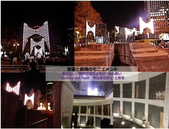
慰霊と鎮魂のモニュメント 忘れない、忘れてはならない あの思い "God be with You!! 今は安らかに"と祈る