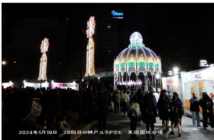
2024年1月19日 29回目の神戸ルミナリエ 東遊園地会場