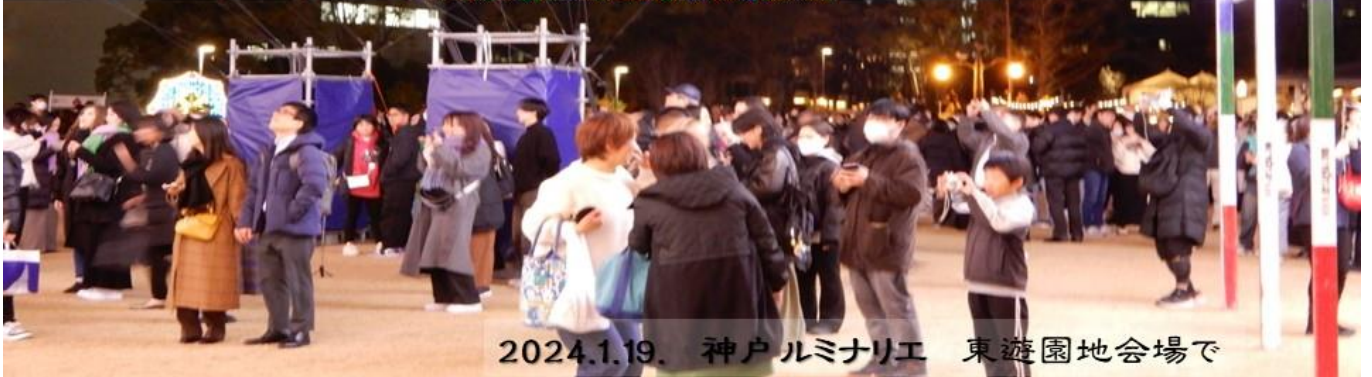
2024.1.19. 神戸ルミナリエ 東遊園地会場で