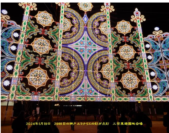
2024年1月19日 29回目の神戸ルミナリエの灯が点灯 三宮東遊園地会場