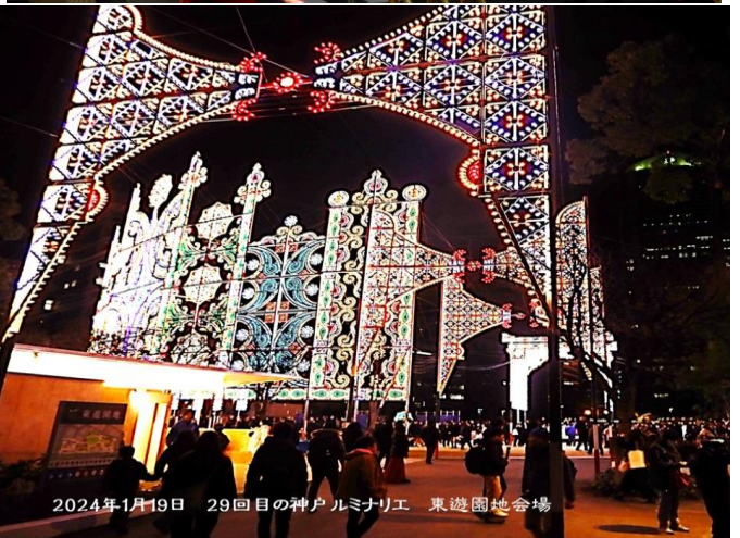
2024年1月19日 29回目の神戸ルミナリエ 東遊園地会場

慰霊と鎮魂のモニュメント 忘れない 悔れではない あの思い "God be with You!! 今は安らかで"と祈る