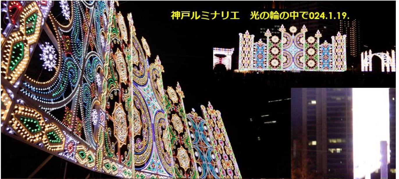
神戸ルミナリエ 光の輪の中で024.1.19.