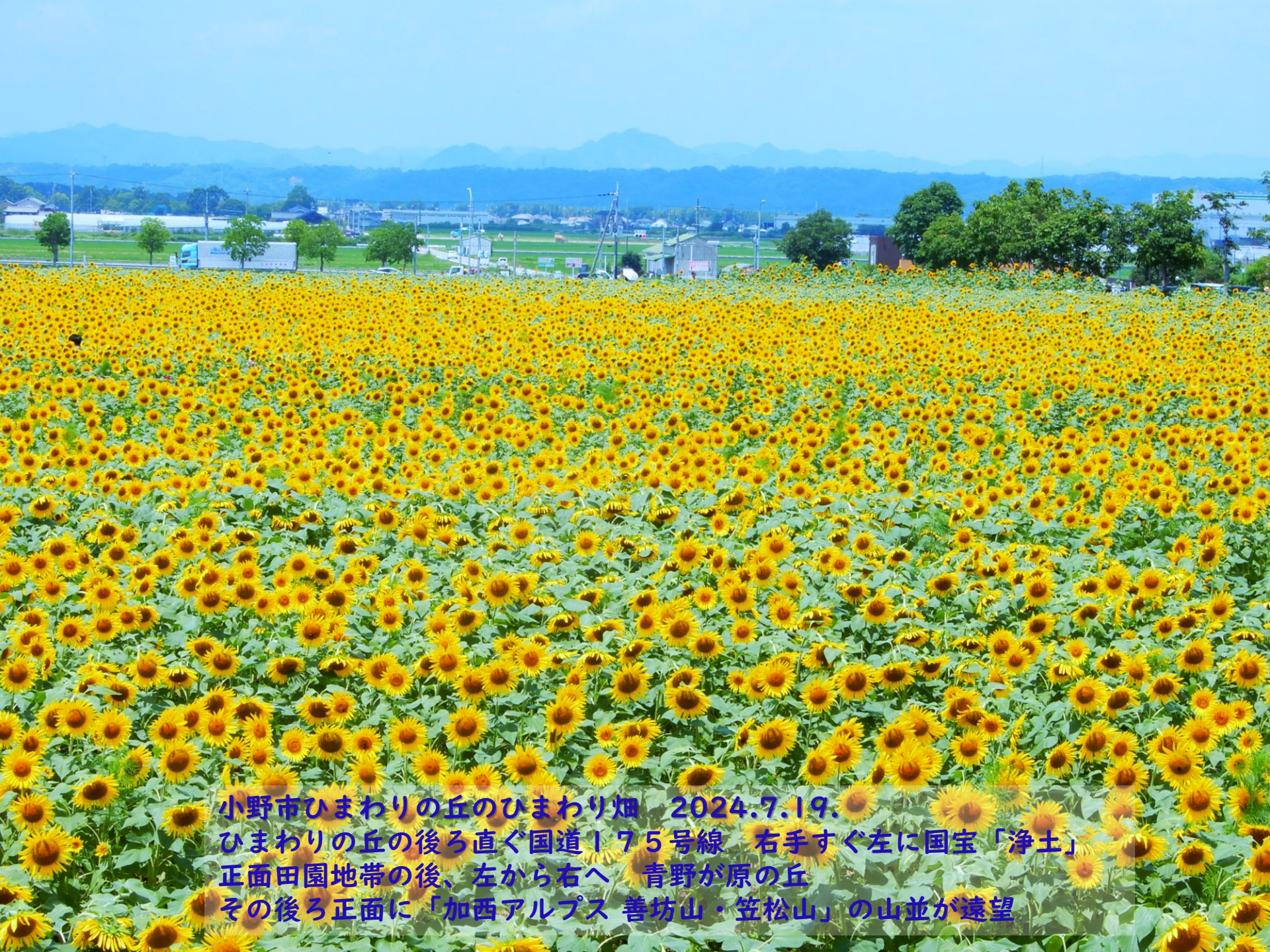
小野市ひまわりの丘のひまわり畑 2024.7.19. ひまわりの丘の後ろ直ぐ国道175号線 右手すぐ左に国宝「浄土」 正面田園地帯の後、左から右へ 青野が原の丘 その後ろ正面に「加西アルプス 善坊山・笠松山」の山並が遠望