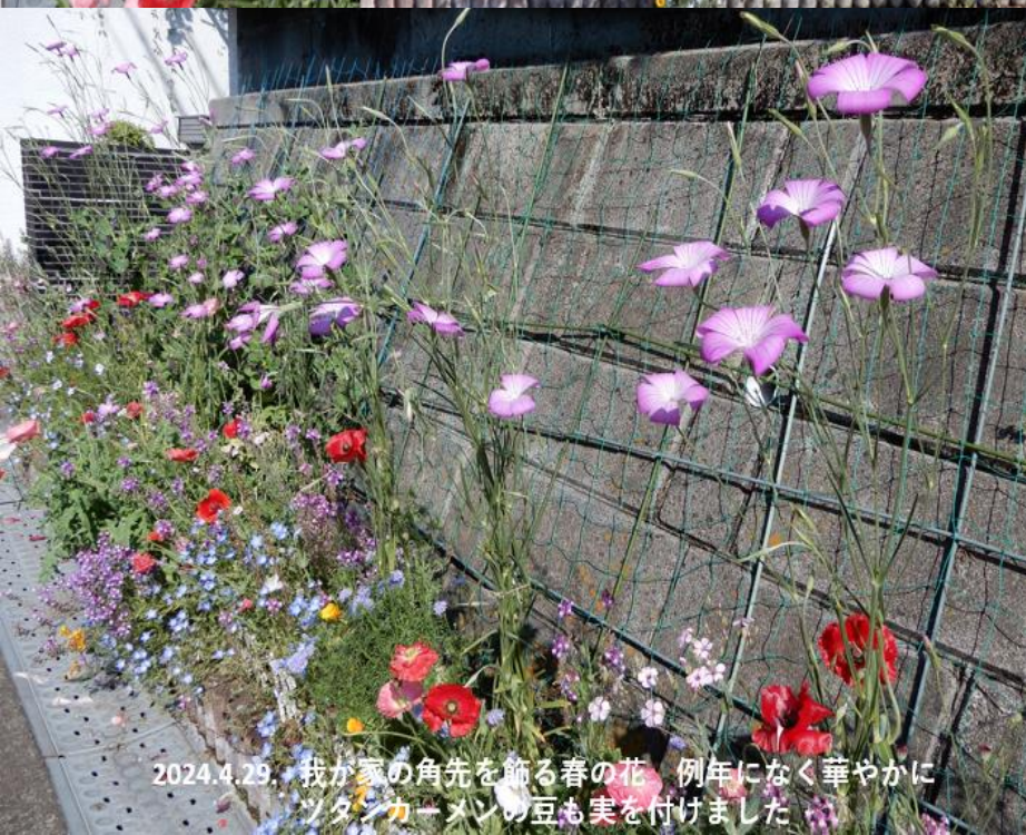
2024.4.29. 我が家の角先を飾る春の花 例年になく華やかに ツタンカーメンの豆も実を付けました