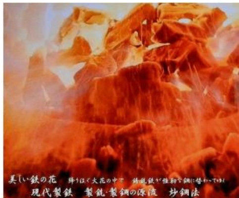
美しい鉄の花 輝くほど大花の中で 鉄製鉄が鉄初鋼に替わって 現代製鉄 製鉄製鋼の源流 妙鋼法