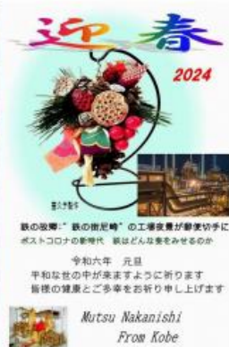
鉄の故郷：“鉄の街尼崎”の工場夜景が郵便切手に ポストコロナの新時代 鉄はどんな姿をみせるのか 令和六年 元旦 平和な世の中が来ますように祈ります 皆様の健康とご多幸をお祈り申し上げます Mutsu Nakanishi From Kobe