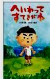
安里有生/詩 長谷川義史/画

へいわってなにかな。ぼくは、かながえたよ。ねこがわらう。おなががいっぱい。やぎののんびりあるいてる。ちょうめいそうがたくさんはえ、よなぐにうまが、ヒヒーンとなく。みんなのこころから、へいわがうまれるんだね。これからも、ずっとへいわがつづくように、ぼくも、ぼくのできることからがんばるよ。