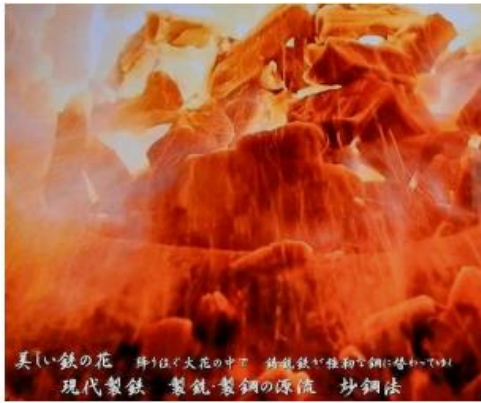
美しい鉄の花 輝くほろ大花の中 鉄製鉄が鉄初鋼に替わって 現代製鉄 製鉄製鋼の源流 妙鋼法