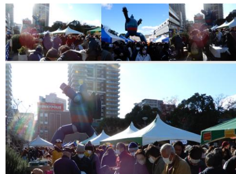
長田 靴っこ祭り 新長田 鉄人広場 2024.12.8.