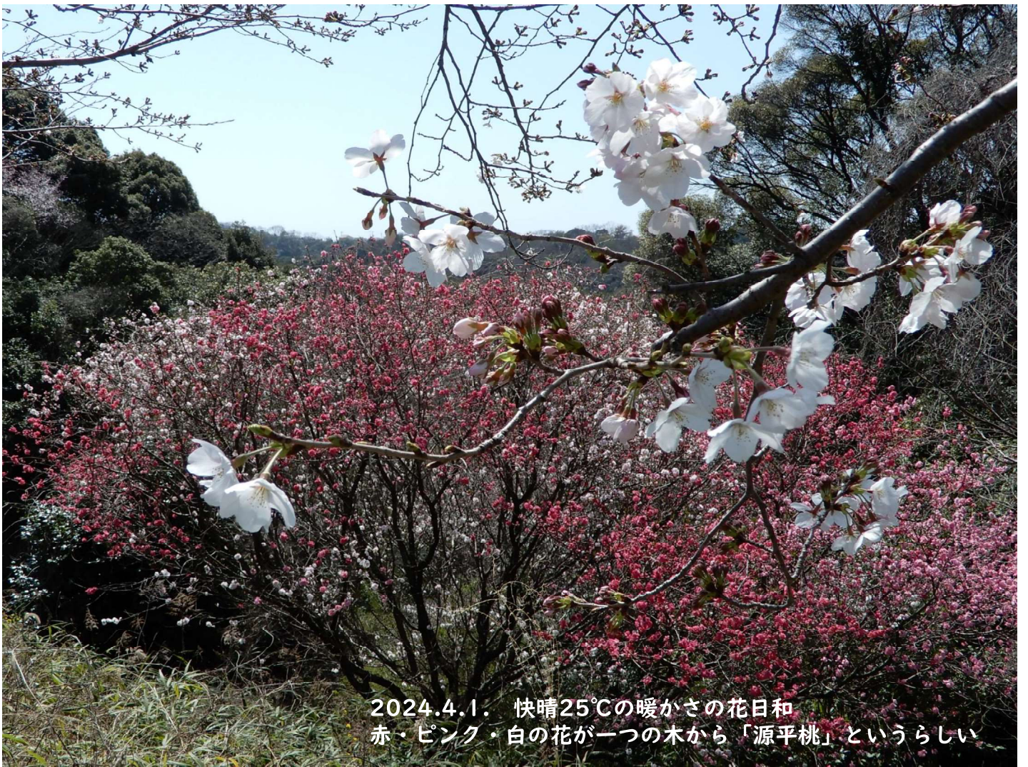
2024.4.1. 快晴25°Cの暖かさの花日和 赤・ピンク・白の花が一つの木から「源平桃」というらしい