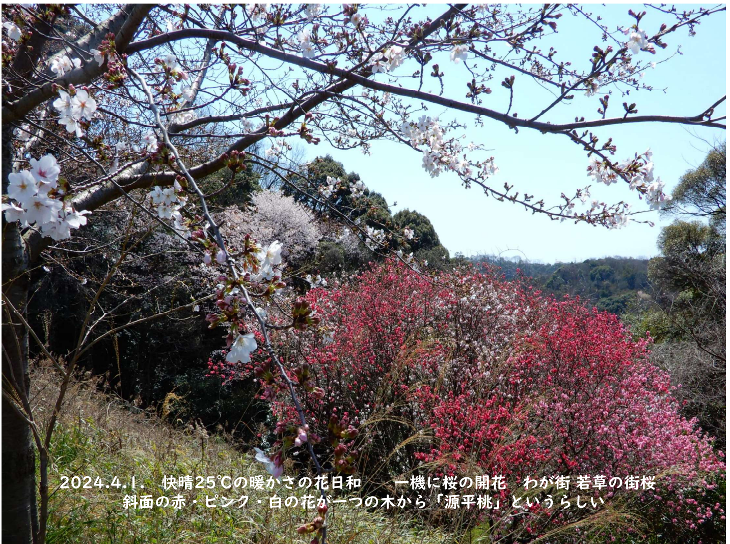
2024.4.1. 快晴25°Cの暖かさの花日和 一機に桜の開花 わが街 若草の街桜 斜面の赤・ピンク・白の花が一つの木から「源平桃」というらしい