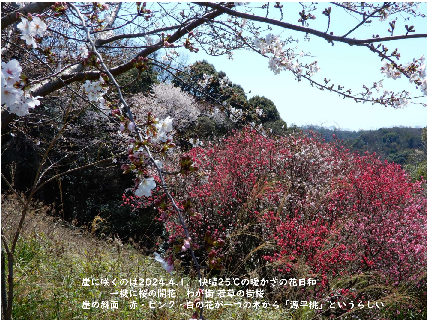
崖に咲くのは2024.4.1. 快晴25℃の暖かさの花日和 一機に桜の開花 わが街 若草の街桜 崖の斜面 赤・ピンク・白の花が一つの木から「源平桃」というらしい