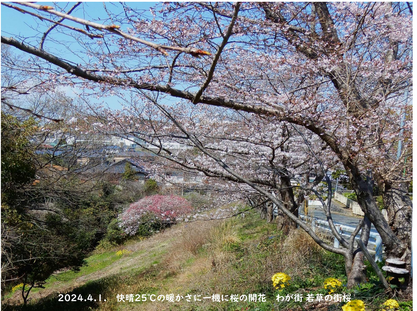
2024.4.1. 快晴25℃の暖かさに一機に桜の開花 わが街 若草の街桜