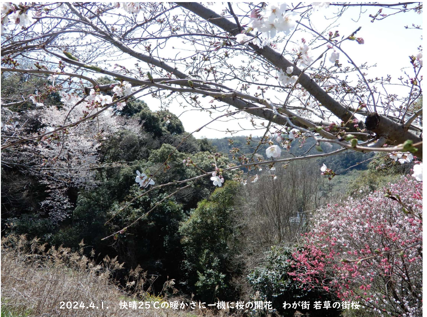
2024.4.1. 快晴25°Cの暖かさに一機に桜の開花 わが街 若草の街桜