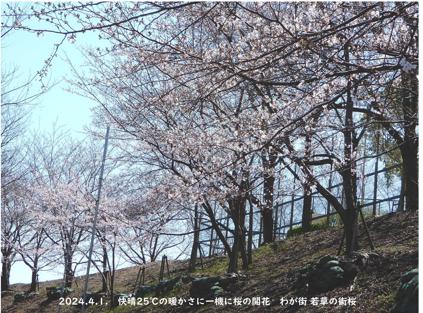
2024.4.1. 快晴25°Cの暖かさに一機に桜の開花 わが街 若草の街桜