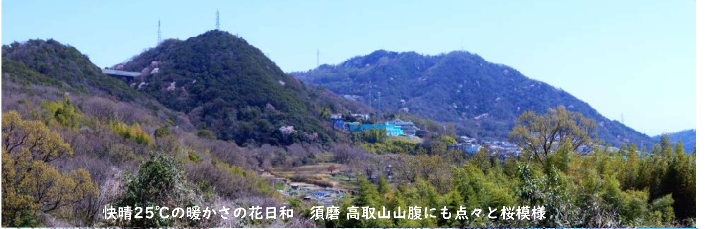
快晴25°Cの暖かさの花日和 須磨 高取山山腹にも点々と桜模様