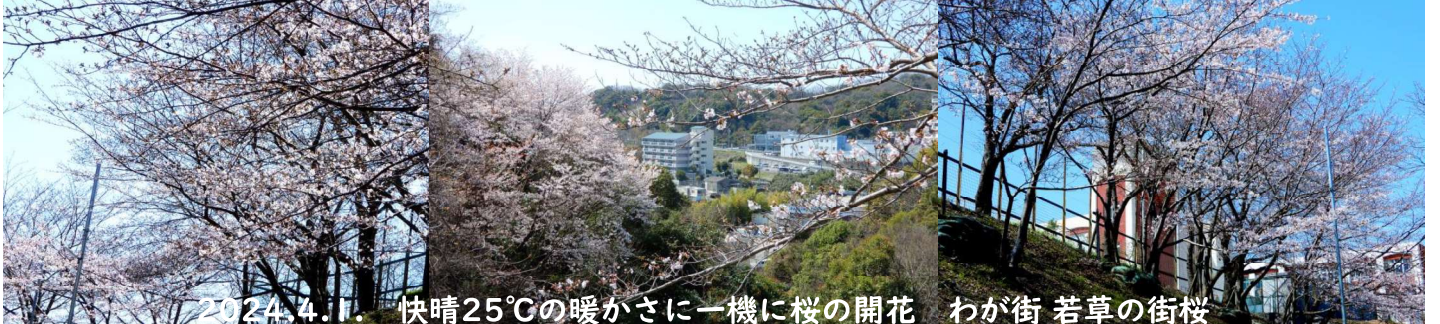
2024.4.1. 快晴25°Cの暖かさに一機に桜の開花 わが街 若草の街桜