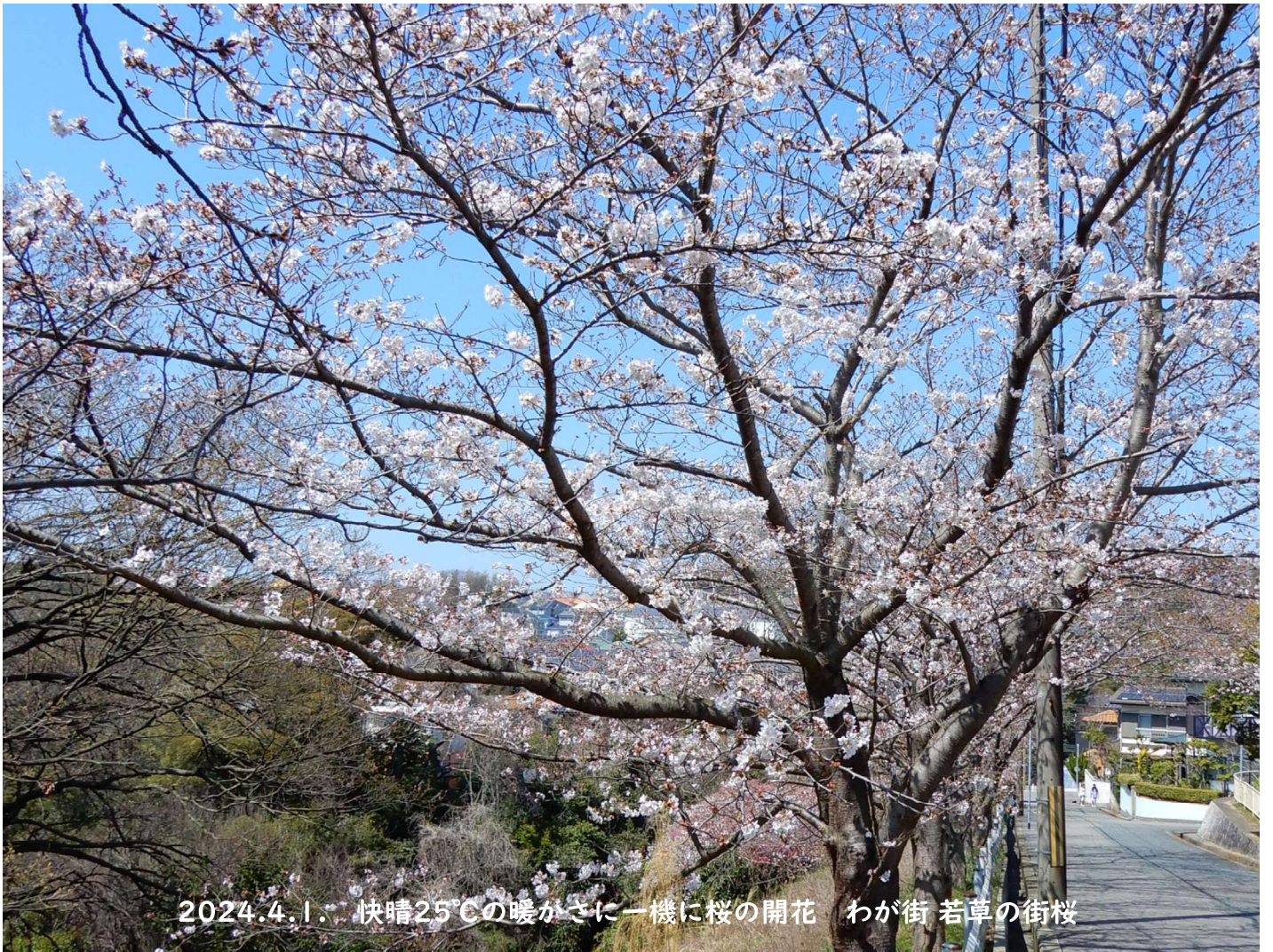
2024.4.1. 快晴25°Cの暖かさに一機に桜の開花 わが街 若草の街桜