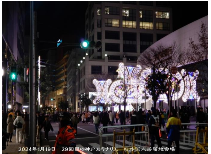
2024年1月19日 29回目の神戸ルミナリエ 旧外国人居留地会場

本年1月1日能登半島大地震で被災された皆様へ！ 厳しい寒さの中 一日も早く支援の手が届きますよう God be With You!! From Kobe