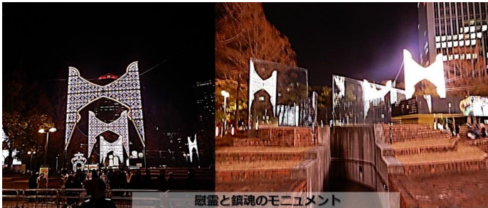
慰霊と鎮魂のモニュメント

忘れない、忘れてはならない あの思い "God be with You!!" 今は安らかにと祈る