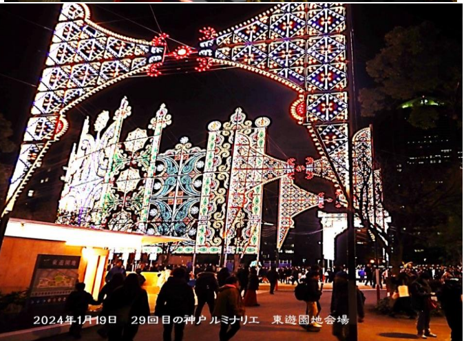
2024年1月19日 29回目の神戸ルミナリエ 東遊園地会場

慰霊と鎮魂のモニュメント 忘れない 悔れではない あの思い "God be with You!! 今は安らかに祈る"