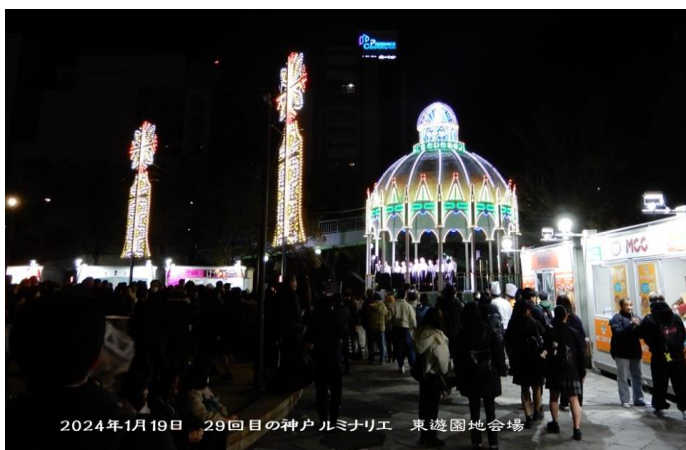
2024年1月19日 29回目の神戸ルミナリエ 東遊園地会場