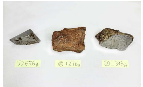
隕鉄各種(付箋紙には重量を記載)

まだ隕鉄の加工を初めてわずかですが、加工手段としての「研磨」も重要であるということに気づき始めました。