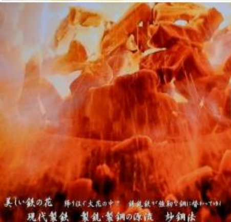
美しい鉄の花 輝くはく大花の中 鉄花鉄が鉄粉と鋼に替わって 現代製鉄 製鉄・製鋼の源流 炒鋼法