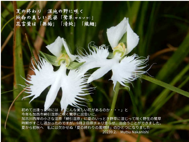
夏の終わり 湿地の野に咲く 純白の美しい花姿「鶯草」(サセソウ) 花言葉は「無垢」「清純」「繊細」

初めて出逢った時には「こんな美しい花があるのか・・・」と 今年も加古川西岸に咲く鶯草に出会いました。 加古川西岸の小さな湿原「網引湿原」に夏のいつとき野草に混じって咲く野生の鶯草 時期がすこし遅かったのですが、9月2日原チャリ走らせ、出会うことができました。 夏から初秋へ 私には欠かせぬ「夏の終わりの風物詩」のひとつになりました 20239.2. Mutsu Nakanishi