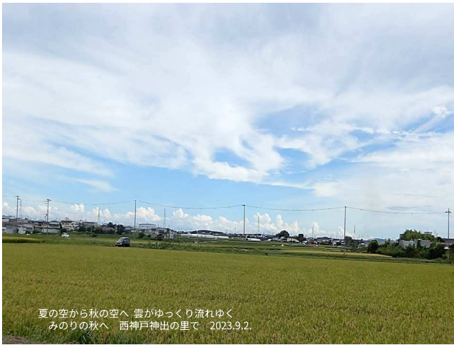
夏の空から秋の空へ 雲がゆっくり流れゆく みのりの秋へ 西神戸神出の里で 2023.9.2.