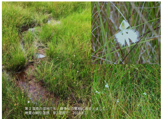
第2湿原の湿地でも、数多くの葎相に出会えました。 晩夏の網引湿原 第2湿原で 2023.9.2.