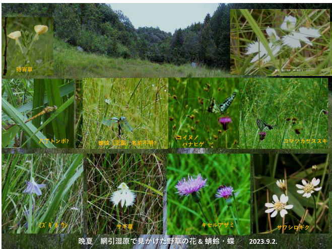
晩夏 網引湿原で見かけた野草の花 & 蜻蛉・蝶 2023.9.2.