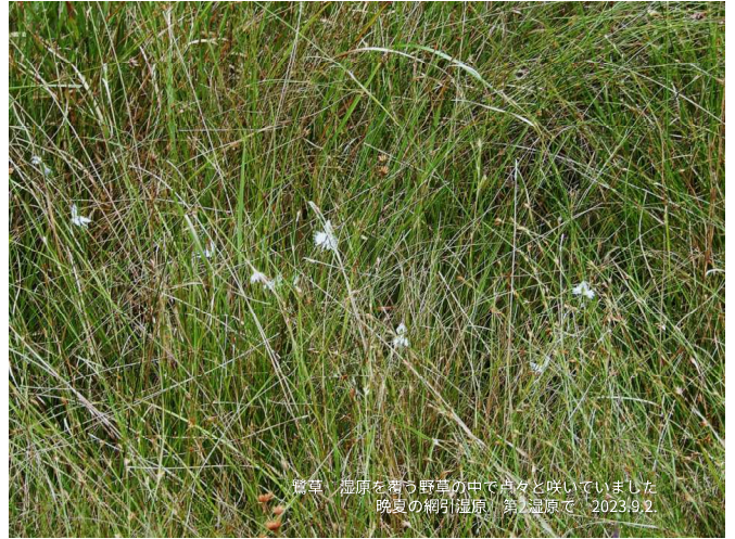
鶯草 湿原を舞う野草の中で点々と咲いていました 晩夏の網引湿原 第2湿原で、2023.9.2.