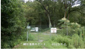
網引湿原のゲート 2023.9.2.