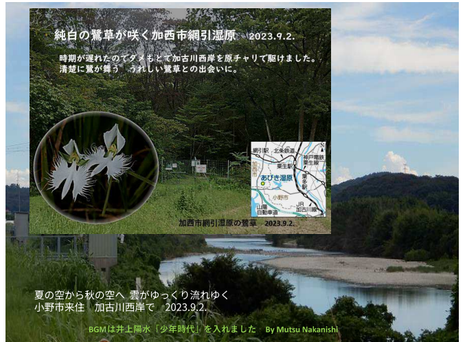
純白の鶯草が咲く加古川西岸の網引湿原 2023.9.2.

初めて出逢った時には「こんな美しい花があるのか・・・」と 今年も加古川西岸に咲く鶯草に出会いました。 加古川西岸の小さな湿原「網引湿原」に夏のいつとき野草に混じって咲く野生の鶯草 時期がすこし遅かったのですが、9月2日原チャリ走らせ、出会うことができました。 夏から初秋へ 私には欠かせぬ「夏の終わりの風物詩」のひとつになりました 20239.2. Mutsu Nakanishi