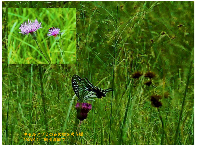
キセルアザミの花の蜜を吸う蝶 2023.9.2. 網引湿原で