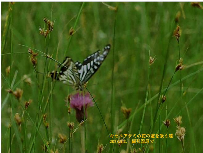
キセルアザミの花の蜜を吸う蝶 2023.9.2. 網引湿原で