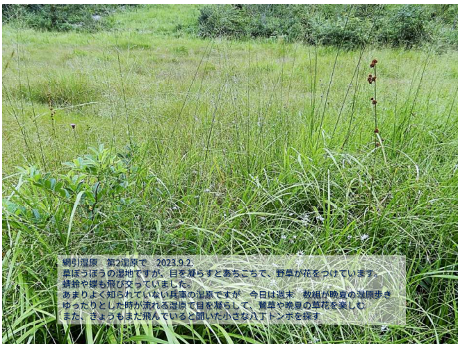
網引湿原 第二湿原で 2023.9.2. 草ぼうぼうの湿地ですが、目を凝らすとあちこちで、野草が花をつけています。 蜻蛉や蝶も飛び交っていました。今日は週末、数組が晩夏の湿原歩き ゆったりとした時が流れる湿原で自然を感じ、暮夏や晩夏の草花を楽しむ また、まようもまだ飛んでいると聞いた小ざな丁トンボを観る