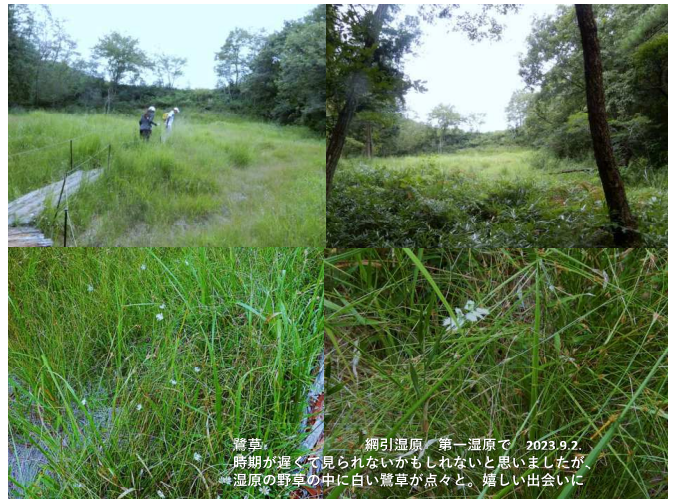
鶯草 網引湿原 第一湿原で 2023.9.2. 時期が遅くて見られないかもしれないと思いましたが、 湿原の野草の中に白い鶯草が点々と、嬉しい出会いに