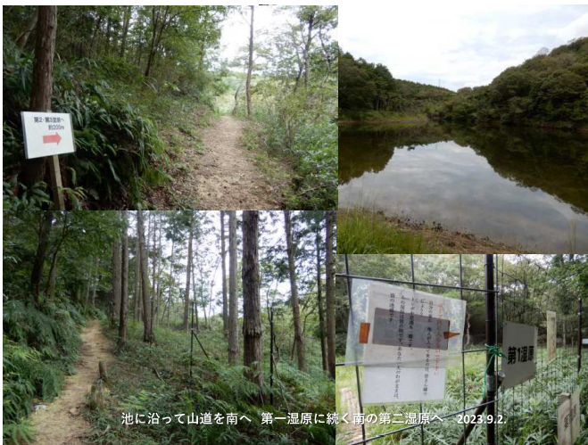
池に沿って山道を南へ 第一湿原に続く南の第二湿原へ 2023.9.2.