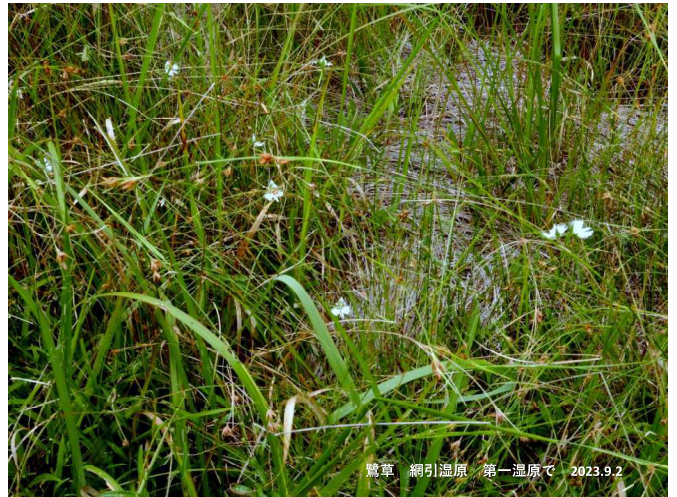
鶯草 網引湿原 第一湿原で 2023.9.2.