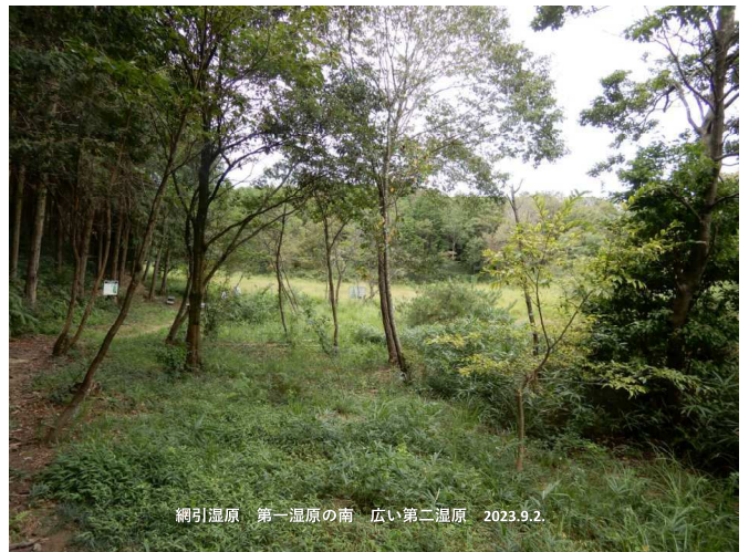
網引湿原 第一湿原の南 広い第二湿原 2023.9.2.