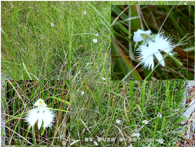
鶯草 網引湿原 第一湿原で 2023.9.2.