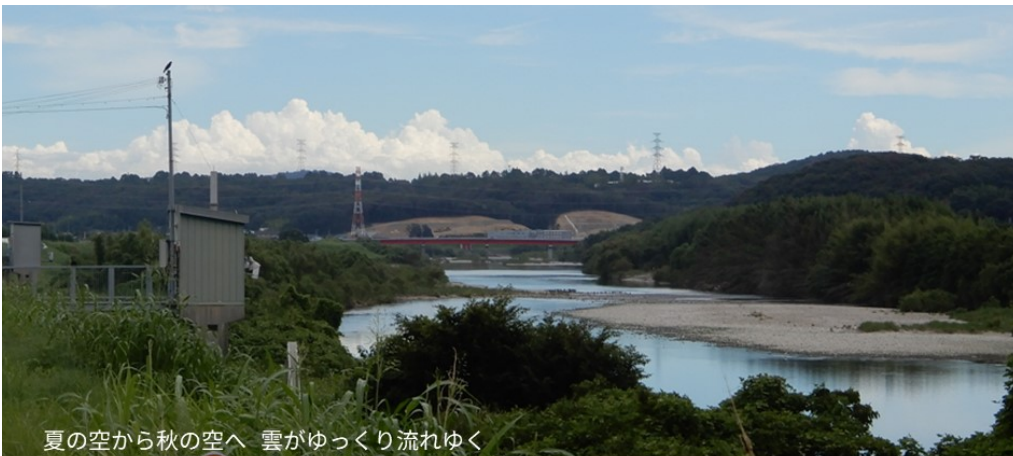
夏の空から秋の空へ 雲がゆっくり流れゆく

嬉しい鶯草との出会いができて、ルンルン。南網引集落から県道79号を南へ山間を抜けると、 四季折々原チャリ走らす東西に走る山陽自動車道沿いの県道118号福匂峠・小野/志方線の十字路 時間もまだ たっぷりある。小野町駅すみの駅蕎麦の昼食。少し引き返して志方の田園を駆けて、 朝来た道 加古川上荘橋から稲美の田園景色を神出の里から白川峠へ 久しぶりに風をきりつつ、西神戸・加古川西岸を駆けてる楽しい一日になりました。 2023.9.2. Mutsu Nakanishi