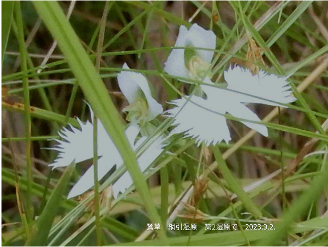
鶯草 網引湿原 第2湿原で 2023.9.2.