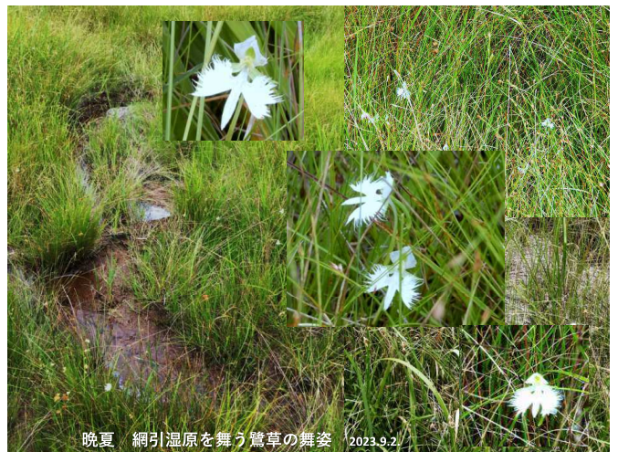
晩夏 網引湿原を舞う鶯草の舞姿 2023.9.2.