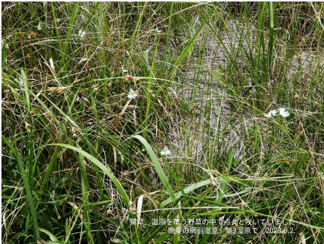
鶯草 湿原を舞う野草の中で点々と咲いていました 晩夏の網引湿原 第2湿原で、2023.9.2.