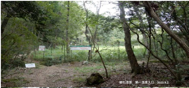
網引湿原 第一湿原入口 2023.9.2.