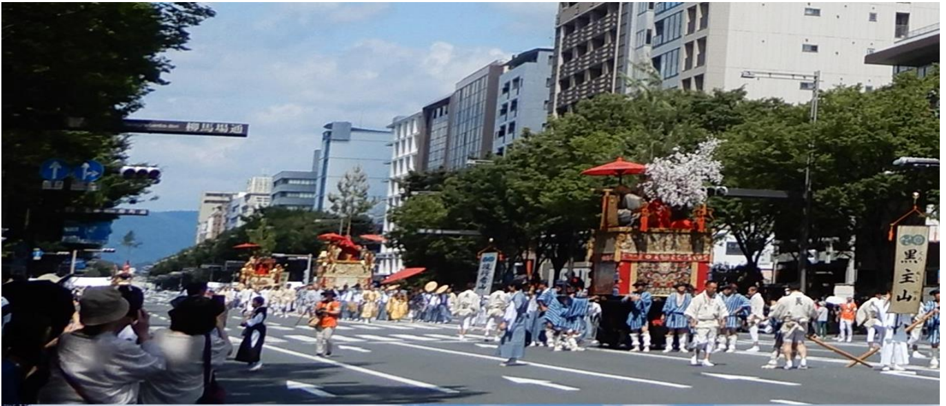
北観音山の後には前が動くのを待つ黒主山→役行者山→鈴鹿山→ 鷹山→ 大船鉾の巡行後半列 2023祇園後祭 柳馬場御池周辺で