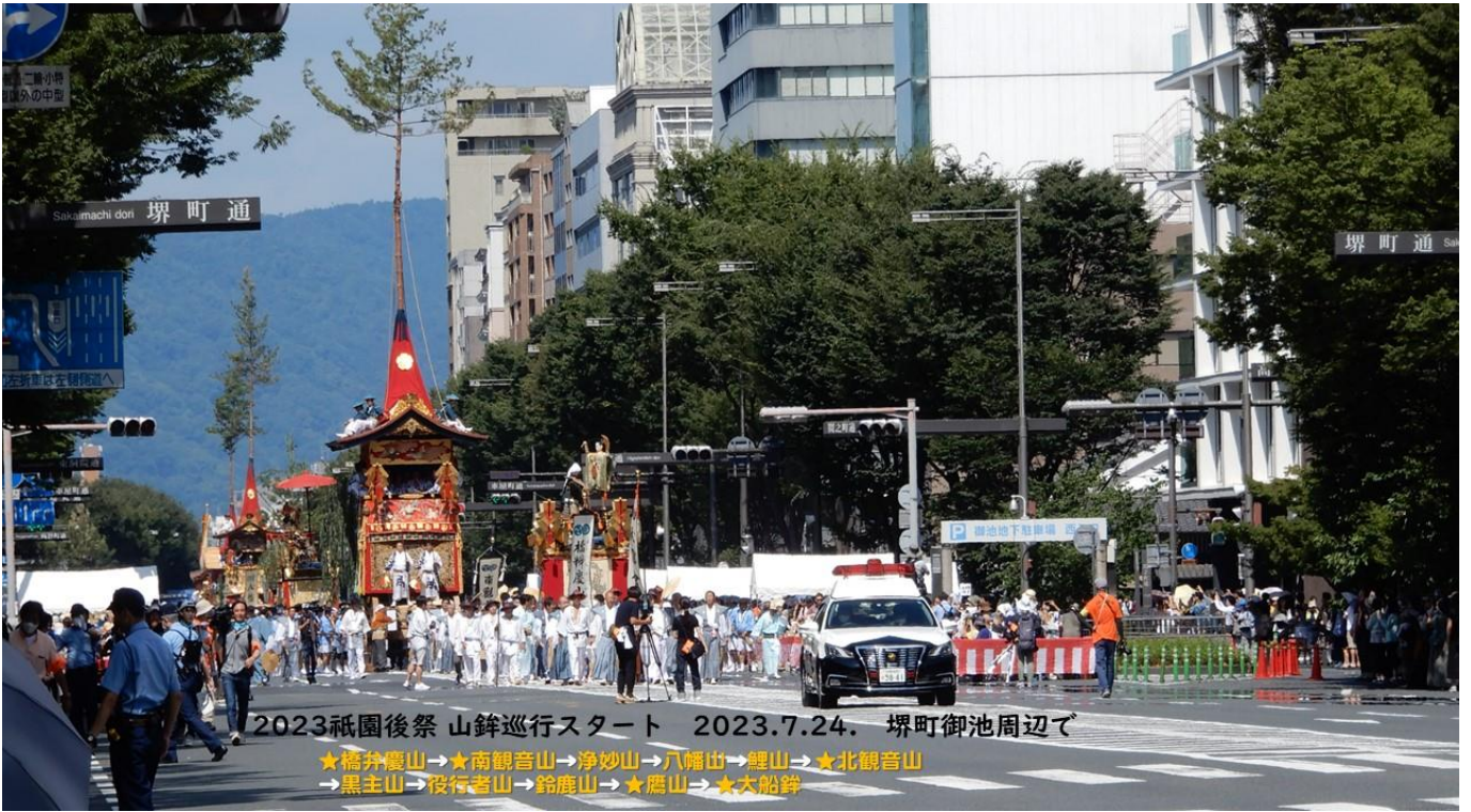
2023祇園後祭 山鉾巡行スタート 2023.7.24. 堺町御池周辺で

★橋弁慶山→★南観音山→浄妙山→八幡出→鯉山→★北観音山 →黒主山→役行者山→鈴鹿山→★鷹山→★大船鉾