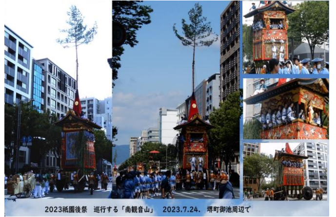
2023祇園後祭 巡行する「南観音山」 2023.7.24. 堺町御池周辺で