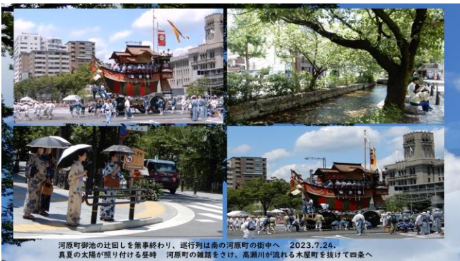
河原町御池の辻回しを無事終わり、巡行列は南の河原町の街中へ 2023.7.24. 真夏の太陽が照り付ける昼時 河原町の雑踏をさげ、高瀬川が流れる木屋町を抜けて四条へ