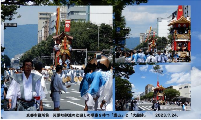
京都市役所前 河原町御池の辻回しの順番を待つ「嵐山」と「大船鉾」 2023.7.24.