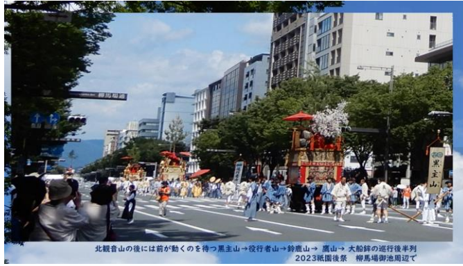
北観音山の後には前が動くのを待つ黒主山→役行者山→鈴鹿山→鷹山→大船鉾の進行後半列 2023祇園後祭 柳馬場御池周辺で