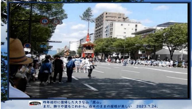
昨年巡行に復活した大きな山「鷹山」 まだ、飾りや塗もこれから。白木のままの屋根が美しい 2023.7.24.