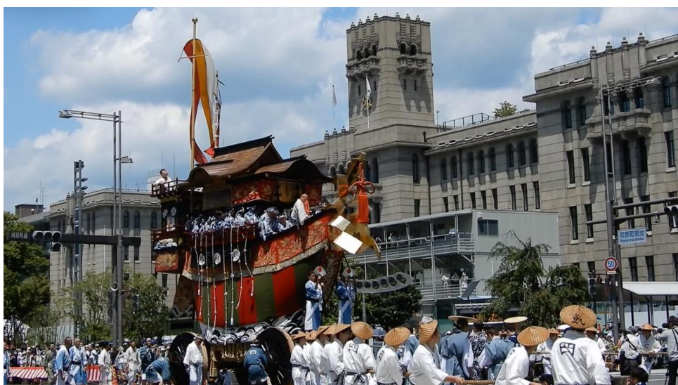
京都市役所前 「大船鉾」 辻回しのため 河原町三池の交差点 2023.7.24.