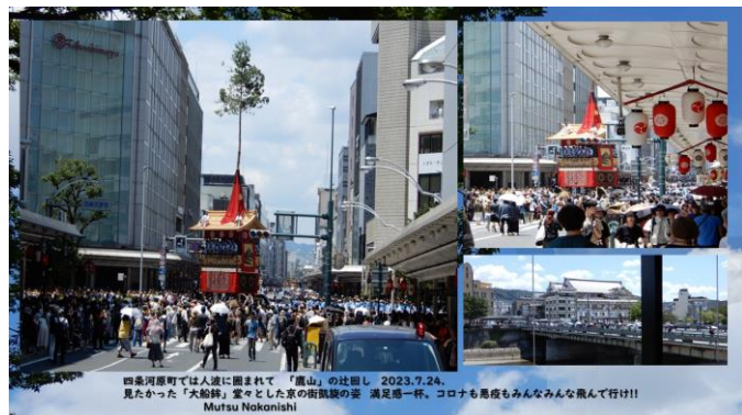
四條河原町では人波に囲まれて「嵐山」の辻回し 2023.7.24. 見たかった「大船鉾」堂々とした京の街並みの姿 満足感一杯。コロナも悪役もみんなを賑わせて行け!!