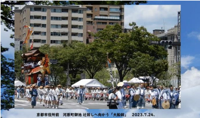
京都市役所前 河原町御池 辻回しへ向かう「大船鉾」 2023.7.24.