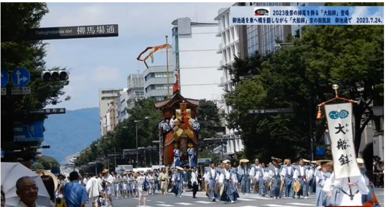
VIDEON 2023後祭の掉尾を飾る「大船鉾」登場 御池通を東へ橋を翻しながら「大船鉾」夏の街凱旋 御池通で 2023.7.24.