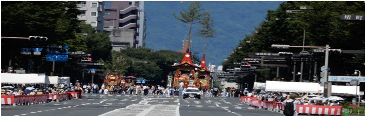
祇園祭 後祭 2023 山鉾巡行 巡行列

コロナが収まり、3年ぶりにみる山鉾巡行 コロナも悪疫もみんなみんな飛んで行け!!