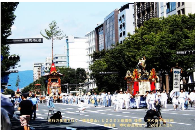
巡行の先頭を行く「橋弁慶山」と2023祇園祭 後祭 京の街車道行列 御池通 堺町御池周辺で、2023-7.24.

★橋弁慶山→★南観音山→浄妙山→八幡出→鯉山→★北観音山 →黒主山→役行者山→鈴鹿山→★鷹山→★大船鉾