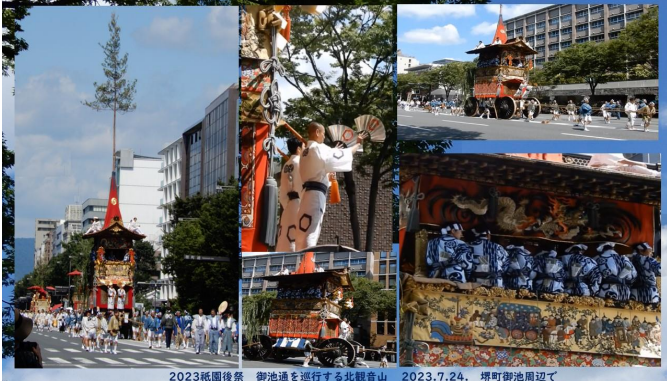
2023祇園後祭 御池通を巡行する北観音山 2023.7.24. 堺町御池周辺で