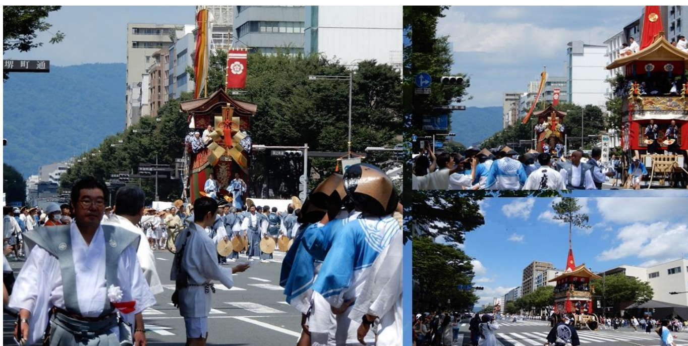
京都市役所前 河原町御池の辻回しの順番を待つ「鷹山」と「大船鉾」 2023.7.24.