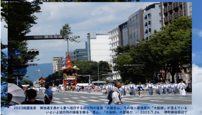
2023祇園後祭 御池通を西から東へ巡行する巡行列の後尾「北観音山」その後には最後尾の「大船鉾」が見えている いよいよ巡行列の挿尾を飾る「鷹山」「大船鉾」の登場だ 2023.7.24. 堺町御池周辺で