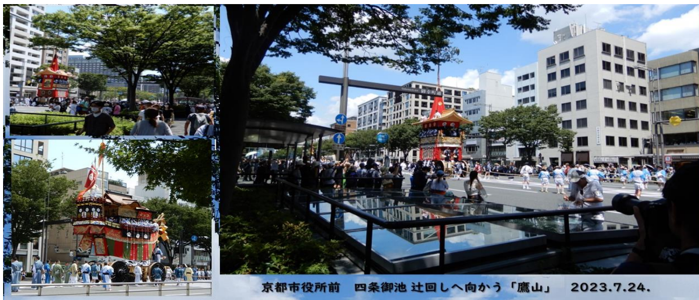
京都市役所前 四条御池 辻回しへ向かう「鷹山」 2023.7.24.