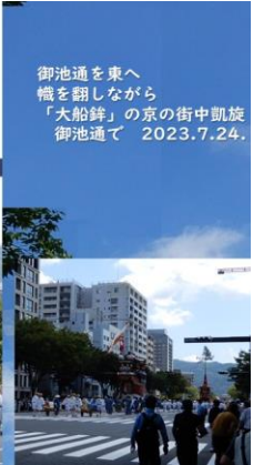
御池通を東へ 幟を翻しながら 「大船鉾」の京の街中凱旋 御池通で 2023.7.24.