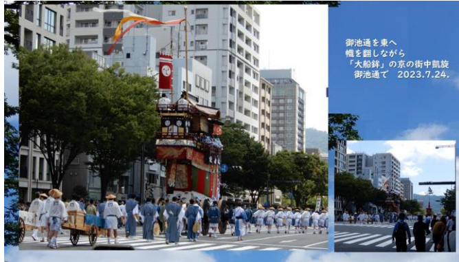
御池通を東へ轡を翻しながら 「大船鉾」の京の街中凱旋 御池通で 2023.7.24.