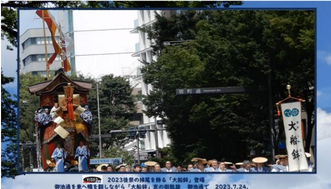
2023後祭の挿尾を飾る「大船鉾」登場 御池通を東へ轡を翻しながら「大船鉾」京の街中凱旋 御池通で 2023.7.24.