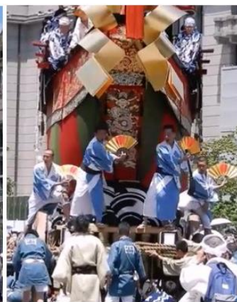
京都市役所前 「大船鉾」河原町御池の辻回し 2023.7.24.