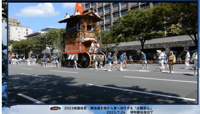
2023祇園後祭 御池通を西から東へ巡行する「北観音山」 2023.7.24. 堺町御池周辺で