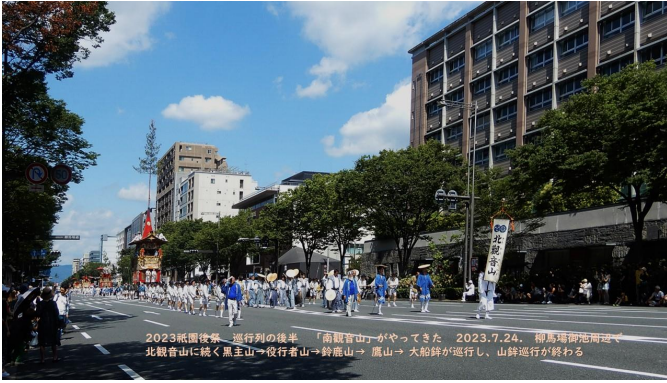
2023祇園後祭 巡行列の後半「南観音山」がやってきた 2023.7.24. 柳馬場御池周辺で 北観音山に続く黒主山→役行者山→鈴鹿山→鷹山→大船鉾が進行し、山鉾巡行が終わる