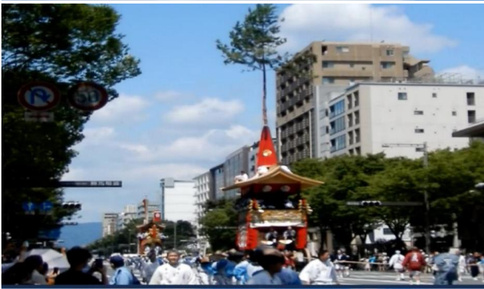
VIDEON 昨年巡行に復帰した大きな山「鷹山」 まだ、飾りや塗もこれから。白木のままの屋根が美しい 2023.7.24.