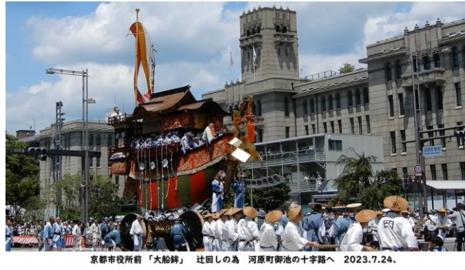
京都市役所前「大船鉾」 辻回しの為 河原町御池の十字路口へ 2023.7.24.