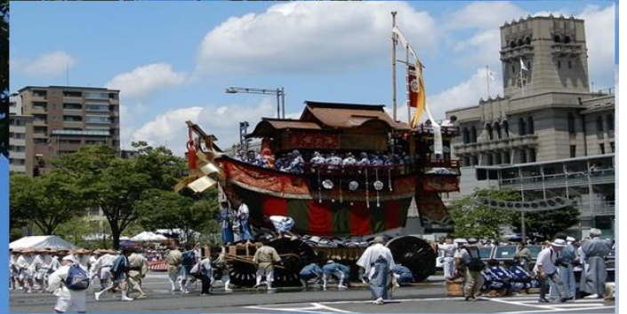
河原町御池の辻回しを無事終わり、巡行列は南の河原町の街中へ 2023.7.24. 真夏の太陽が照り付ける昼時 河原町の雑踏をさげ、高瀬川が流れる木屋町を抜けて四条へ