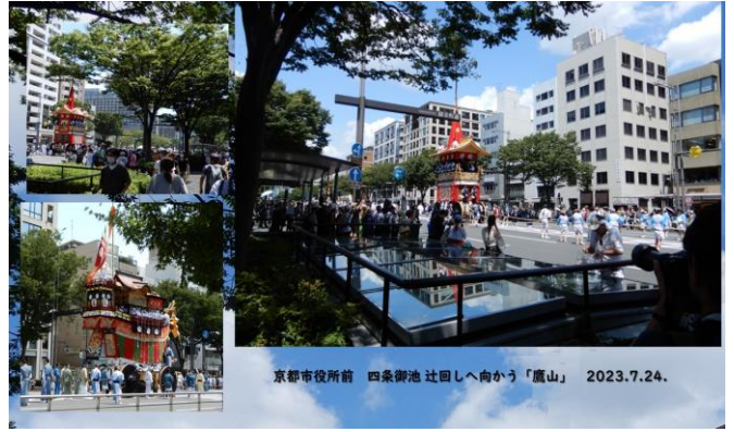
京都市役所前 四條御池 辻回しへ向かう「嵐山」 2023.7.24.