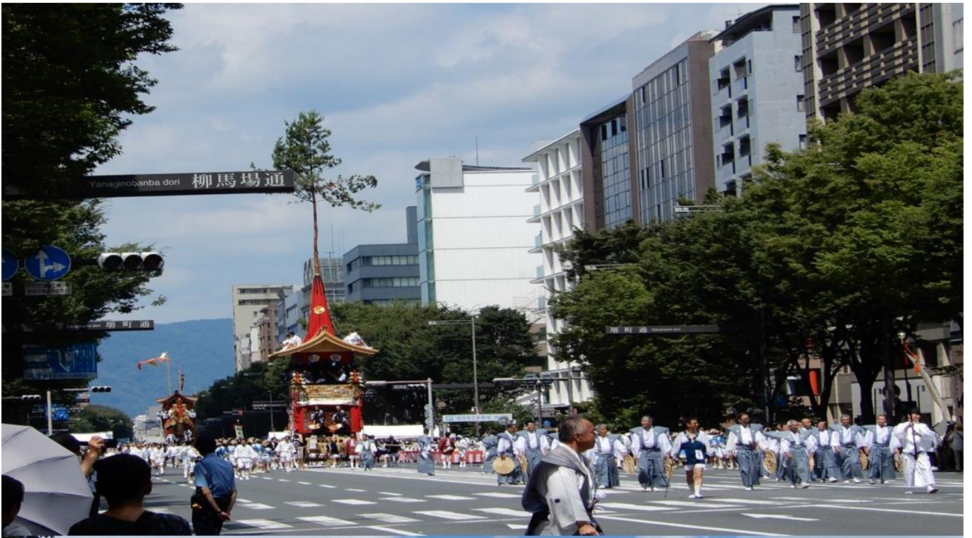
2023祇園後祭 いよいよ巡行列の掉尾を飾る「鷹山」「大船鉾」の登場だ 2023.7.24. 堺町御池周辺で