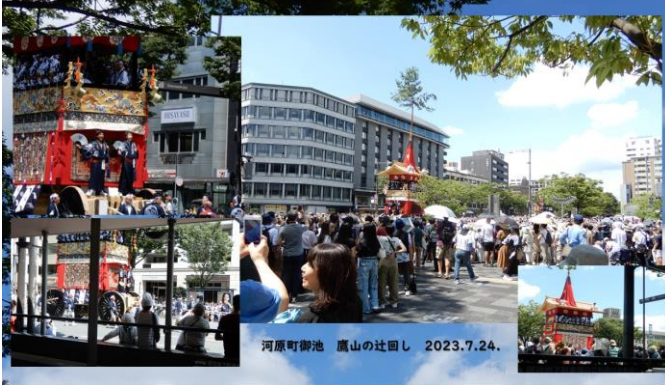
河原町御池 嵐山の辻回し 2023.7.24.