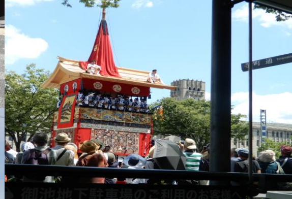
河原町御池 鷹山の辻回し 2023.7.24.