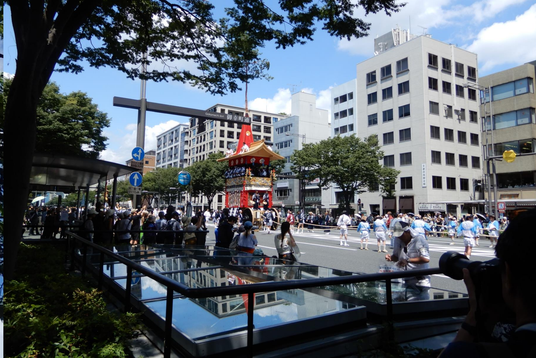
京都市役所前 四條御池 辻回しへ向かう「鷹山」 2023.7.24.