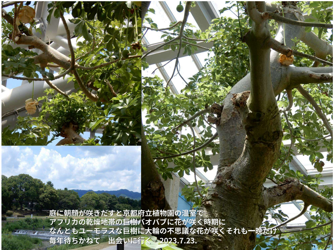
庭に朝顔が咲きだすと京都府立植物園の温室で アフリカの乾燥地帯の巨樹バオバブに花が咲く時期に なんともユーモラスな巨樹に大輪の不思議な花が咲くそれも一晩だけ 毎年待ちかねて 会いに行く 2023.7.23.