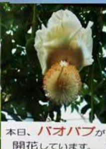
本日、バオバブが 開花しています。