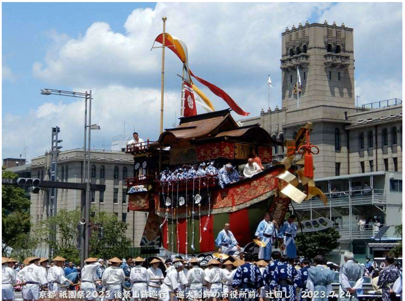
京都 祇園祭2023 後祭山鉾巡行 巡大船鉾の市役所前 辻回し 2023.7.24.