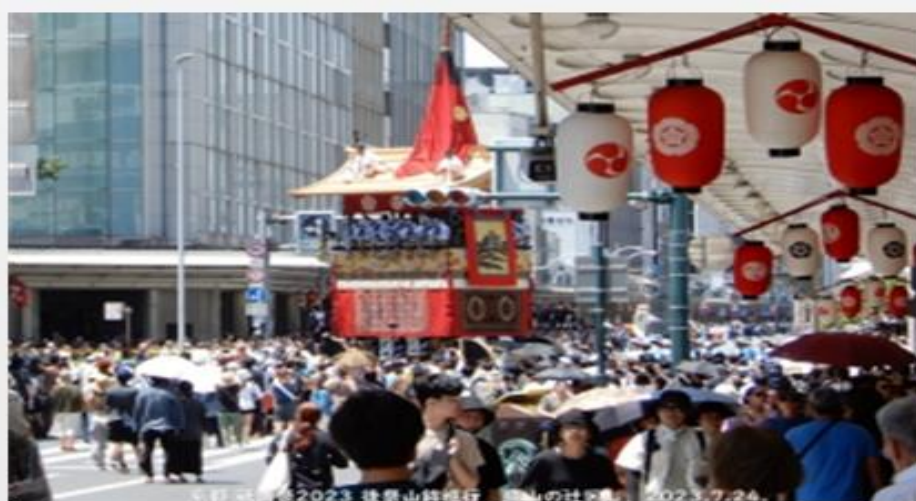
2023 後祭山鉾巡行 観大御所の春役所前 2023.7.24.