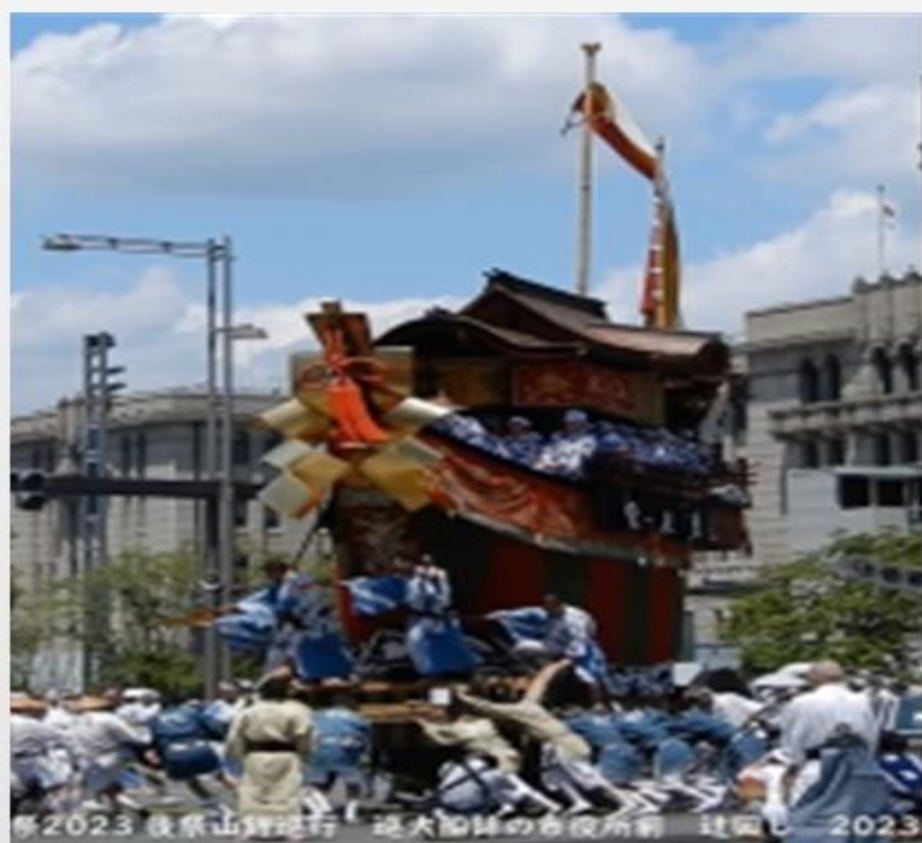
2023 後祭山鉾巡行 観大御所の春役所前 2023.7.24.