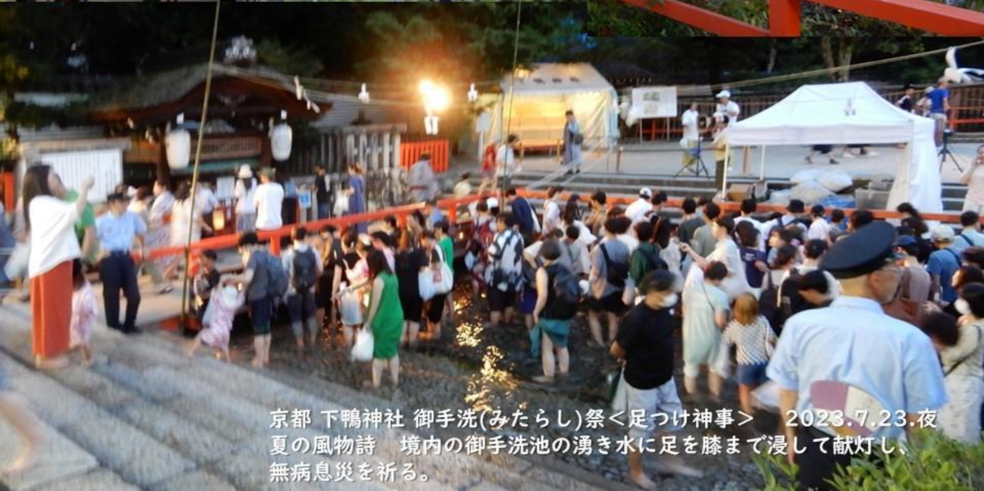
京都 下鴨神社 御手洗(みたらし)祭<足つけ神事> 2023.7.23.夜 夏の風物詩 境内の御手洗池の湧き水に足を膝まで浸して献灯し、 無病息災を祈る。