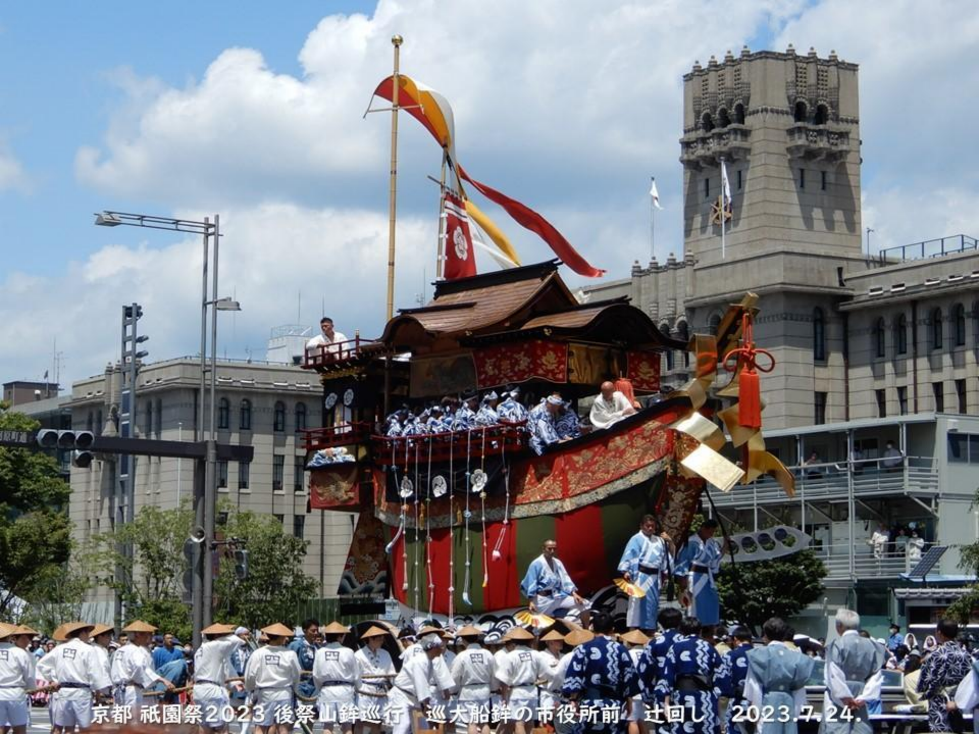
京都 祇園祭2023 後祭山鉾巡行 巡大船鉾の市役所前 辻回し 2023.7.24.