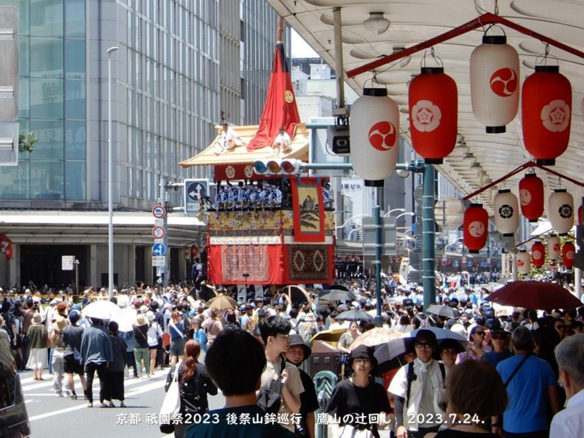
京都 祇園祭2023 後祭山鉾巡行 鷹山の辻回し 2023.7.24.