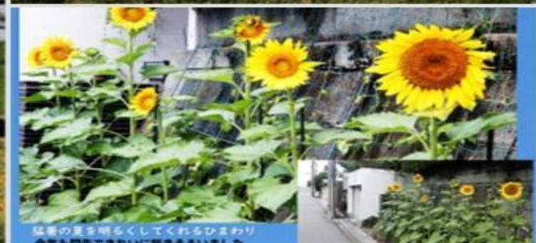
炎夏の夏を明るくしてくれるひまわり 今年も自然ときれいに咲きそろいました