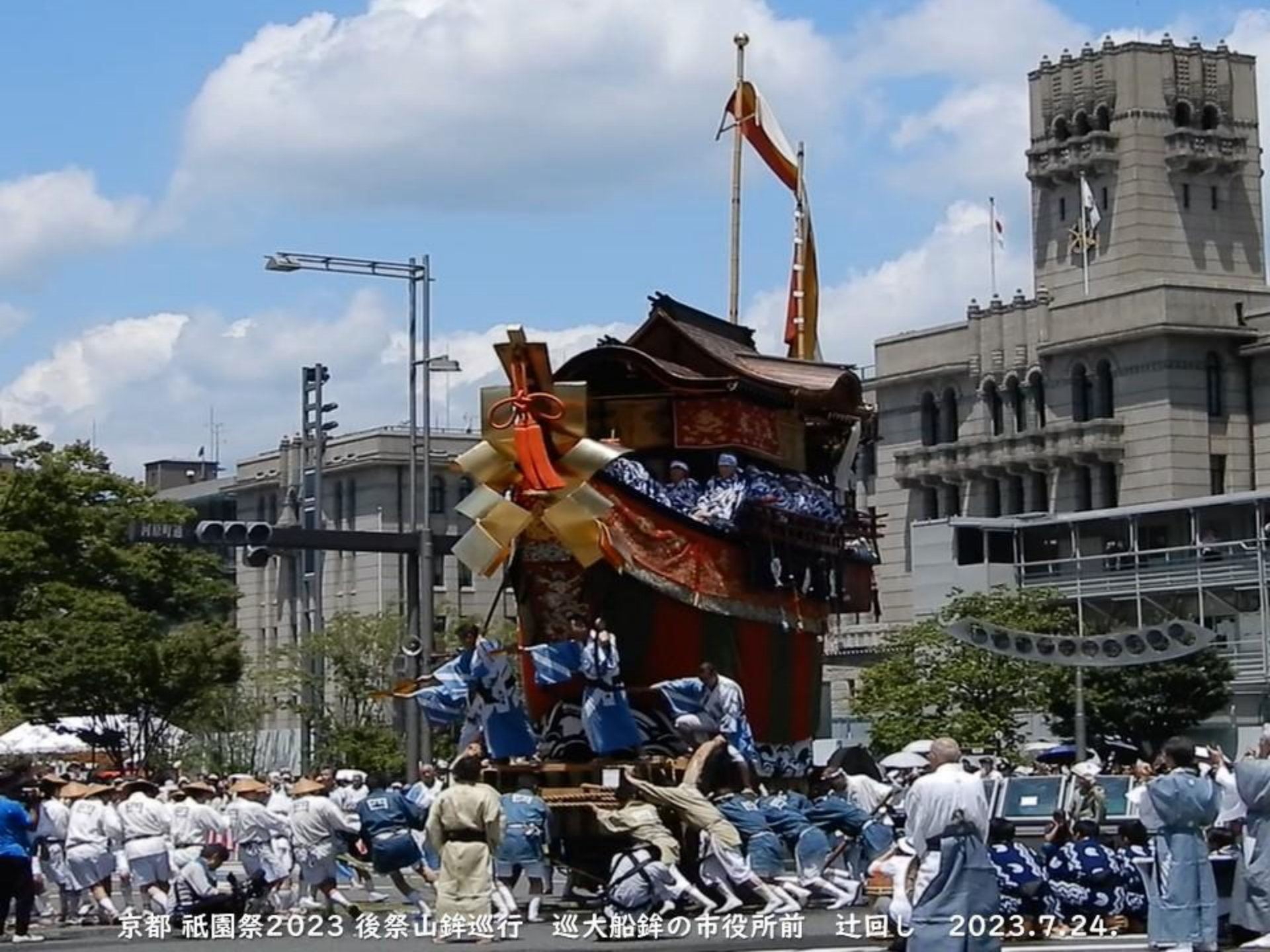
京都 祇園祭2023 後祭山鉾巡行 巡大船鉾の市役所前 辻回し 2023.7.24.