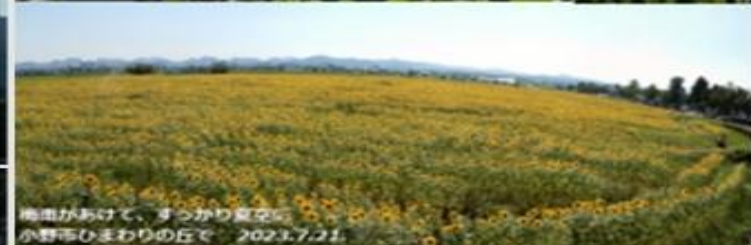
梅雨があけて、すっかり夏空に 小野市ひまわりの丘で 2023.7.21