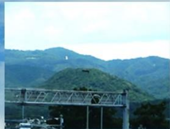
梅雨明け目前 夏の日差しに 武庫川 甲武橋で 2023.7.18. 久し振りに眺める六甲を背にした甲山