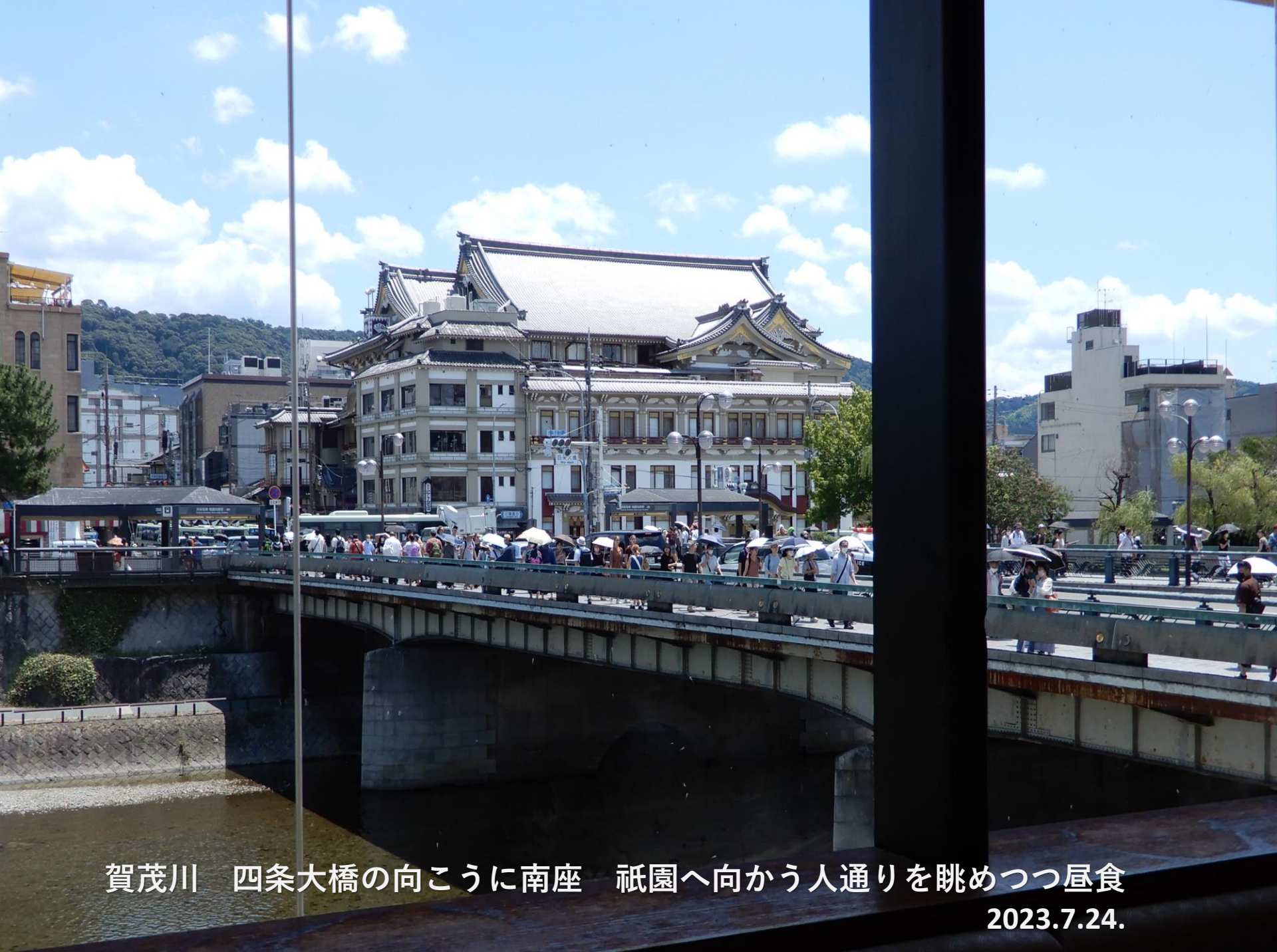
賀茂川 四條大橋の向こうに南座 祇園へ向かう人通りを眺めつつ昼食