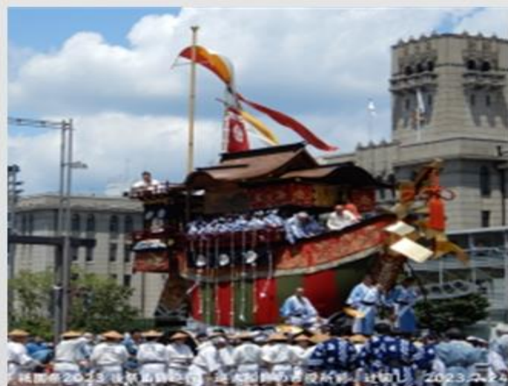
2023 後祭山鉾巡行 観大御所の春役所前 2023.7.24.