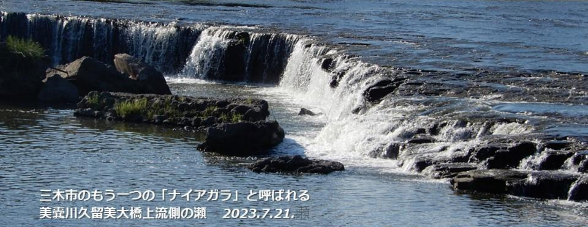
三木市のもう一つの「ナイアガラ」と呼ばれる 美嚙川久留美大橋上流側の瀬 2023.7.21.