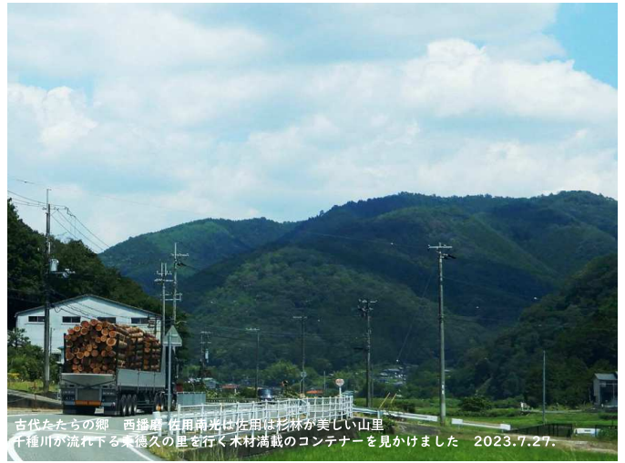
古代たたら郷 西播磨 佐用南光は古里杉林が美しい山里 千種川が流れる東徳久の里を行く木材満載のコンテナ車を見かけました 2023.7.27.