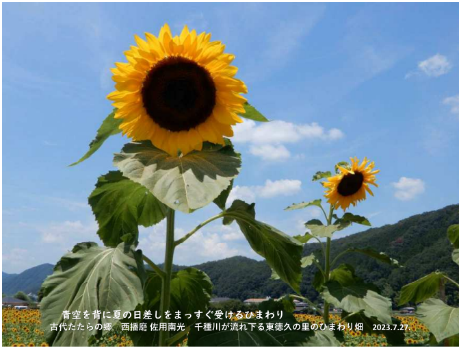
青空を背に夏の日差しをまっすぐ受けるひまわり 古代たたら郷 西播磨 佐用南光 千種川が流れ下る東徳久の里のひまわり畑 2023.7.27.