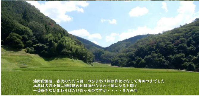
漆野段集落 古代のたたら跡 のひまわり畑は作付けなして青田のまでした 本年は8月中旬に街道筋の休耕田がひまわり畑になると聞く 一番好きなひまわりばたけだったので、・・・また来年