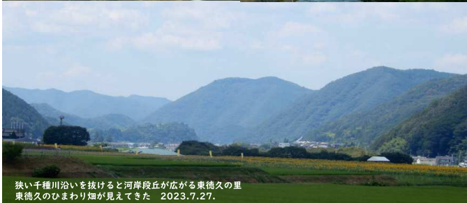
狭い千種川沿いを抜ける河岸段丘が広がる東徳久の里 東徳久のひまわり畑が見えてきた 2023.7.27.