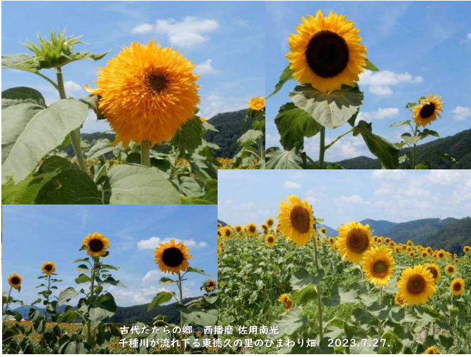
古代たたら郷 西播磨 佐用南光 千種川が流れ下る東徳久の里のひまわり畑 2023.7.27.