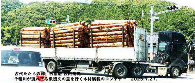
古代たたら郷 西播磨 佐用南光 千種川が流れる東徳久の里を行く木材満載のコンテナ車 2023.7.27.