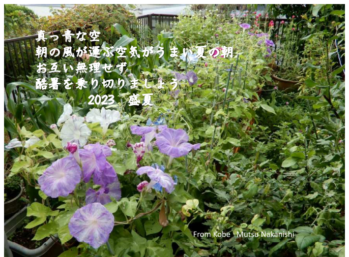
真っ青な空 朝の風が運ぶ空気がうまい夏の朝 お互い無理せず 酷暑を乗り切りましょう 2023 盛夏