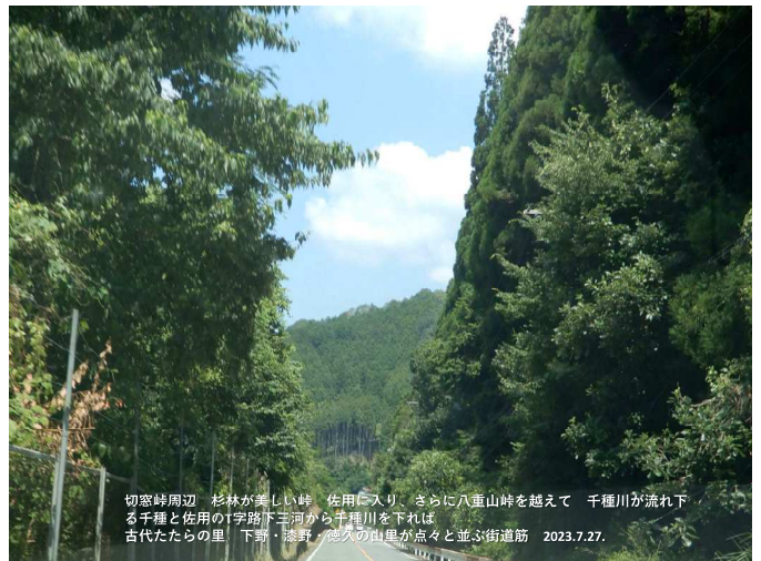
切窓峠周辺 杉林が美しい峠 佐用に入り、さらに八重山峠を越えて 千種川が流れ下る千種と佐用のT字路下三河から千種川を下れば 古代たたら郷 下野・漆野・徳久の山々が点々と並ぶ街道筋 2023.7.27.

この時にかかる手前 青木の里にいつもスイートコーンの店が出る。 何度か買ったことがあり、ここが一番 まだ、早朝なのにもう店が出ている。 ラッキー。 帰りにでもよいのですが、昼には売り切れに。 また、佐用でも買えるのですが、孫にまず甘い朝採れ確保する。 今回は帰る時には もう売り切れてしまっていました。 みんなよく知っているのです。