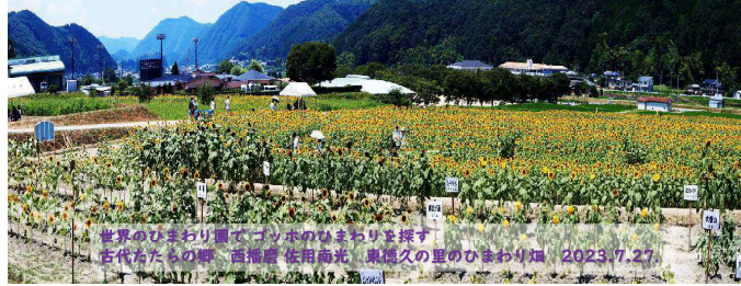
世界のひまわり園でゴッホのひまわりを探す 古代たたら郷 西播磨 佐用南光 東徳久の里のひまわり畑 2023.7.27.