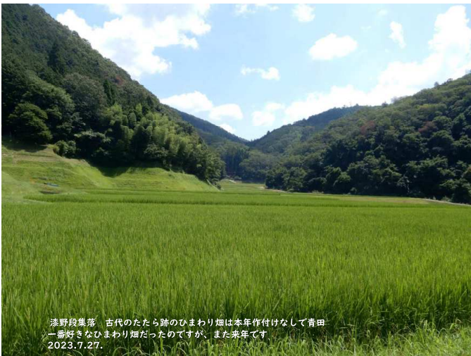
漆野段集落 古代のたたら跡のひまわり畑は本年作付けなして青田 一番好きなひまわり畑だったので、また来年です 2023.7.27.