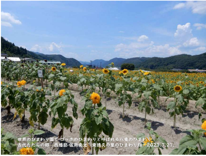
世界のひまわり園でゴッホのひまわりと呼ばれる八重のひまわり 古代たたら郷 西播磨 佐用南光 東徳久の里のひまわり畑 2023.7.27.