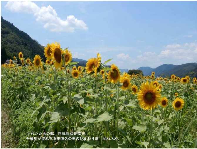
古代たたら郷 西播磨 佐用南光 千種川が流れ下る東徳久の里のひまわり畑 2023.7.27.