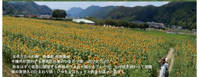
古代たたら跡の郷 西播磨 佐用南光 千種川が流れる東徳久の里のひまわり畑 2023.7.27 昨年はずく南西に隣接する林間のひまわり畑が主でしたが、もう咲き終わって閉園 東の東徳久のひまわり畑 いつもとはちょっと角度が違った風景も