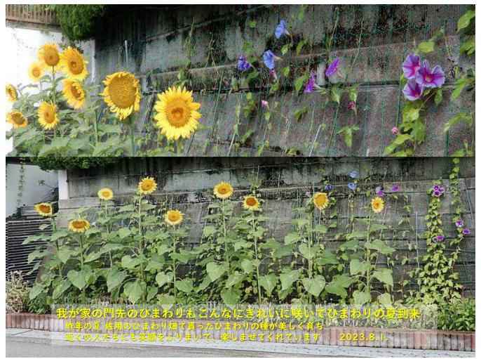
我が家の門先のひまわりもこんなにきれいに咲いてひまわりの夏到来 昨年の夏 佐用のひまわり畑でもらったひまわりの種が美しく育ち 近くの人も笑顔が溢れています。楽しんでくれています 2023.8.1