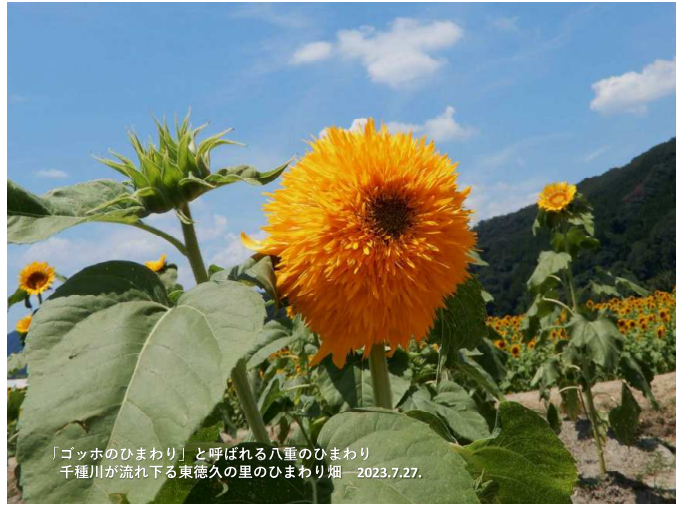
「ゴッホのひまわり」と呼ばれる八重のひまわり 千種川が流れ下る東徳久の里のひまわり畑 2023.7.27.