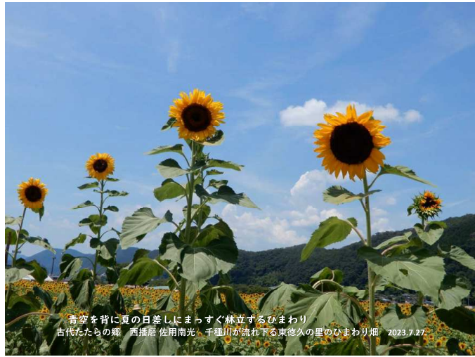
青空を背に夏の日差しにまっすぐ林立するひまわり 古代たたら郷 西播磨 佐用南光 千種川が流れ下る東徳久の里のひまわり畑 2023.7.27.