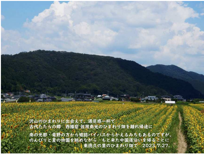
沢山のみまわりに出会えて、満足感一杯で 古代たたら郷・西播磨 佐用南光のみまわり畑を離れ帰途に 南の光部・竜野の方から姫路バイパスからかえるみちもあるのですが、 のんびりと夏の田園を眺めながら、もと来た中国道沿いを帰ることに 東徳久の里のみまわり畑で 2023.7.27.