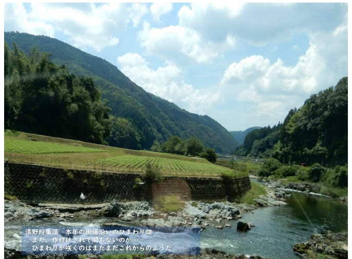
漆野段集落 本年の街道沿いのひまわり畑 また、作付けされて間もないのか、 ひまわりが咲くのはまだまだこれからようだ。