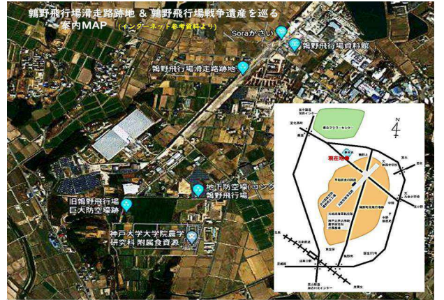
【参考】和鉄の道2022 加西市鶯野飛行場跡地と戦争遺産の諸施設の紹介 by Mutsu https://infokkna2.com/ironroad2/2022htm/walk19/R0410EHarimaphotoC.pdf 非常にシンプルに説明書・道標等の類がないので、戦争の悲惨さがない舞台 自分なりにイメージ冷静に受け止められるのがお勧めです。