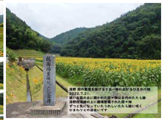
<昨年2022年夏の漆野段集落 たたら跡のひまわり畑> 今年は残念ながら青田が広がっていました