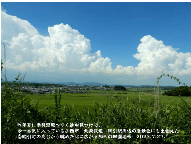
昨年夏に南引温泉へゆく途中見つけて、 今一番気に入っている加西市 北条鉄道 南網駅周辺の夏景色にも出会えた 南網引町の高台から眺めた北に広がる加西の田園地帯 2023.7.27.