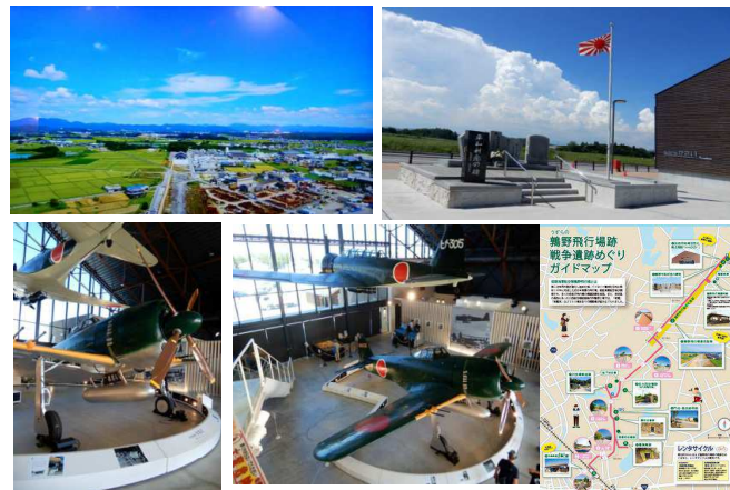
【参考】和鉄の道2022 よく整備保存されている加西市鶯野飛行場跡地と戦争遺産の諸施設 by Mutsu Nakanishi https://infokkna2.com/ironroad2/2022htm/walk19/R0410EHarimaphotoC.pdf