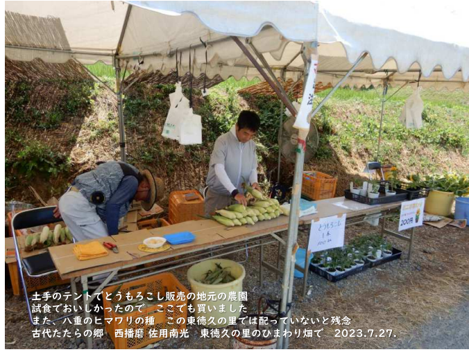
土手のテントでとうもろこし販売の地元の農園 試食でおいしかったので、ここでも買いました また、八重のヒマワリの種 この東徳久の里では配っていないと残念 古代たたら郷 西播磨 佐用南光 東徳久の里のひまわり畑 2023.7.27.