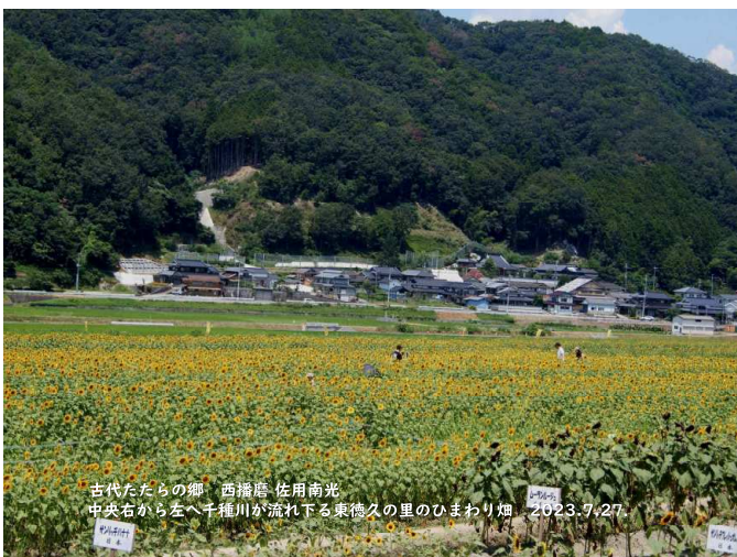
古代たたら跡の郷 西播磨 佐用南光 中央右から左へ千種川が流れ下る東徳久の里のひまわり畑 2023.7.27