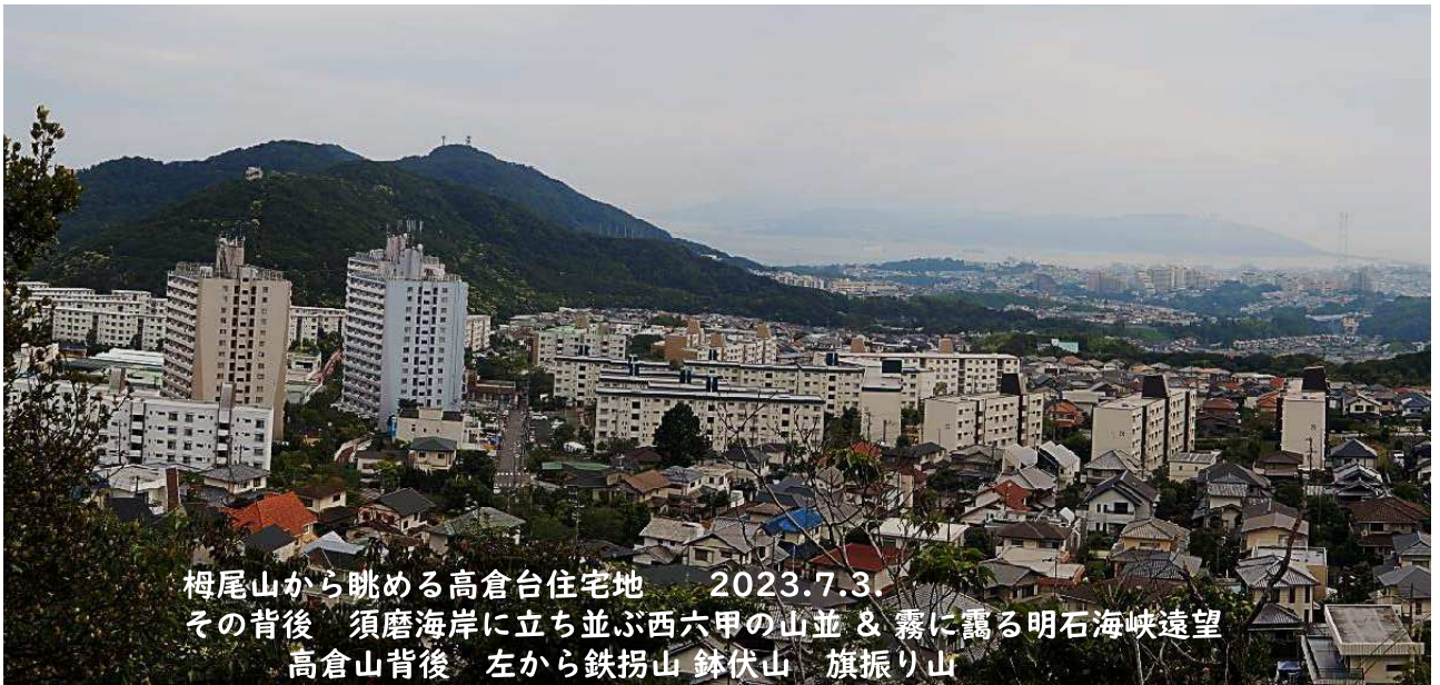
樽尾山から眺める高倉台住宅地 2023.7.3. その背後 須磨海岸に立ち並ぶ西六甲の山並 & 霧に靄る明石海峡遠望 高倉山背後 左から鉄拐山 鉢伏山 旗振り山