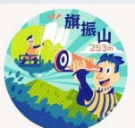
旗振山 2023.06.23 15:47:32