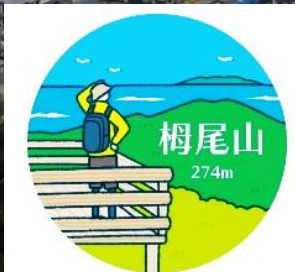
梅尾山 2022.08.15 10:19:34