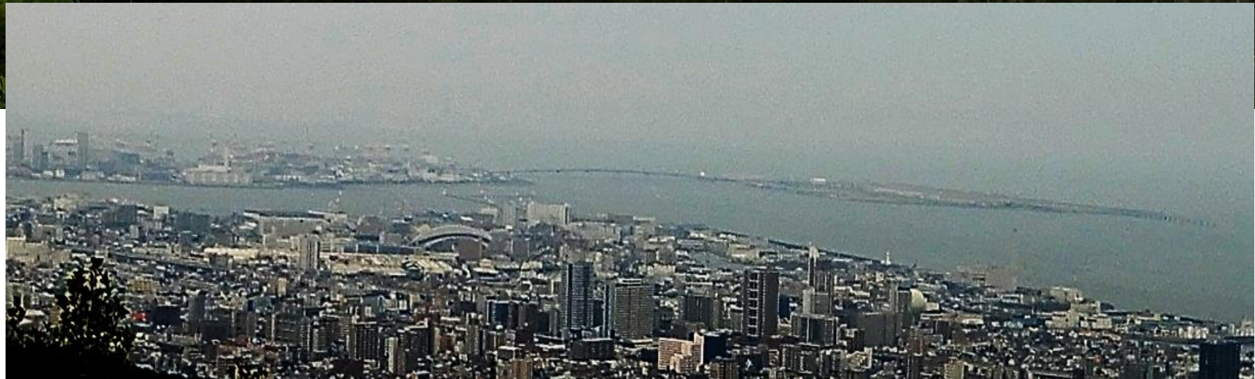
梅尾山山頂展望台より眺める南東側 神戸の街 2023.7.3.