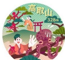
高取山 (六甲) 2023.06.27 17:35:13