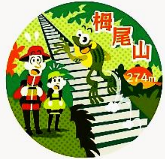
梅尾山 2023.07.03 16:21:45

7月の初め、梅尾山山腹下の横尾道から眺める山並 2023.7.1. 左手前から おらが山(高倉山)・鉄拐山・鉢伏山・旗振山