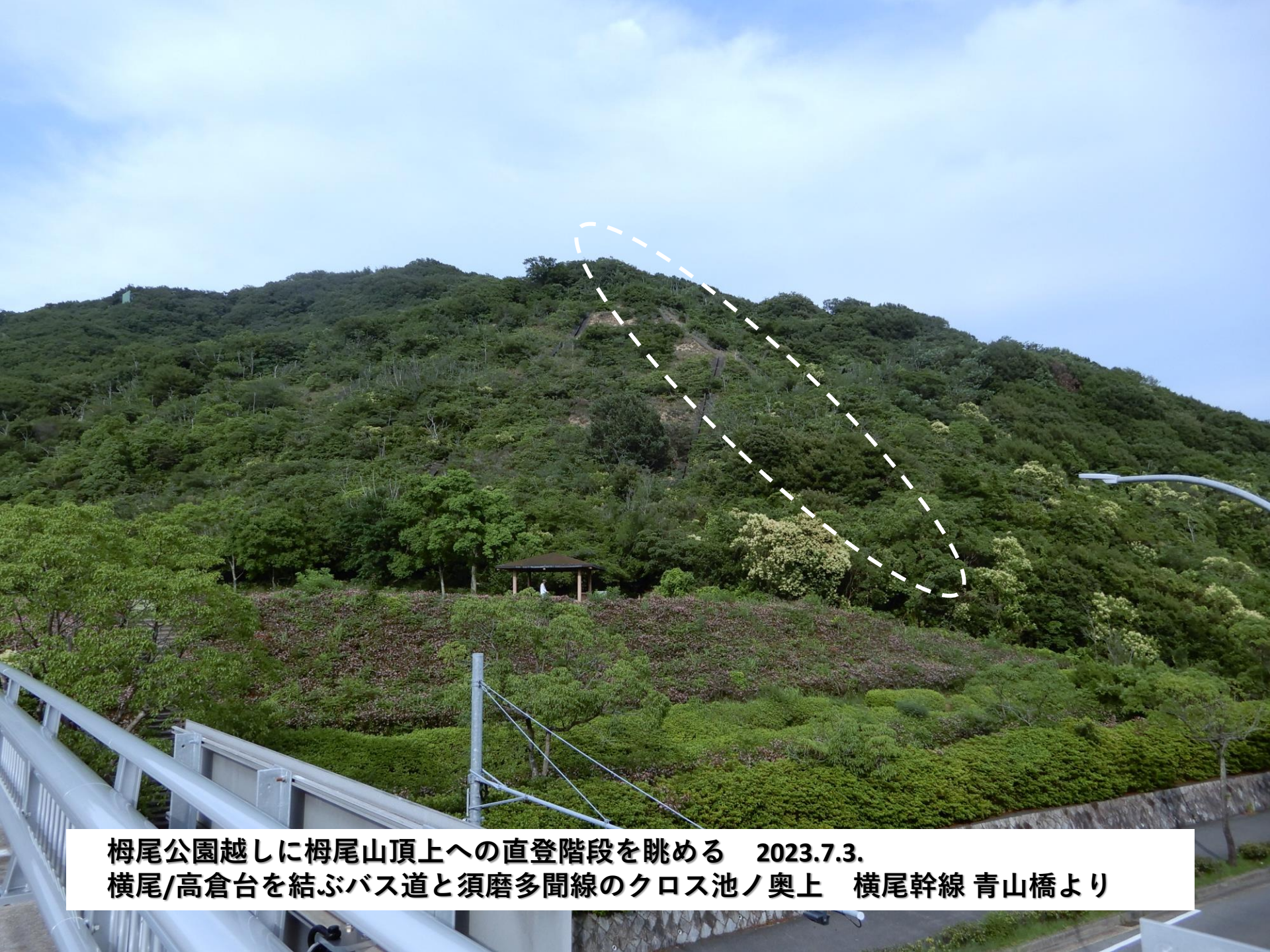
柁尾公園越しに柁尾山頂上への直登階段を眺める 2023.7.3. 横尾/高倉台を結ぶバス道と須磨多聞線のクロス池ノ奥上 横尾幹線 青山橋より