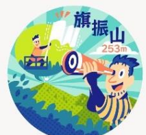
旗振山 2023.06.23 15:47:32