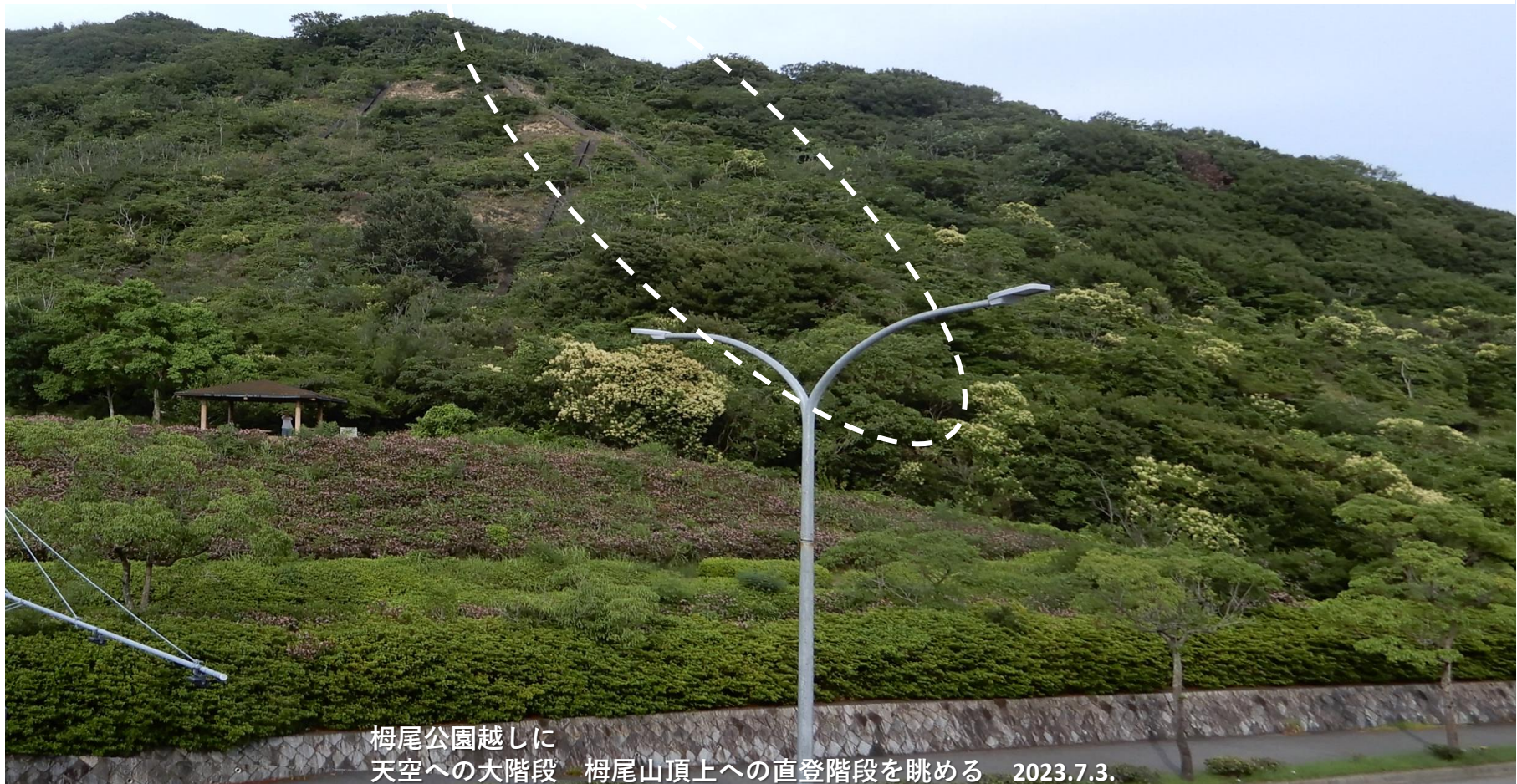
梅尾公園越しに 天空への大階段 梅尾山頂上への直登階段を眺める 2023.7.3.