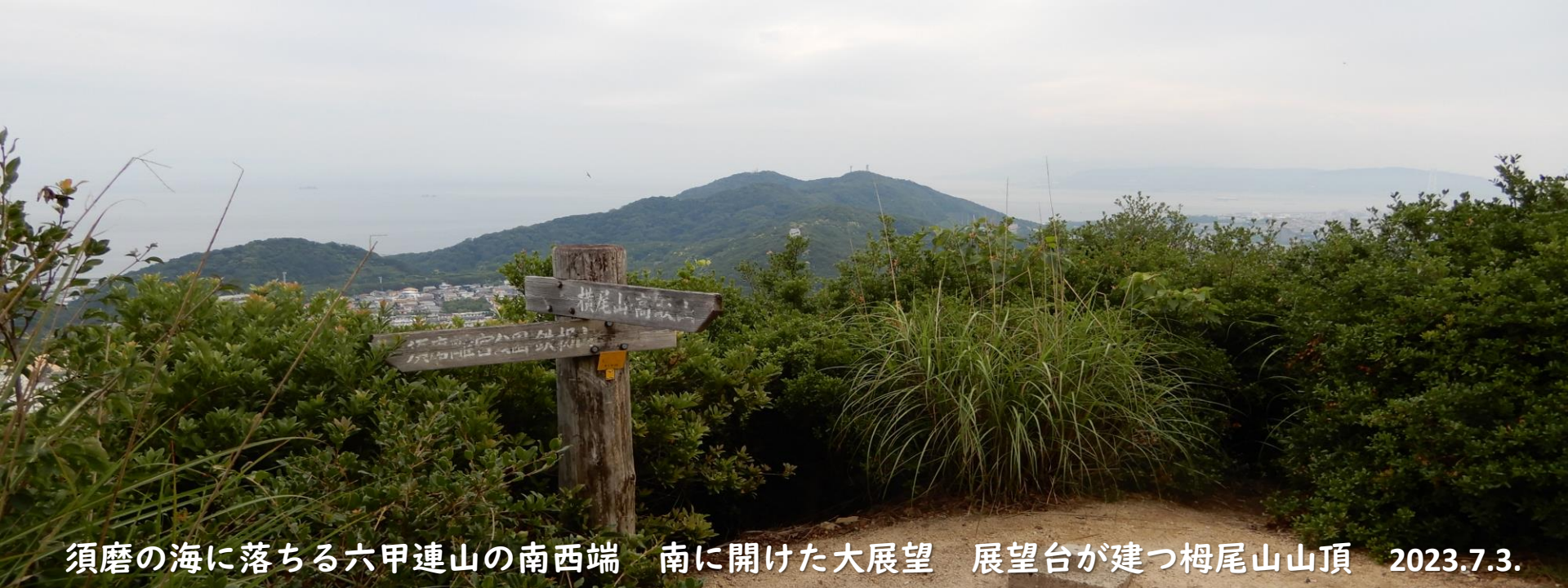
須磨の海に落ちる六甲連山の南西端 南に開けた大展望 展望台が建つ梅尾山山頂 2023.7.3.