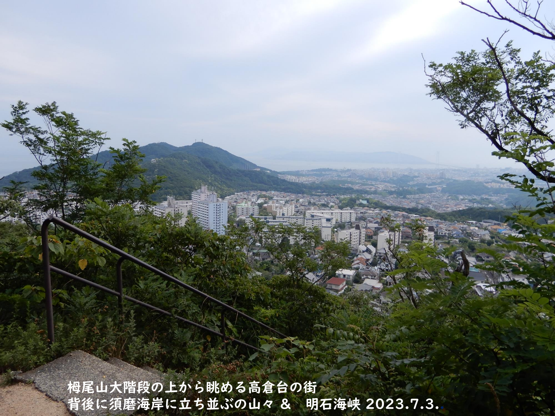
梅尾山大階段の上から眺める高倉台の街 背後に須磨海岸に立ち並ぶの山々 & 明石海峡 2023.7.3.