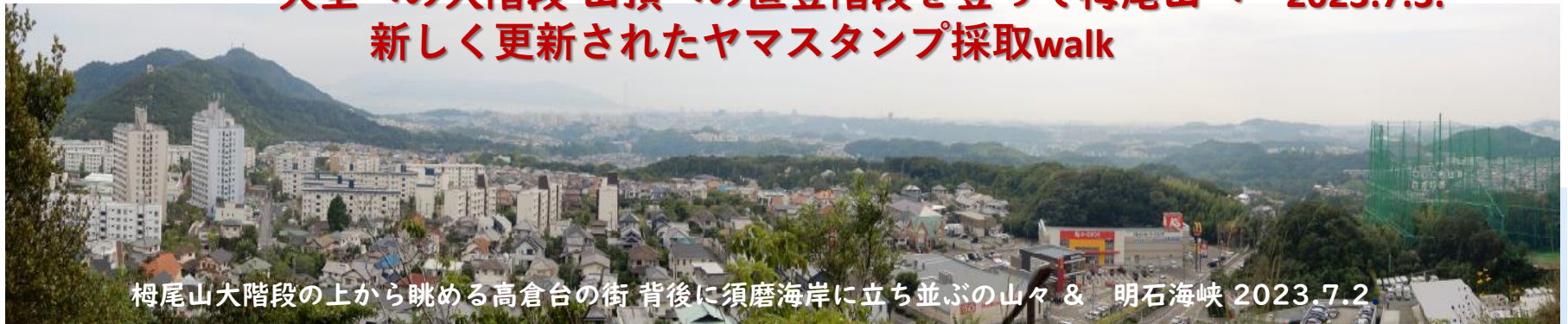
梅尾山大階段の上から眺める高倉台の街 背後に須磨海岸に立ち並ぶの山々 & 明石海峡 2023.7.2