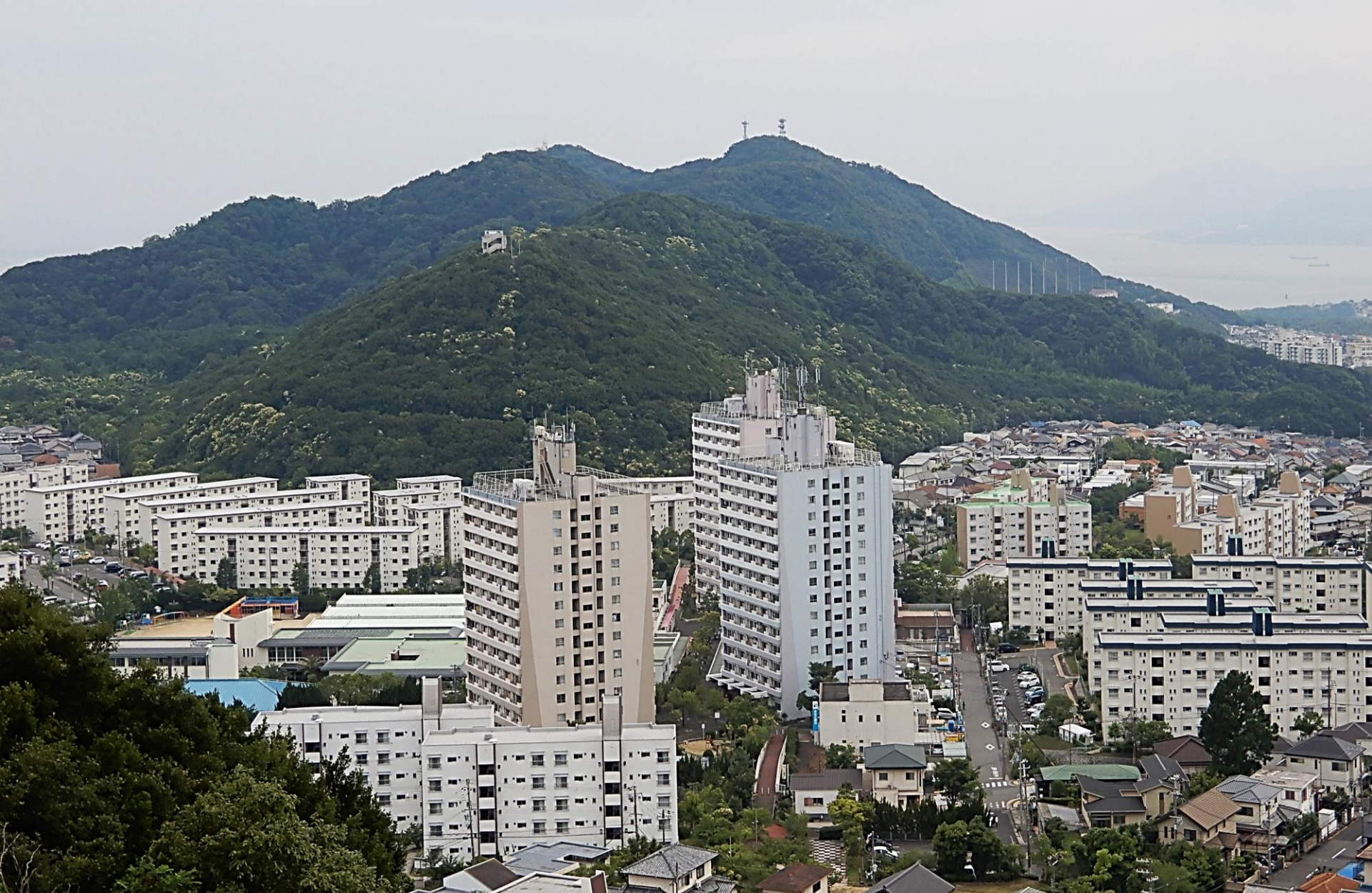
梅尾山大階段上から眺める高倉台の街 & 須磨海岸に立ち並ぶの山々 2023.7.3. 直登階段と展望台が見えるおらが山(高倉山)の後ろ 左から鉄拐山 鉢伏山 旗振り山