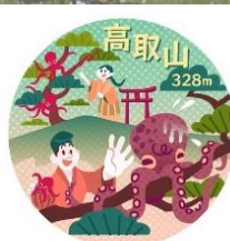
高取山 (六甲) 2023.06.27 17:35:13