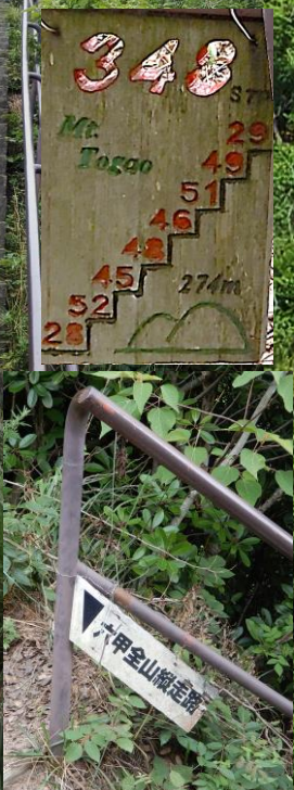
横尾道から眺める梅尾山の直登大階段 2023.7.3. 西六甲の縦走路 何時も階段に姿が見える 今日も