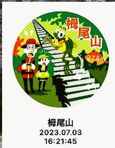
梅尾山 2023.07.03 16:21:45

梅尾山のヤマスタンプはやっぱり天空への直登大階段!! 新しいヤマスタンプを採取しました