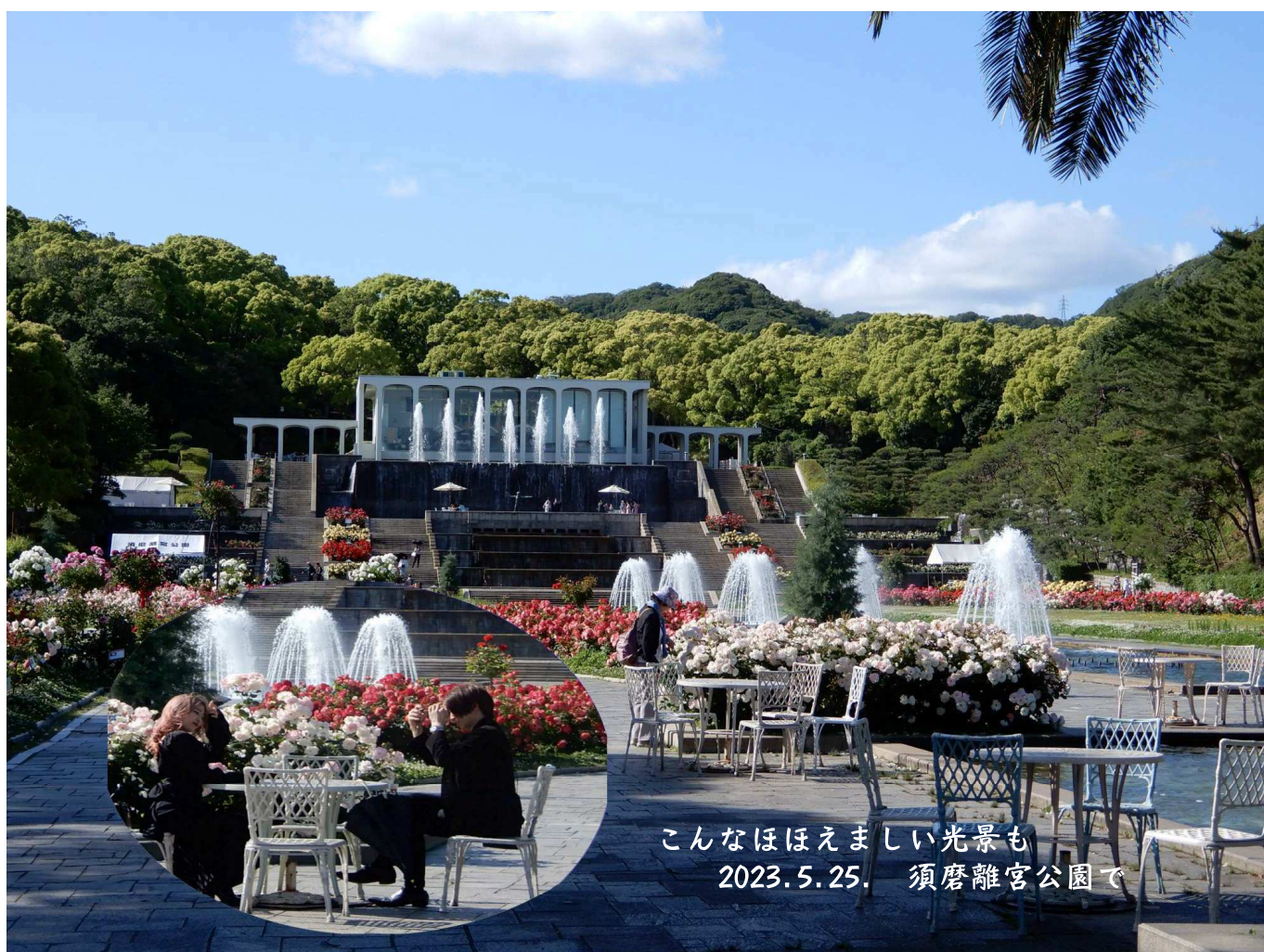
こんなほほえましい光景も 2023.5.25. 須磨離宮公園で