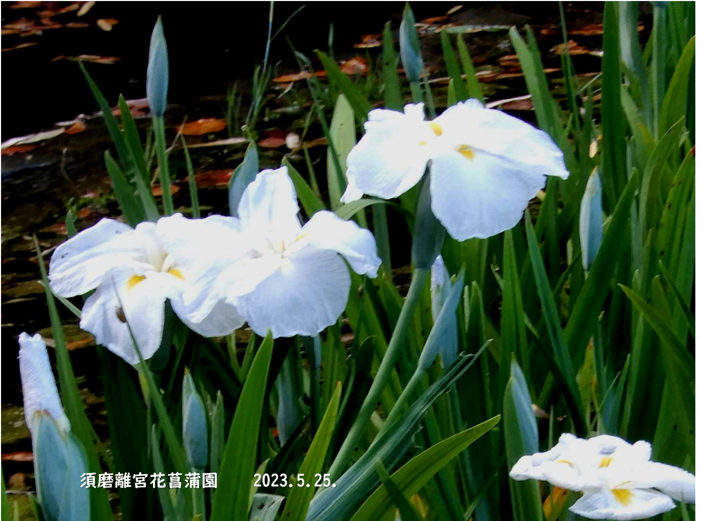
須磨離宮花菖蒲園