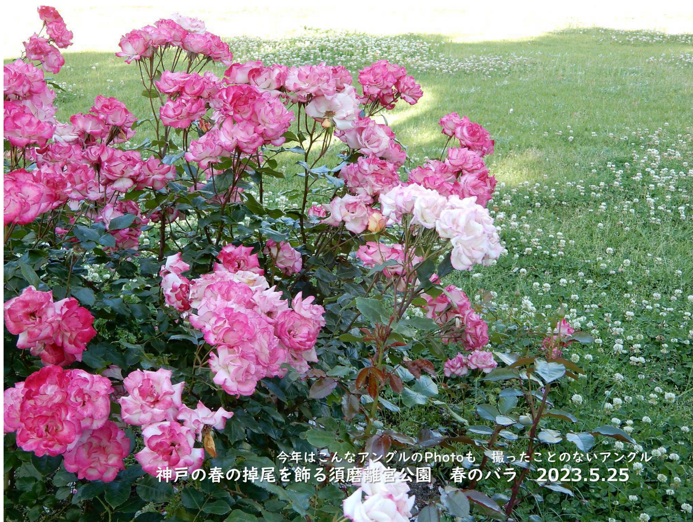
今年はこのアングルのPhotoも 撮ったことのないアングル 神戸の春の掉尾を飾る須磨離宮公園 春のバラ 2023.5.25