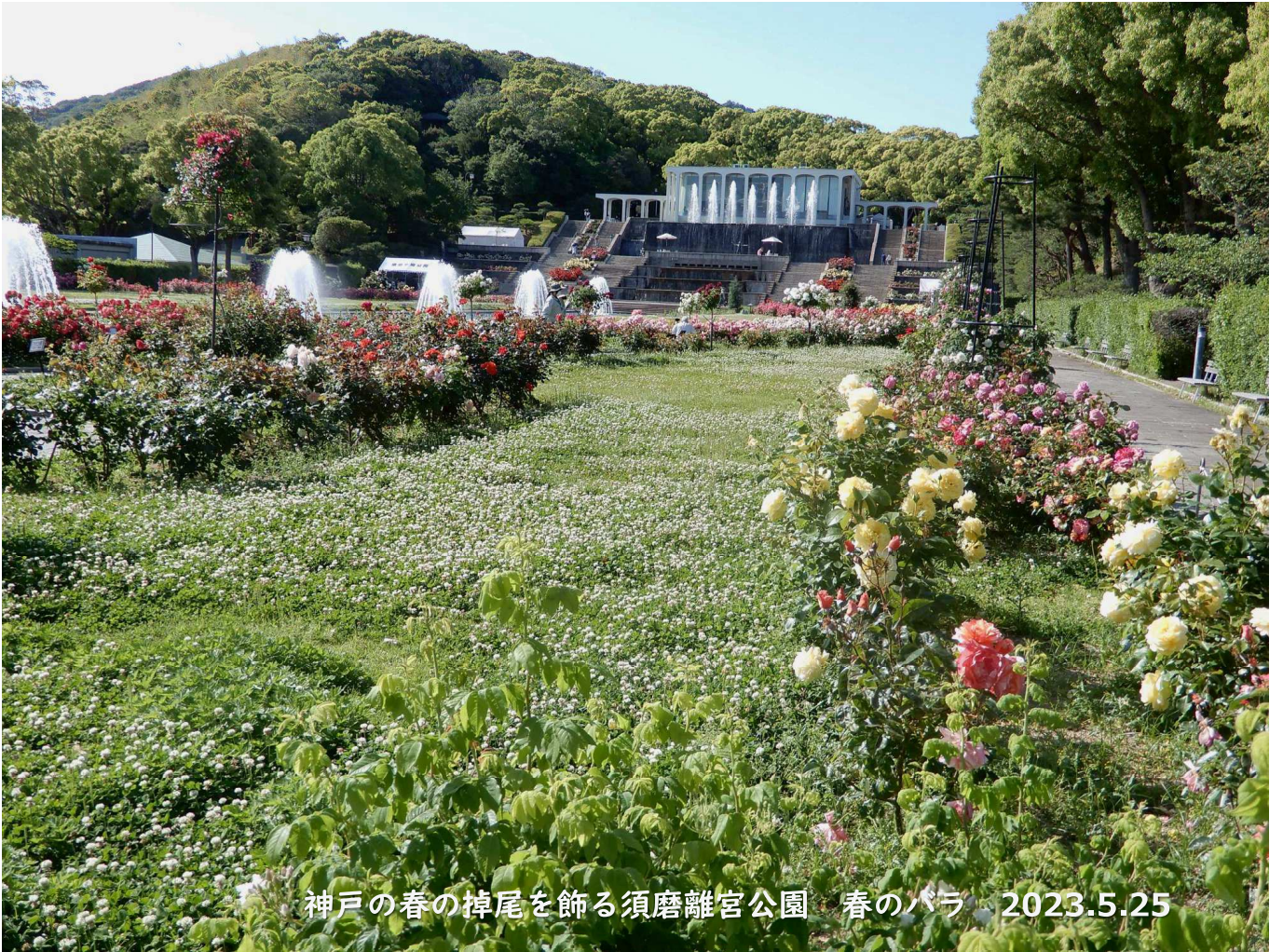
神戸の春の掉尾を飾る須磨離宮公園 春のバラ 2023.5.25