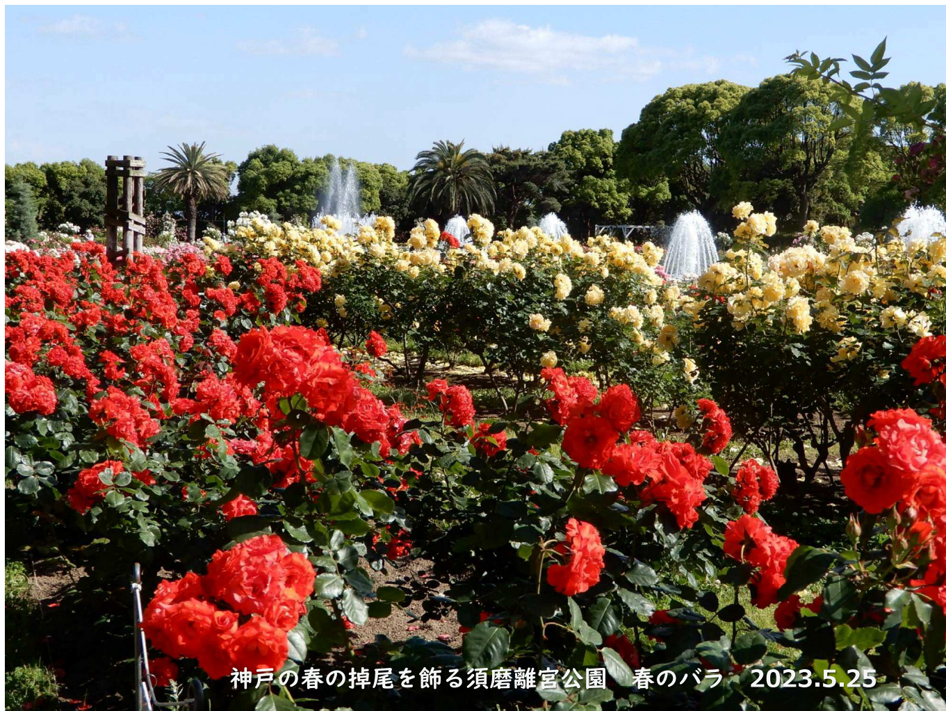
神戸の春の掉尾を飾る須磨離宮公園 春のバラ 2023.5.25