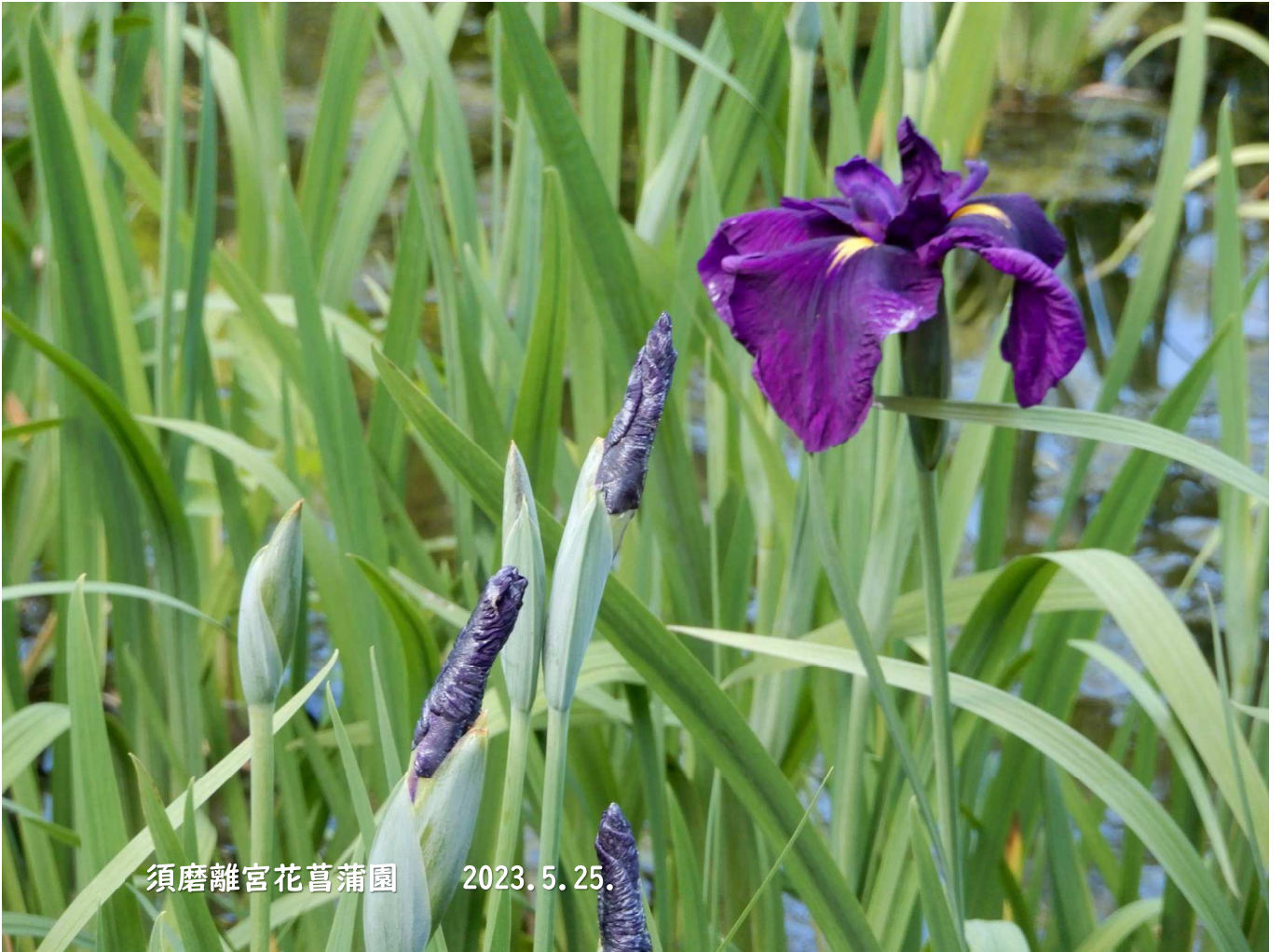
須磨離宮花菖蒲園