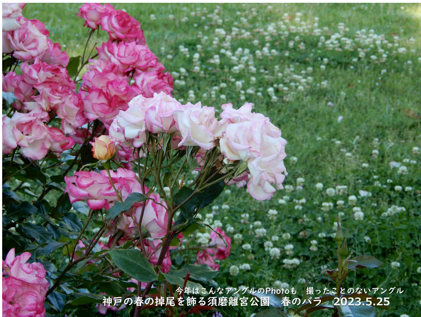
今年はこのアングルのPhotoも 撮ったことのないアングル 神戸の春の掉尾を飾る須磨離宮公園 春のバラ 2023.5.25