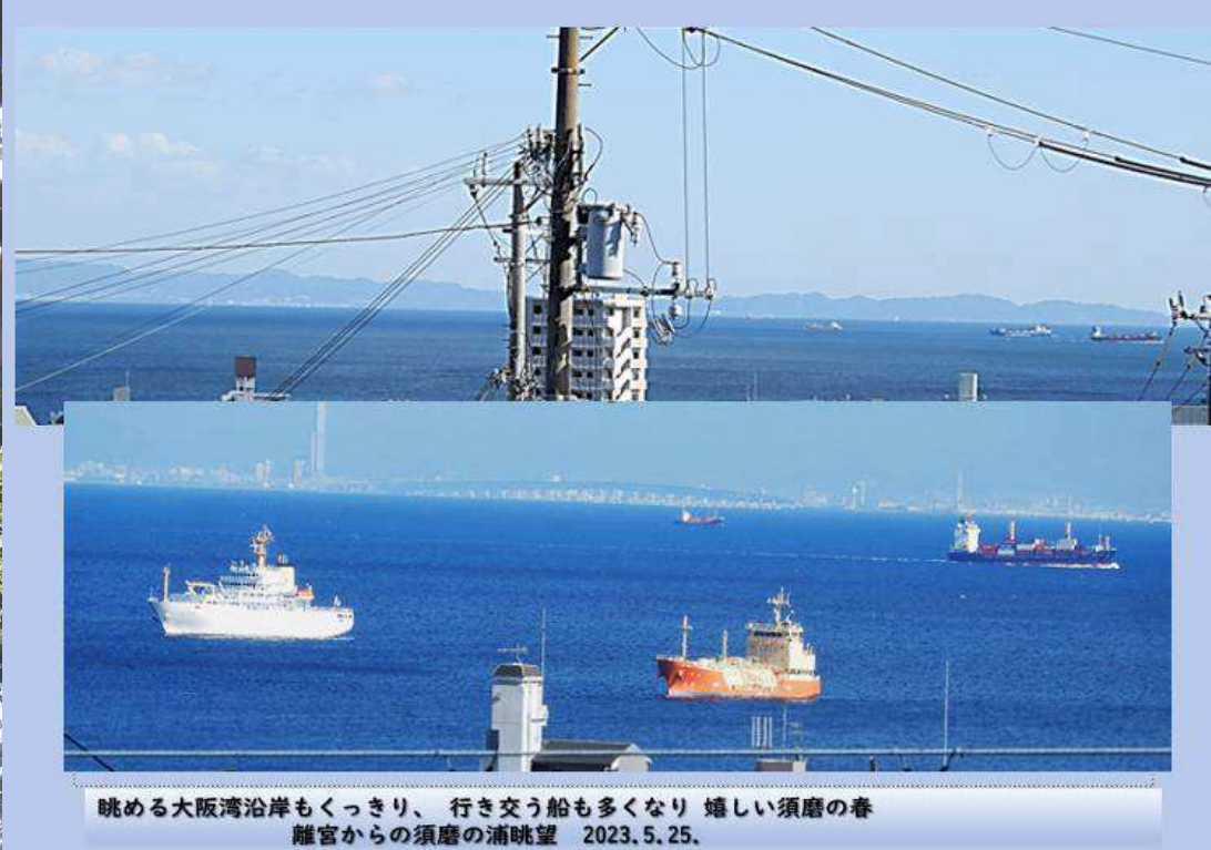
眺める大阪湾沿岸もくっきり、行き交う船も多くなり 嬉しい須磨の春 離宮からの須磨の浦眺望 2023. 5. 25.