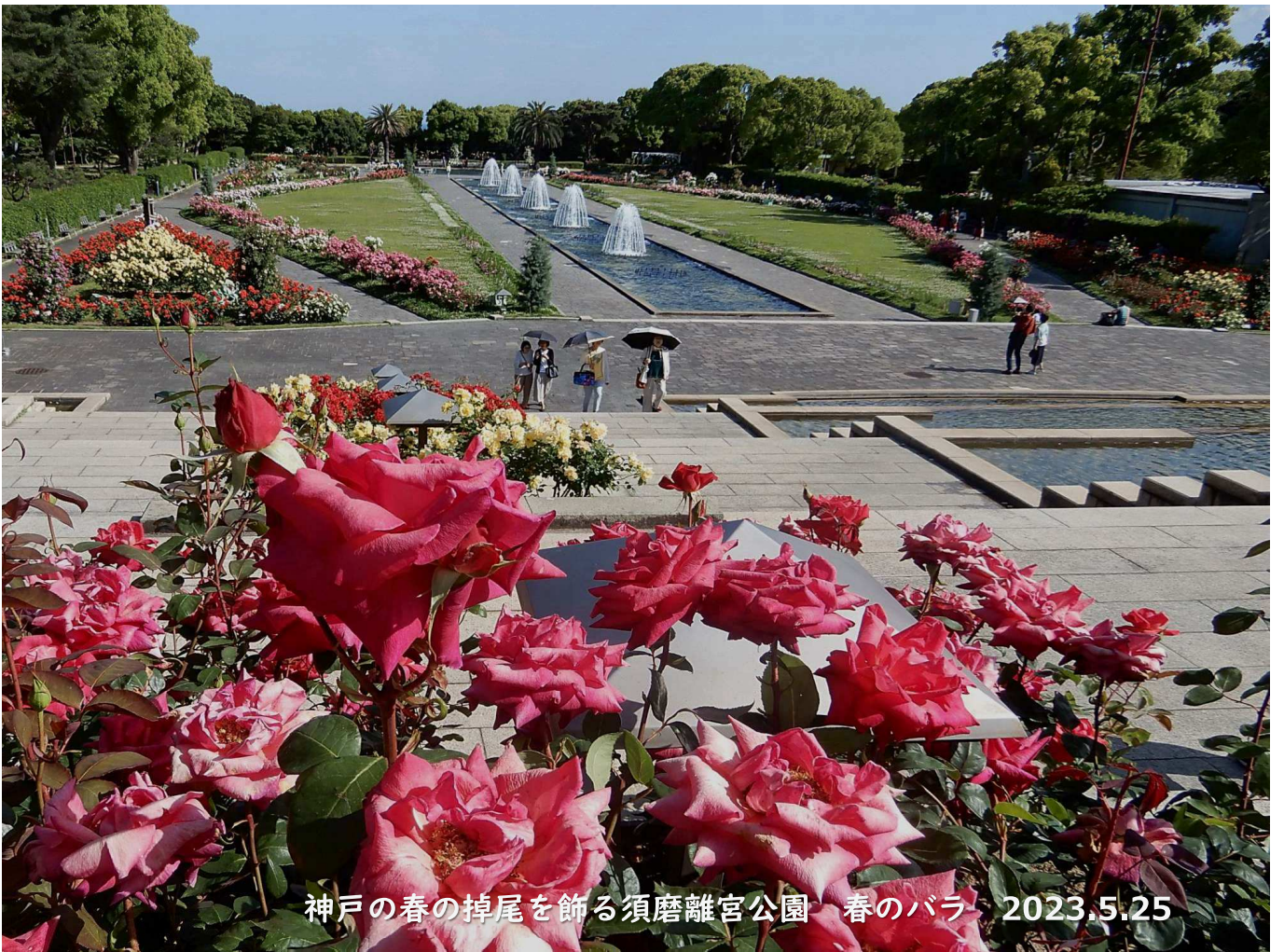
神戸の春の掉尾を飾る須磨離宮公園 春のバラ 2023.5.25