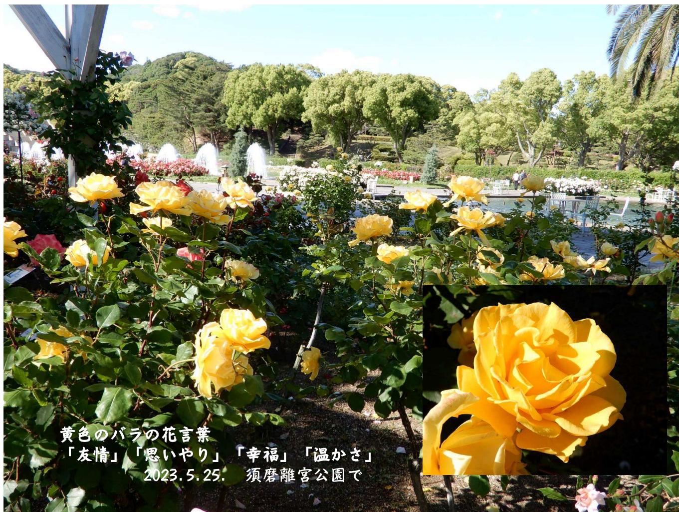
黄色のバラの花言葉 「友情」「思いやり」「幸福」「温かさ」 2023.5.25. 須磨離宮公園で