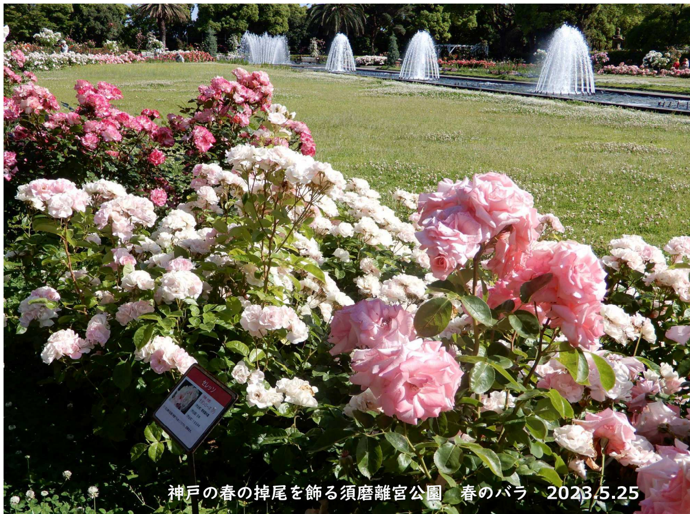
神戸の春の掉尾を飾る須磨離宮公園 春のバラ 2023.5.25