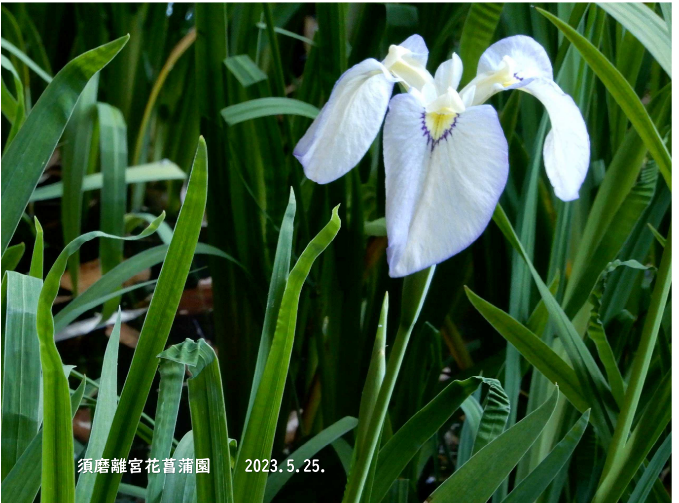
須磨離宮花菖蒲園