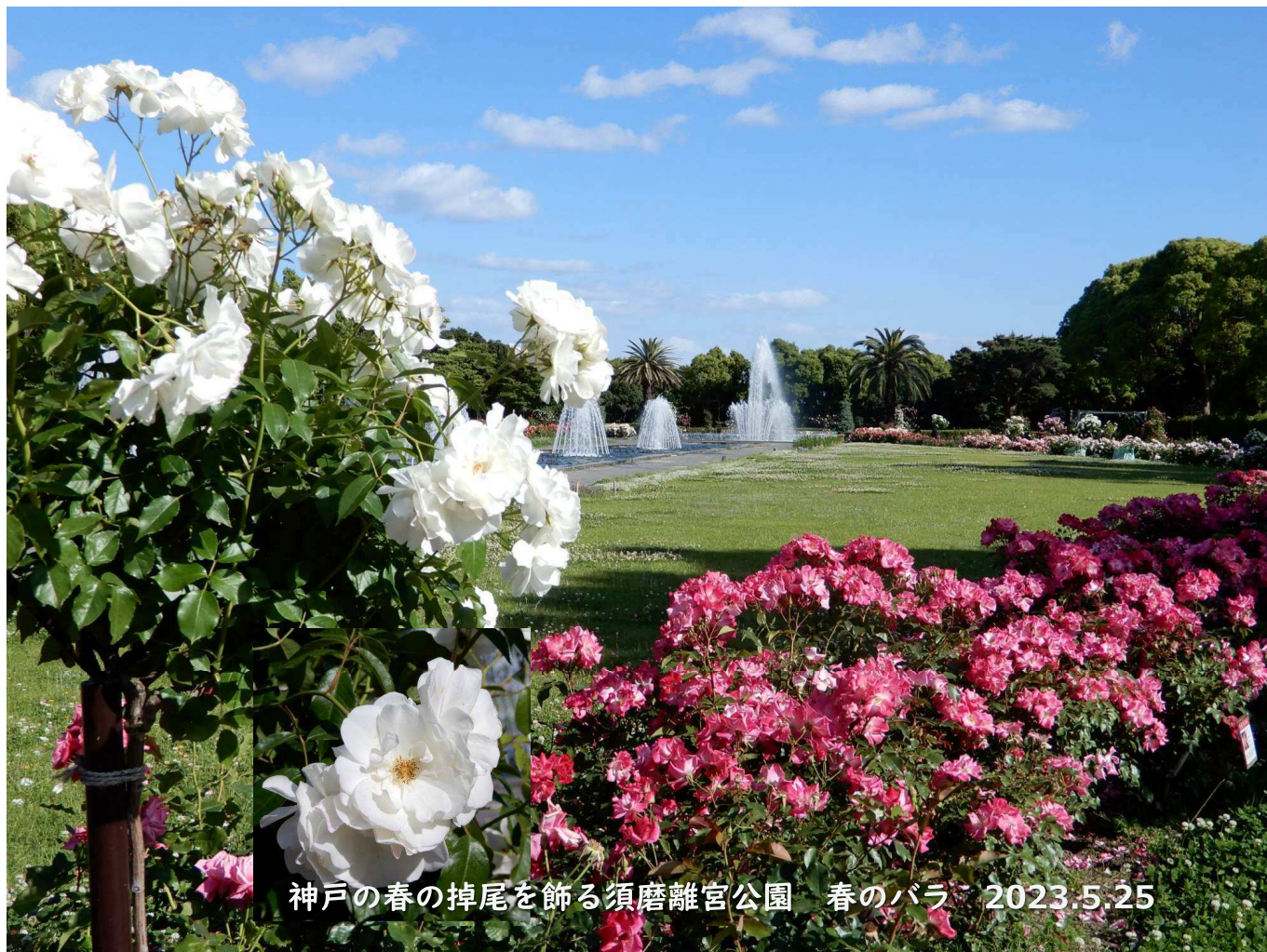
神戸の春の掉尾を飾る須磨離宮公園 春のバラ 2023.5.25