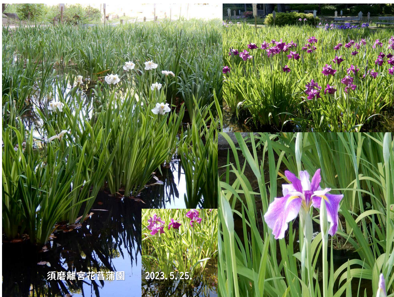
須磨離宮花菖蒲園