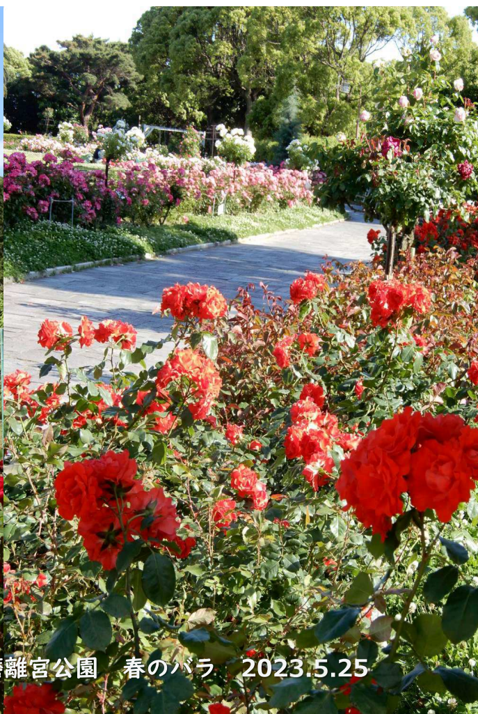
神戸の春の掉尾を飾る須磨離宮公園 春のバラ 2023.5.25