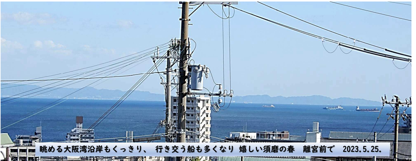
眺める大阪湾沿岸もくっきり、行き交う船も多くなり 嬉しい須磨の春 離宮前で 2023.5.25.