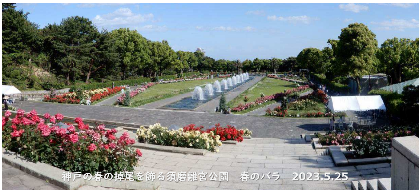
神戸の春の掉尾を飾る須磨離宮公園 春のバラ 2023.5.25