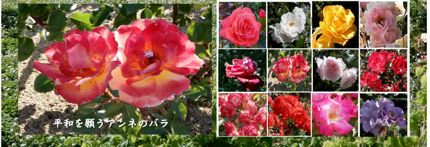
平和を願うアンネのバラ