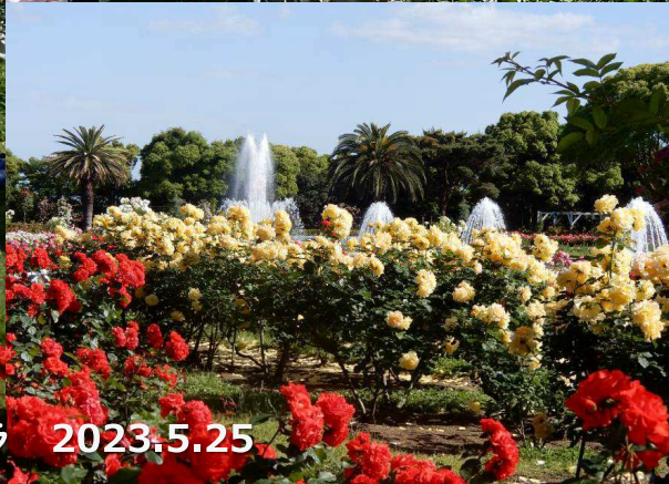
神戸の春の掉尾を飾る須磨離宮公園 春のバラ 2023.5.25