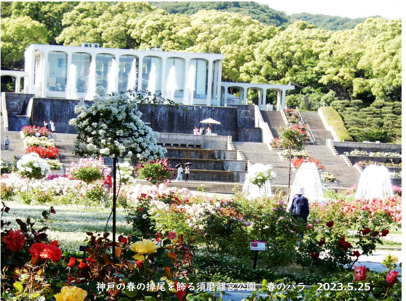
神戸の春の掉尾を飾る須磨離宮公園 春のバラ 2023.5.25