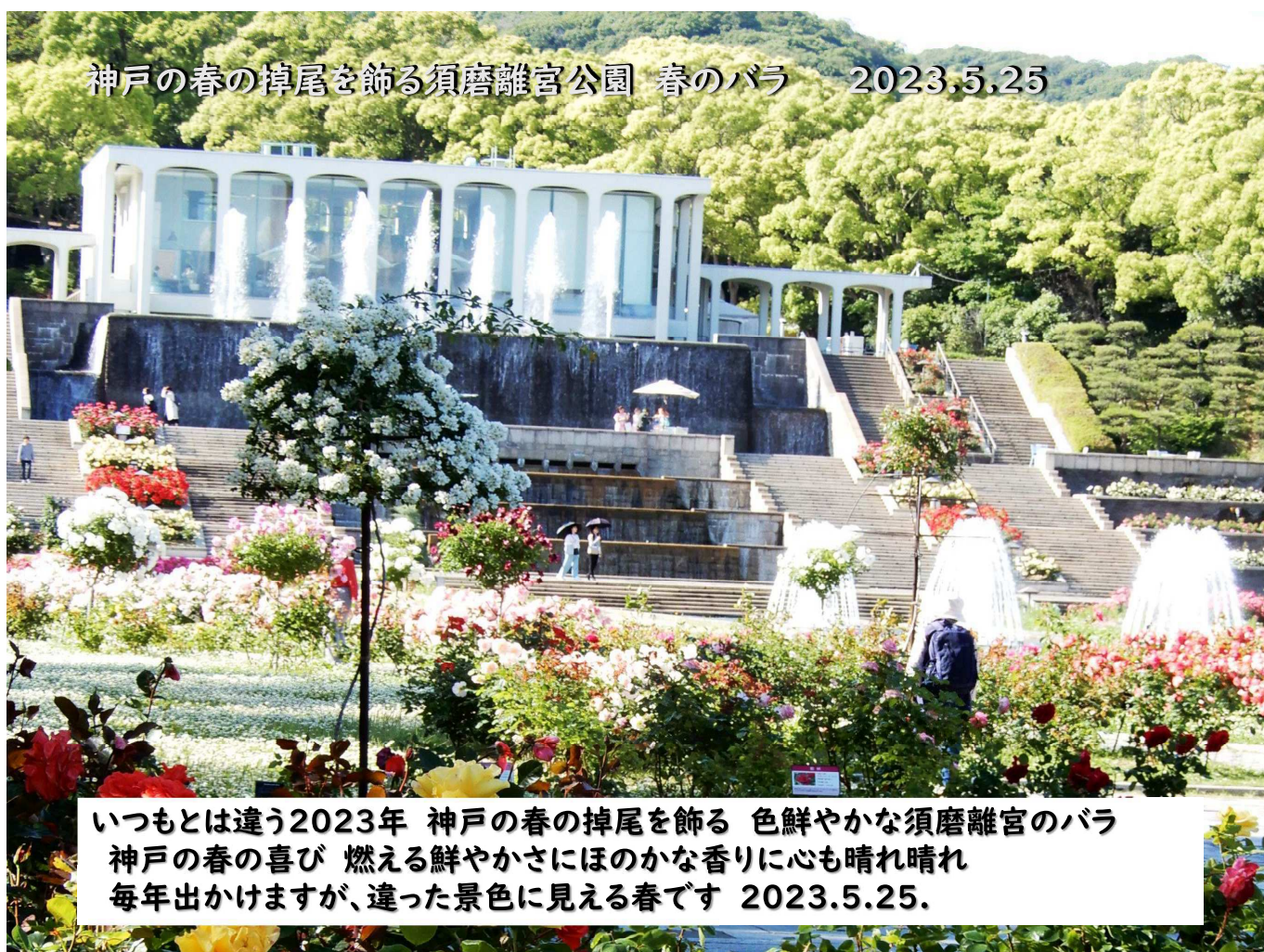
神戸の春の掉尾を飾る須磨離宮公園 春のバラ 2023.5.25

いつもとは違う2023年 神戸の春の掉尾を飾る 色鮮やかな須磨離宮のバラ 神戸の春の喜び 燃える鮮やかさにほのかな香りに心も晴れ晴れ 毎年出かけますが、違った景色に見える春です 2023.5.25.