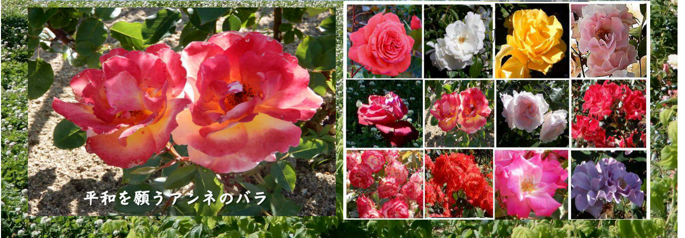
平和を願うアンネのバラ