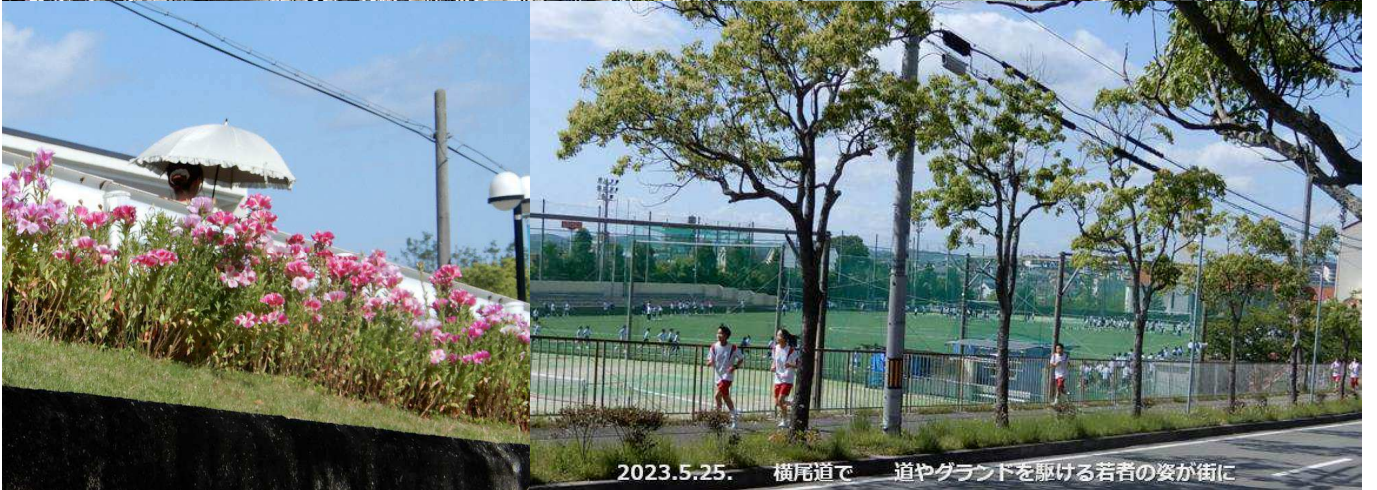
2023.5.25. 横尾道で 道やグラウンドを駆ける若者の姿が街に