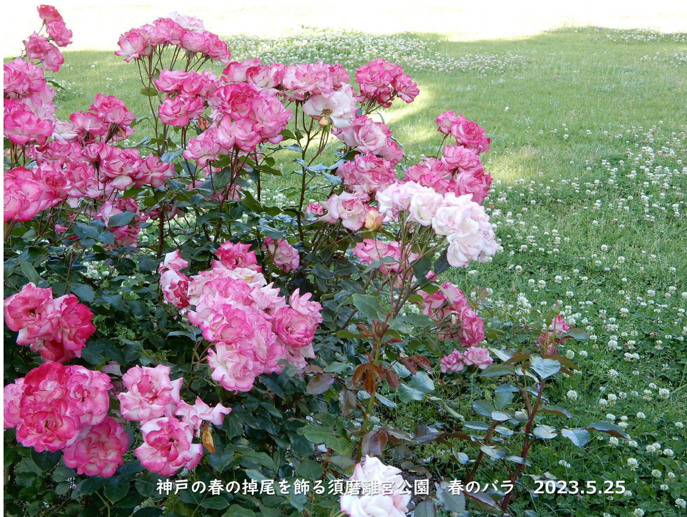
神戸の春の掉尾を飾る須磨離宮公園 春のバラ 2023.5.25