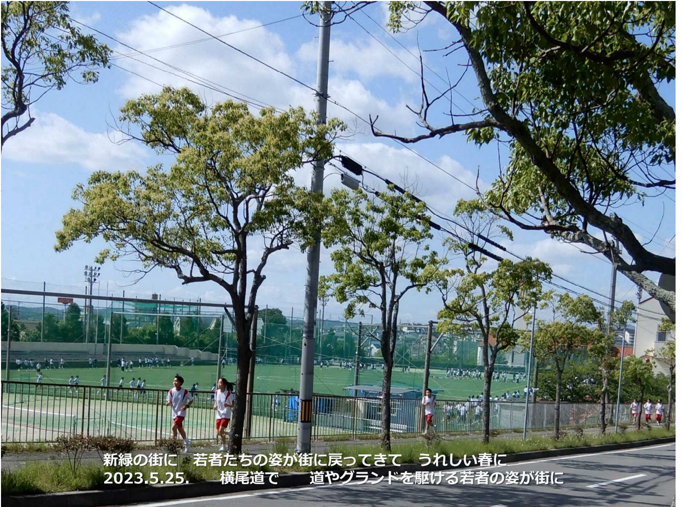
新緑の街に 若者たちの姿が街に戻ってきて うれしい春に 2023.5.25. 横尾道で 道やグラウンドを駆ける若者の姿が街に