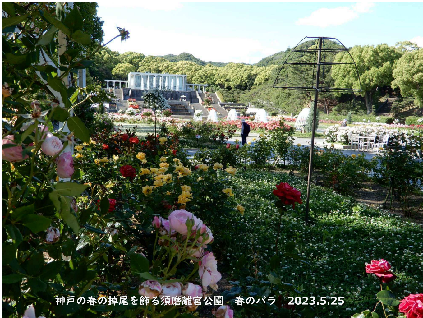
神戸の春の掉尾を飾る須磨離宮公園 春のバラ 2023.5.25