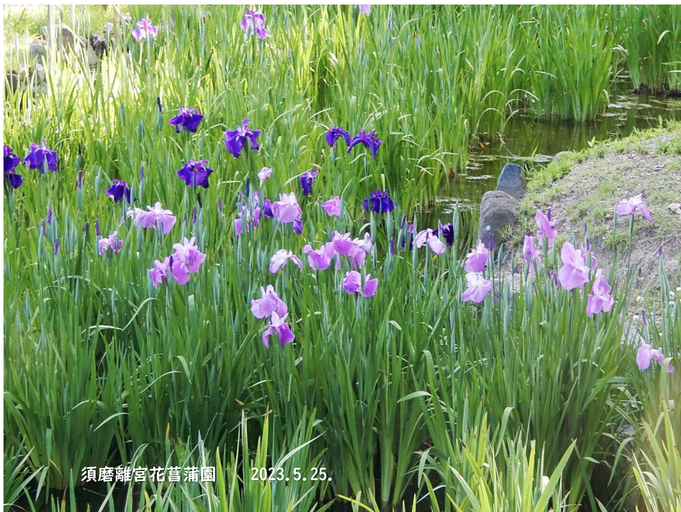
須磨離宮花菖蒲園