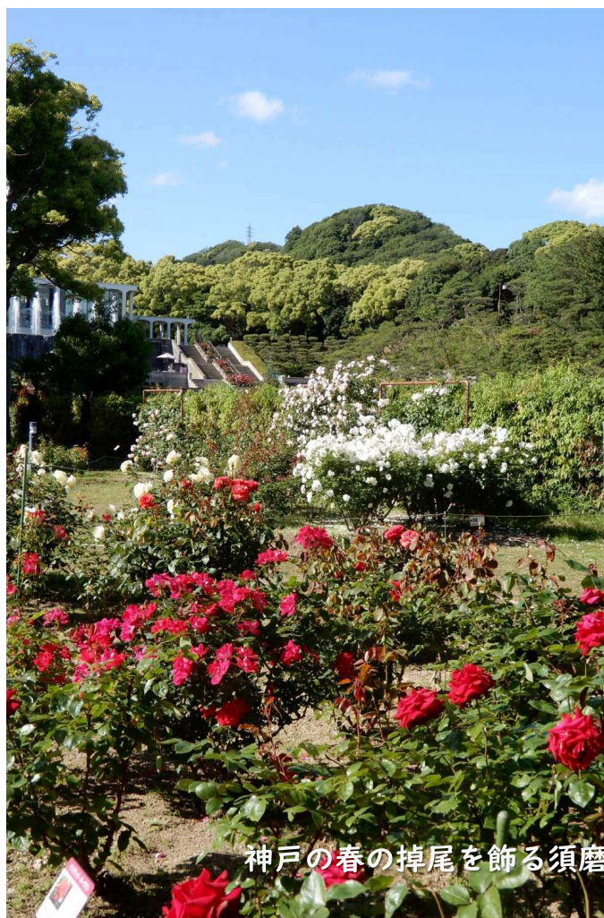
神戸の春の掉尾を飾る須磨離宮公園 春のバラ 2023.5.25