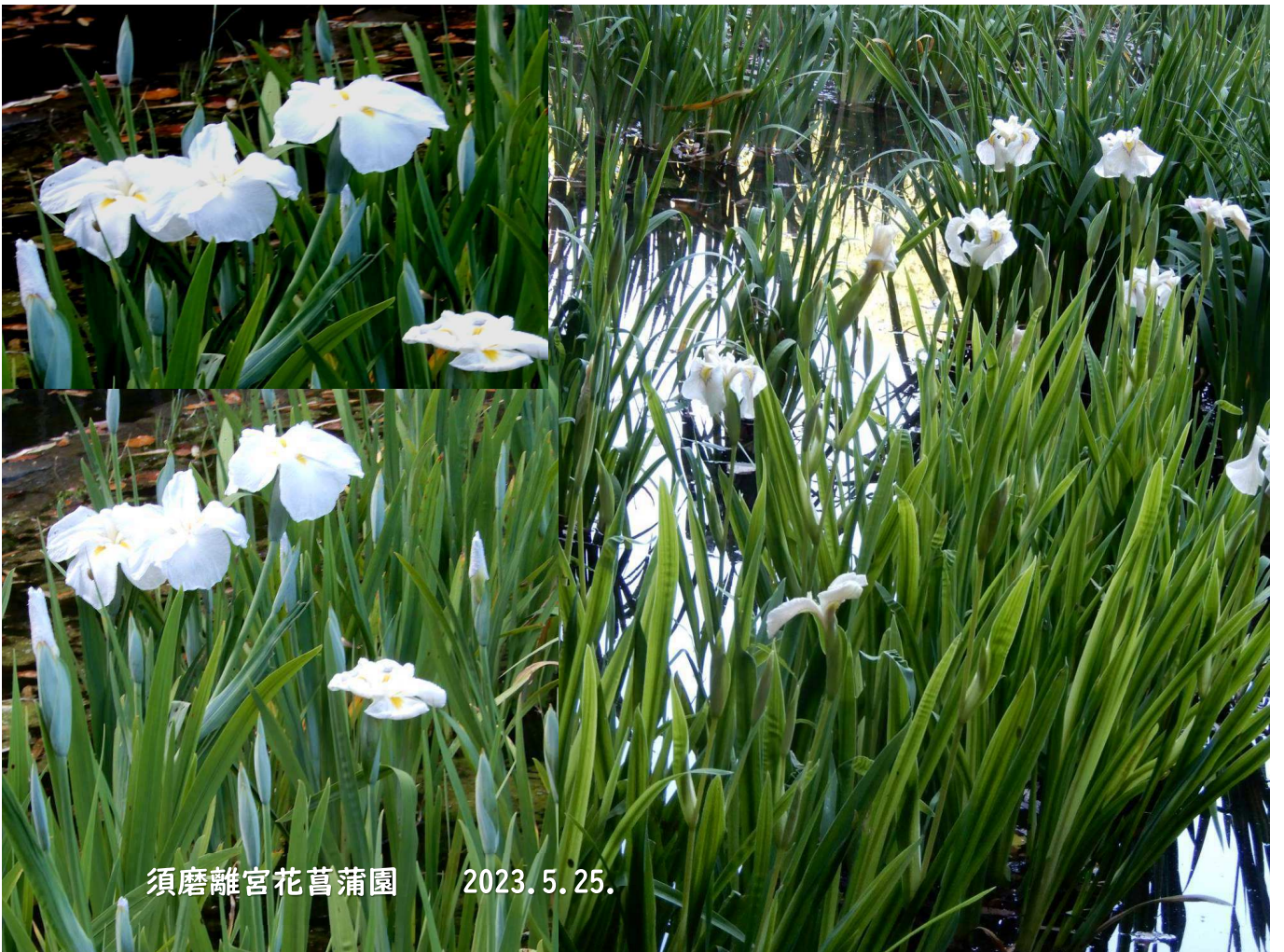
須磨離宮花菖蒲園