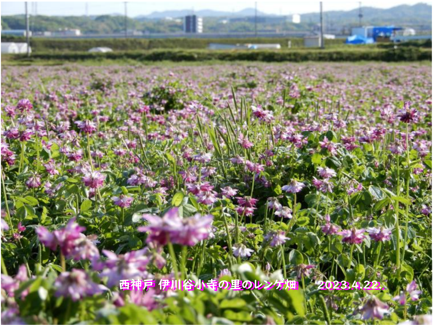
西神戸 伊川谷小寺の里のレンゲ畑 2023.4.22.