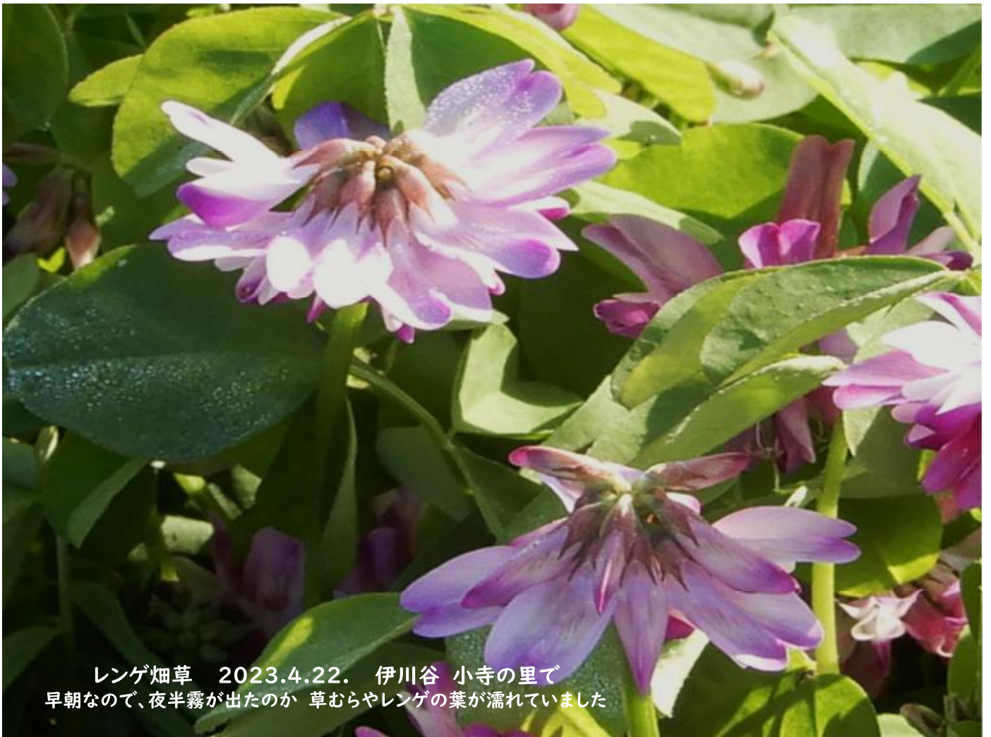
レンゲ畑草 2023.4.22. 伊川谷 小寺の里で 早朝なので、夜半霧が出たのか 草むらやレンゲの葉が濡れていました