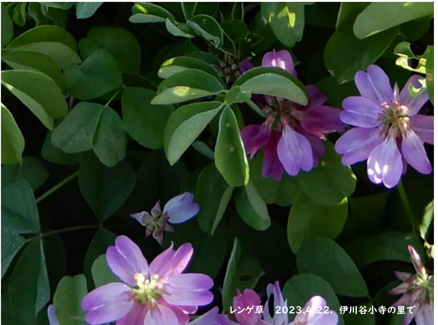
レンゲ草 2023.4.22. 伊川谷小寺の里で