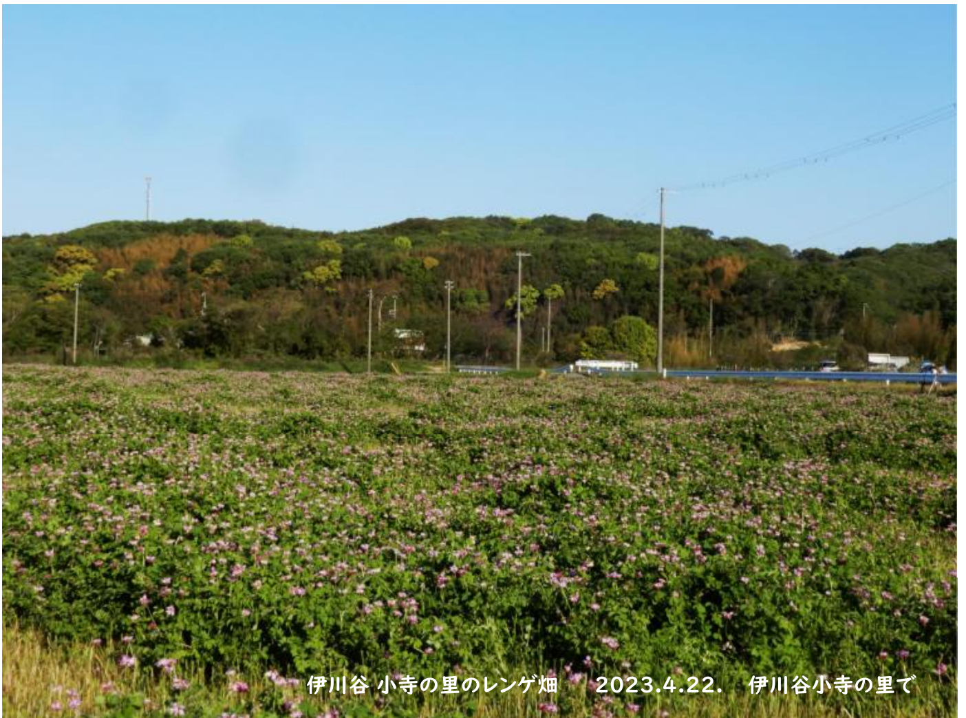
伊川谷 小寺の里のレンゲ畑 2023.4.22. 伊川谷小寺の里で