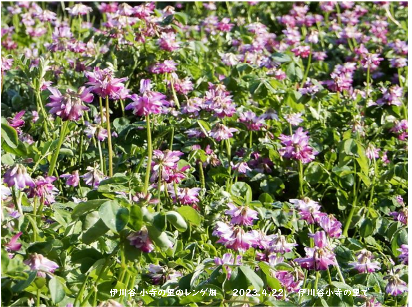
伊川谷 小寺の里のレンゲ畑 2023.4.22. 伊川谷小寺の里で