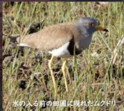
水の入る前の田圃に現れたムクドリ