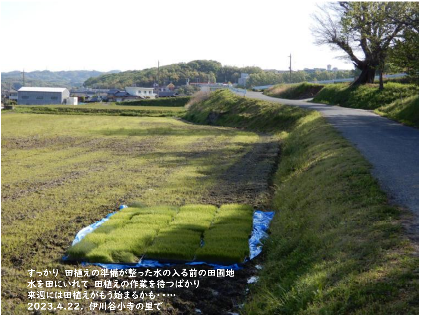
すっかり 田植えの準備が整った水の入る前の田圃地 水を田にいれて 田植えの作業を待つばかり 来週には田植えがもう始まるかも…… 2023.4.22. 伊川谷小寺の里で