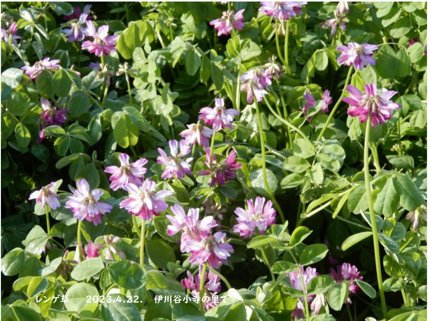
レンゲ草 2023.4.22. 伊川谷小寺の里で