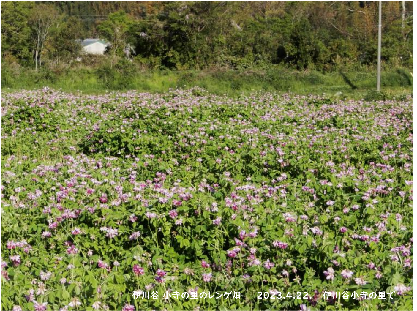
伊川谷 小寺の里のレンゲ畑 2023.4.22. 伊川谷小寺の里で