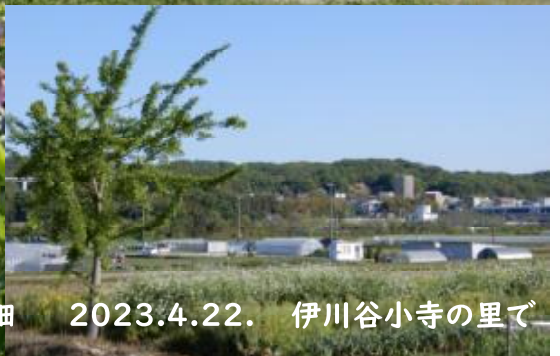
伊川谷 小寺の里のレンゲ畑 2023.4.22. 伊川谷小寺の里で