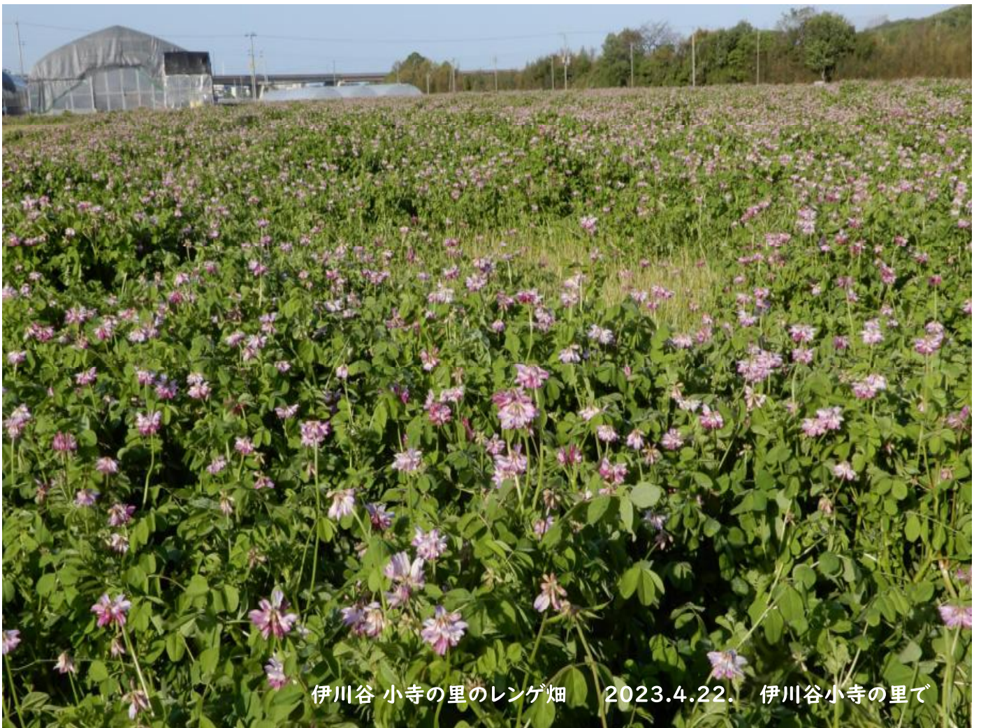
伊川谷 小寺の里のレンゲ畑 2023.4.22. 伊川谷小寺の里で