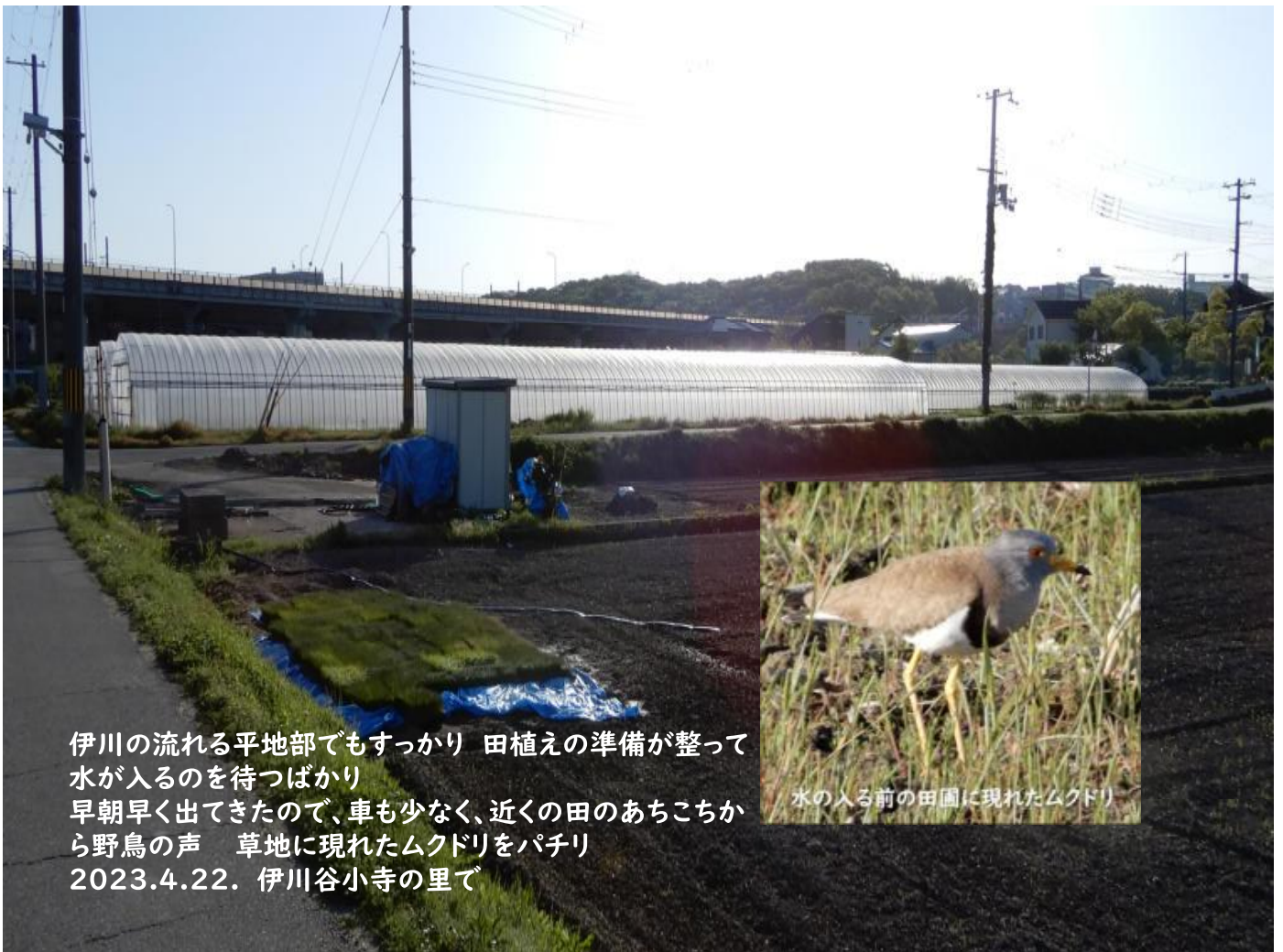
伊川の流れる平地部でもすっかり 田植えの準備が整って 水が入るのを待つばかり 早朝早く出てきたので、車も少なく、近くの田のあちこちか ら野鳥の声 草地に現れたムクドリをパチリ 2023.4.22. 伊川谷小寺の里で