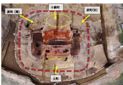
桜谷鉦跡 高殿内の主要遺構 高殿は高殿の構造跡

https://www3.pref.shimane.jp/houdou/uploads/160337/141626/0c4531a09f99cde0518403fbf00f82de.pdf