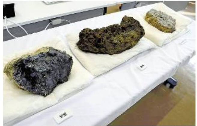
遺跡から見つかった製鉄炉の破片（左）や、製鉄の際に出る不純物（中央）など（松江市で）

県埋蔵文化財調査センターは27日、江津市松川町で、江戸時代から明治時代にかけて盛んだった「たたら製鉄」の遺跡を確認したと発表した。製鉄炉を覆う建物「高殿」跡は四隅が丸い長方形で、センターは「全国的に見ても類例のない形で、たたら製鉄の変遷を考える上で重要な発見だ」としている。