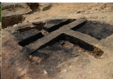
炭町(南) (炭置き場跡)