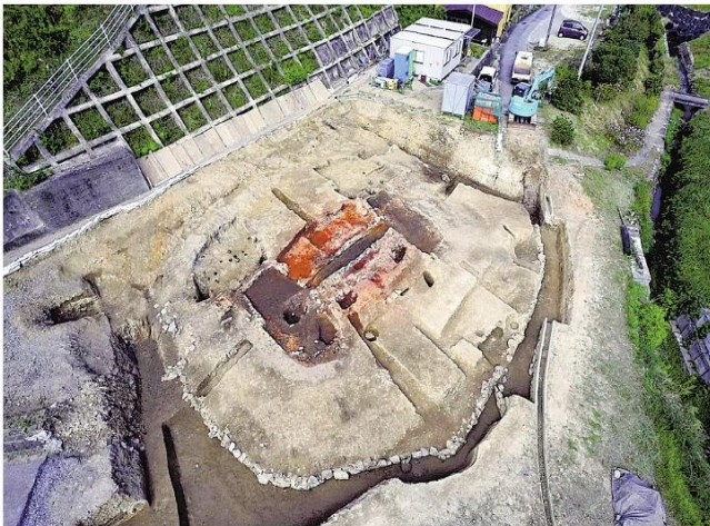
高殿跡が見つかった、たたら製鉄跡（江津市で）

https://www.yomiuri.co.jp/local/shimane/news/20231027-OYTNT50077/