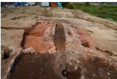
製鉄炉の地下構造 (中央が本床)