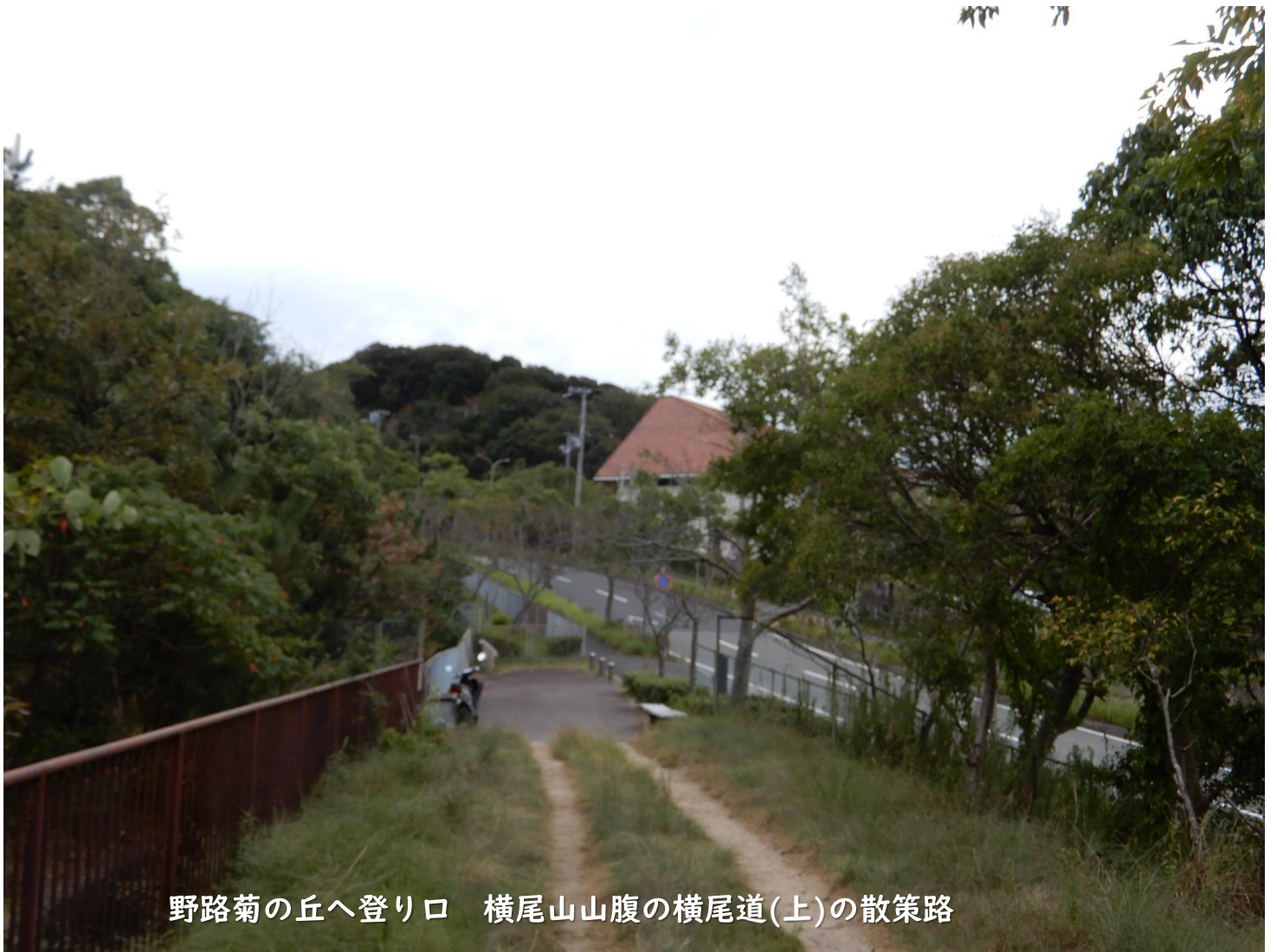
野路菊の丘へ登り口 横尾山山腹の横尾道(上)の散策路