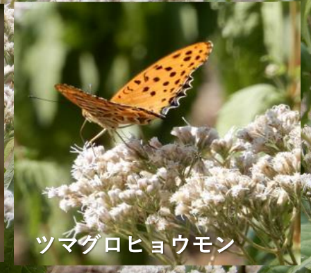
ツマグロヒョウモン