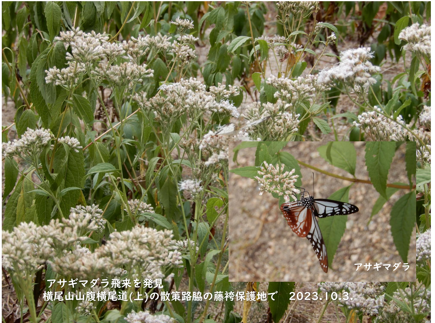
アサギマダラ飛来を発見 横尾山山腹横尾道(上)の散策路脇の藤袴保護地で 2023.10.3.