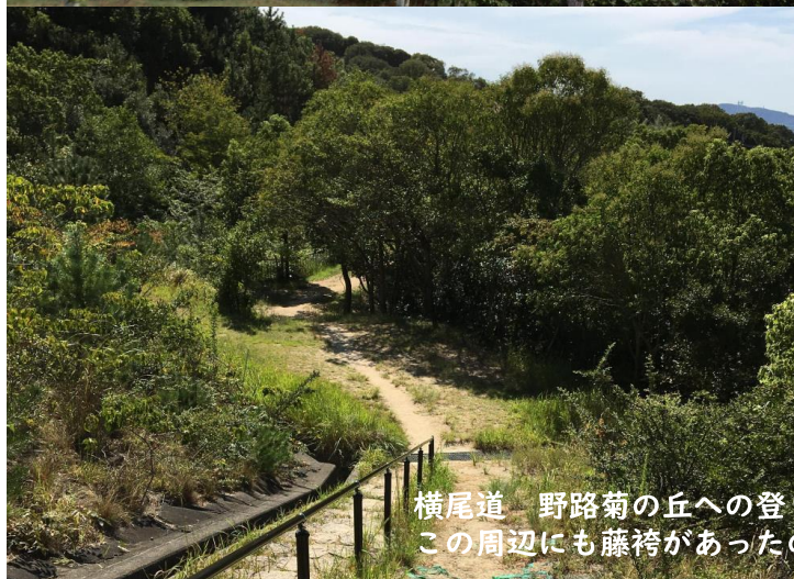
横尾道 野路菊の丘への登り口周辺 この周辺にも藤袴があったのですが、今年は消えてありませんでした