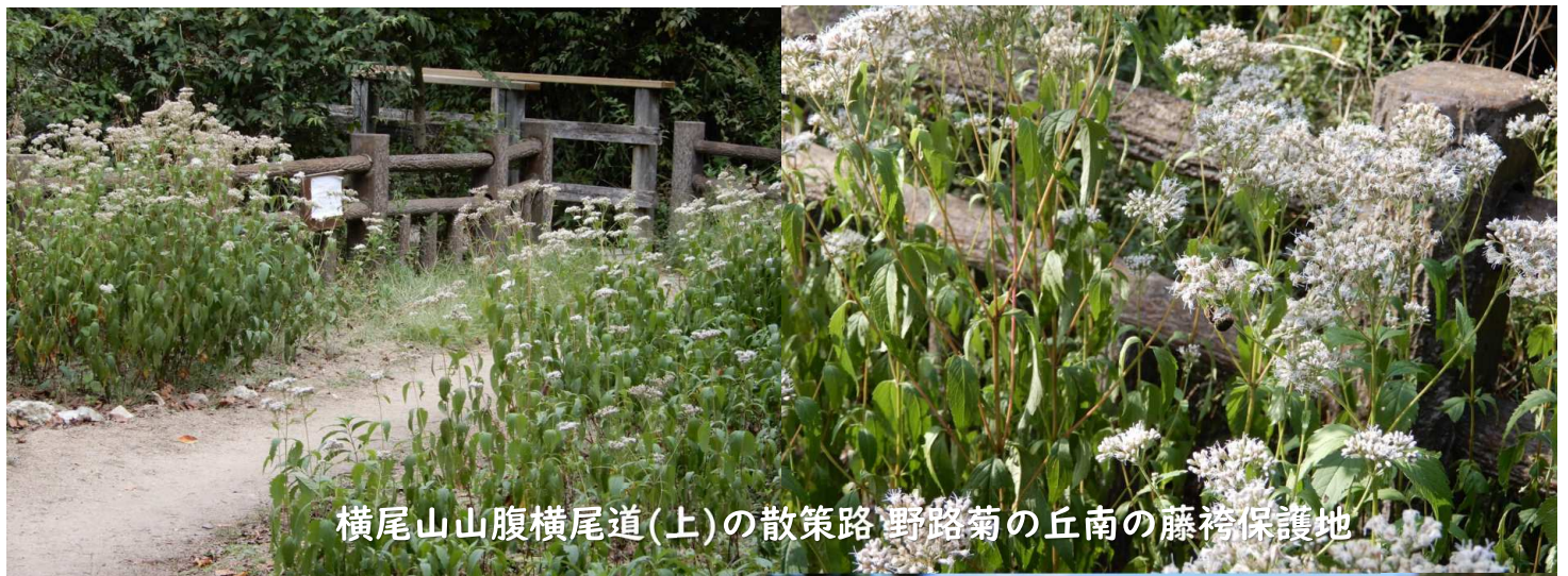
横尾山山腹横尾道(上)の散策路 野路菊の丘南の藤袴保護地

注) ◎藤袴保護地:横尾道 & 縦走路沿い ボランティアによる自生保護・栽培保護地 ◎遊歩道:横尾道:横尾山山腹を巡る遊歩道 山腹の上から下のバス道路まで幾本も 散策路として、並行zigzagに造成されてる