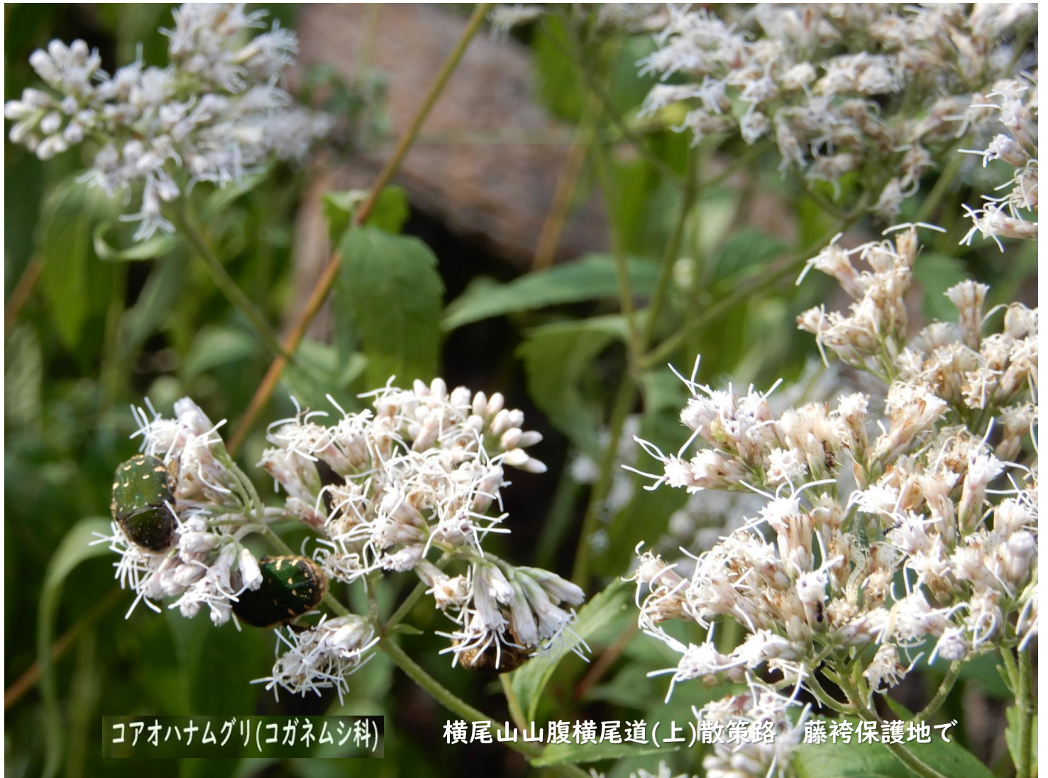
コアオハナムグリ(コガネムシ科)