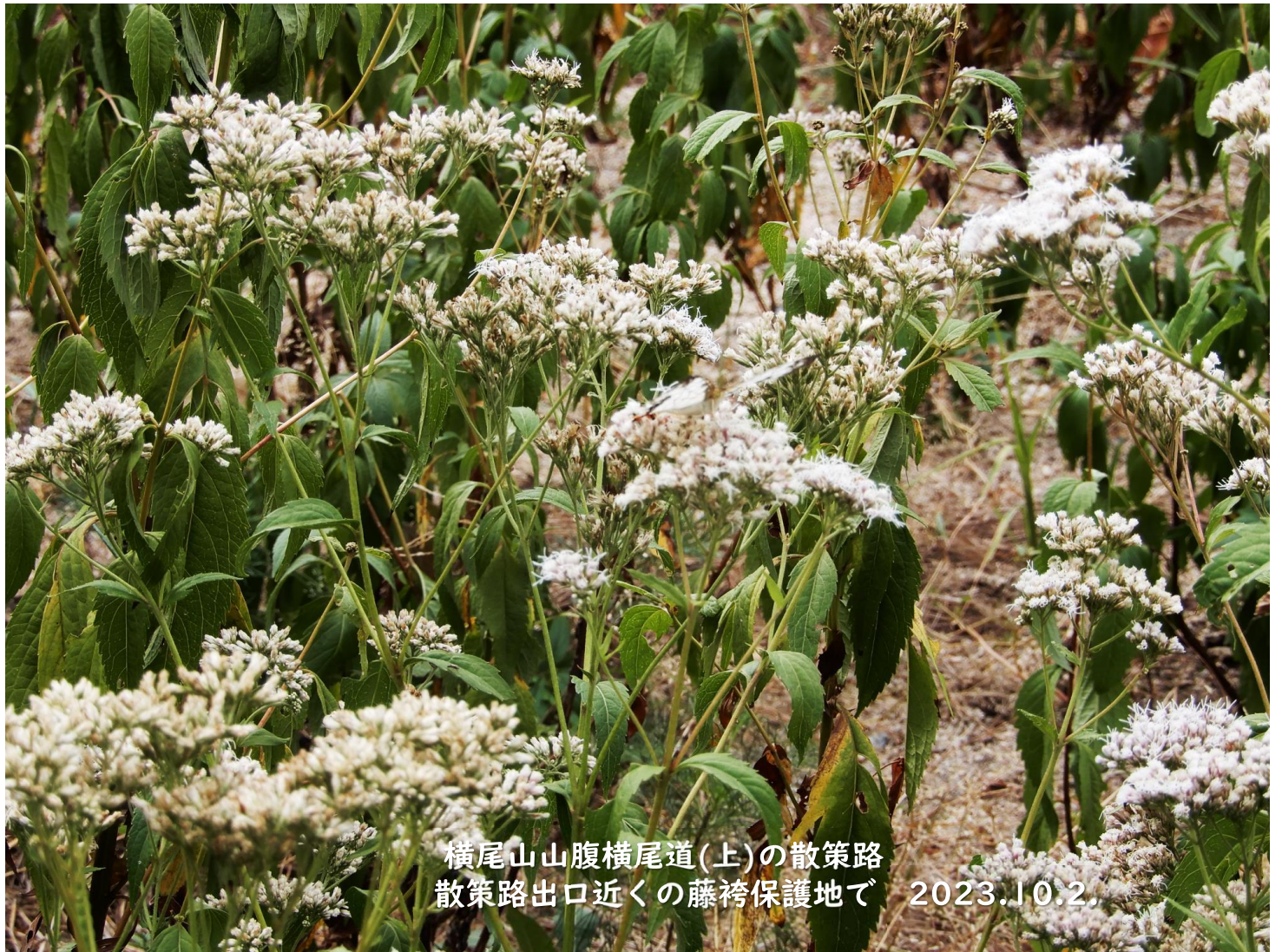
横尾山山腹横尾道(上)の散策路 散策路出口近くの藤袴保護地で 2023.10.2.