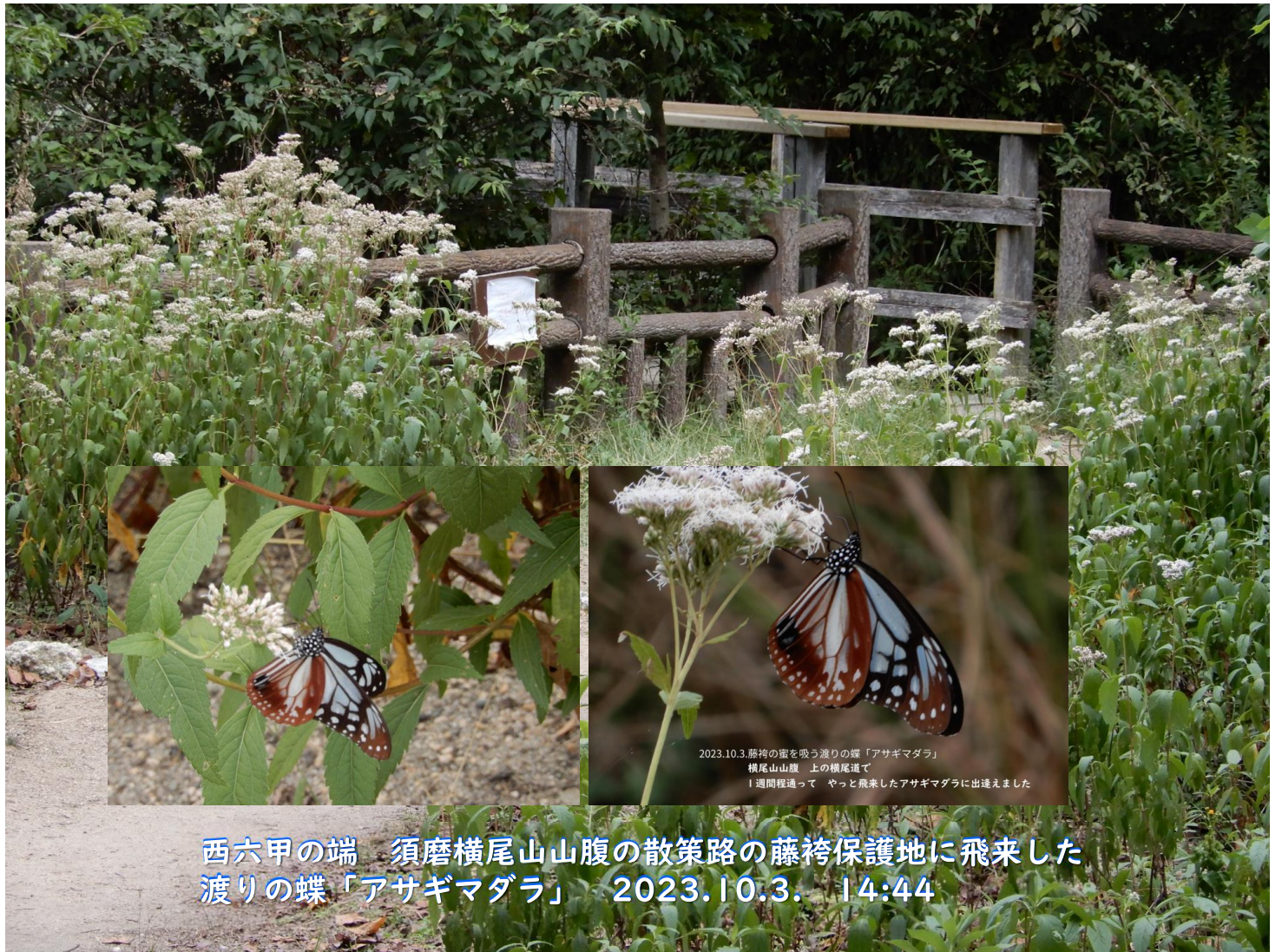
西六甲の端 須磨横尾山山腹の散策路の藤袴保護地に飛来した 渡りの蝶「アサギマダラ」 2023.10.3. 14:44