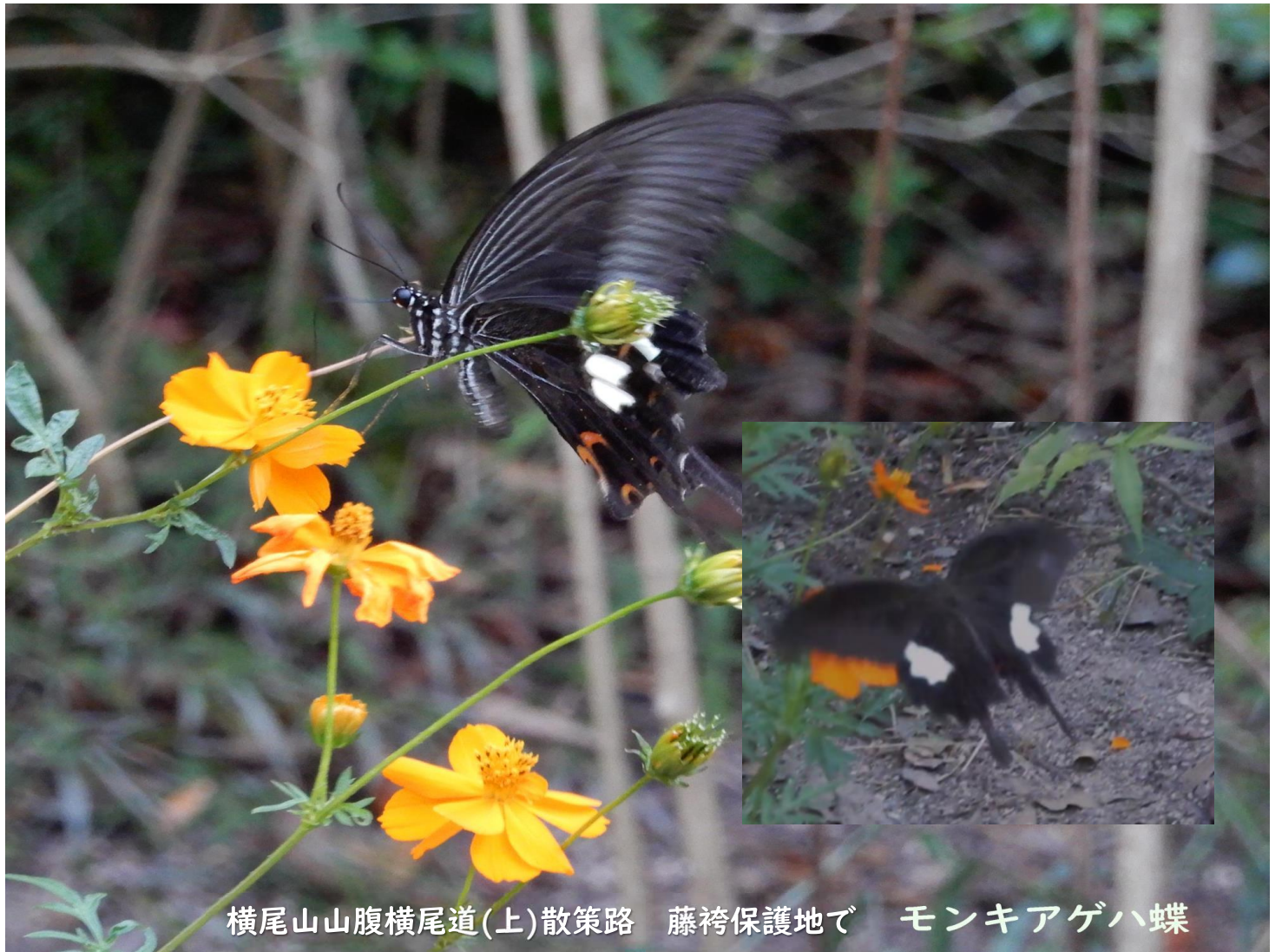
横尾山山腹横尾道(上)散策路 藤袴保護地で モンキアゲハ蝶