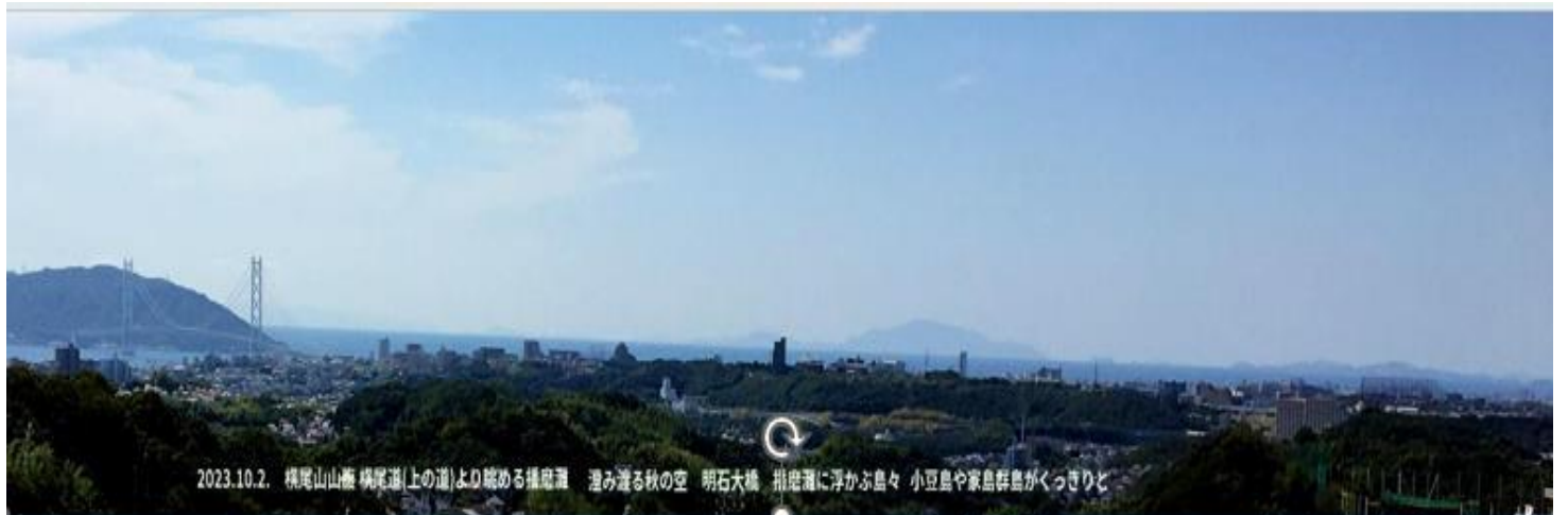
2023.10.2. 横尾山山腹 横尾道(上)より眺める播磨灘 澄み渡る秋の空 明石大橋 播磨灘に浮かぶ島々 小豆島や家島群島がくっきりと