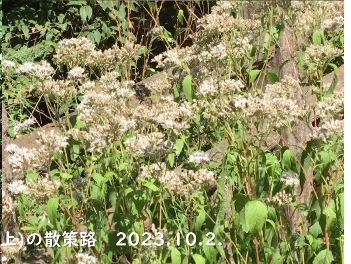
野路菊の丘 横尾山山腹の横尾道(上)の散策路 2023.10.2.