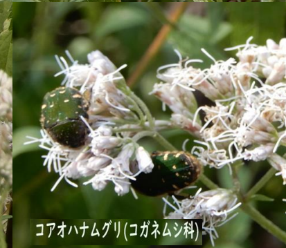
コアハナムグリ(コガネムシ科)