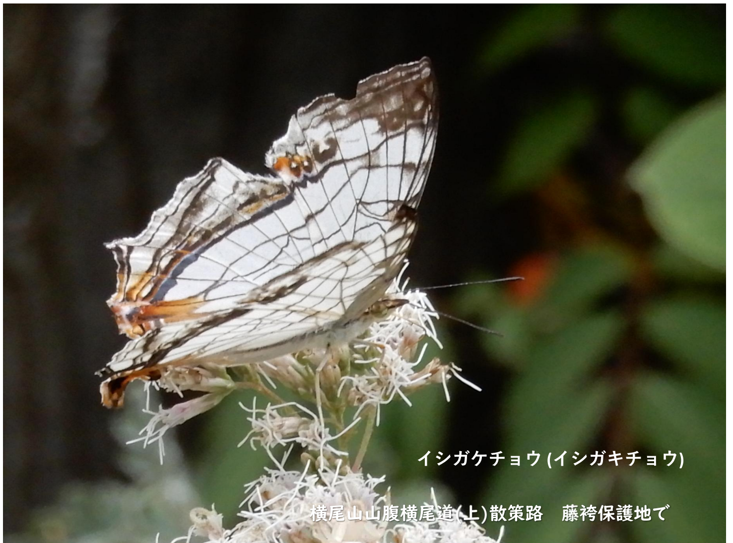
イシガケチョウ(イシガキチョウ)