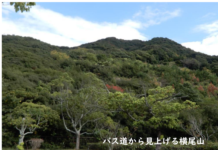
バス道から見上げる横尾山