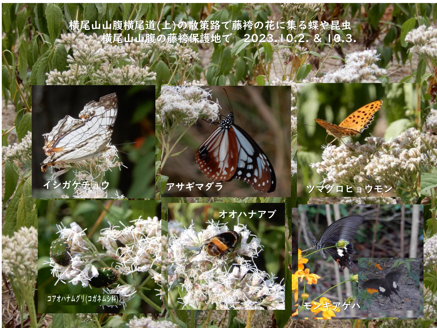
横尾山山腹横尾道(上)の散策路で藤袴の花に集る蝶や昆虫 横尾山山腹の藤袴保護地で 2023.10.2. & 10.3.