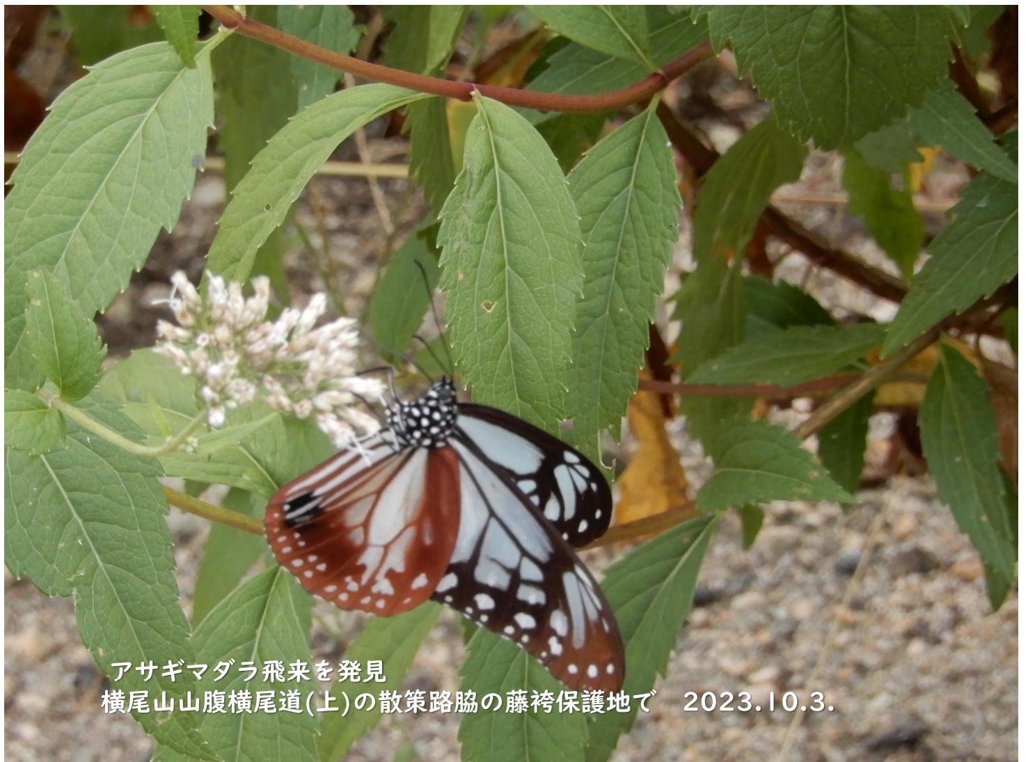
アサギマダラ飛来を発見 横尾山山腹横尾道(上)の散策路脇の藤袴保護地で 2023.10.3.