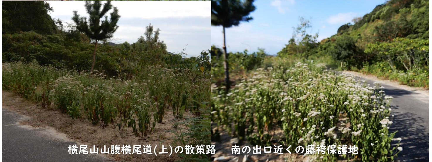
横尾山山腹横尾道(上)の散策路 南の出口近くの藤袴保護地