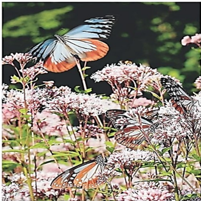
フシバカマの上を飛ぶアサギマダラ 神戸市灘区摩耶山町