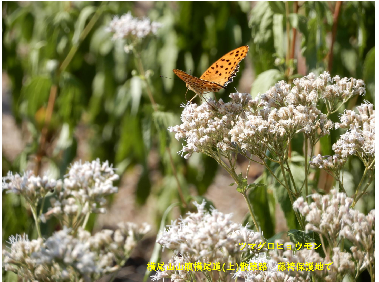
ツマグロヒヨウモン 横尾山山腹横尾道(上)散策路 藤袴保護地で