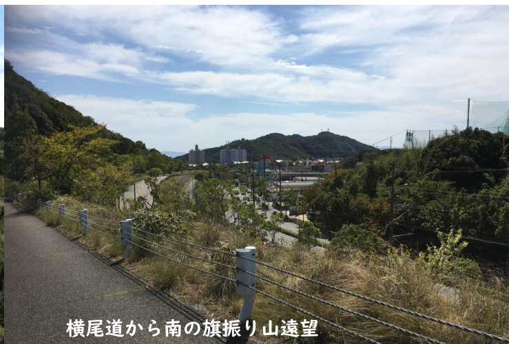
横尾道から南の旗振り山遠望