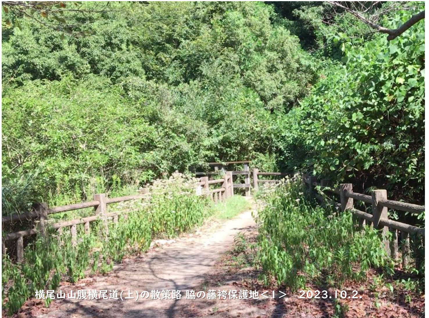
横尾山山腹横尾道(上)の散策路 脇の藤袴保護地<1> 2023.10.2.