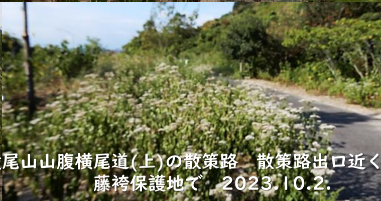
横尾山山腹横尾道(上)の散策路 散策路出口近く 藤袴保護地で 2023.10.2.