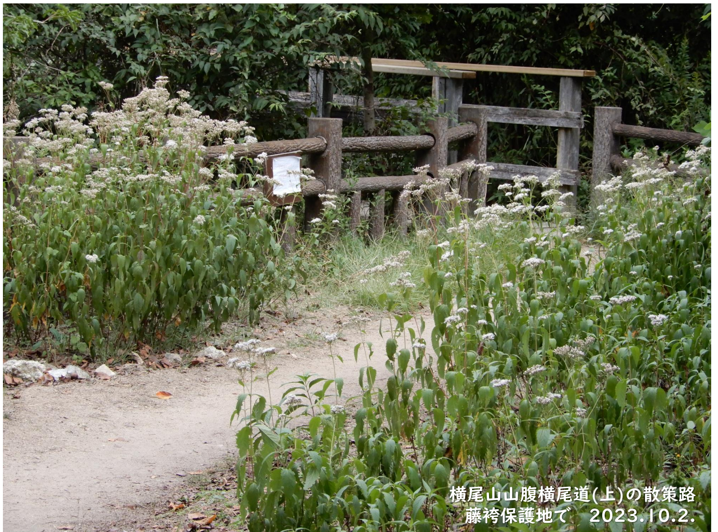
横尾山山腹横尾道(上)の散策路 藤袴保護地で 2023.10.2.