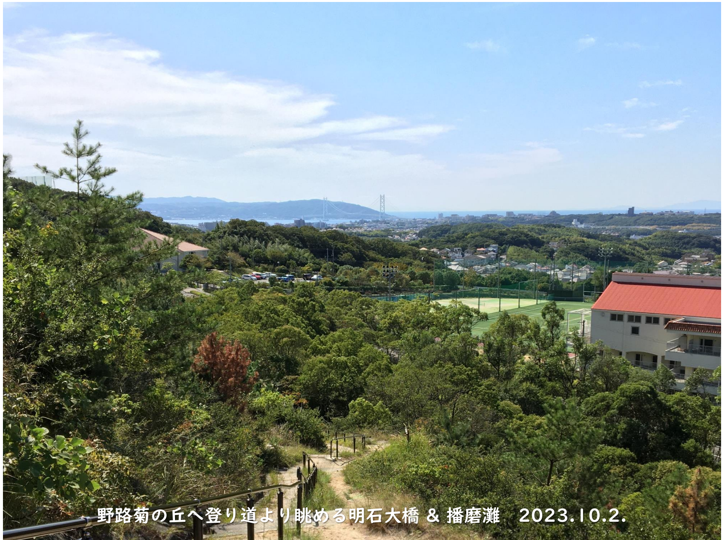
野路菊の丘へ登り道より眺める明石大橋 & 播磨灘 2023.10.2.