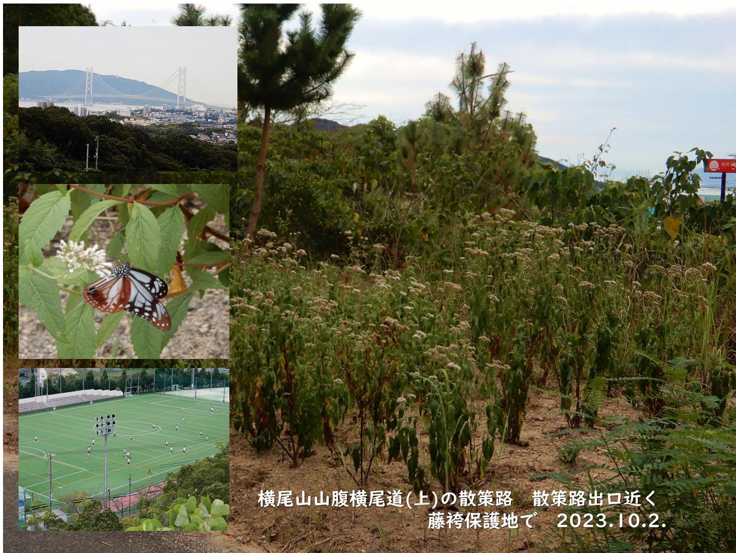
横尾山山腹横尾道(上)の散策路 散策路出口近く 藤袴保護地で 2023.10.2.