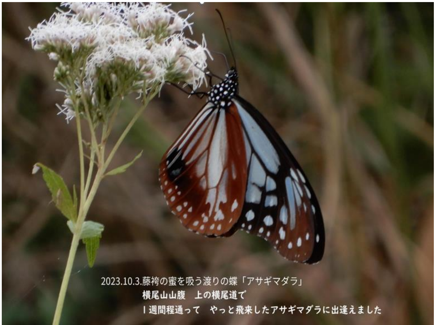
2023.10.3.藤袴の蜜を吸う渡りの蝶「アサギマダラ」 横尾山山腹 上の横尾道で 1週間程通って やっと飛来したアサギマダラに出逢えました