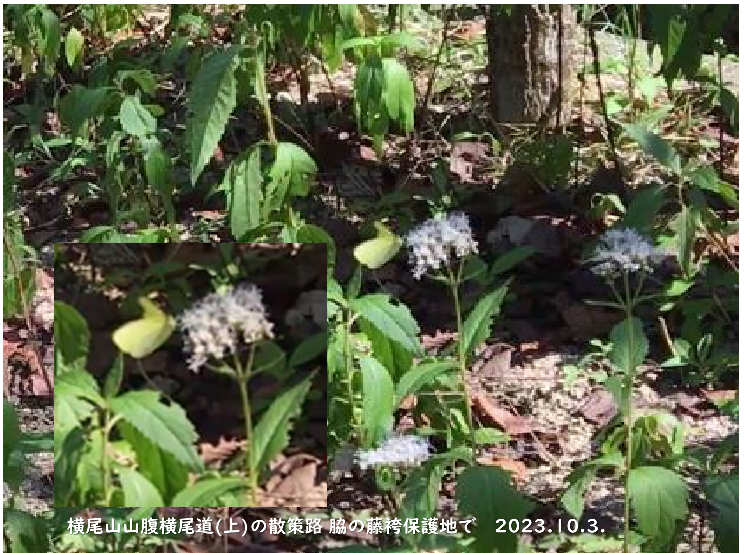
横尾山山腹横尾道(上)の散策路 脇の藤袴保護地で 2023.10.3.