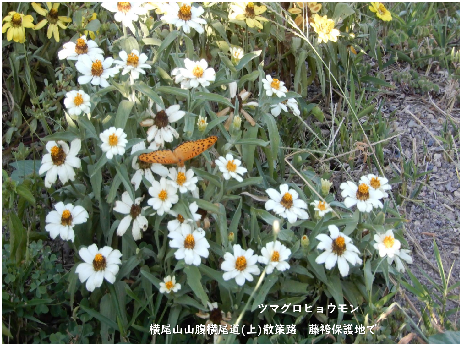
ツマグロヒヨウモン 横尾山山腹横尾道(上)散策路 藤袴保護地で