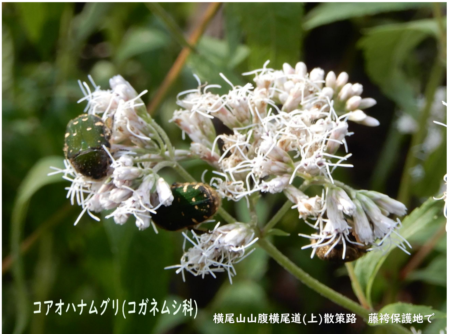
コアオハナムグリ(コガネムシ科)