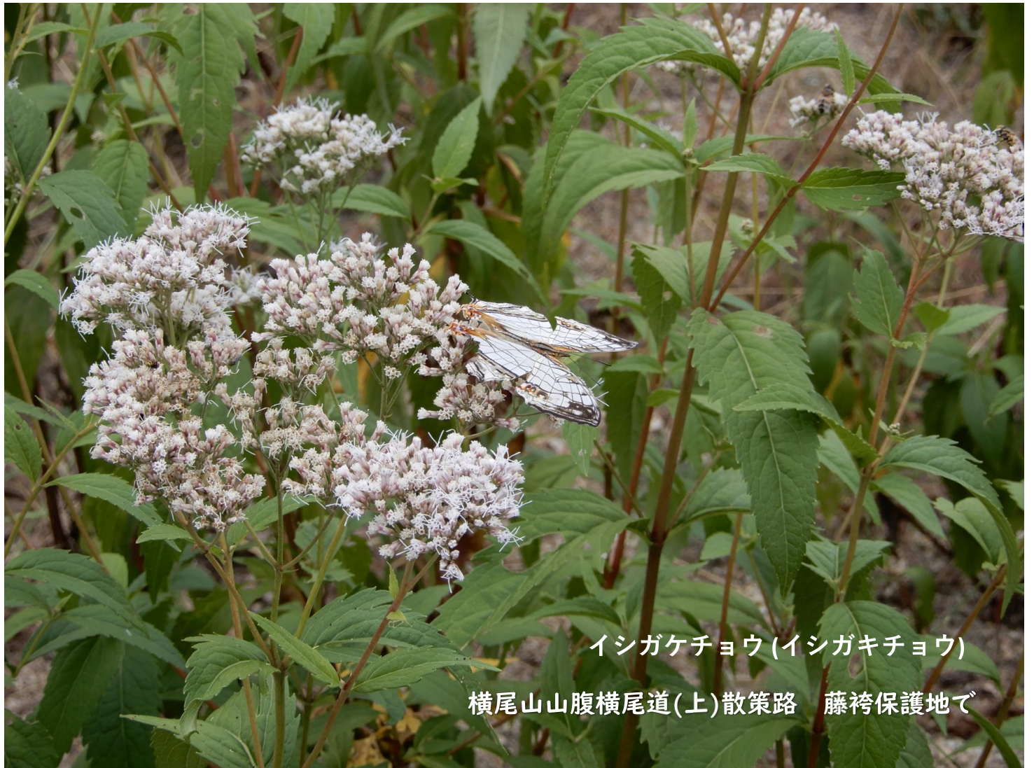
イシガケチョウ(イシガキチョウ)