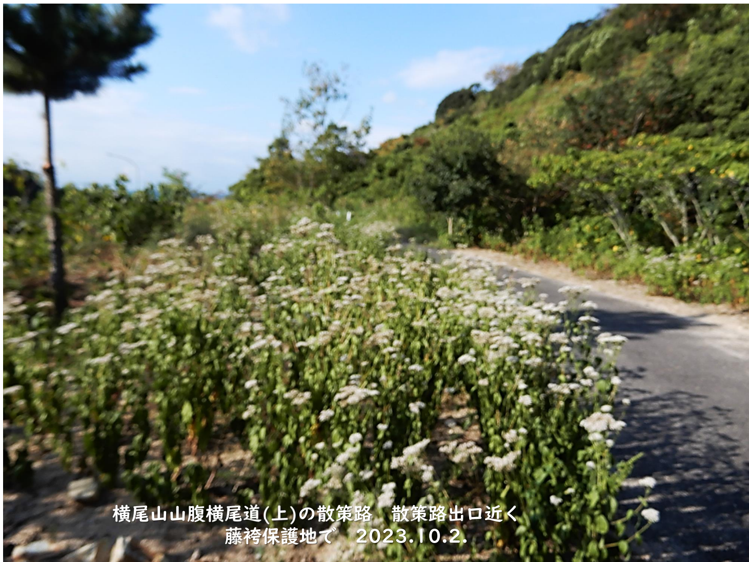
横尾山山腹横尾道(上)の散策路 散策路出口近く 藤袴保護地で 2023.10.2.