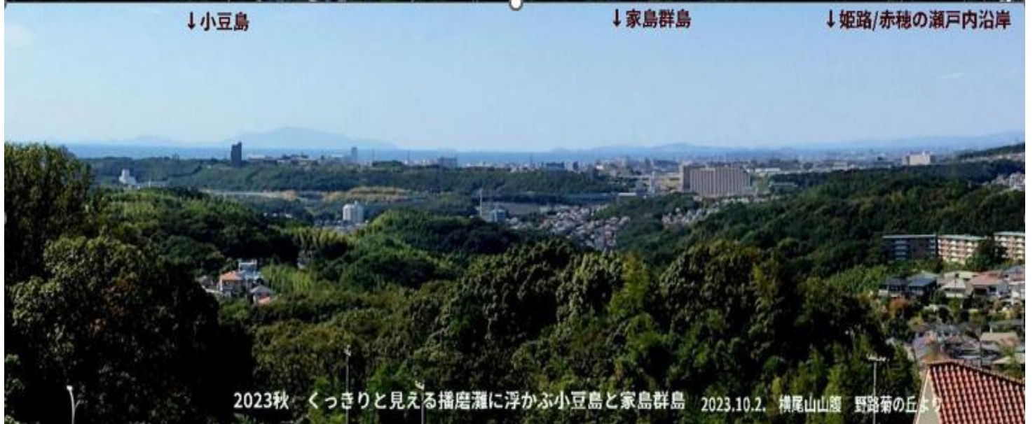
2023秋 くっきりと見える播磨灘に浮かぶ小豆島と家島群島 2023.10.2. 横尾山山腹 野路菊の丘より