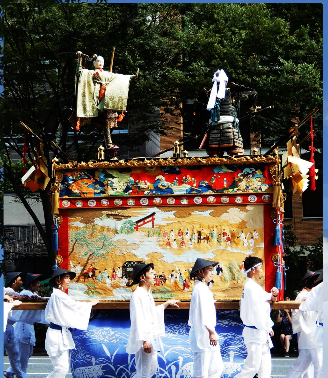
巡行の先頭を行く橋弁慶山 牛若（義経）と弁慶が五条大橋で戦う姿を表現 御池通 堺町御池周辺で 2023.7.24.