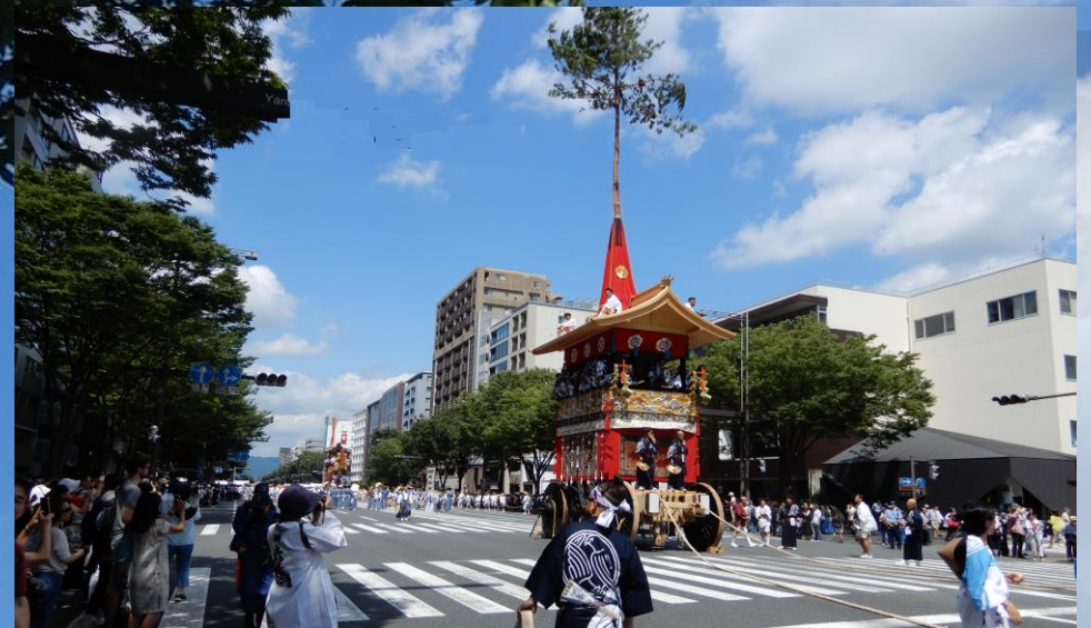
京都市役所前 河原町御池の辻回しの順番を待つ「鷹山」と「大船鉾」 2023.7.24.