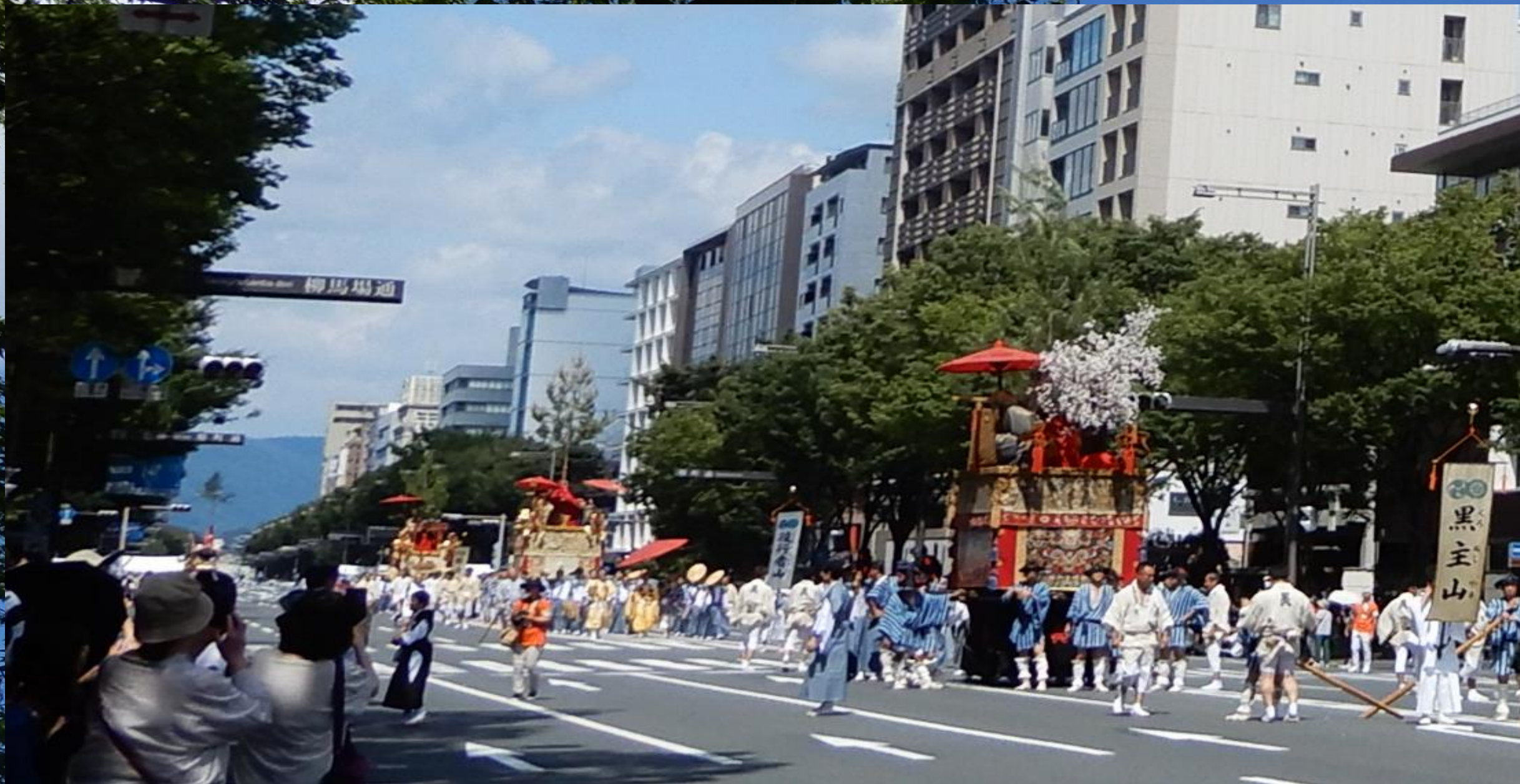
北観音山の後には前が動くのを待つ黒主山→役行者山→鈴鹿山→鷹山→大船鉾の巡行後半列 2023祇園後祭 柳馬場御池周辺で