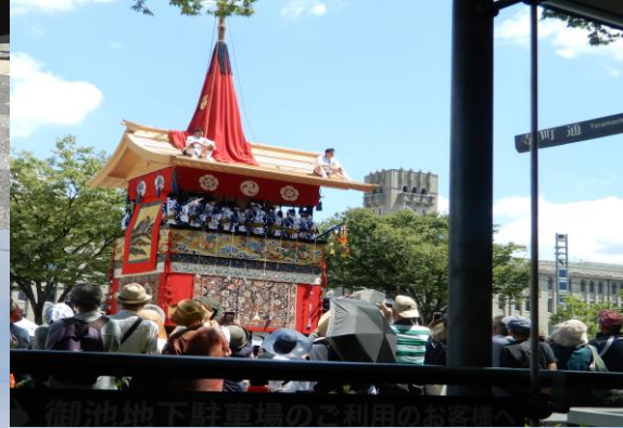
河原町御池 鷹山の辻回し 2023.7.24.