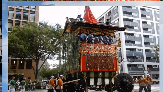
2023祇園後祭 巡行する「南観音山」 2023.7.24. 堺町御池周辺で