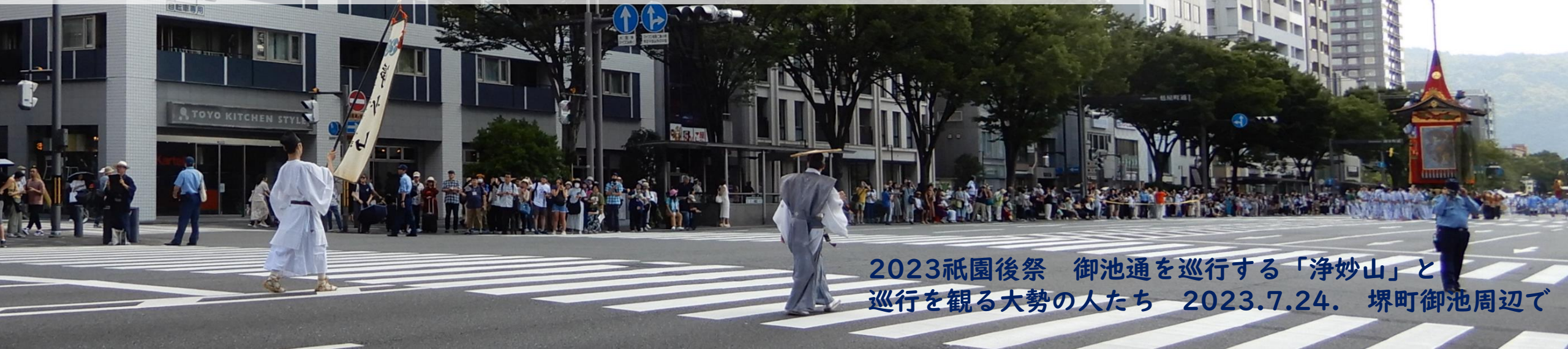
2023祇園後祭 御池通を巡行する「浄妙山」と巡行を観る大勢の人たち 2023.7.24. 堺町御池周辺で