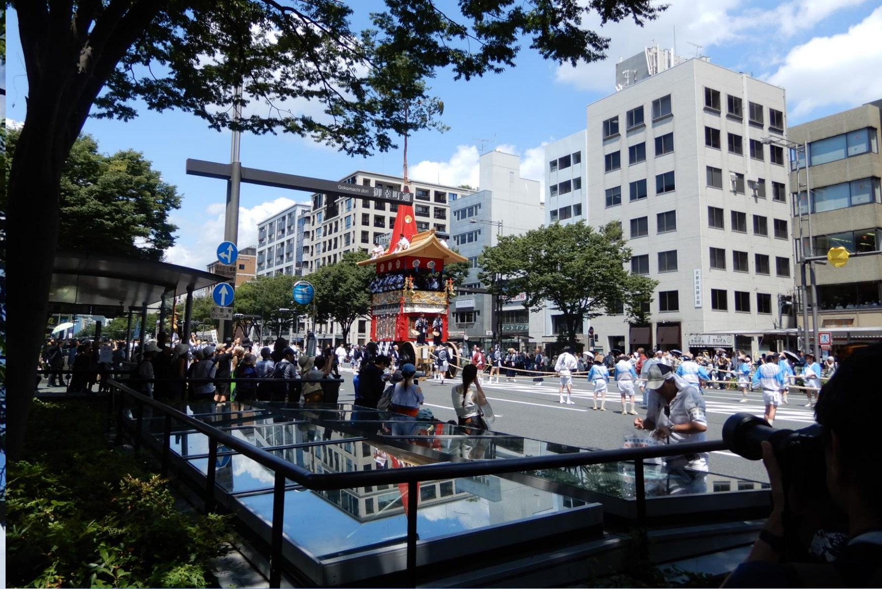
京都市役所前 四條御池 辻回しへ向かう「鷹山」 2023.7.24.