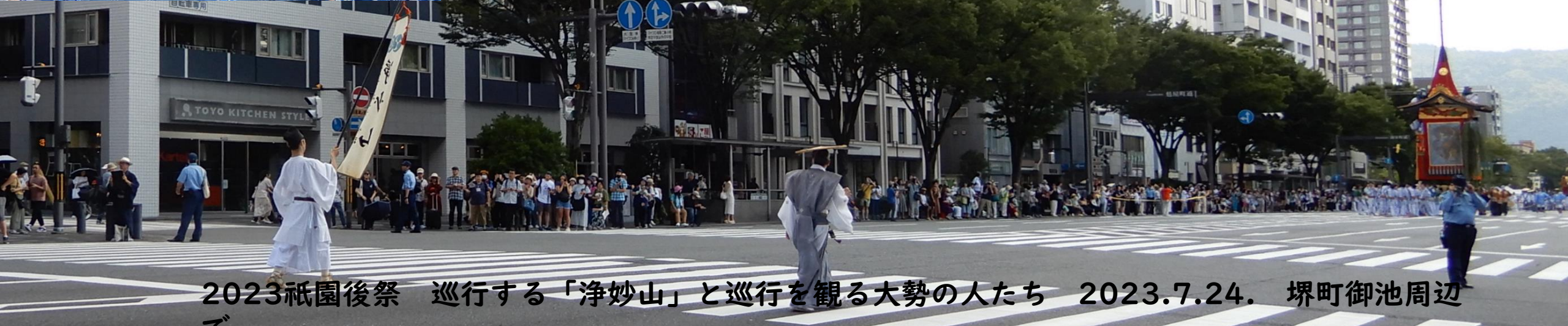
2023祇園後祭 巡行する「浄妙山」と巡行を観る大勢の人たち 2023.7.24. 堺町御池周辺