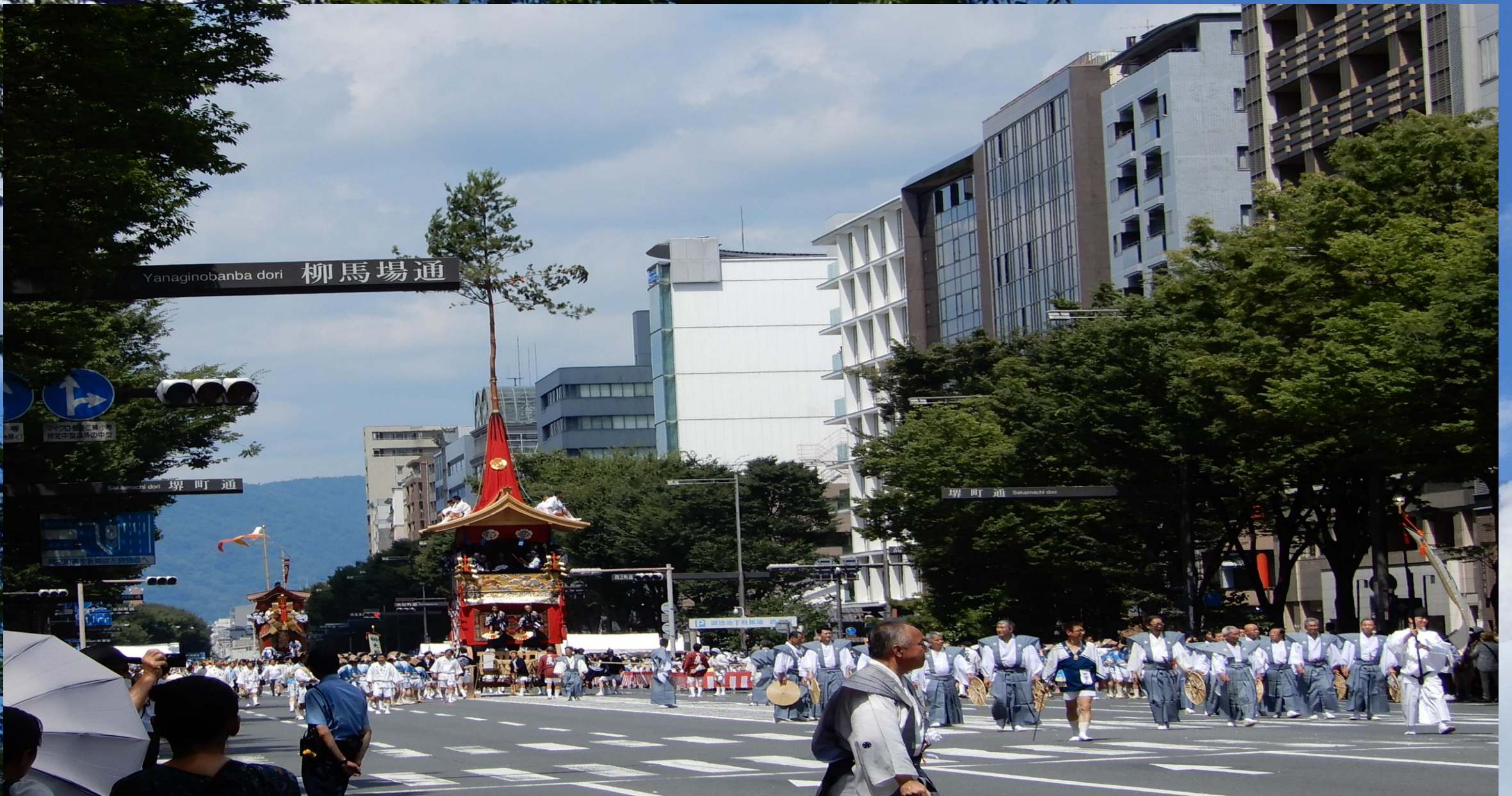
2023祇園後祭 御池通を西から東へ巡行する巡行列の後尾「北観音山」その後に最後尾の「大船鉾」が見えている いよいよ巡行列の掉尾を飾る「鷹山」「大船鉾」の登場だ 2023.7.24. 堺町御池周辺で