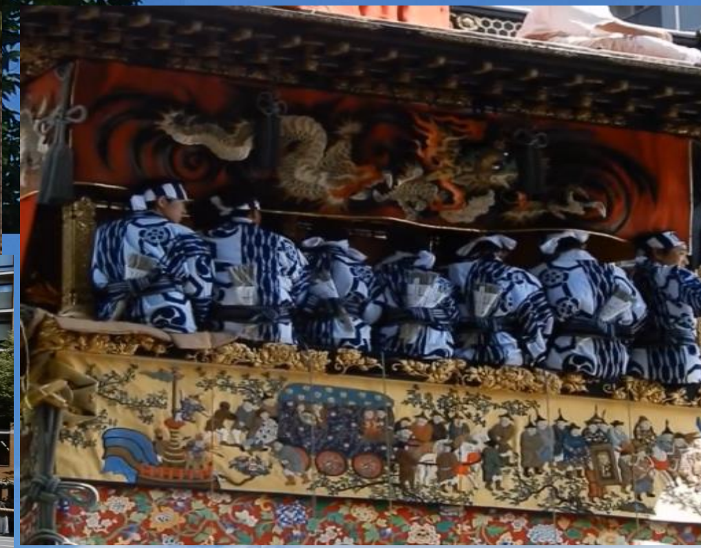
2023祇園後祭 御池通を巡行する北観音山 2023.7.24. 堺町御池周辺で