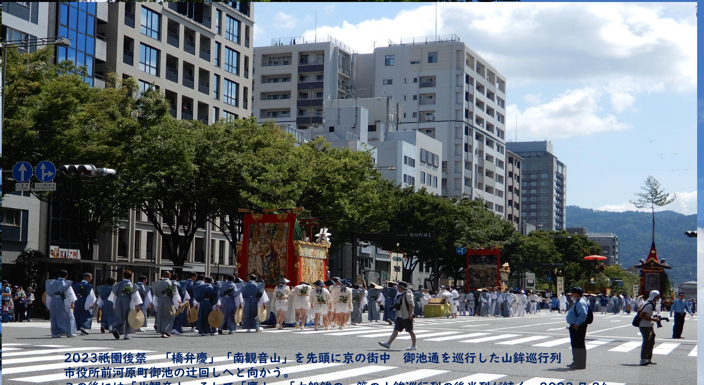
2023祇園後祭 「橋弁慶」「南観音山」を先頭に京の街中 御池通を巡行した山鉾巡行列 市役所前河原町御池の辻回しへと向かう。 この後には「北観音山」そして「鷹山」「大船鉾の」等の山鉾巡行列の後半列が続く 2023.7.24.