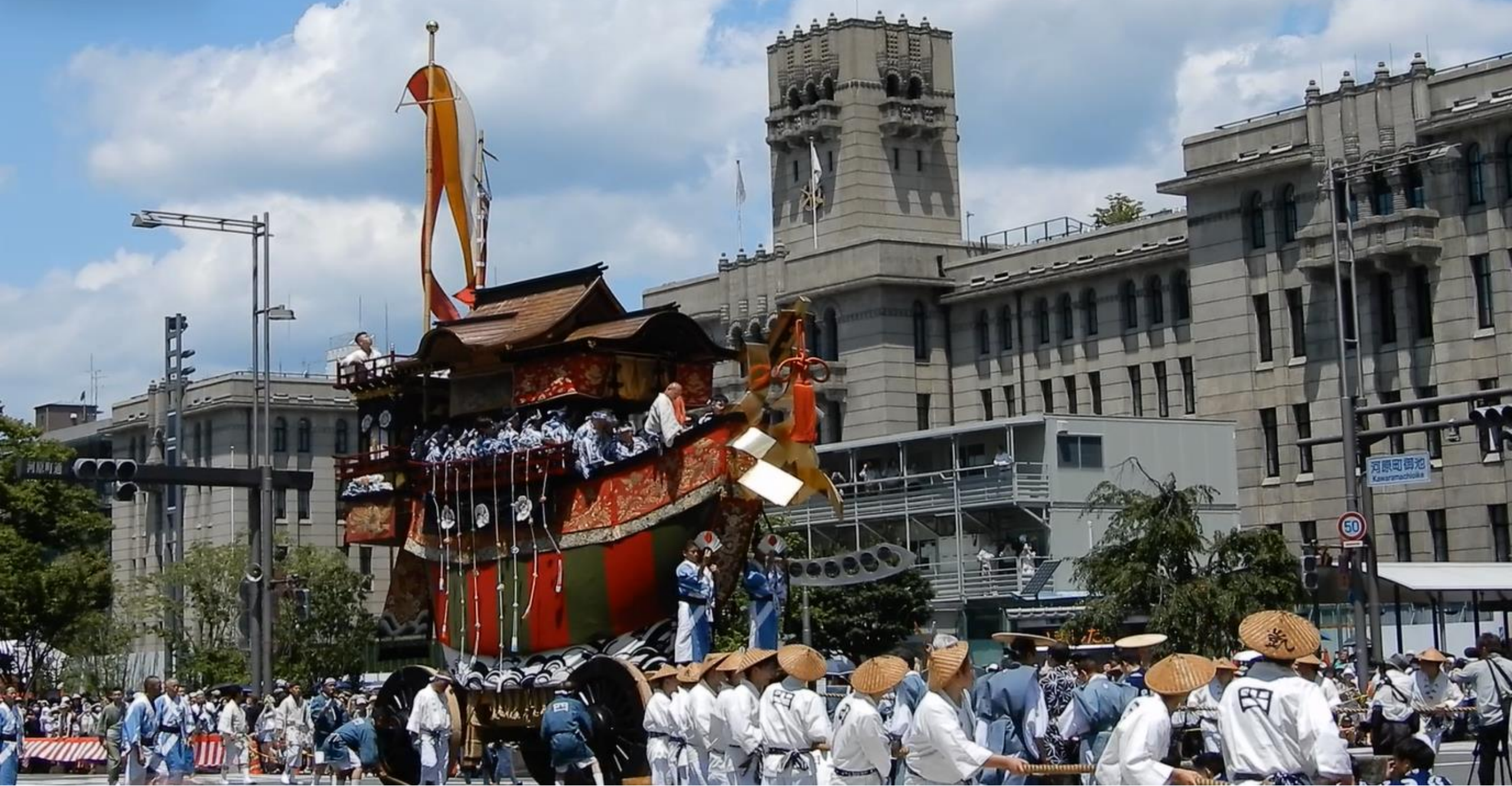
京都市役所前 「大船鉾」 辻回しの為 河原町御池の十字路へ 2023.7.24.