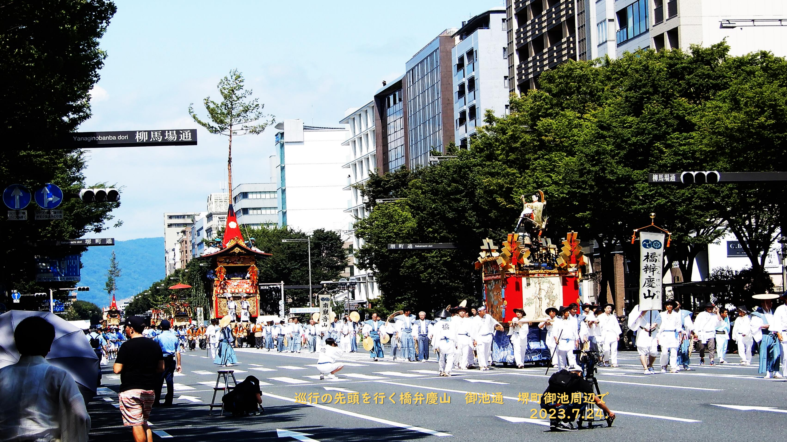
巡行の先頭を行く橋弁慶山 御池通 堺町御池周辺で 2023.7.24.