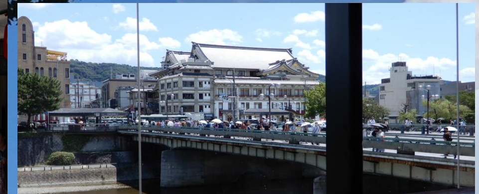
四条河原町では人波に囲まれて 「鷹山」の辻回し 2023.7.24. 見たかった「大船鉾」堂々とした京の街凱旋の姿 満足感一杯。コロナも悪疫もみんなみんな飛んで行け!!