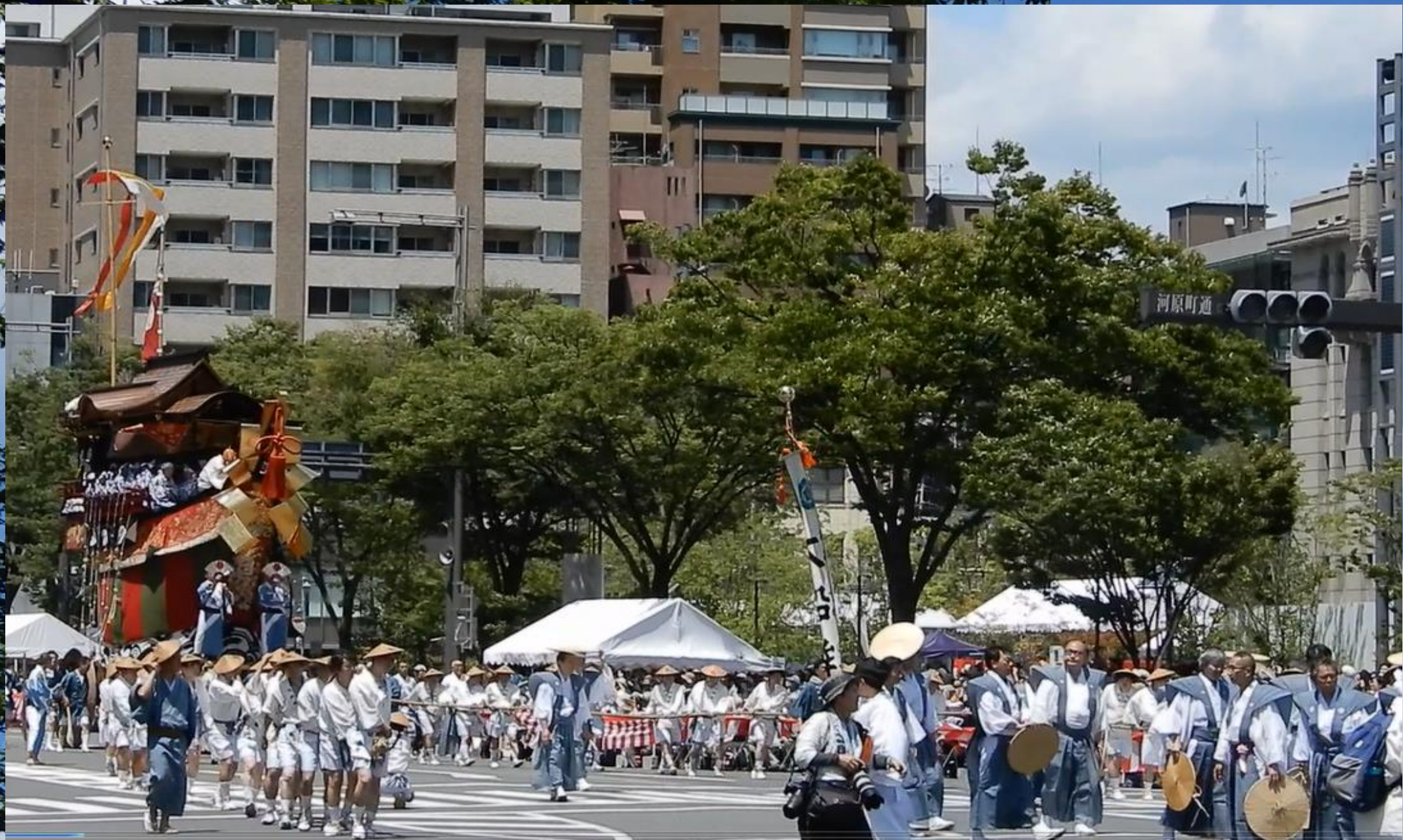
京都市役所前 河原町御池 迂回しへ向かう「大船鉾」 2023.7.24.