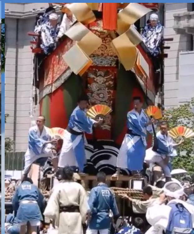
京都市役所前 「大船鉾」 河原町御池の辻回し 2023.7.24.