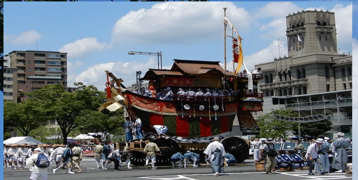
河原町御池の辻回しを無事終わり、巡行列は南の河原町の街中へ 2023.7.24. 真夏の太陽が照り付ける昼時 河原町の雑踏をさけ、高瀬川が流れる木屋町を抜けて四条へ