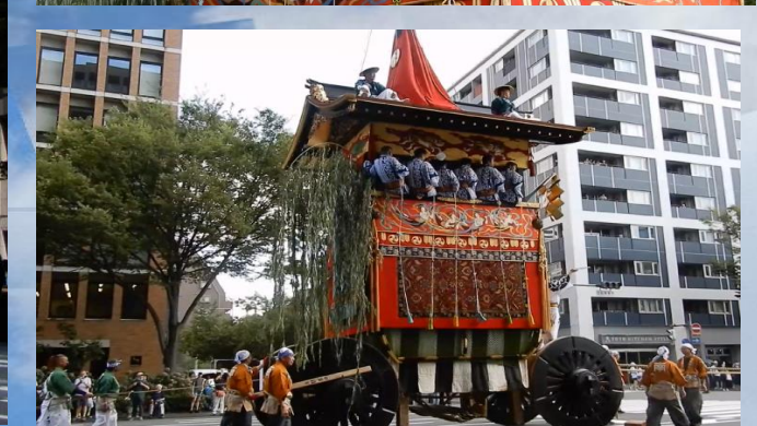
2023祇園後祭 巡行する南観音山 2023.7.24. 堺町御池周辺で