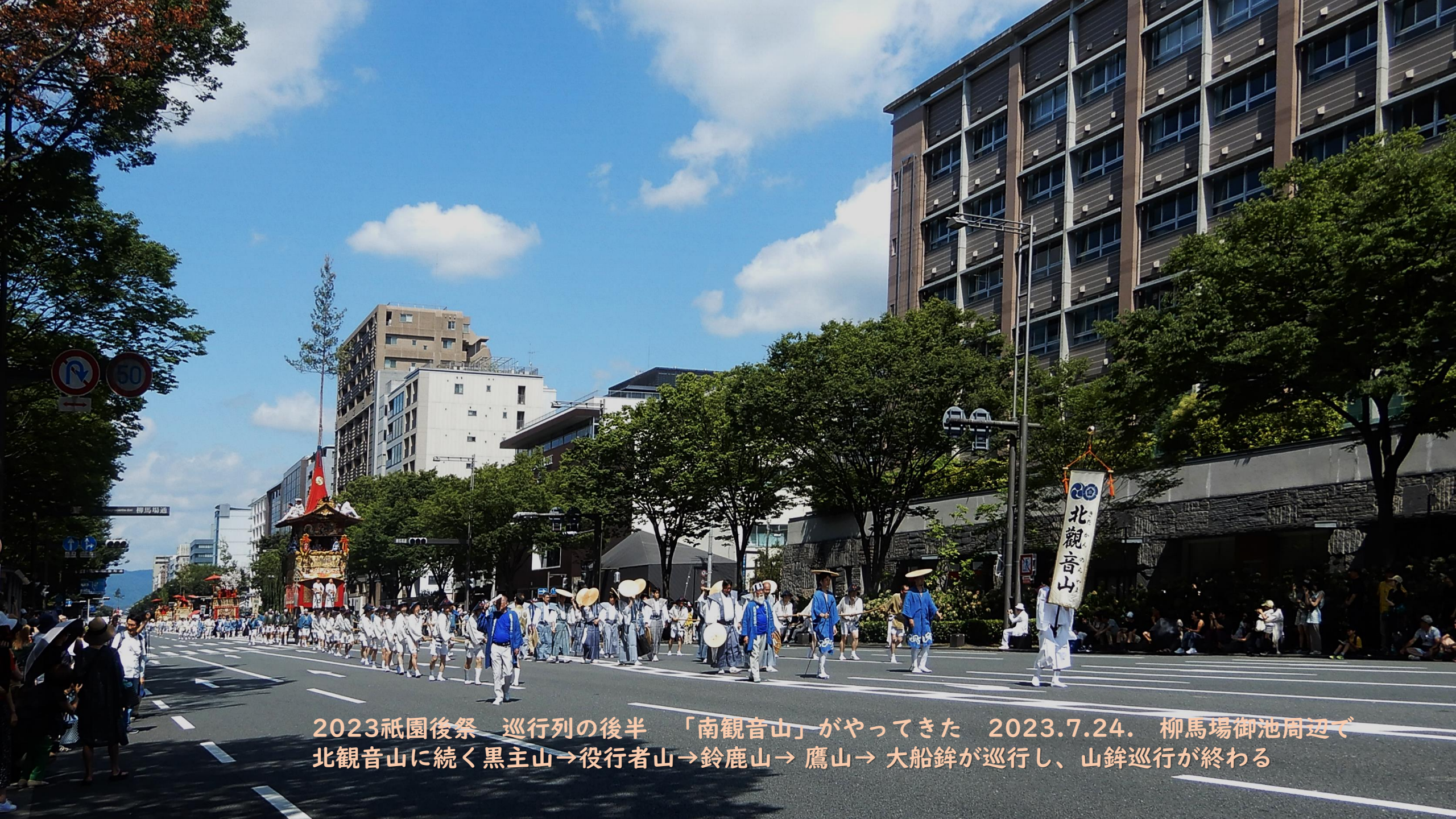
2023祇園後祭 巡行列の後半 「南観音山」がやってきた 2023.7.24. 柳馬場御池周辺で 北観音山に続く黒主山→役行者山→鈴鹿山→鷹山→大船鉾が巡行し、山鉾巡行が終わる