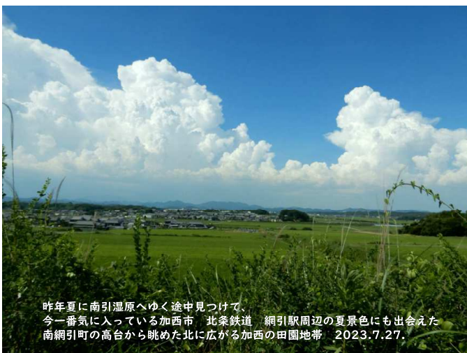
昨年夏に南引温泉へゆく途中見つけて、 今一番気に入っている加西市 北条鉄道 南網駅周辺の夏景色にも出会えた 南網引町の高台から眺めた北に広がる加西の田園地帯 2023.7.27.