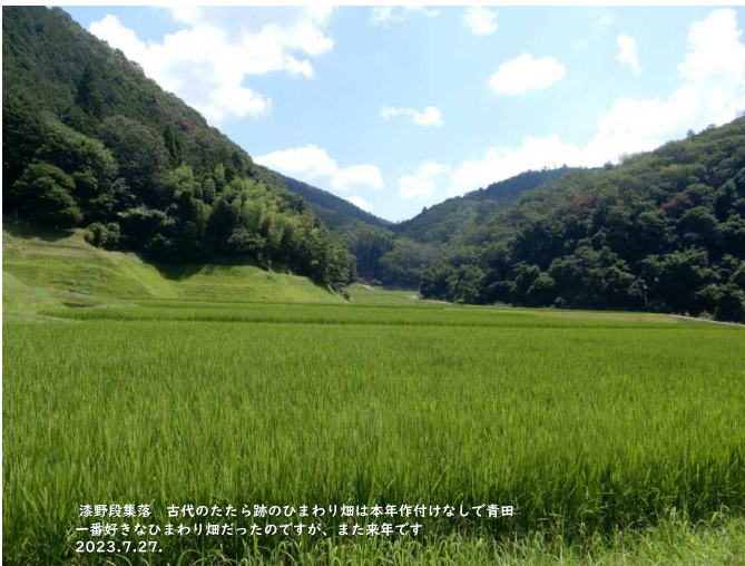
漆野段集落 古代のたたら跡のひまわり畑は本年作付けなして青田 一番好きなひまわり畑だったので、また来年です 2023.7.27.