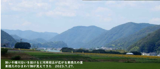
狭い千種川沿いを抜ける河岸段丘が広がる東徳久の里 東徳久のひまわり畑が見えてきた 2023.7.27.