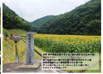
<昨年2022年夏の漆野段集落 たたら跡のひまわり畑> 今年は残念ながら青田が広がっていました