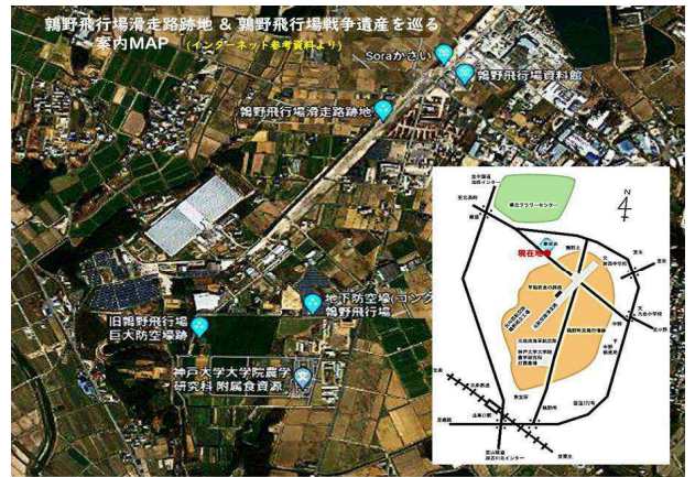
【参考】和鉄の道2022 加西市鶯野飛行場跡地と戦争遺産の諸施設の紹介 by Mutsu https://infokkna2.com/ironroad2/2022htm/walk19/R0410EHarimaphotoC.pdf 非常にシンプルに説明書・道標等の類がないので、戦争の悲惨さがない舞台 自分なりにイメージ冷静に受け止められるのがお勧めです。