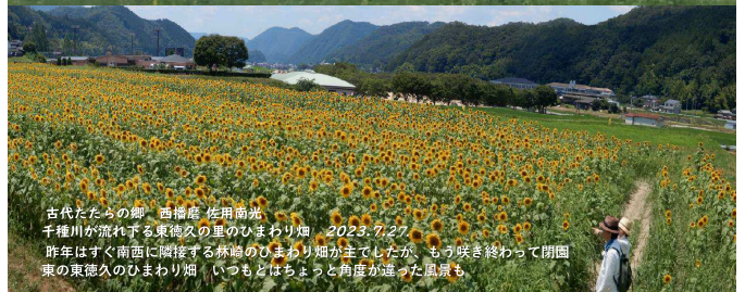
古代たたら郷 西播磨 佐用南光 千種川が流れる東徳久の里のひまわり畑 2023.7.27 昨年はずく南西に隣接する林間のひまわり畑が主でしたが、もう咲き終わって閉園 東の東徳久のひまわり畑 いつもとはちょっと角度が違った風景も