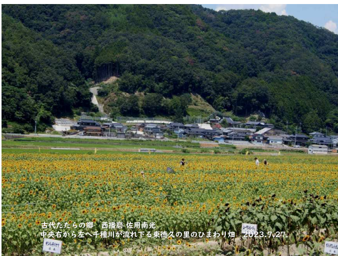
古代たたら郷 西播磨 佐用南光 中央右から左へ千種川が流れ下る東徳久の里のひまわり畑 2023.7.27.