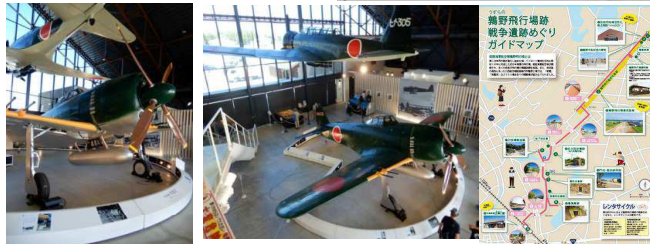
【参考】和鉄の道2022 よく整備保存されている加西市鶯野飛行場跡地と戦争遺産の諸施設 by Mutsu Nakanishi https://infokkna2.com/ironroad2/2022htm/walk19/R0410EHarimaphotoC.pdf