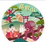
高取山 (六甲) 2023.06.27 17:35:13