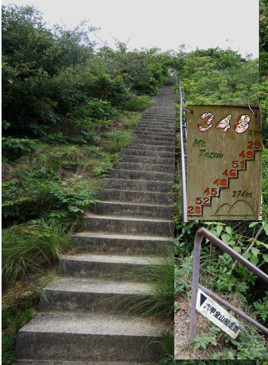
横尾道から眺める梅尾山の直登大階段 2023.7.3. 西六甲の縦走路 何時も階段に姿が見える 今日も