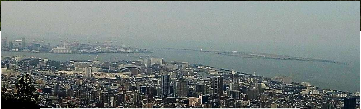
樽尾山山頂展望台より眺める南東側 神戸の街 2023.7.3.