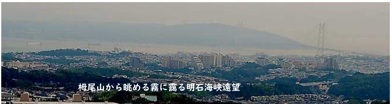
樽尾山から眺める霧に靄る明石海峡遠望