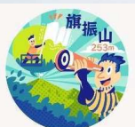
旗振山 2023.06.23 15:47:32