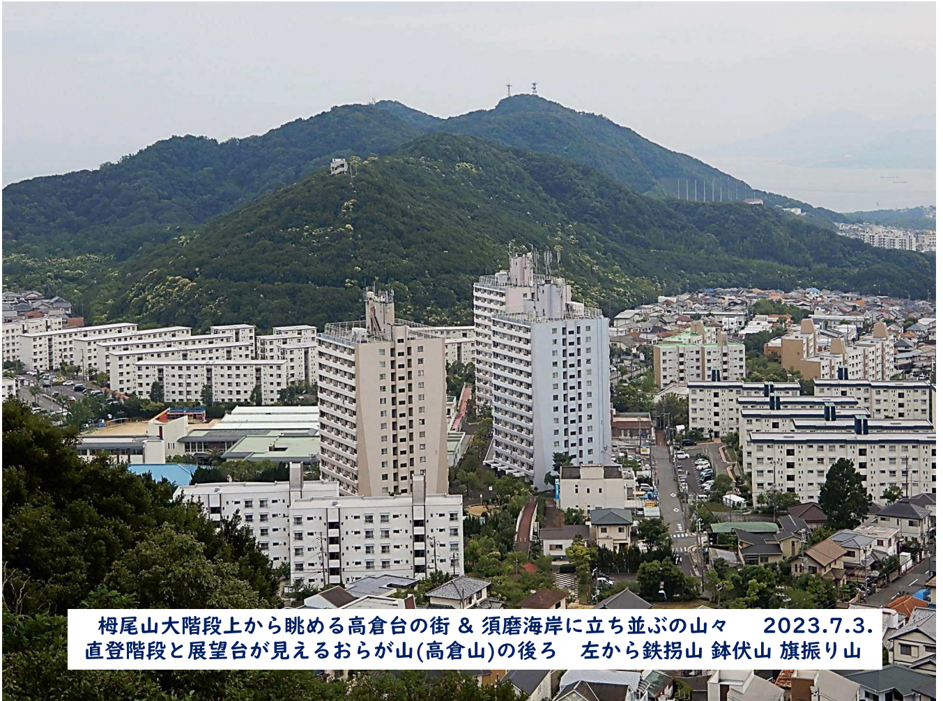
榎尾山大階段上から眺める高倉台の街 & 須磨海岸に立ち並ぶの山々 2023.7.3. 直登階段と展望台が見えるおらが山(高倉山)の後ろ 左から鉄拐山 鉢伏山 旗振り山