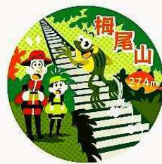
梅尾山 2023.07.03 16:21:45

7月の初め、梅尾山山腹下の横尾道から眺める山並 2023.7.1. 左手前から おらが山(高倉山)・鉄拐山・鉢伏山・旗振山