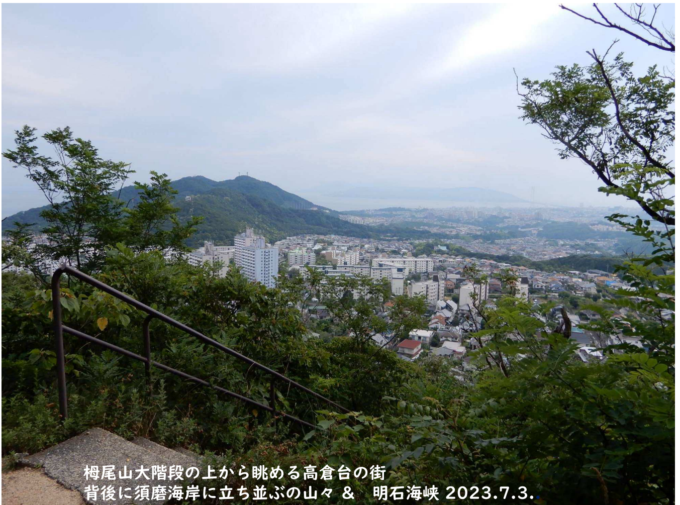
梅尾山大階段の上から眺める高倉台の街 背後に須磨海岸に立ち並ぶの山々 & 明石海峡 2023.7.3.