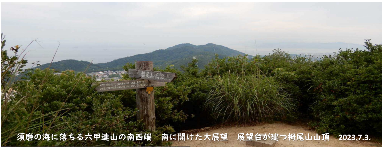
須磨の海に落ちる六甲連山の南西端 南に開けた大展望 展望台が建つ榎尾山山頂 2023.7.3.