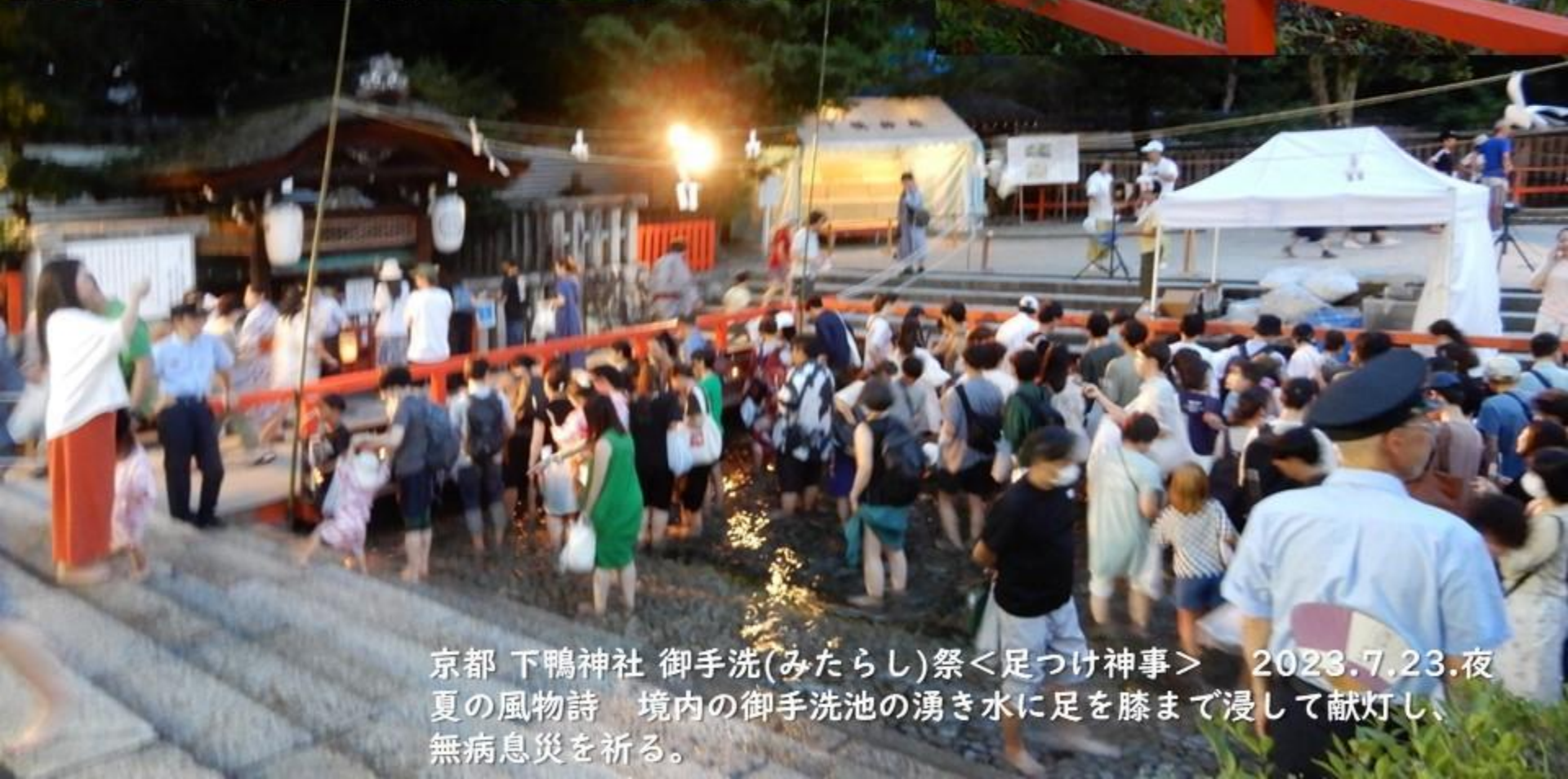
京都 下鴨神社 御手洗(みたらし)祭<足つけ神事> 2023.7.23.夜 夏の風物詩 境内の御手洗池の湧き水に足を膝まで浸して献灯し、 無病息災を祈る。