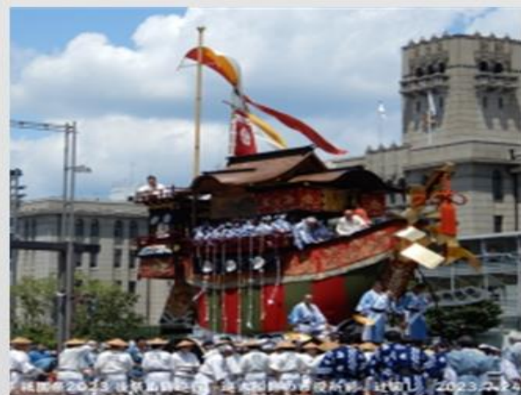
2023 後祭山鉾巡行 観大御所の森役所前 辻廻し 2023.7.24