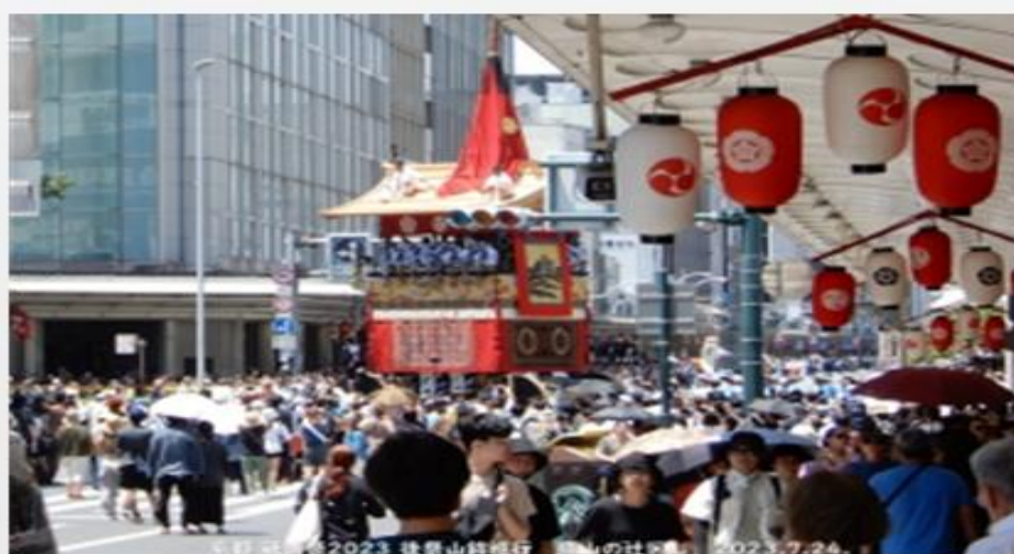
2023 後祭山鉾巡行 観大御所の森役所前 辻廻し 2023.7.24.