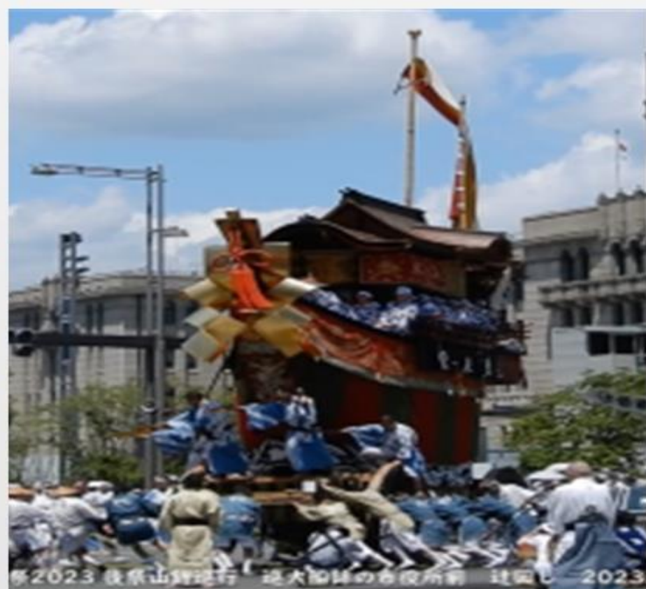
2023 後祭山鉾巡行 観大御所の森役所前 辻廻し 2023