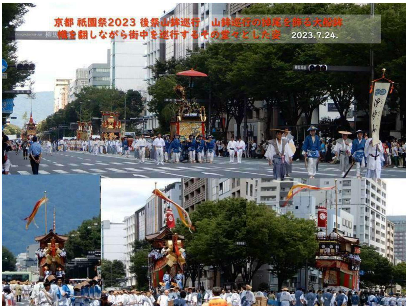
京都 祇園祭2023 後祭山鉾巡行 山鉾巡行の掉尾を飾る大船鉾 櫓を翻しながら街中を巡行するその堂々とした姿 2023.7.24.