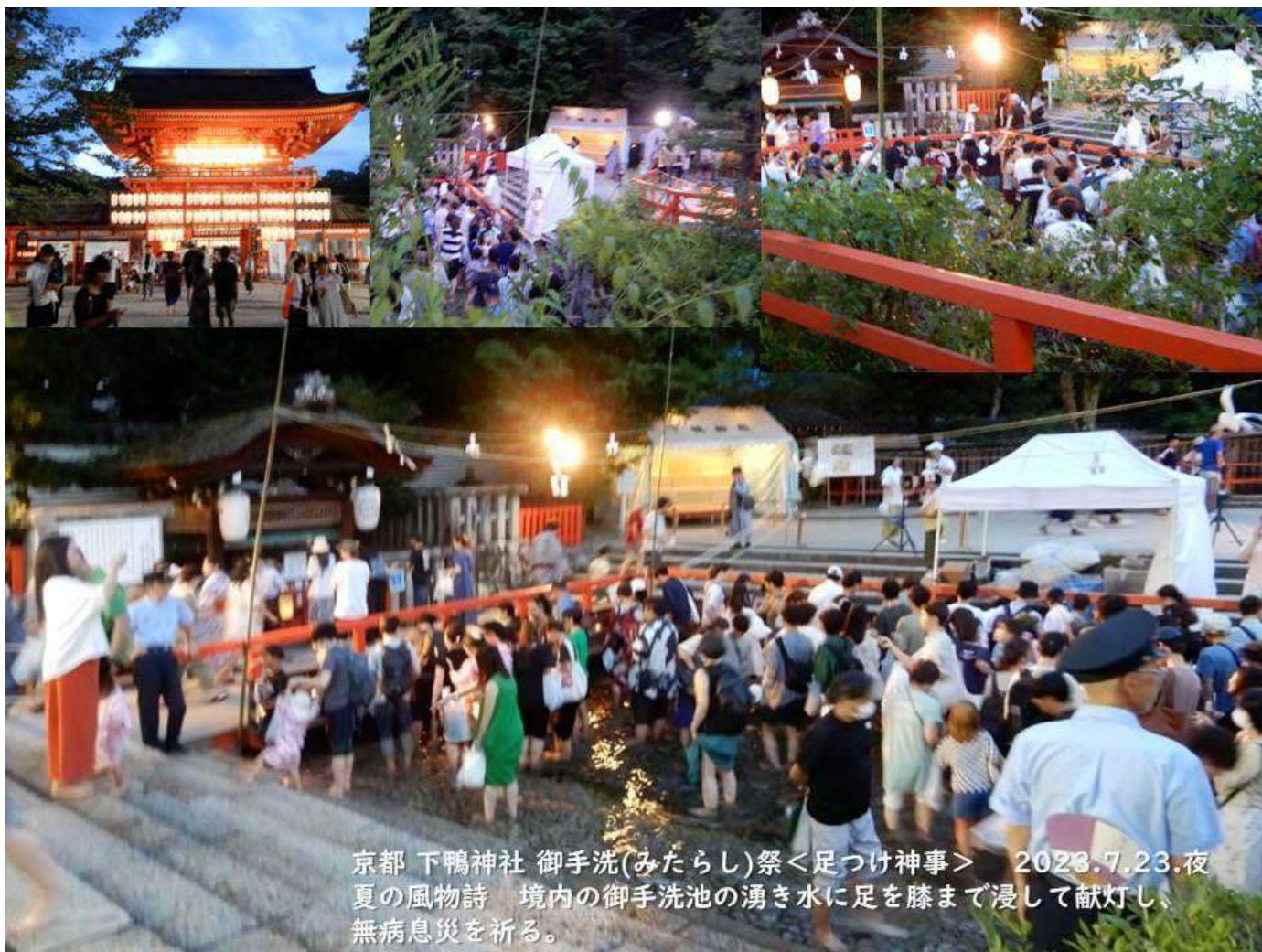
京都 下鴨神社 御手洗(みたらし)祭<足つけ神事> 2023.7.23.夜 夏の風物詩 境内の御手洗池の湧き水に足を膝まで浸して献灯し、 無病息災を祈る。