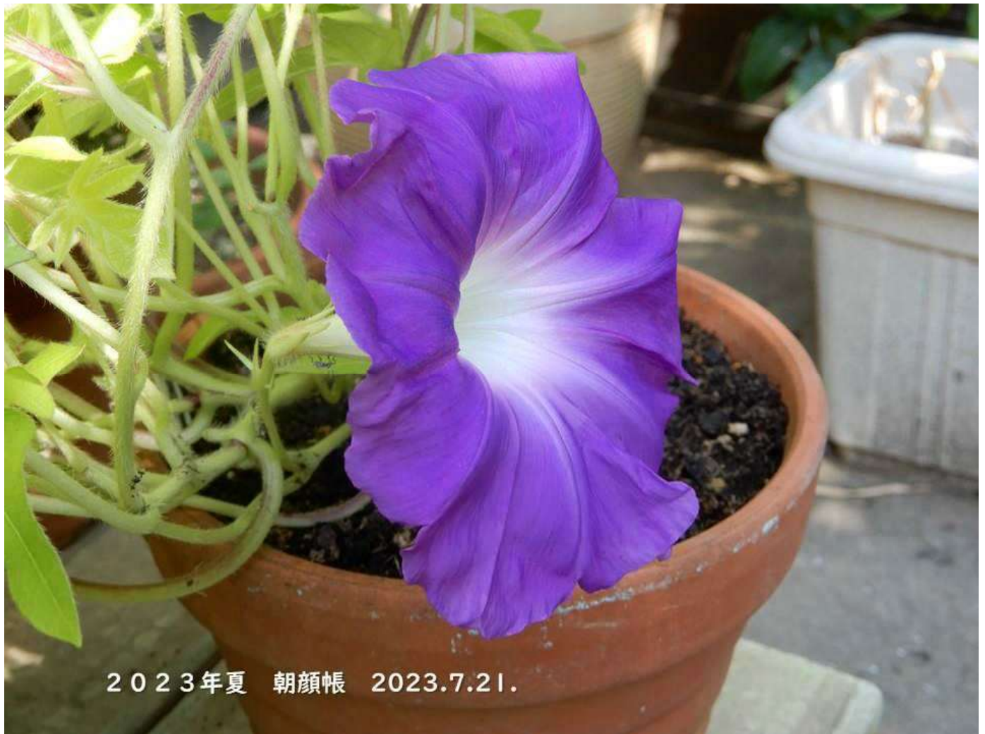
2023年夏 朝顔帳 2023.7.21.