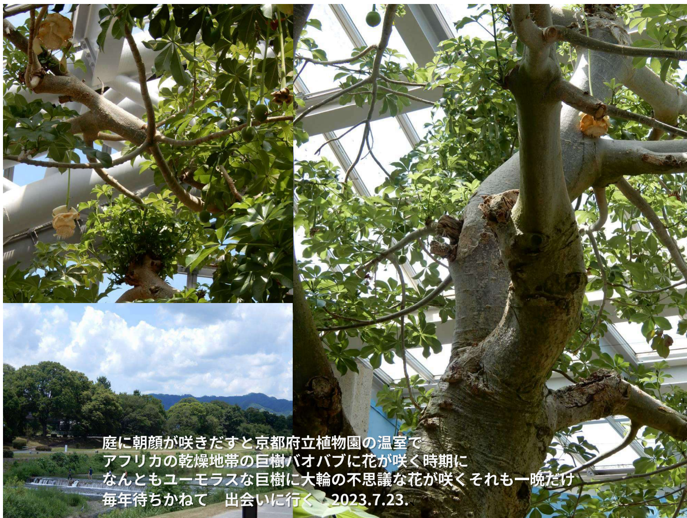
庭に朝顔が咲きだすと京都府立植物園の温室で アフリカの乾燥地帯の巨樹バオバブに花が咲く時期に なんともユーモラスな巨樹に大輪の不思議な花が咲くそれも一晩だけ 毎年待ちかねて 会いに行く 2023.7.23.