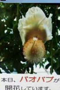
本日、バオバブが 開花しています。