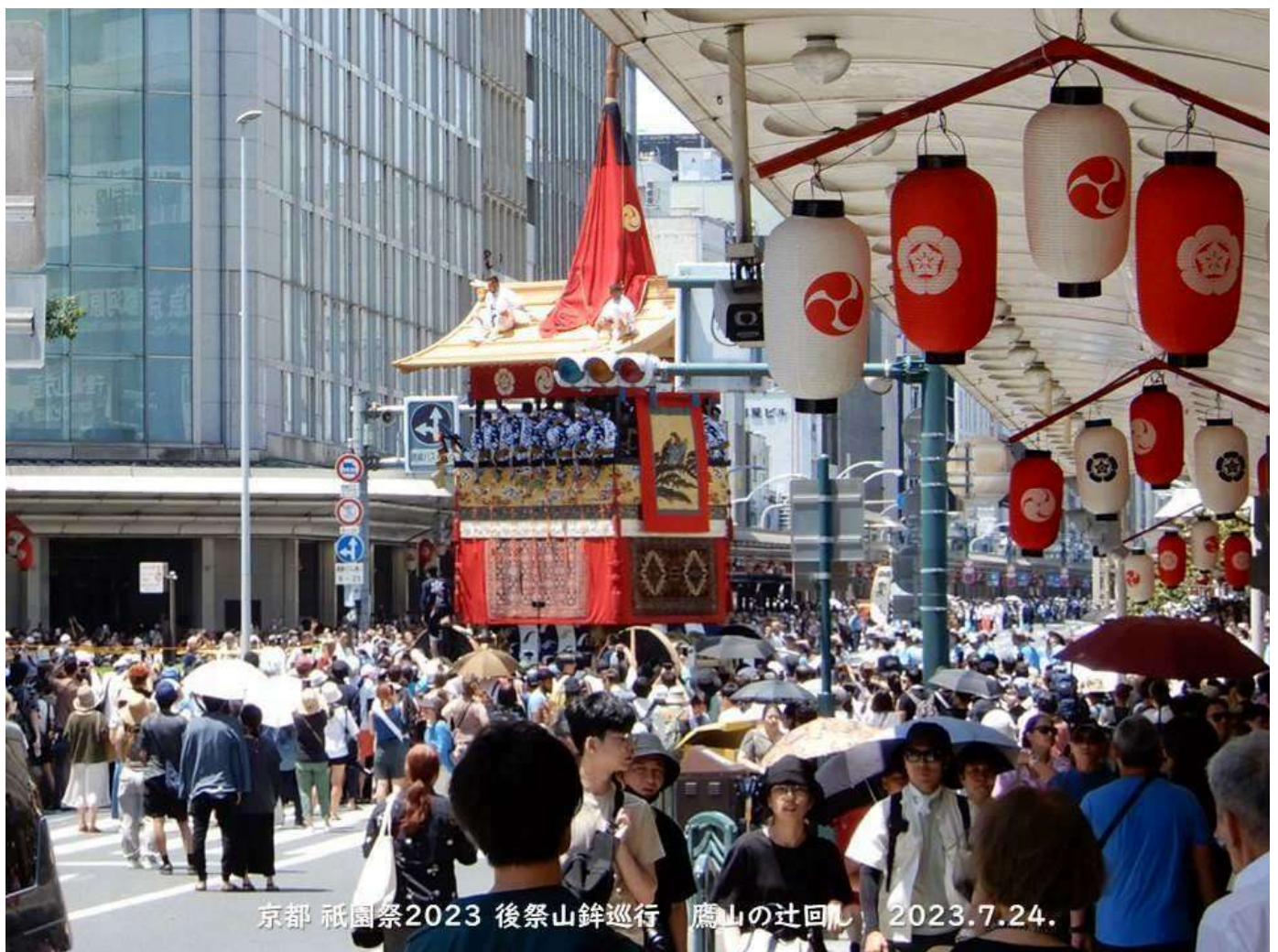
京都 祇園祭2023 後祭山鉾巡行 鷹山の辻回し 2023.7.24.