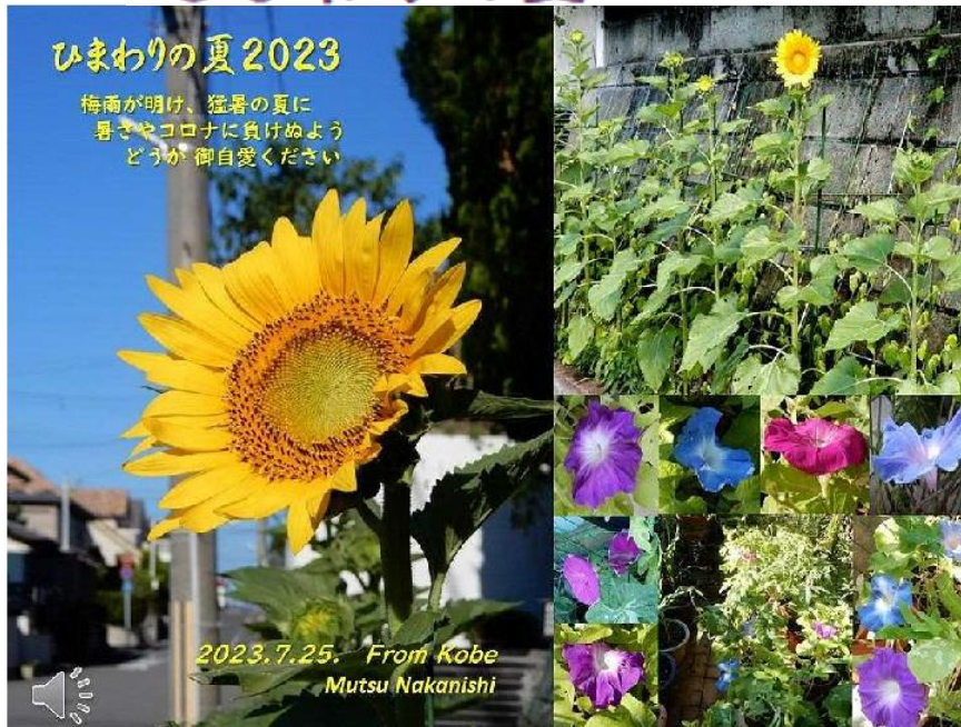
R0508Himawari00.htm 2023.8.1. by Mutsu Nakanishi 【スライド動画】ひまわりの夏2023 動画再生中 1min55s 厳しい夏の始まり 元気を貰ったひまわりの夏