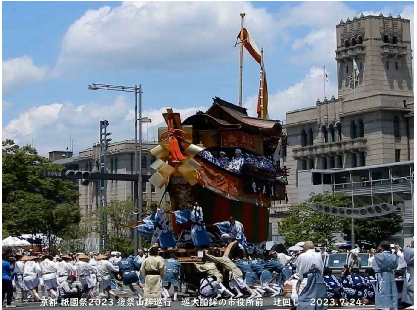
京都 祇園祭2023 後祭山鉾巡行 巡大船鉾の市役所前 辻回し 2023.7.24.