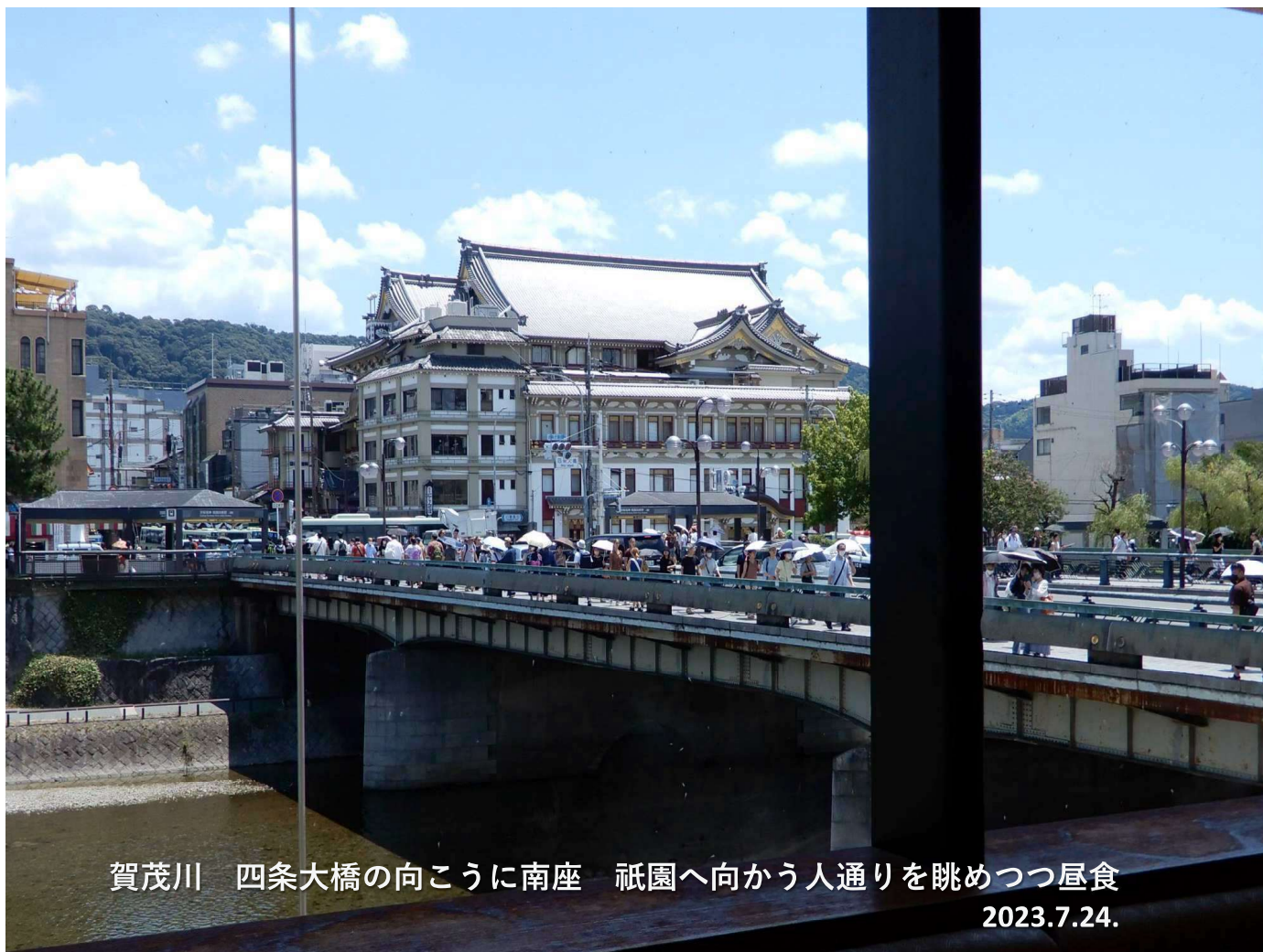
賀茂川 四条大橋の向こうに南座 祇園へ向かう人通りを眺めつつ昼食 2023.7.24.