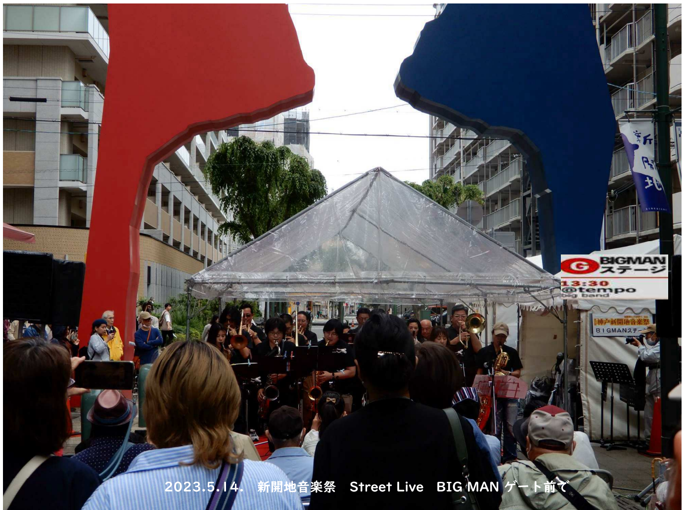
2023.5.14. 新開地音楽祭 Street Live BIG MAN ゲート前で