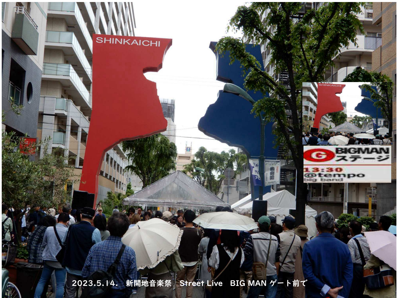
2023.5.14. 新開地音楽祭 Street Live BIG MAN ゲート前で