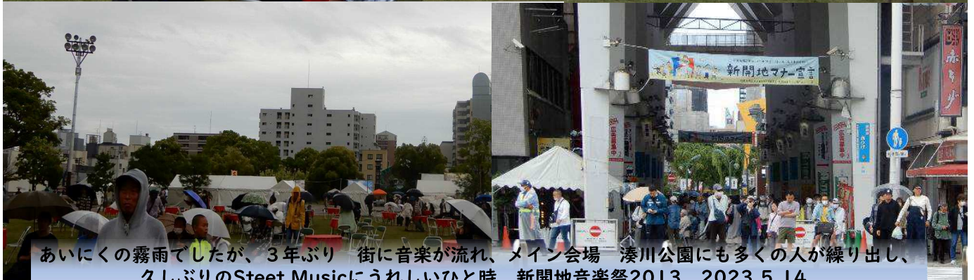
あいにくの霧雨でしたが、3年ぶり 街に音楽が流れ、メイン会場 湊川公園にも多くの人々が繰り出し、久しぶりのStreet Musicにうれしいひと時 新聞地音楽祭2013 2023.5.14.