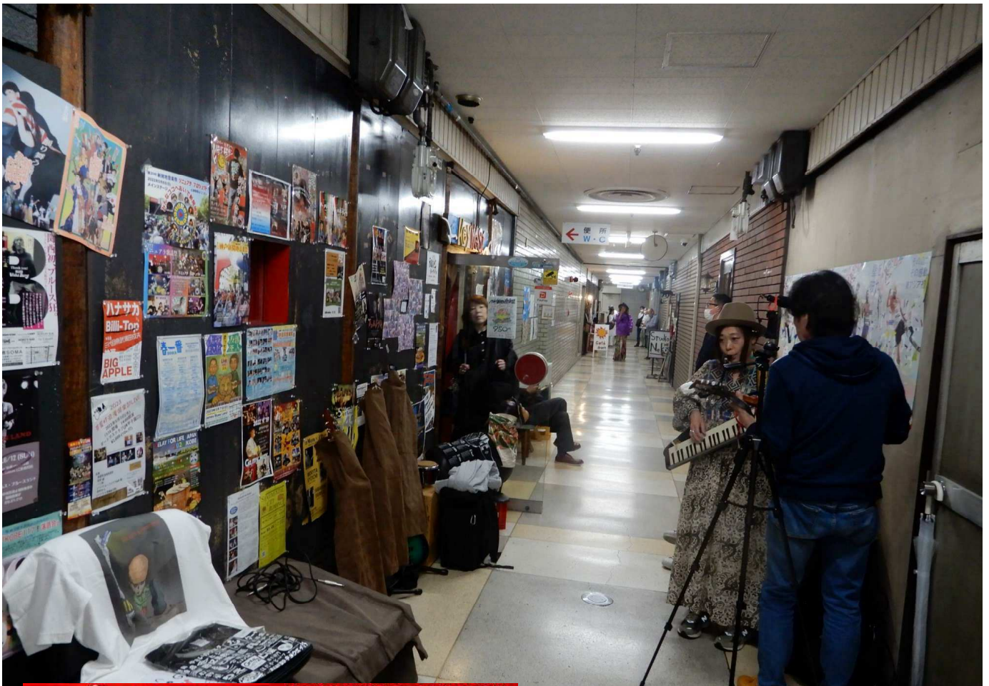
① ミナエンタウンステージ 「トンネル」南側ミナエンタウン地下1階 ライブハウス街