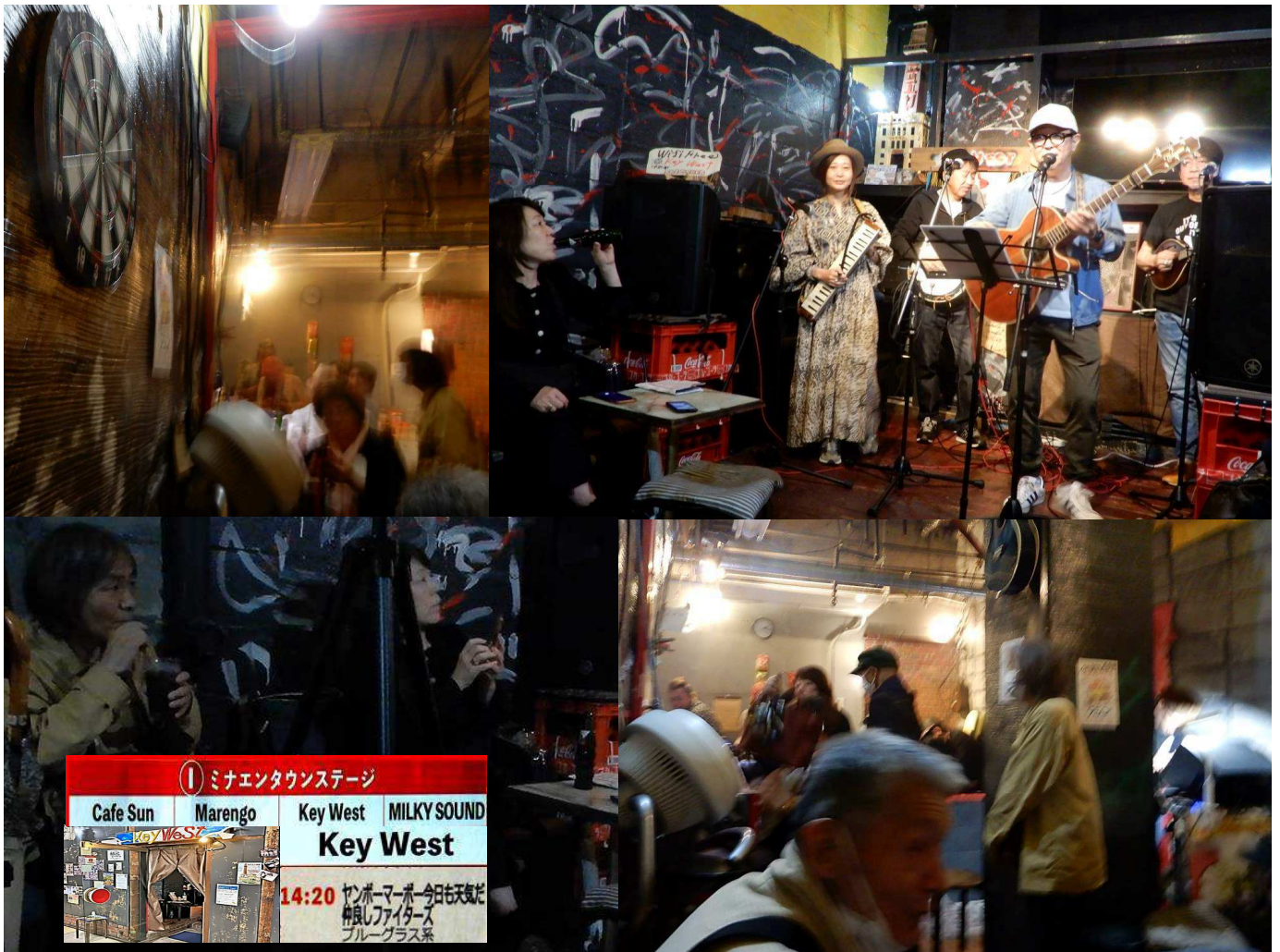
① ミナエタウンステージ Cafe Sun Marengo Key West MILKY SOUND Key West 14:20 ヤンポーマーポー 今日も天気だ 仲良しファイターズ ブルーグラス系