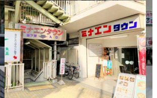
① ミナエンタウンステージ 「トンネル」南側ミナエンタウン地下1階 ライブハウス街