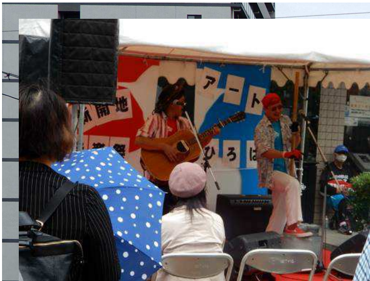
2023.5.14. 新開地音楽祭 Street Live スクエアステージで