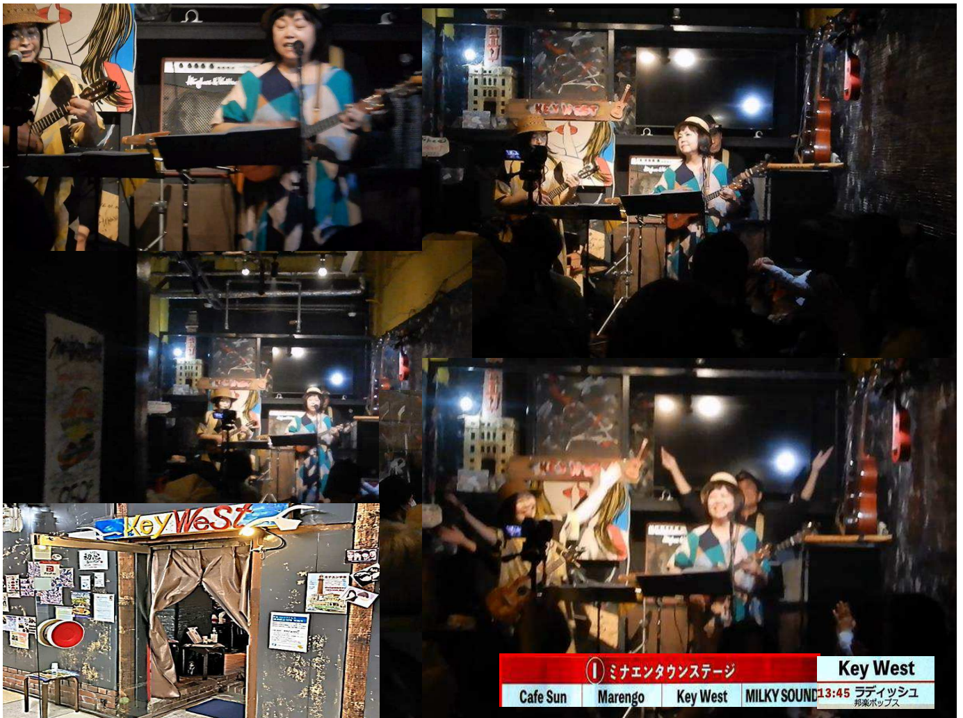
① ミナエタウンステージ Key West Cafe Sun Marengo Key West MILKY SOUND 13:45 ラディッシュ 邦楽ポップス