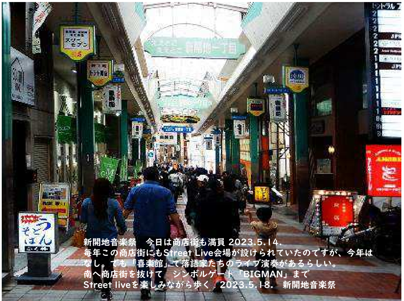
新開地音楽祭 今日商店街も満員 2023.5.14. 毎年この商店街にもStreet Live会場が設けられていたのですが、今年はない。でも「喜楽館」で落語家たちのライブ演奏があるらしい。 南へ商店街を抜けて シンボルゲート「BIGMAN」まで Street liveを楽しみながら歩く 2023.5.18. 新開地音楽祭

湊川公園から南へ商店街を抜け、大開通りを南に渡って 一番南のチャップリンの姿を模したという【シンボルゲート「BIGMAN」】 前会場までstreet Live会場を巡るいつものコース。 最後は 久しぶりにトンネル「ミナエンタウン」会場へ戻って ライブハウスで演奏されるブルーグラスを聞いて帰ることに