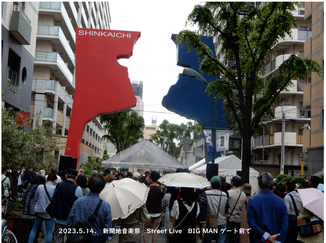
2023.5.14. 新開地音楽祭 Street Live BIG MAN ゲート前で