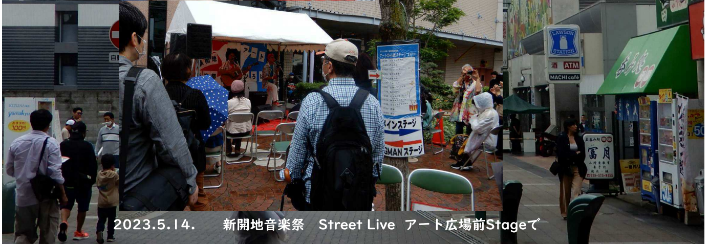
2023.5.14. 新開地音楽祭 Street Live アート広場前Stageで